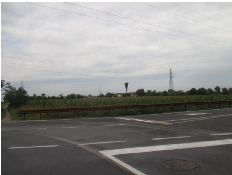
da via Peschiera