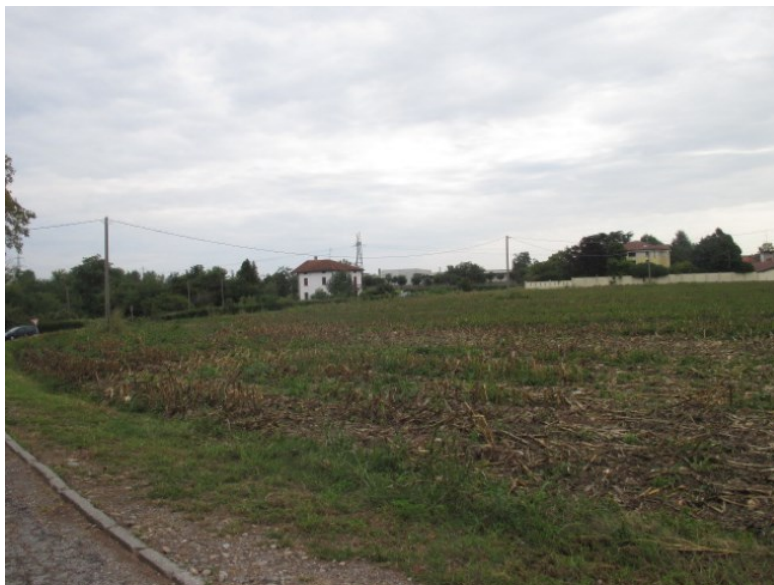
Vista da via Milano