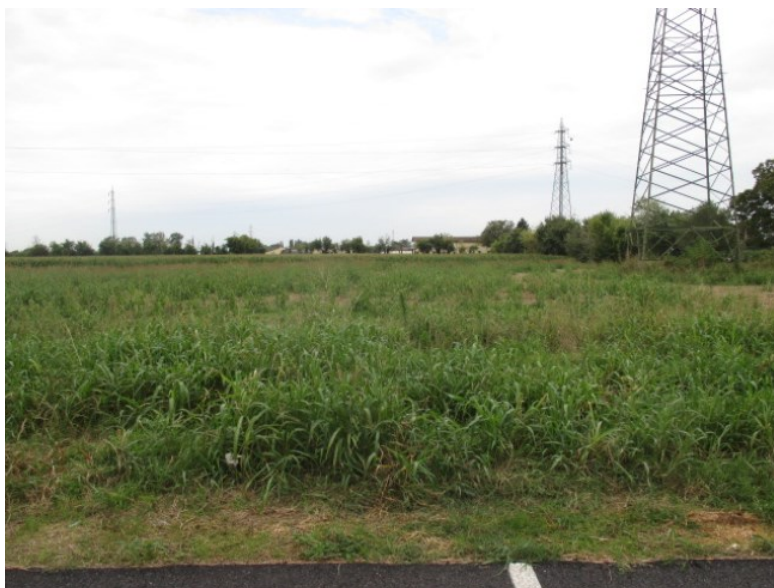
Fronte su via Bezzecca