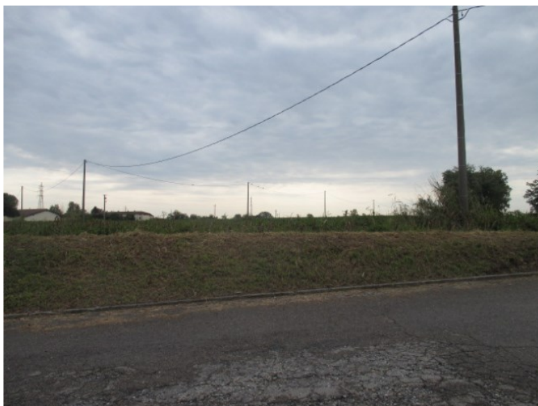
Vista da via Milano