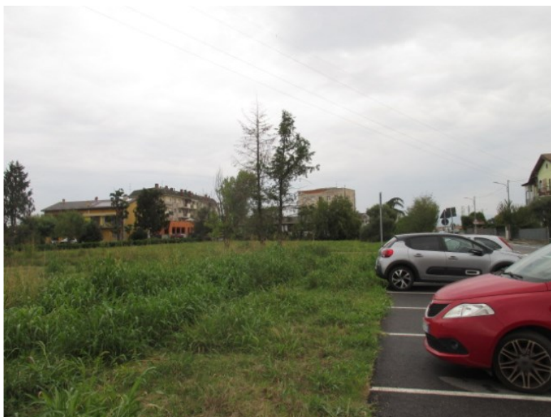
vista da sud verso Nord