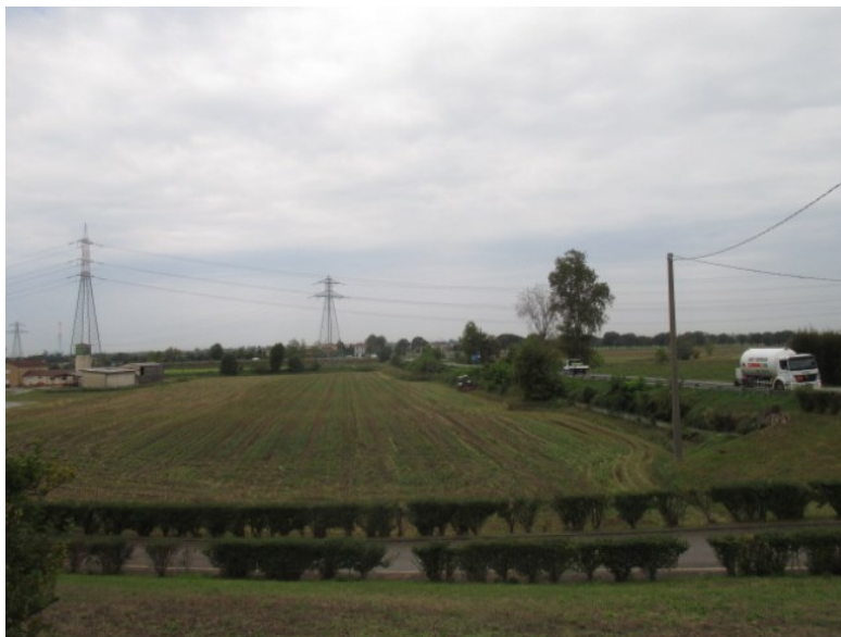
vista da via Milano