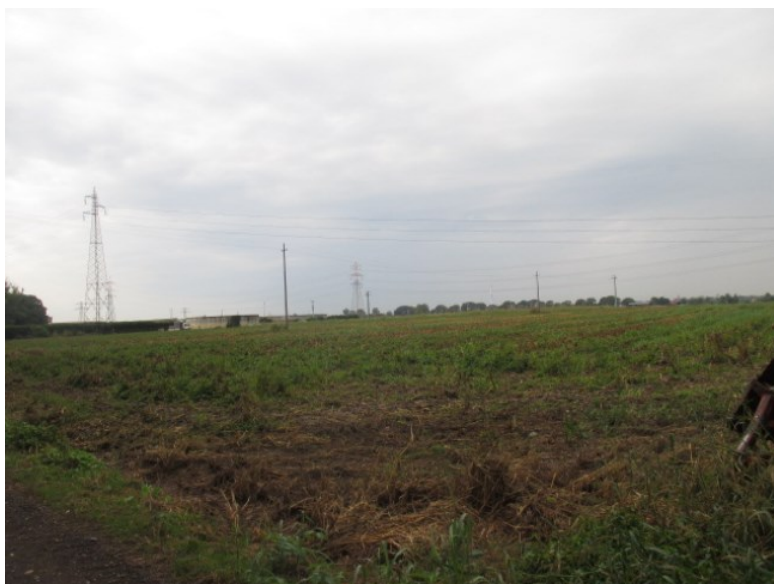
Vista da strada sterrata che si dirama da via Cascia Pallavicina