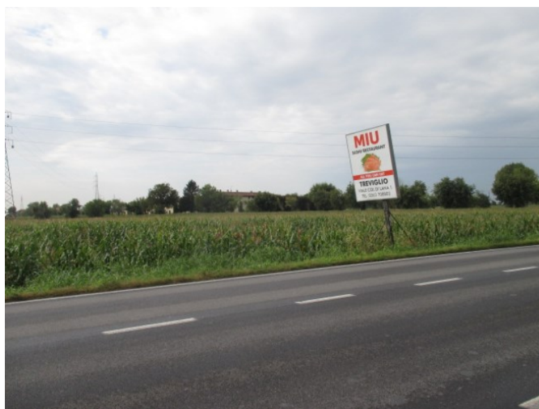
vista da via Milano