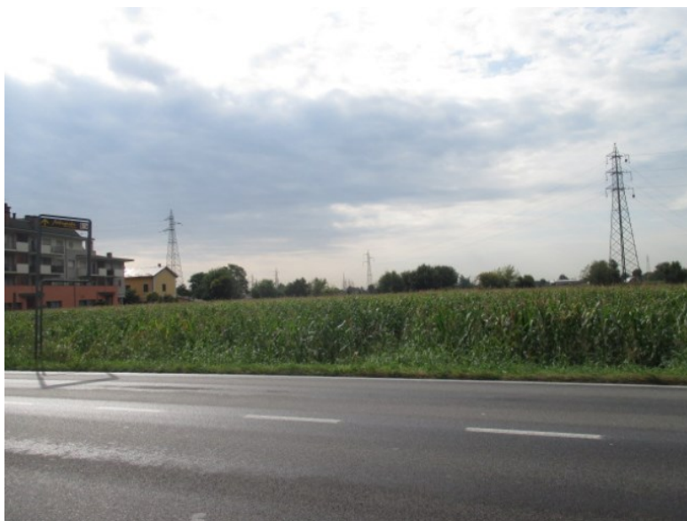
vista da via milano verso Treviglio