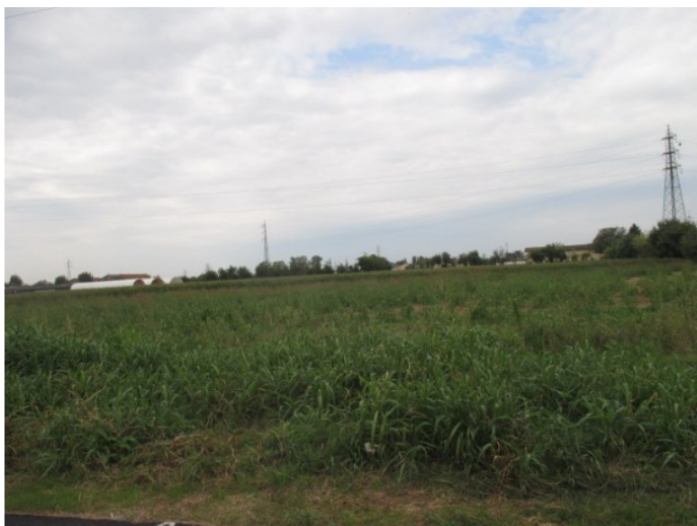
Vista da via Bezzecca