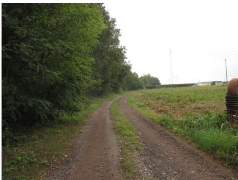
Vista da strada sterrata che si dirama da via Cascia Pallavicina