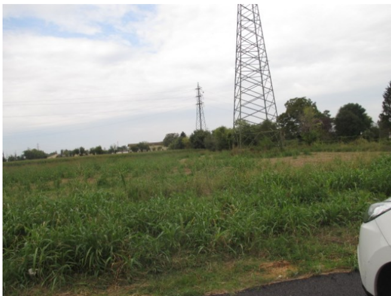
vista da via Bezzecca