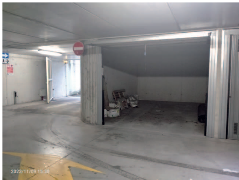
box sub 771