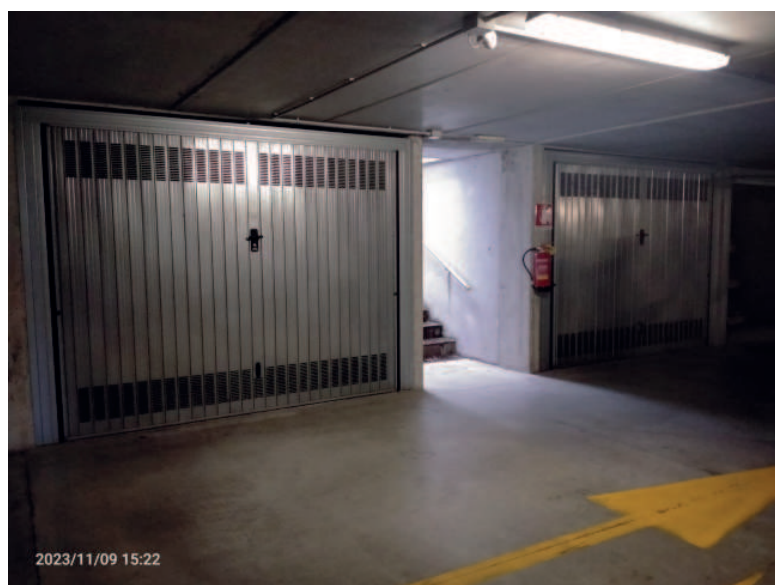
box sub 754 a valle della scala