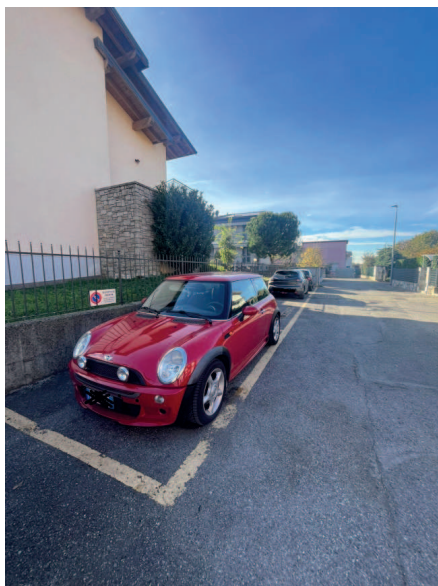
posti auto esterni