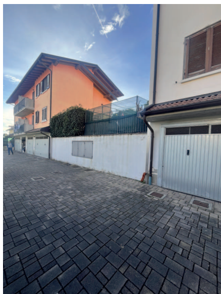
posti auto esterni al fabbricato

Descrizione: Posto auto [PA] di cui al corpo D - POSTO AUTO INTERNO SUB 703