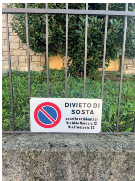
posti auto esterni