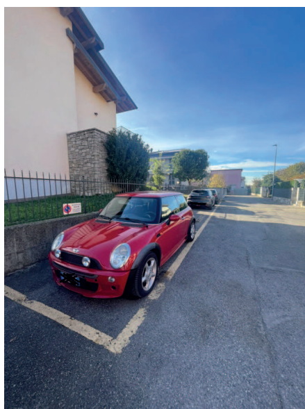
posti auto esterni

Descrizione: Posto auto [PA] di cui al corpo d - POSTO AUTO ESTERNO SUB 705