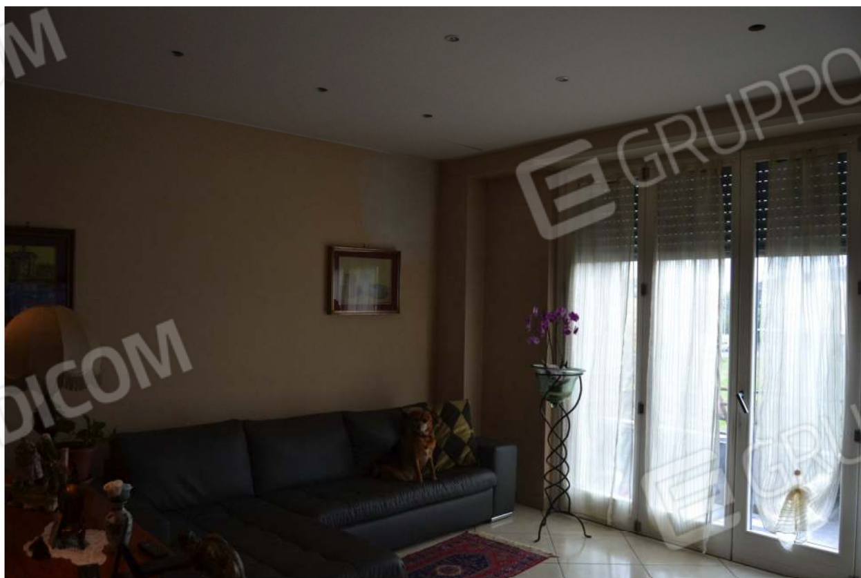
SALA - SOGGIORNO