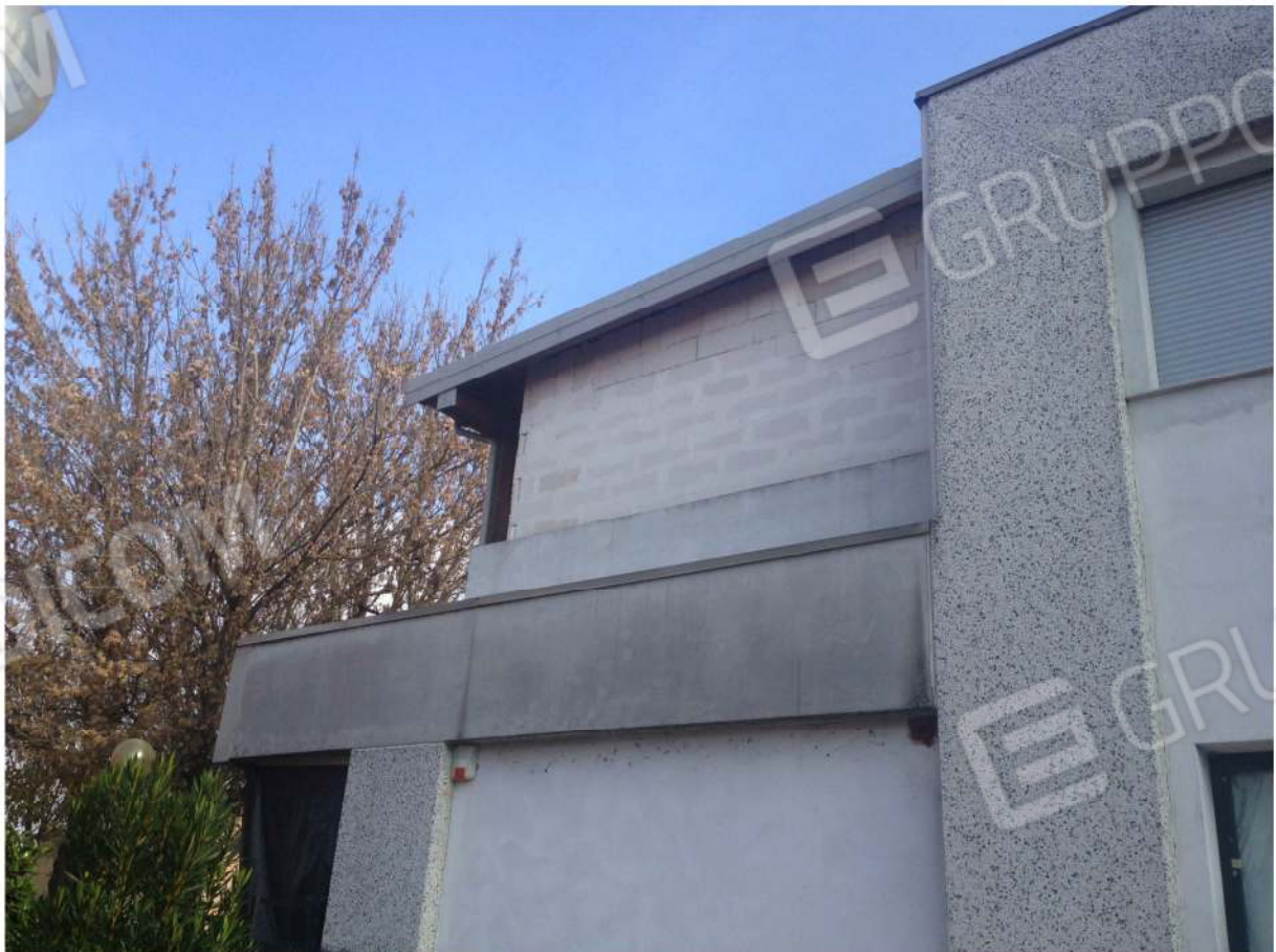
VISTA ESTERNA DELL'AMPLIAMENTO