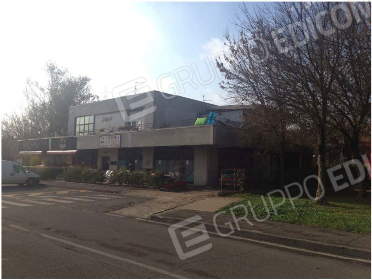
PROSPETTO VERSO VIA E. BERLINGUER