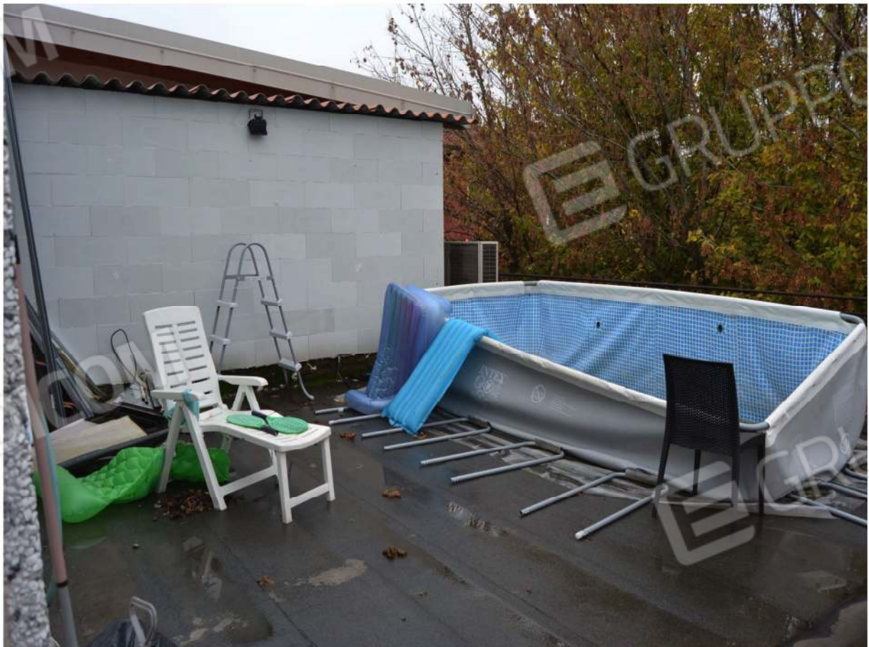
VISTA ESTERNA DEL TERRAZZO