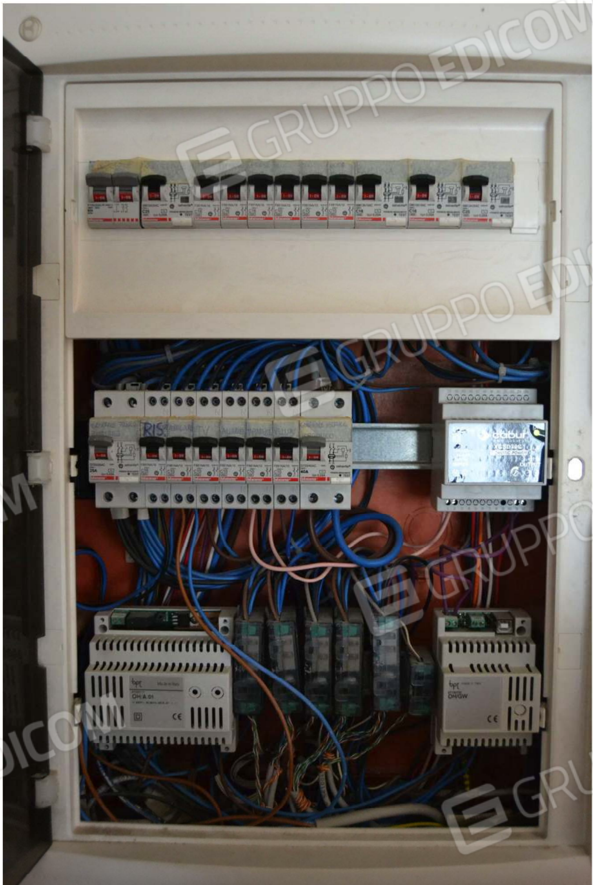
QUADRO ELETTRICO GENERALE