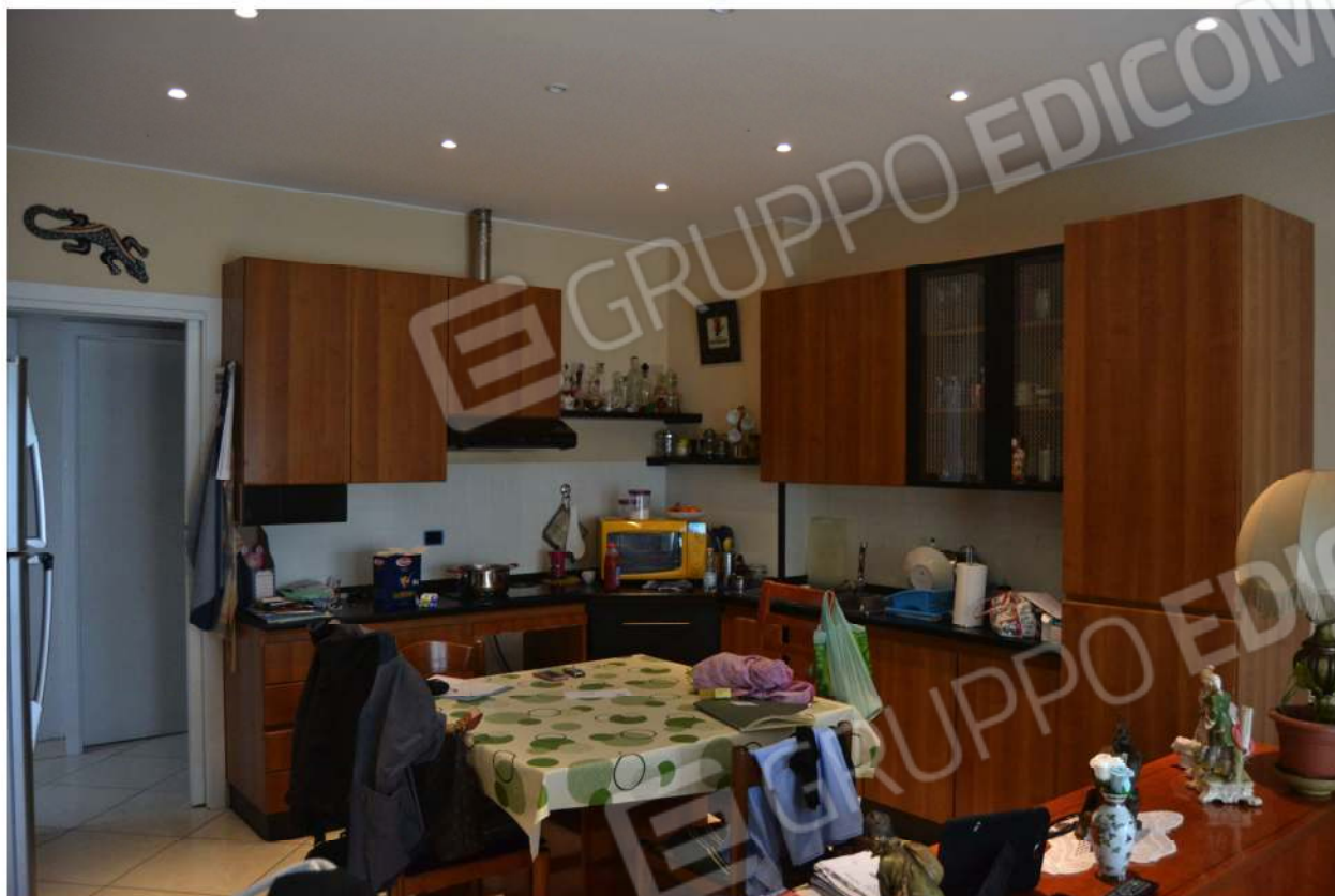
SALA - SOGGIORNO