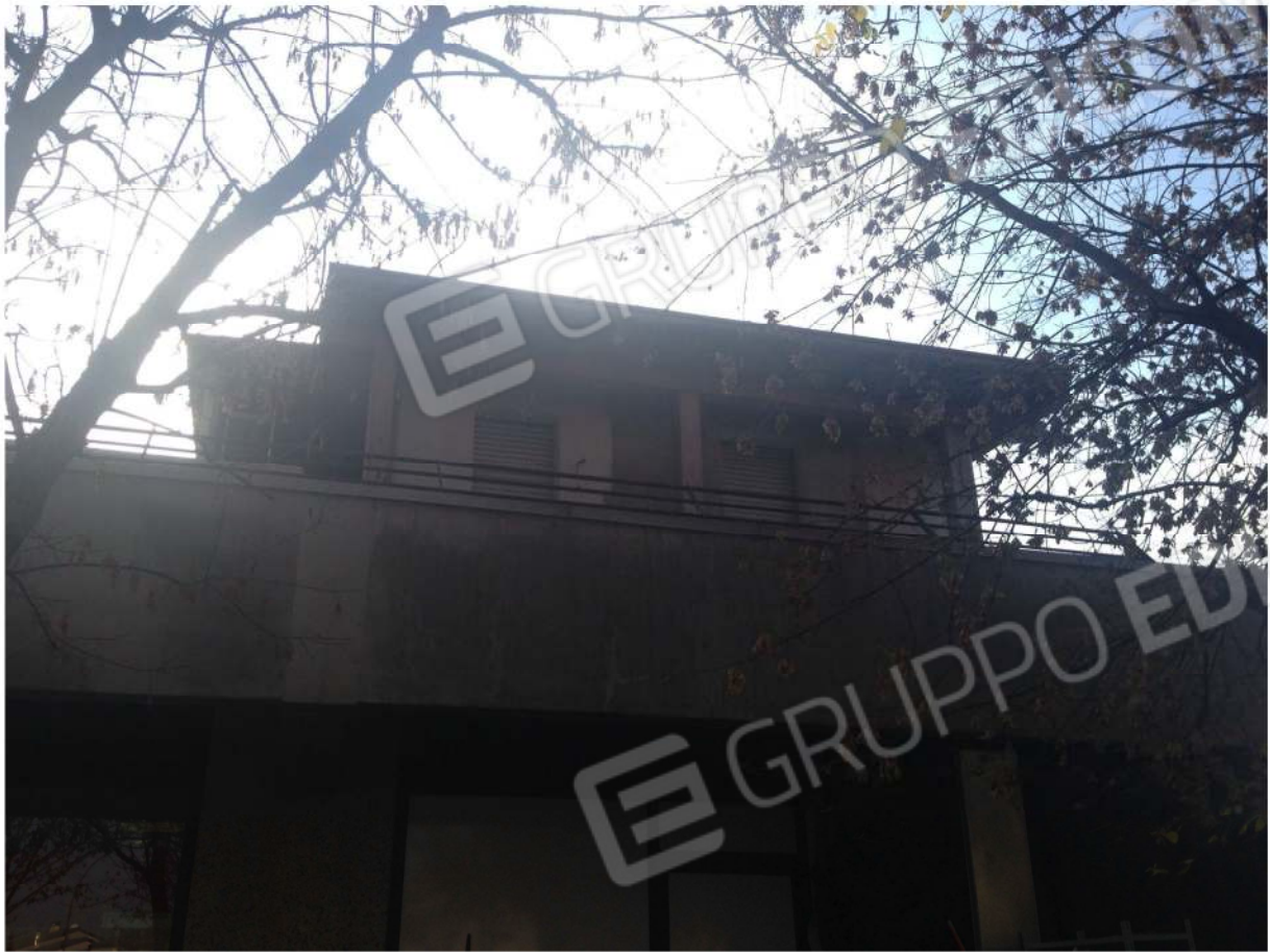
VISTA ESTERNA DELL'AMPLIAMENTO DAL PROSPETTO NORD