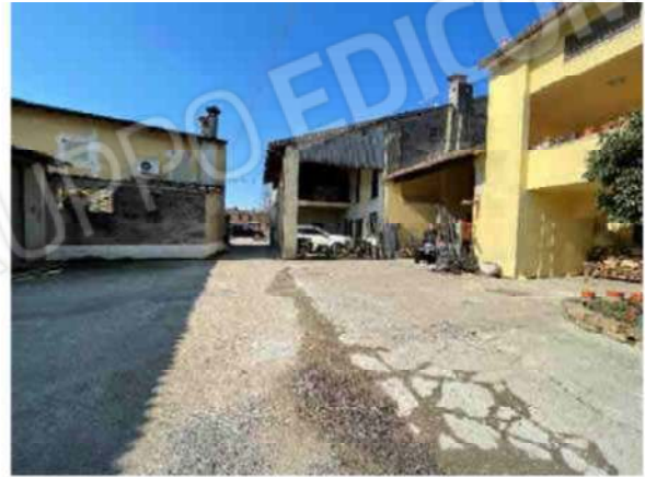
VISTA ACCESSO ALLA CORTE