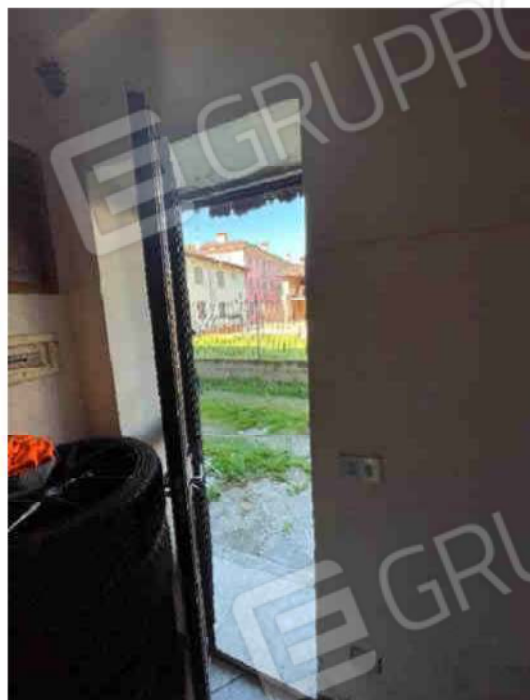
USCITA RETRO CASA