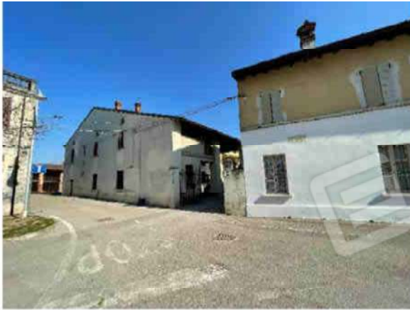
PIAZZA IV NOVEMBRE