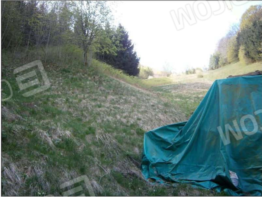
LOTTO B: vista dei terreni circostanti