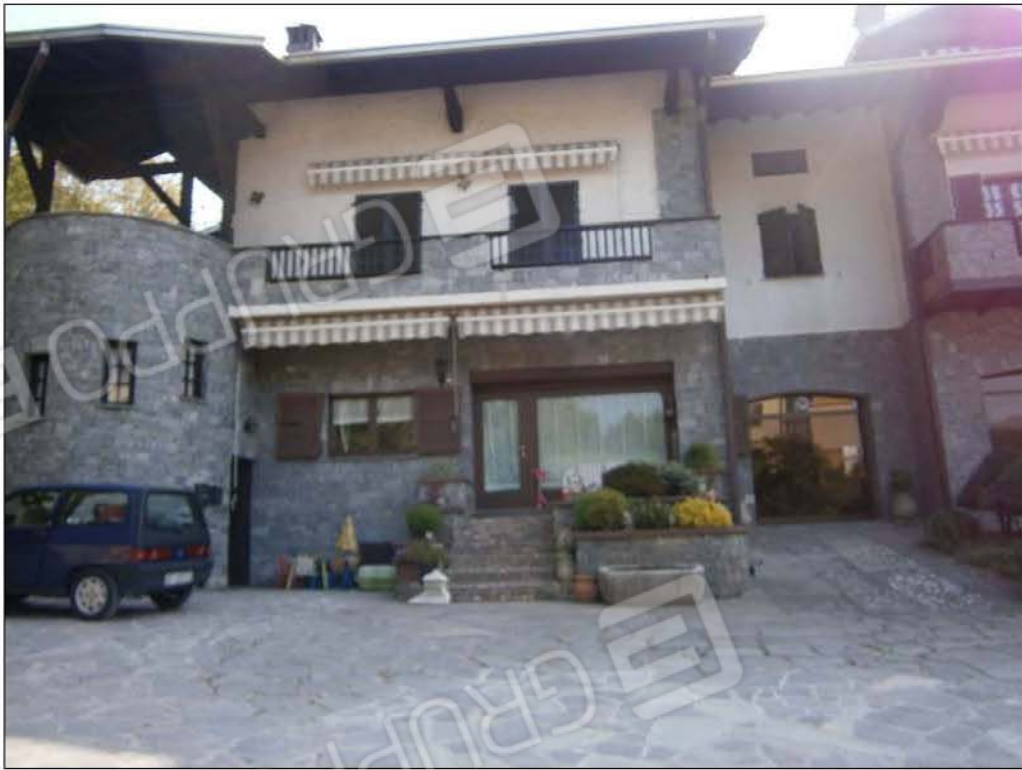
LOTTO A: vista esterna