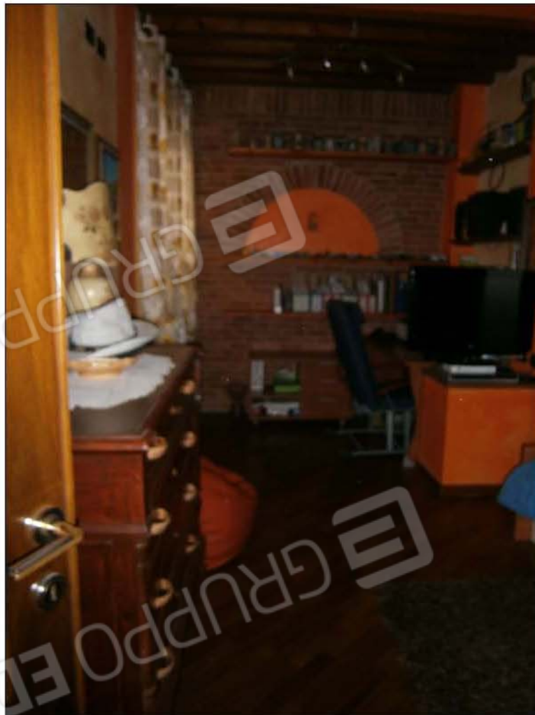
LOTTO A: vista interna di una camera(sub.5)