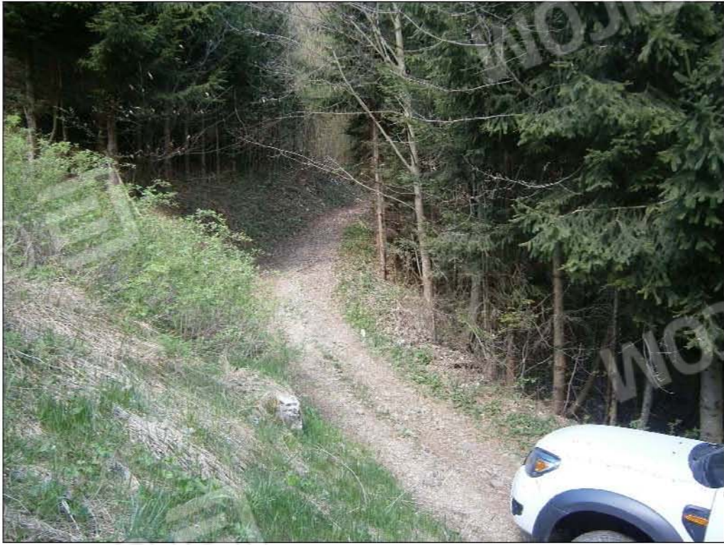
LOTTO B: strada di accesso