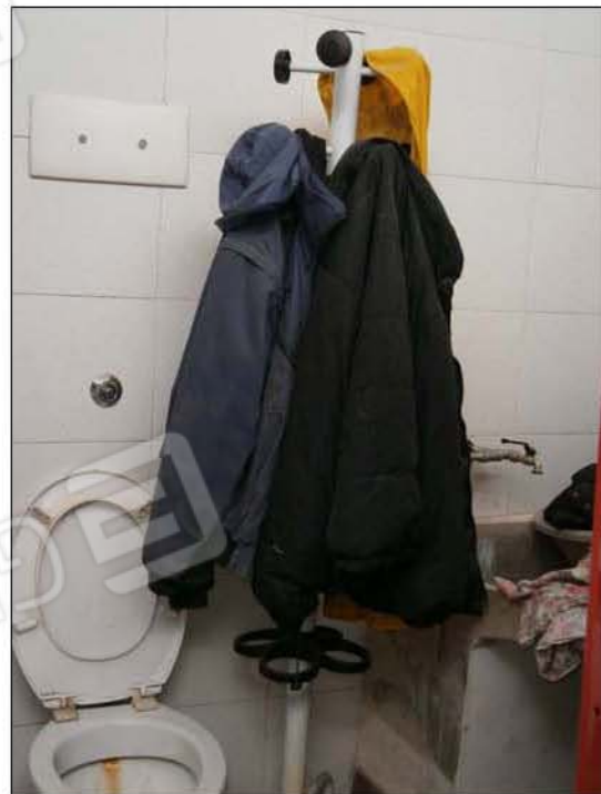
LOTTO A (sub.5): particolare cantina e lavanderia