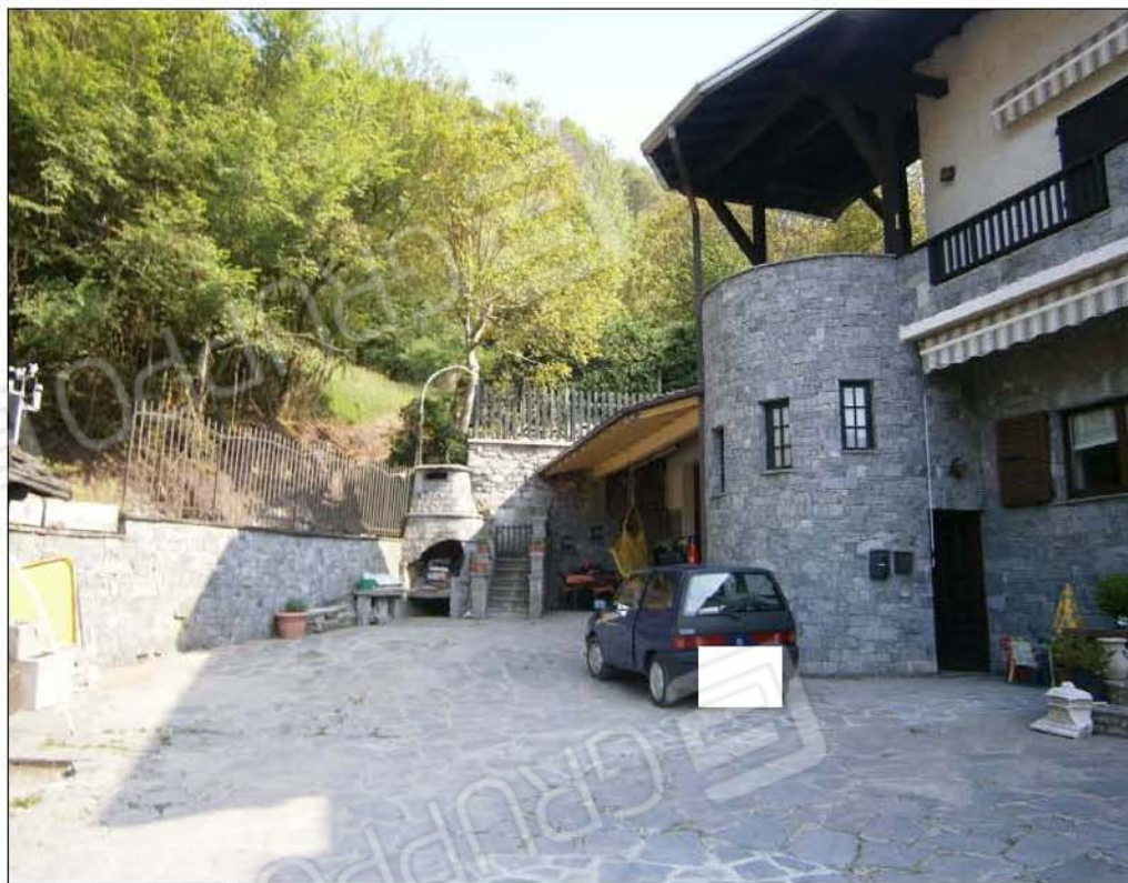
LOTTO A: vista esterna