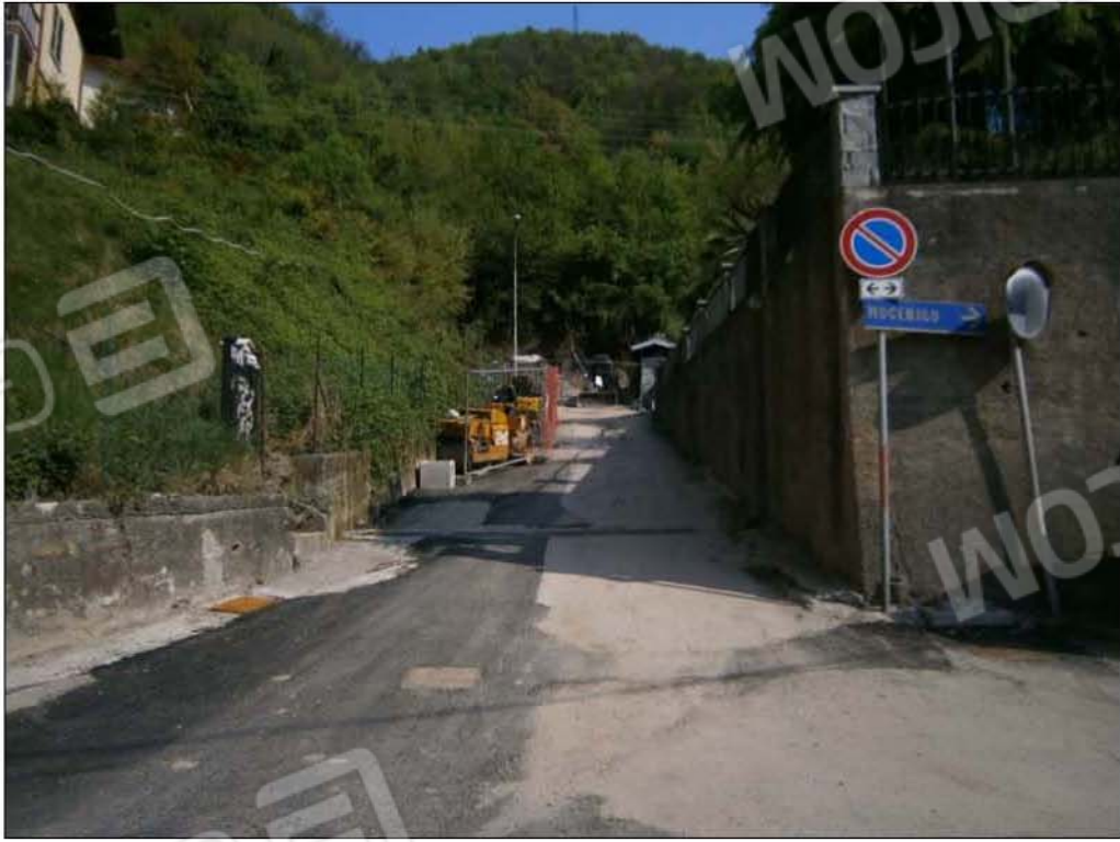
LOTTO A: Via Saline