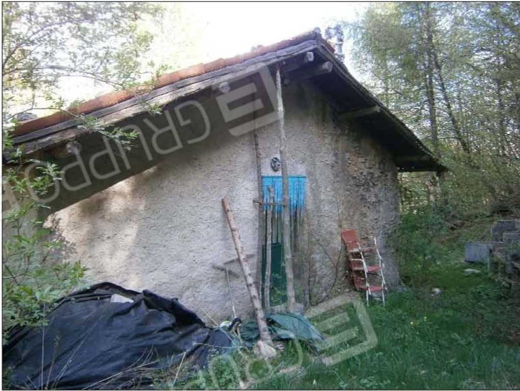
LOTTO B: vista esterna fabbricato rurale