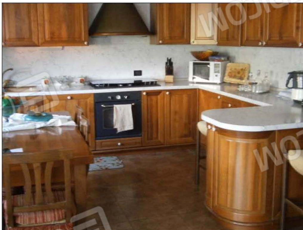
LOTTO A: vista interna cucina (sub.5)