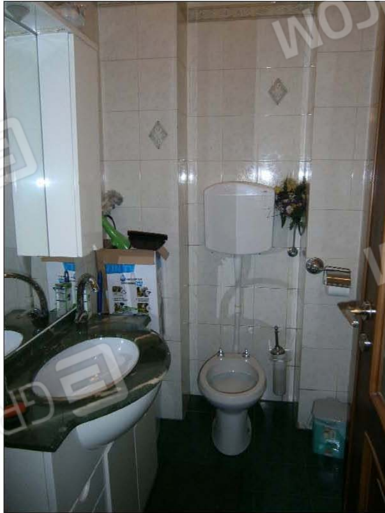
LOTTO A: vista interna w.c. (sub.5)