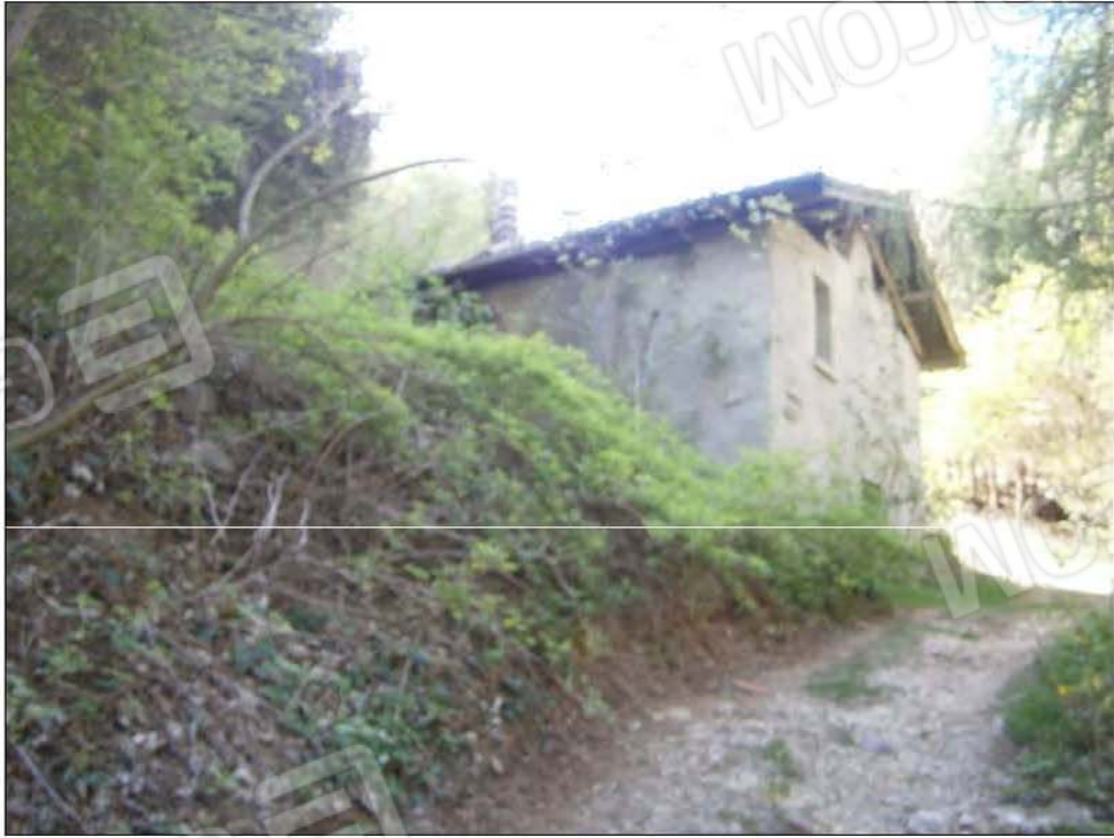
LOTTO B: vista esterna fabbricato rurale