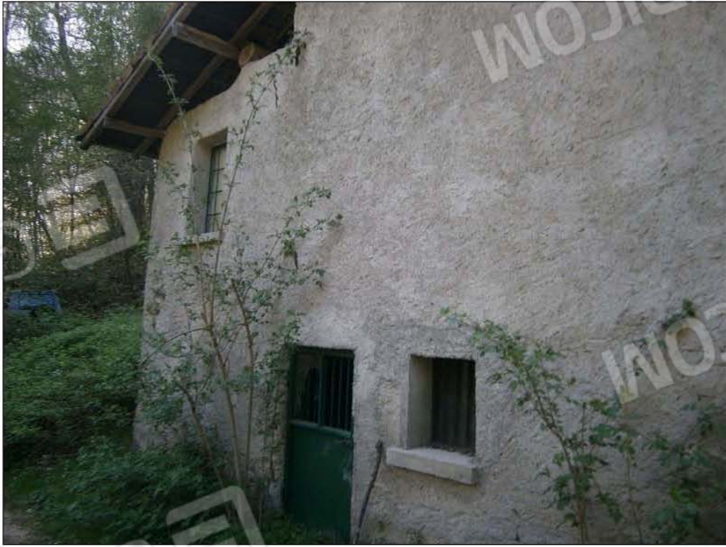
LOTTO B: vista esterna fabbricato rurale