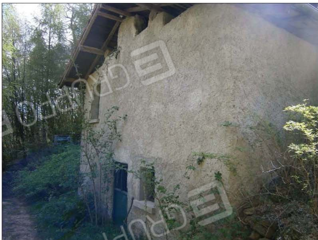
LOTTO A: ingresso carraio all'interno dell'area comune