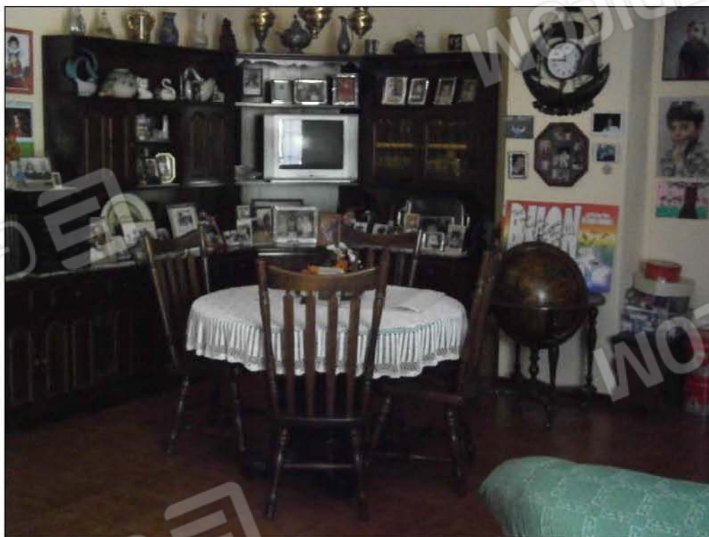
LOTTO A: vista interna soggiorno (sub.3)