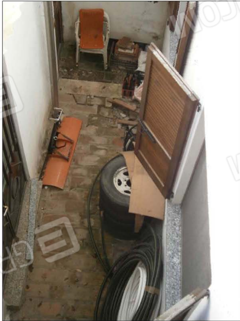
LOTTO A (sub 5): vista cavedio esterno