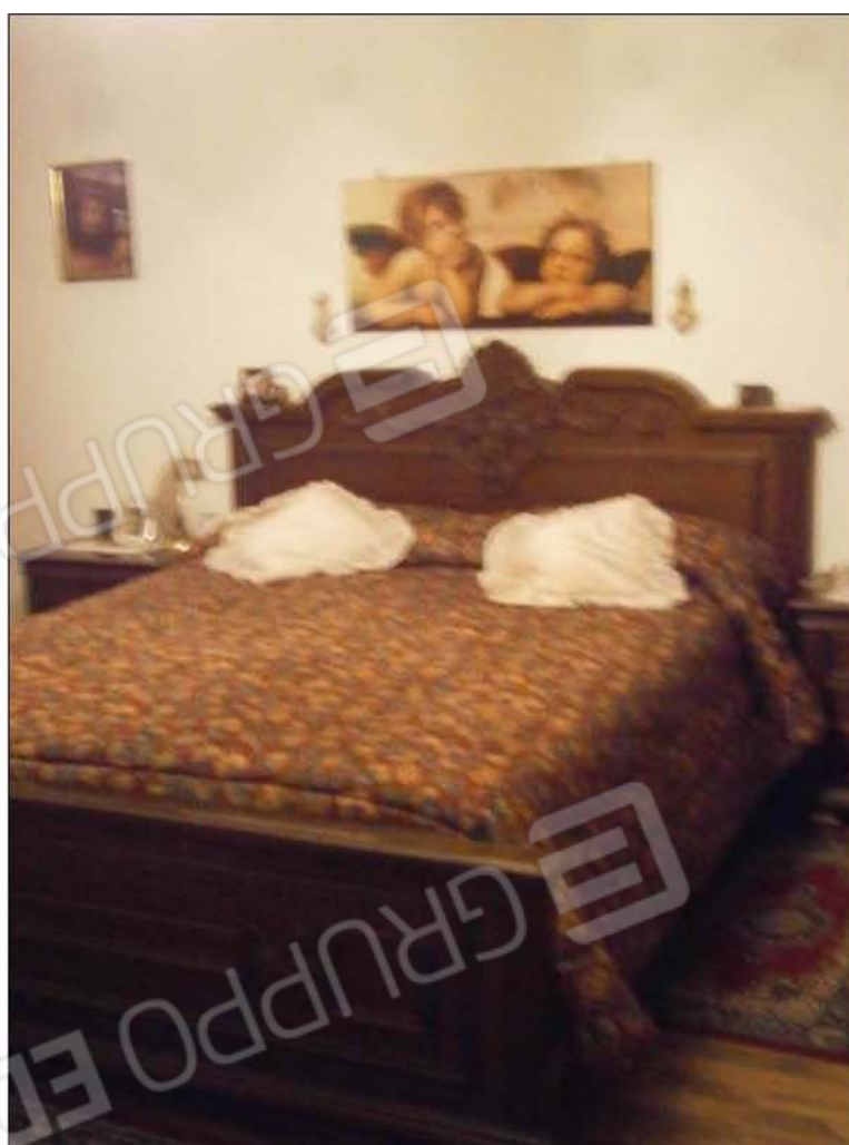
LOTTO A: vista camera (sub.3)