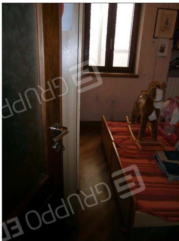
LOTTO A: vista interna camera (sub.5)