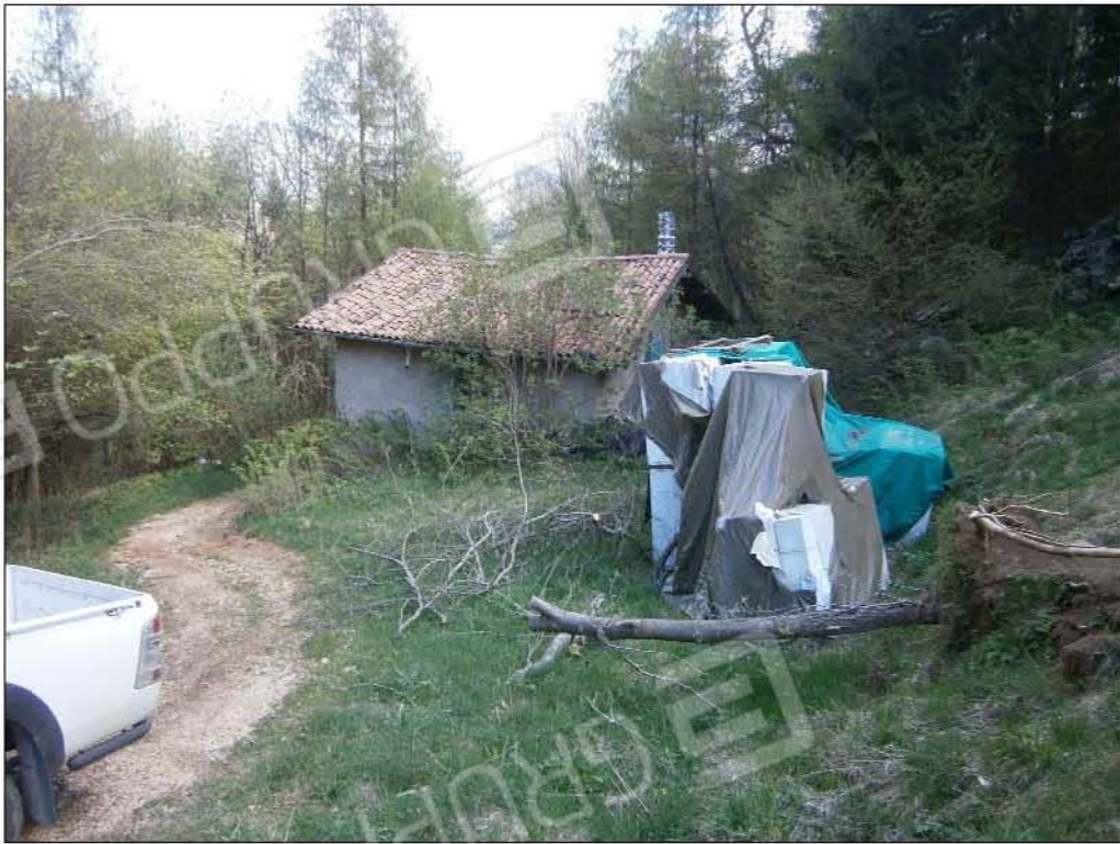
LOTTO B: vista esterna fabbricato rurale