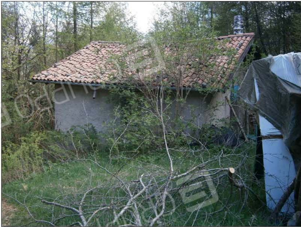
LOTTO B: vista esterna fabbricato rurale