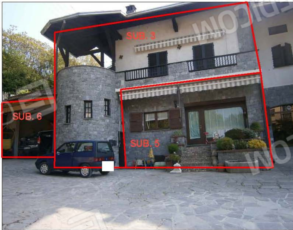
LOTTO A: vista esterna