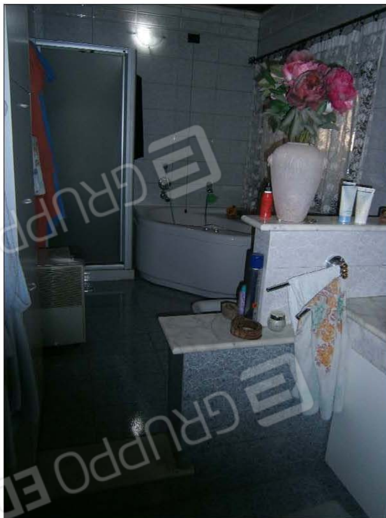
LOTTO A: vista bagno principale (sub.5)