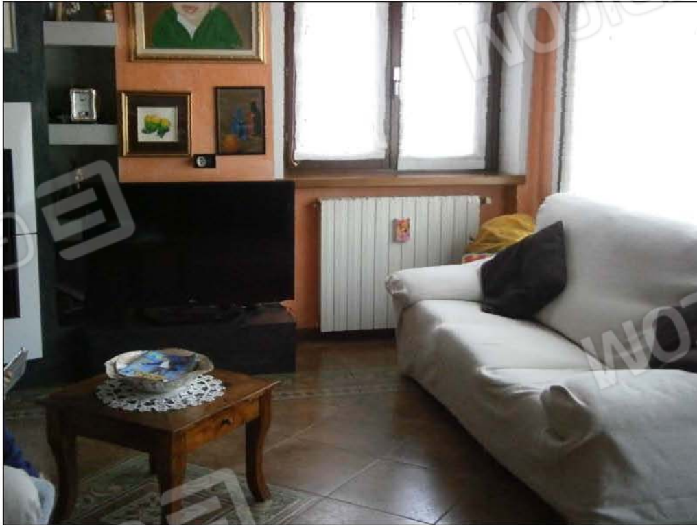
LOTTO A: vista interna soggiorno (sub.5)