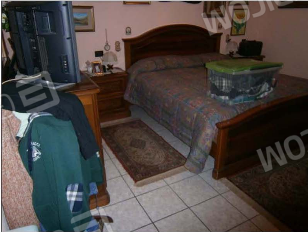
LOTTO A: vista interna camera (sub.5)