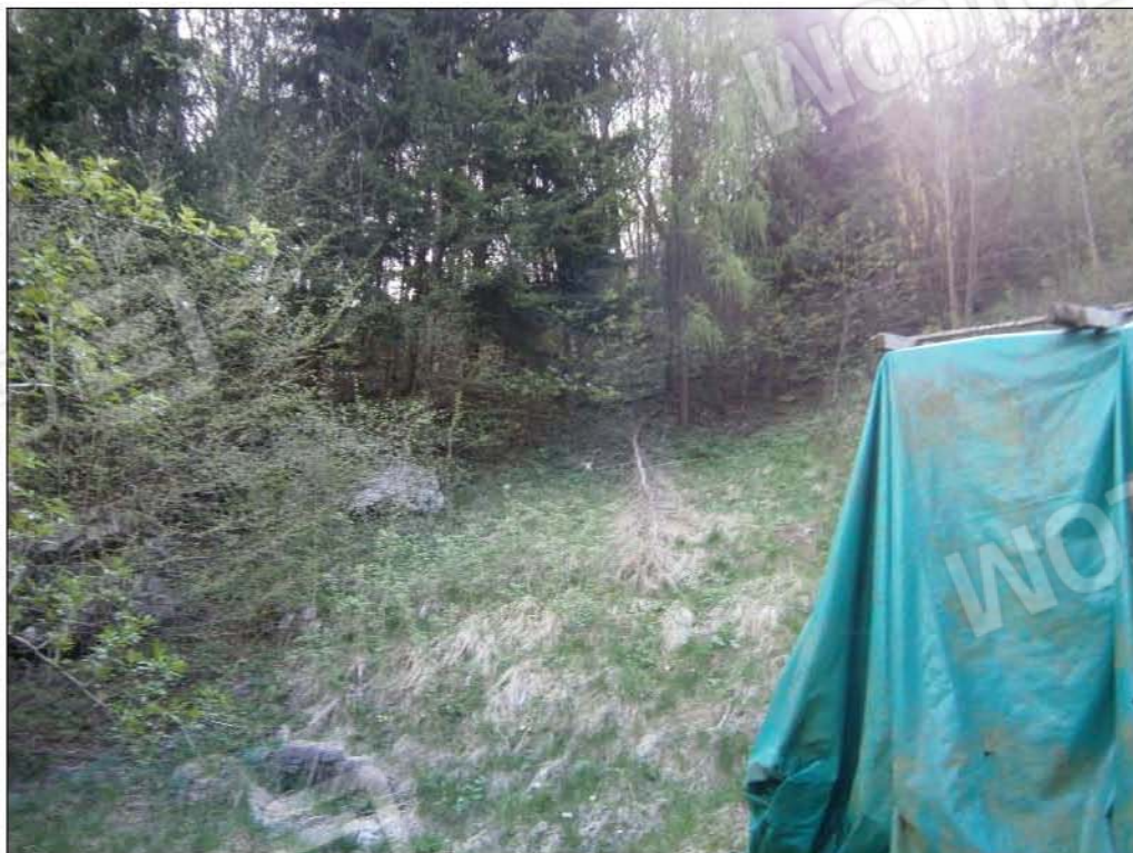
LOTTO B: vista dei terreni circostanti