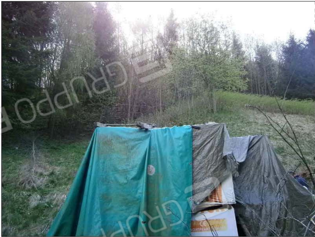
LOTTO B: vista dei terreni circostanti