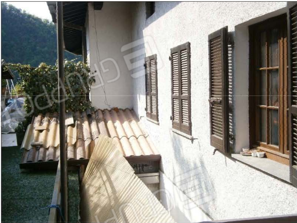
LOTTO A: vista terrazza esclusiva (sub.3)