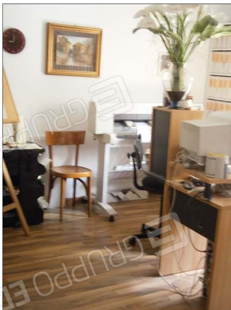
LOTTO A: vista di una delle camere (sub.3)