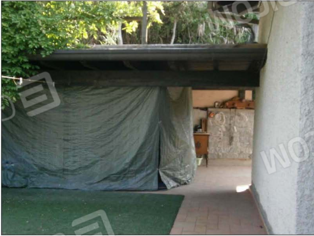
LOTTO A: vista terrazza esclusiva (sub.3)