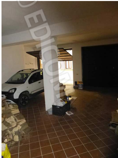
SUB. 2 - AUTORIMESSA