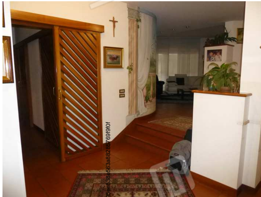
SUB. 1 - PIANO TERRA