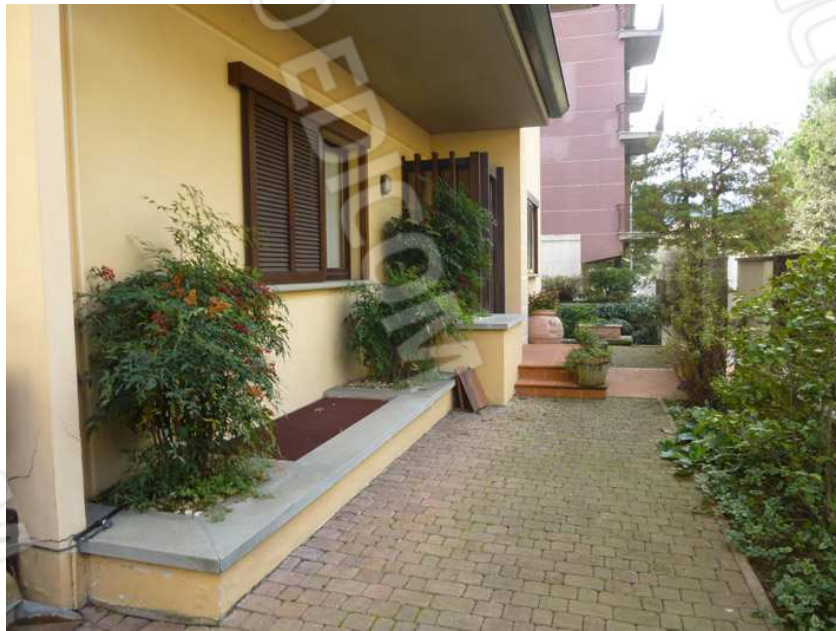
SUB. 13 - CORTE