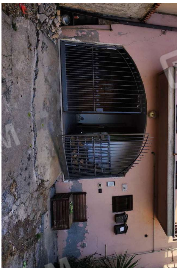
Fotografia n. 5