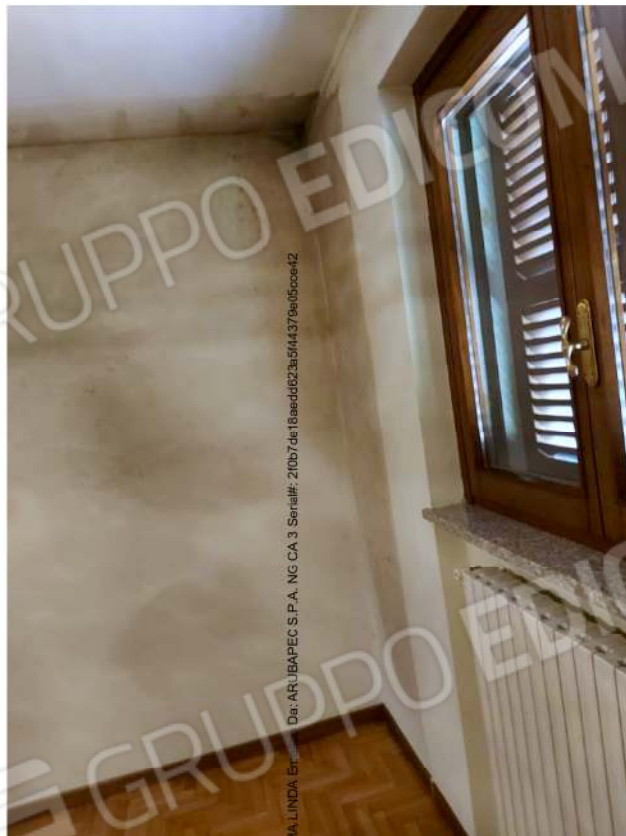
Camera visibili le tracce di ponte termico e infiltrazioni