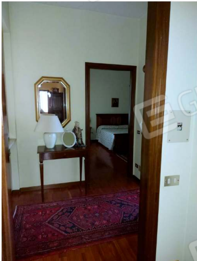
Dettagli pavimenti e porte interne