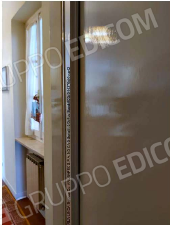
Dettaglio porte interne e calorifero