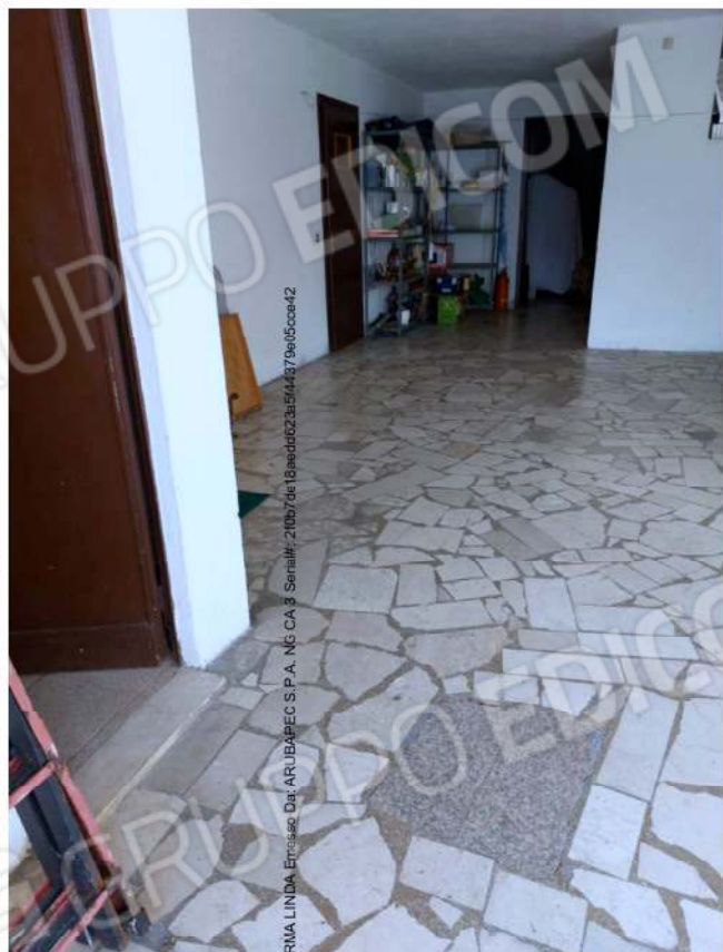
Box seminterrato accessibile dall'abitazione