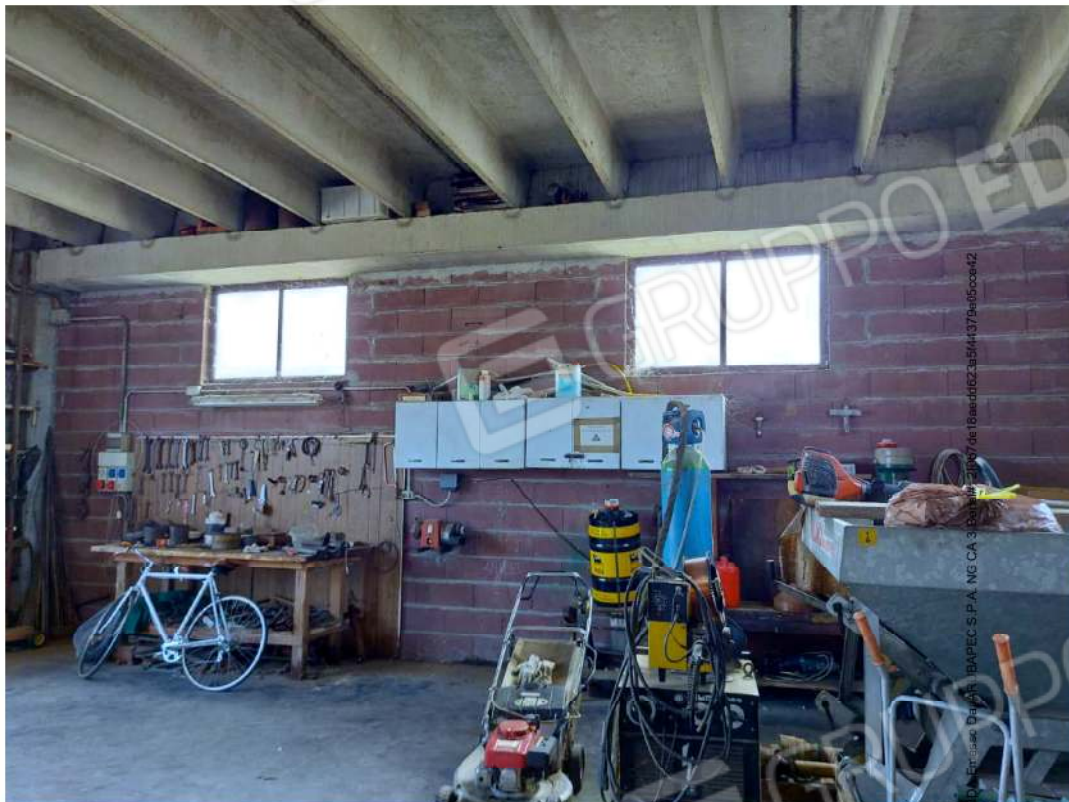
Interno del locale deposito chiuso con portone di ferro