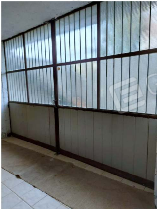
Accesso all'autorimessa con portone in ferro apertura manuale