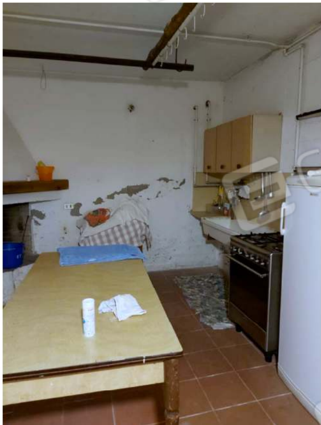
Locale interrato adiacente all'autorimessa