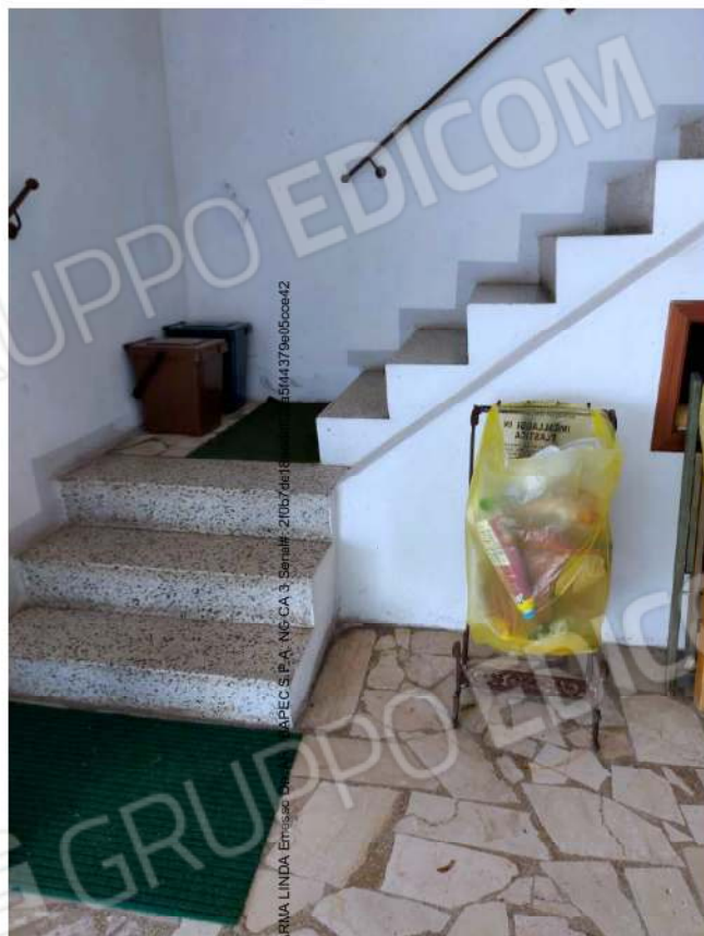
Scala interna per raggiungere la lavanderia ed il box