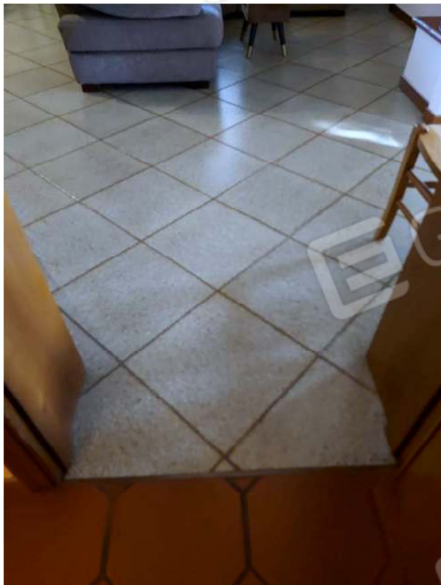
Dettaglio dei pavimenti interni all'abitazione