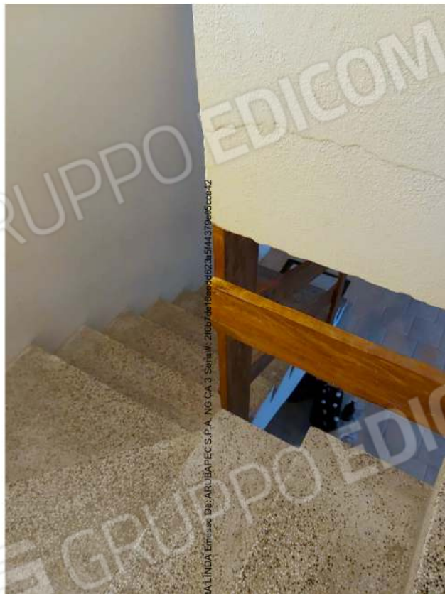
Scala interna che collega l'autorimessa all'abitazione