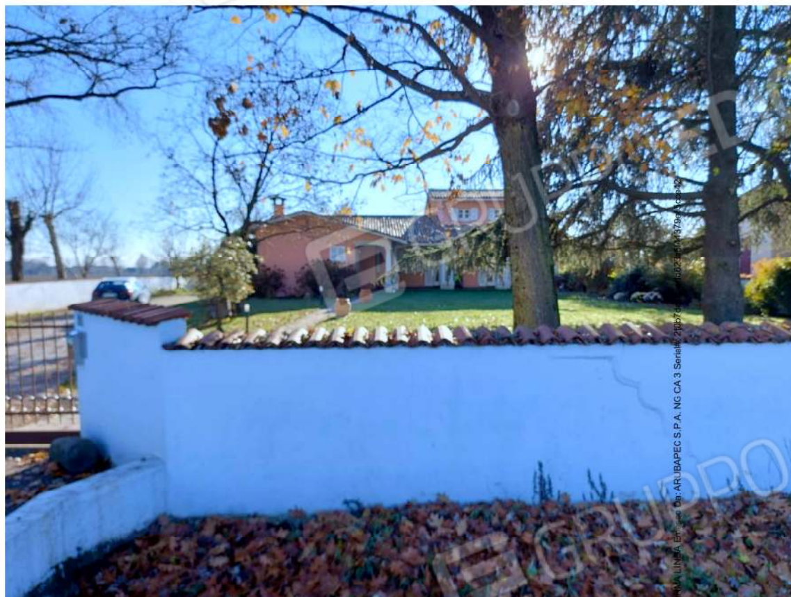
Vista esterna dell'immobile identificato al fg 9. Mapp 138