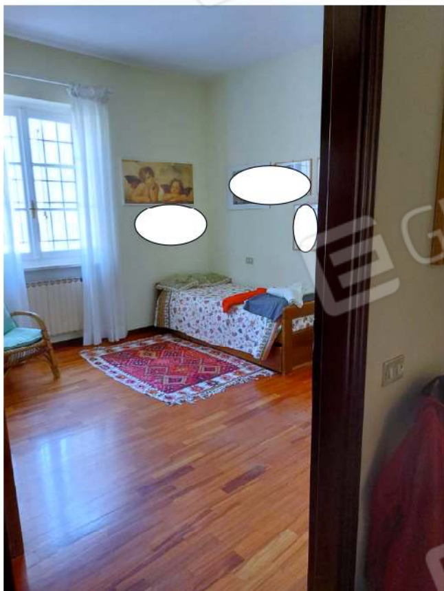
Dettaglio pavimenti, infissi e termosifone camera da letto