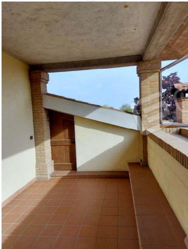
Dettaglio loggia piano primo