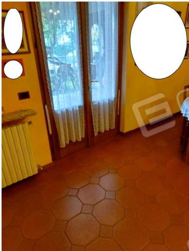
Dettaglio porta finestra, pavimenti interni e caloriferi