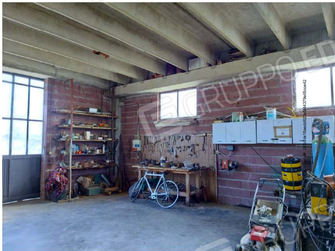
Interno del locale deposito chiuso con portone di ferro