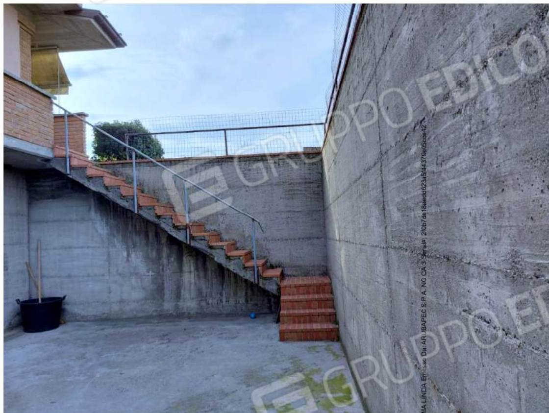
Scala di accesso dal portico al piano interrato dove si trova l'autorimessa