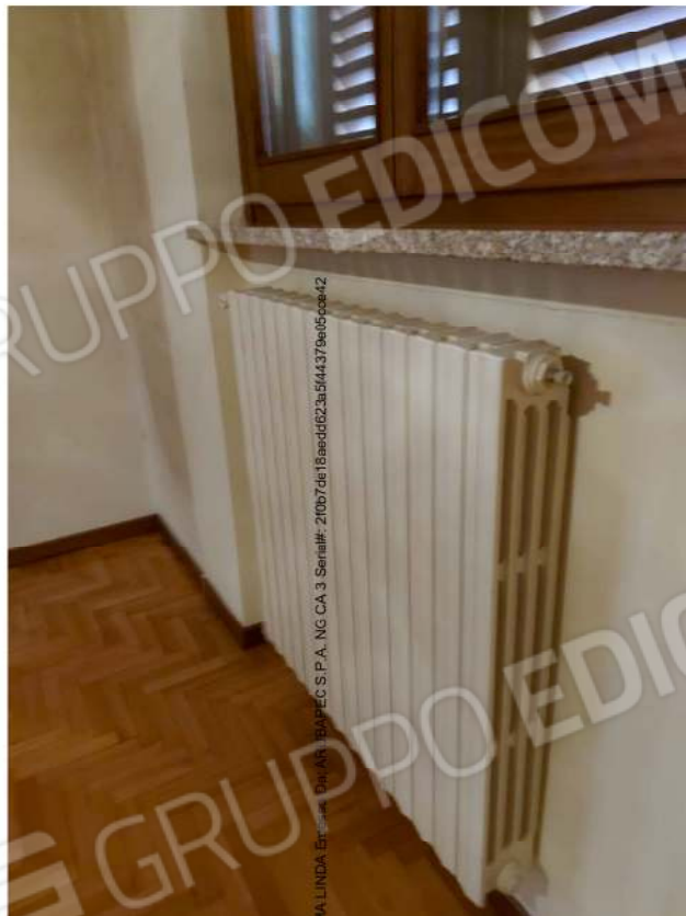
Dettaglio impianto riscaldamento