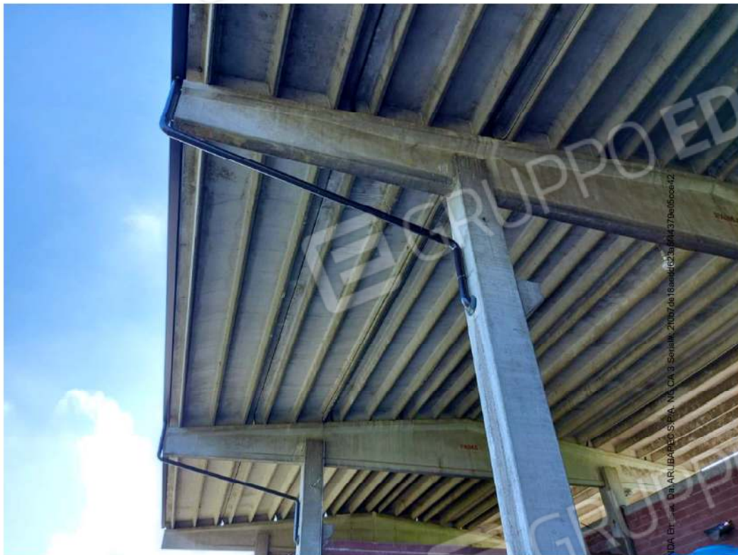
Dettaglio della copertura vista dall'interno. Si può vedere la struttura prefabbricata che compone il deposito