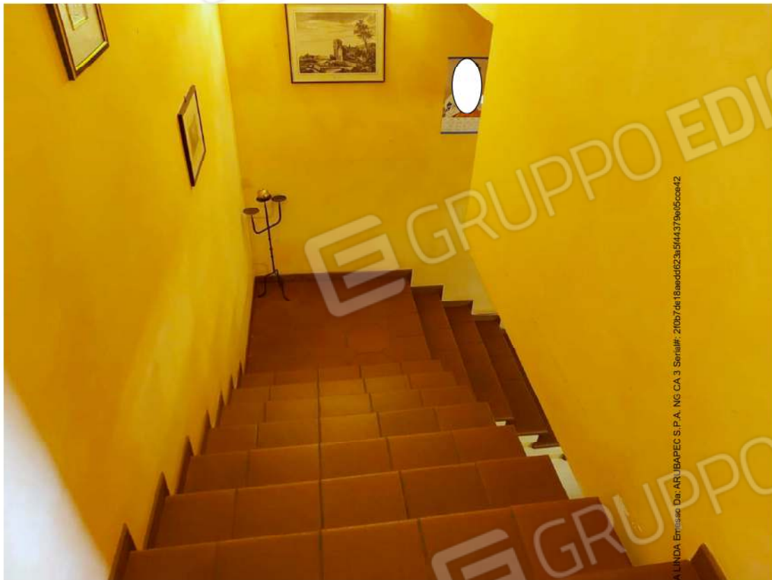
Scala interna che collega la zona giorno e la zona notte