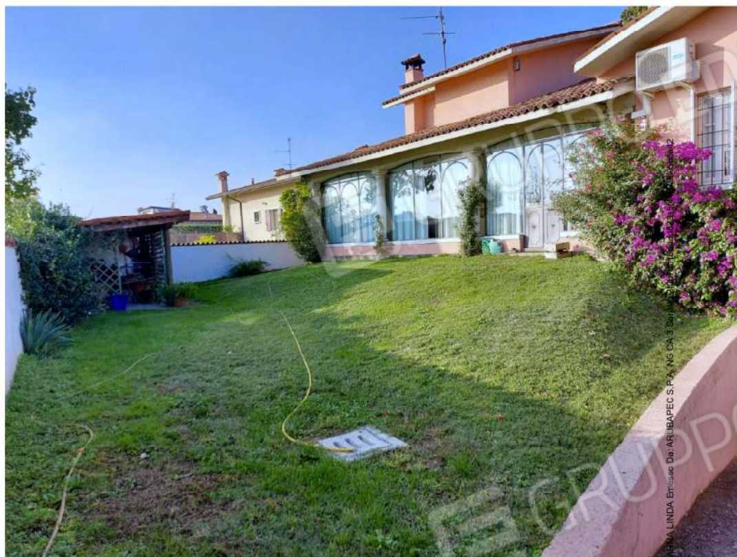
Vista esterna dell'immobile identificato al fig. 9. Mapp. 138