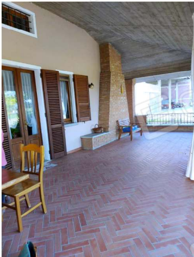
Dettaglio esterno portico piano terra