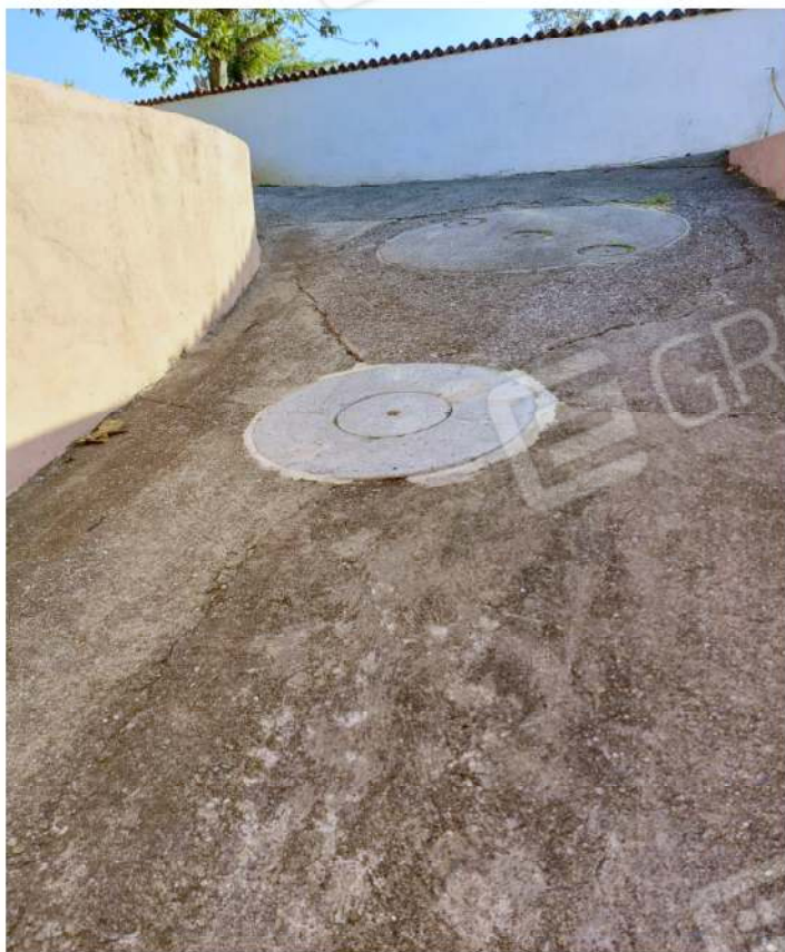
Vista esterna rampa accesso al box