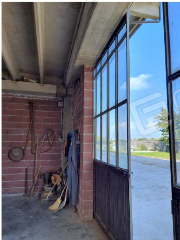
Vista interna del portone in ferro con apertura manuale della zona chiusa del deposito