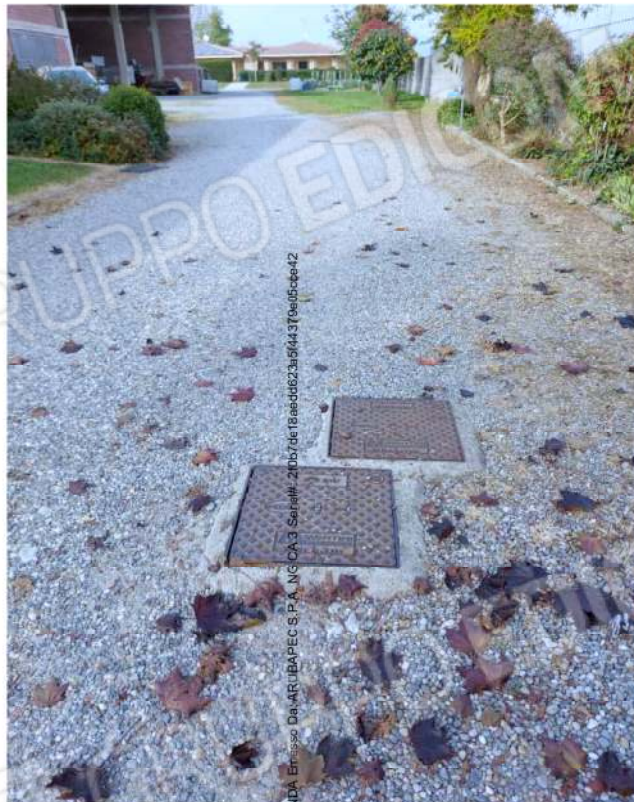
Viale d'accesso sub. 1 - comune ai sub 3-4-5 con transito anche ai mappali 615,616 e sottoservizi