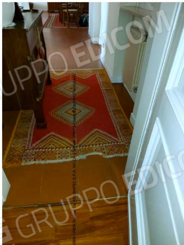
Dettaglio pavimenti interni