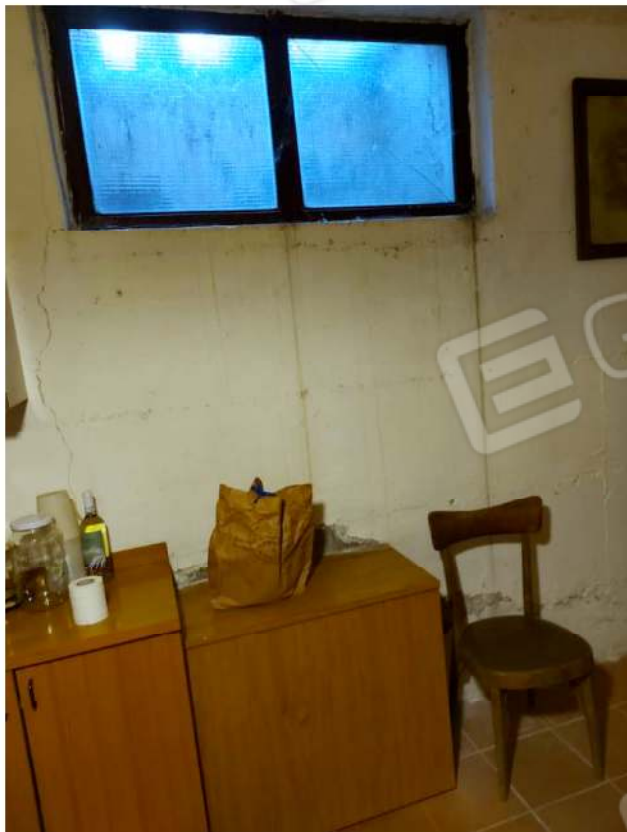
Locale interrato adiacente all'autorimessa, dettaglio finestra