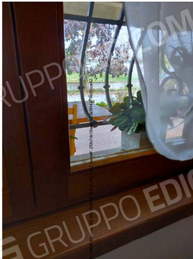
Dettaglio dei serramenti interni