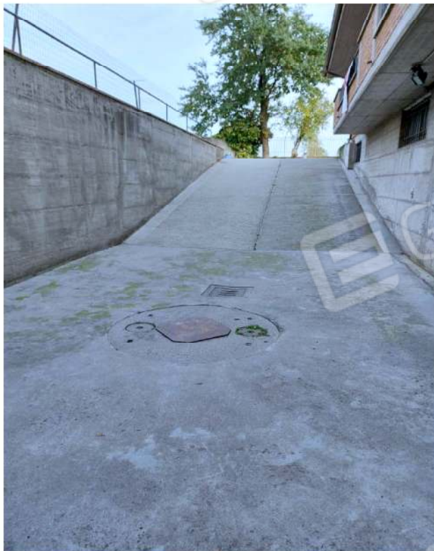
Rampa di accesso all'autorimessa