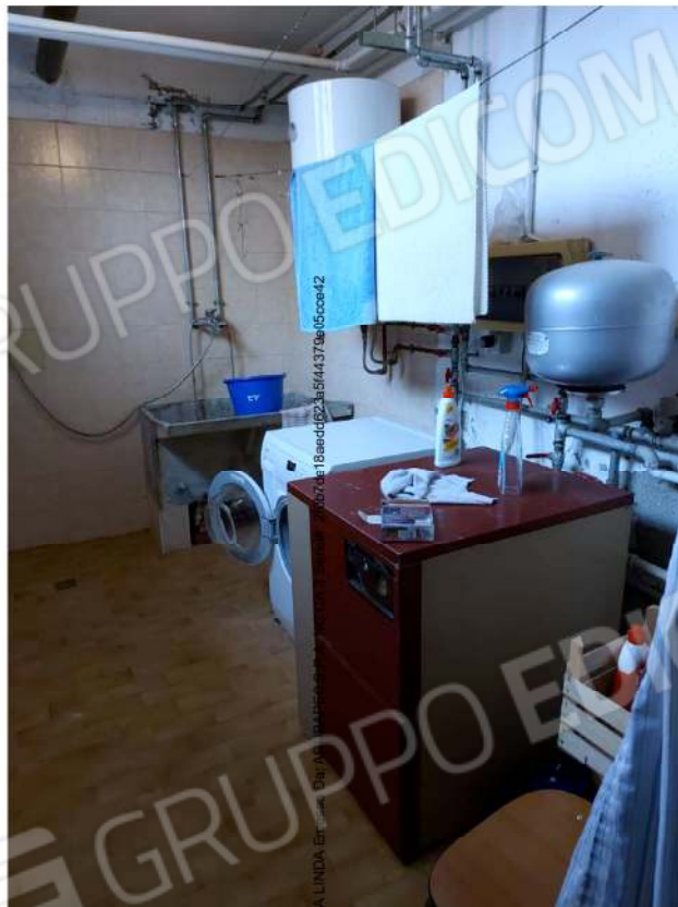
Locale tecnico/lavanderia adiacente all'autorimessa