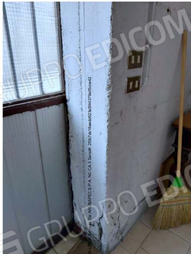
Accesso all'autorimessa con portone in ferro apertura manuale