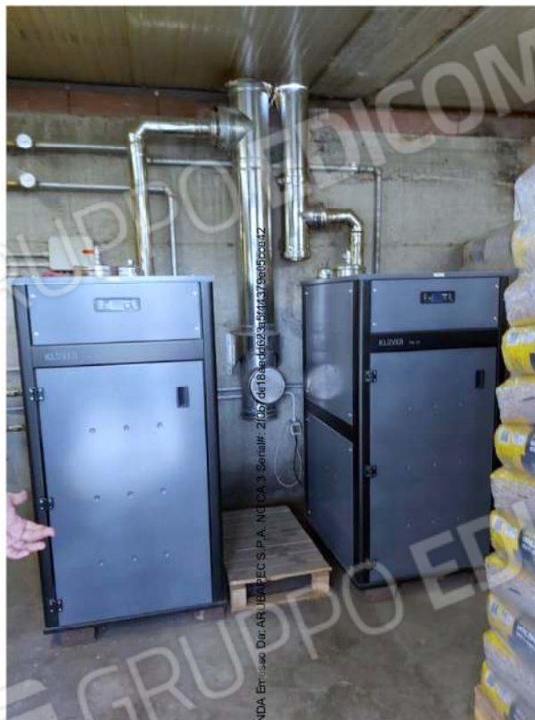
Locale tecnico deposito – caldaie a pellet che scaldano 585 sub 3-4 e mappali 615-616 posti a nord altre proprietà'