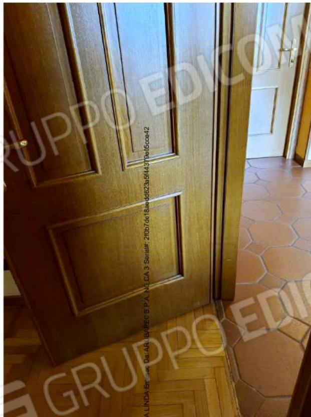
Dettaglio porte interne e pavimenti tra zona giorno e zona notte