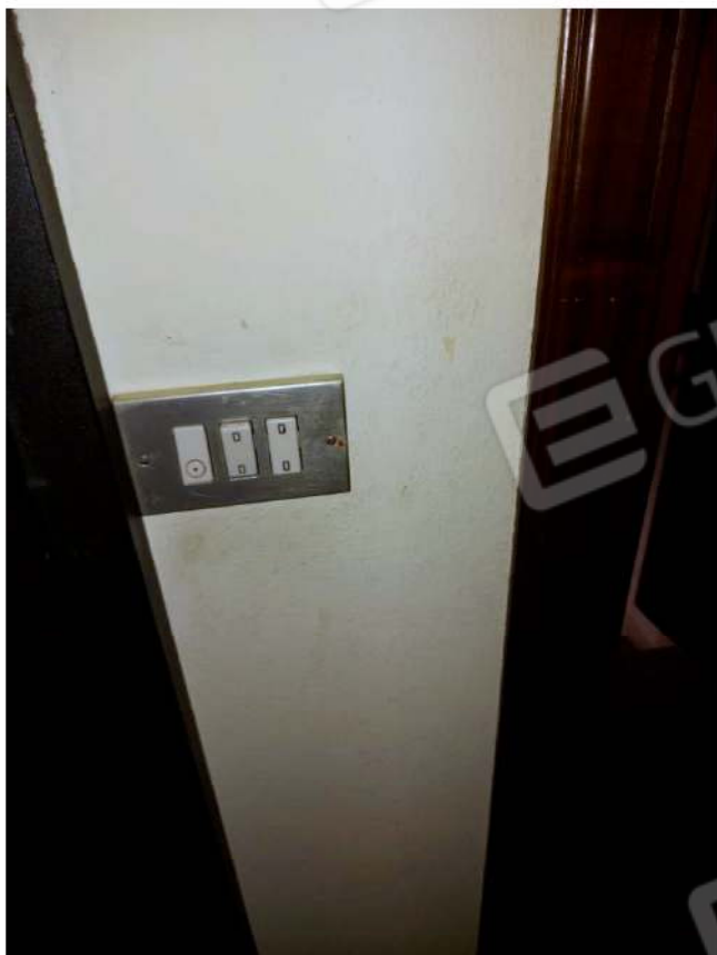
Dettaglio interruttori impianto elettrico