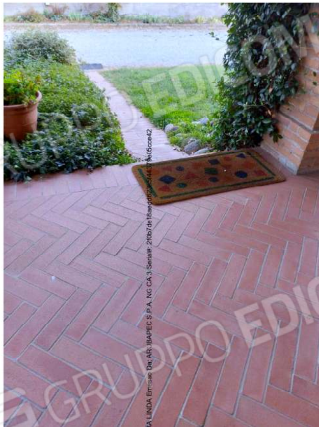
Dettaglio di uno degli accessi al portico