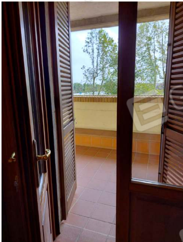
Accesso alla loggia