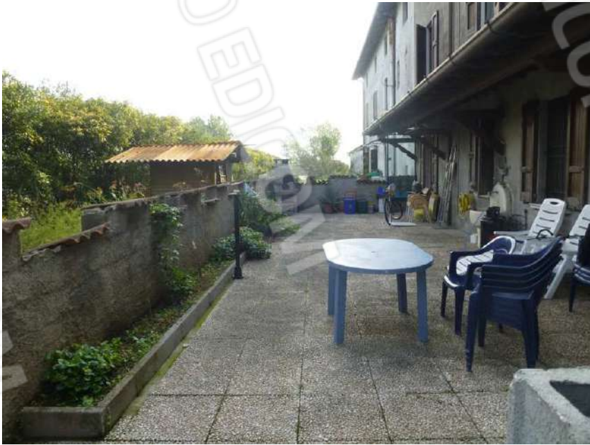
AREA ESTERNA MAPP. 69/130 NON OGGETTO DI STIMA