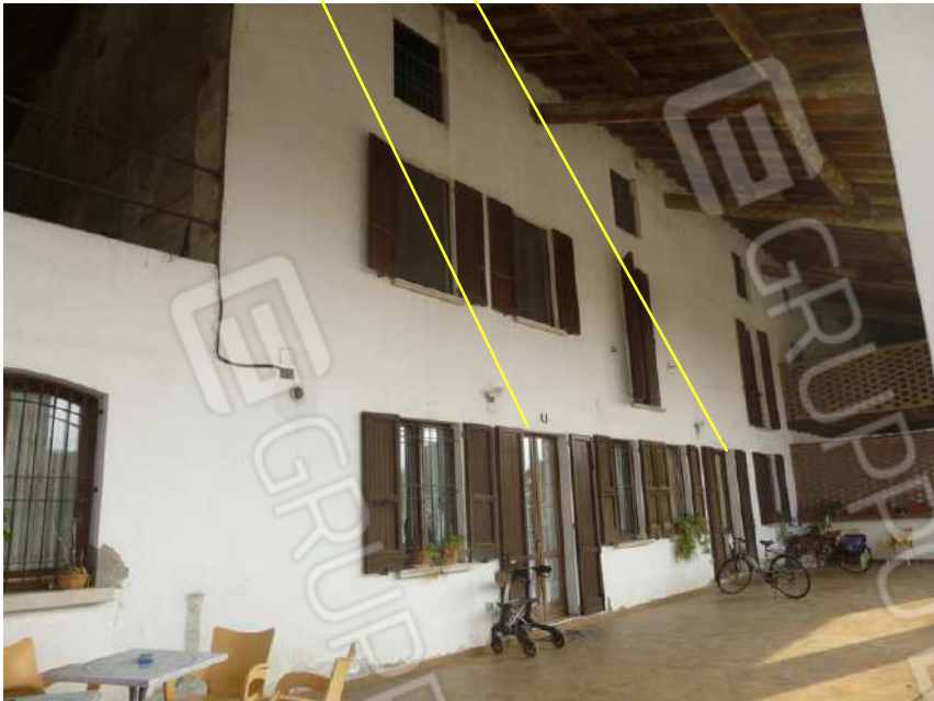
ABITAZIONI SUB. 6 - SUB. 7