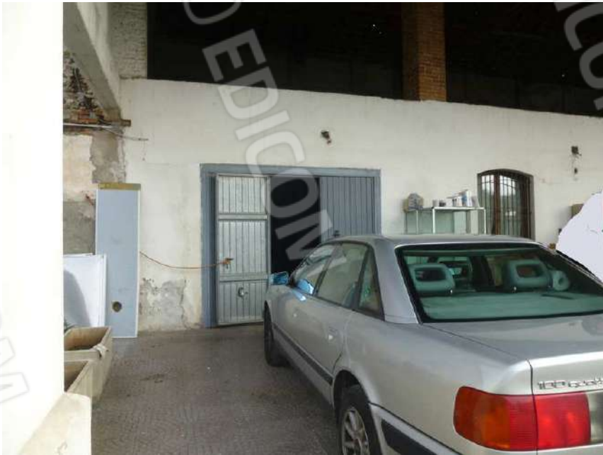
BOX SUB. 5