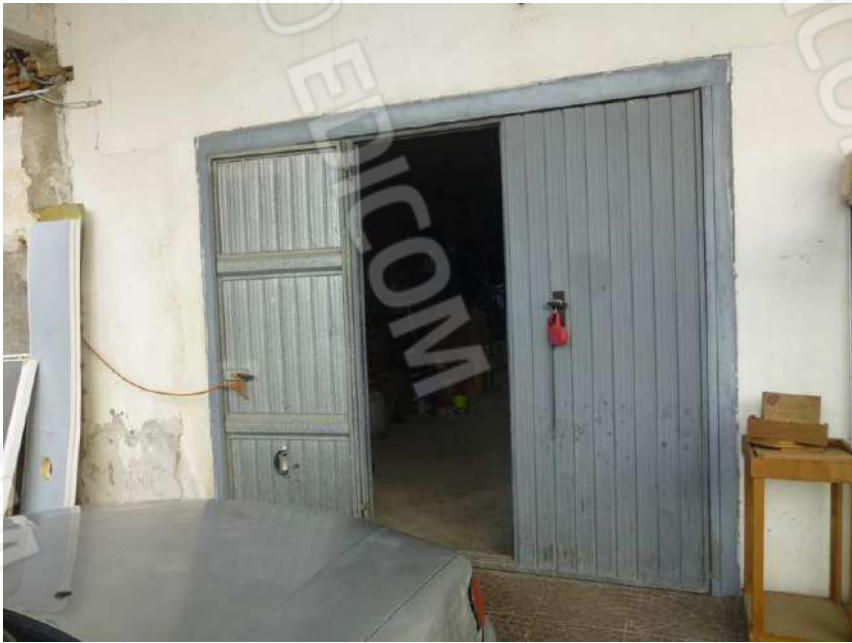
BOX SUB. 5