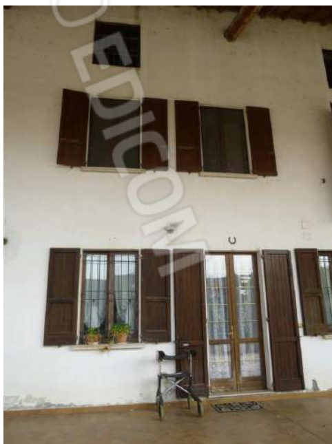
ABITAZIONE SUB. 6