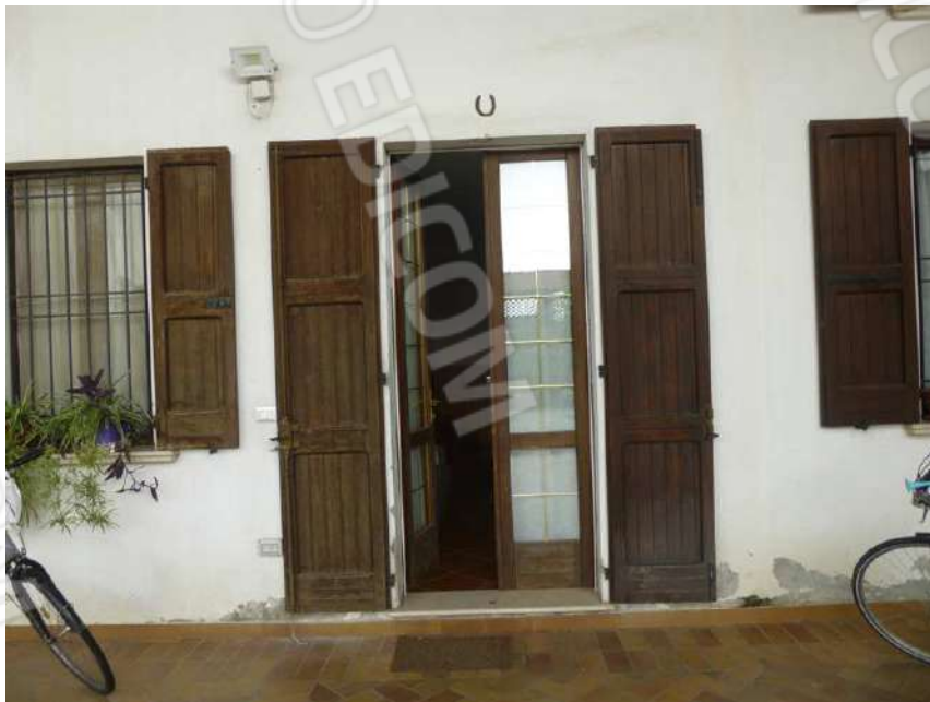
ABITAZIONE SUB. 7