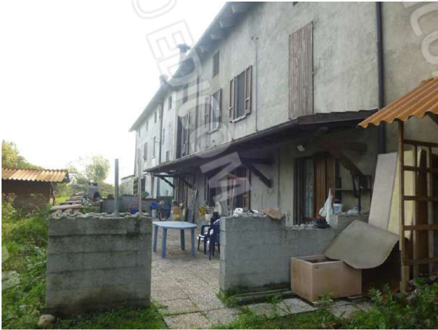
ESTERNO PROSPETTO NORD