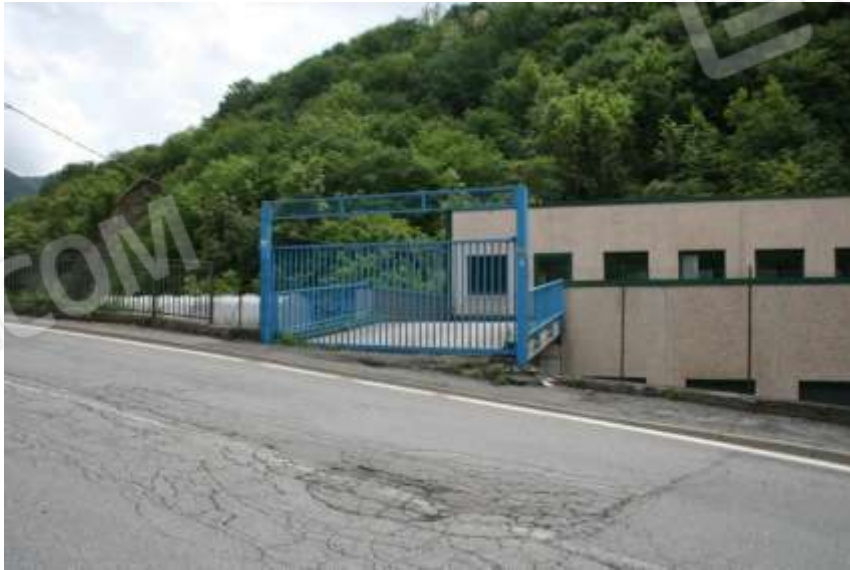
FOTOGRAFIA 05 - ACCESSO VIA MAINONE CIV.52