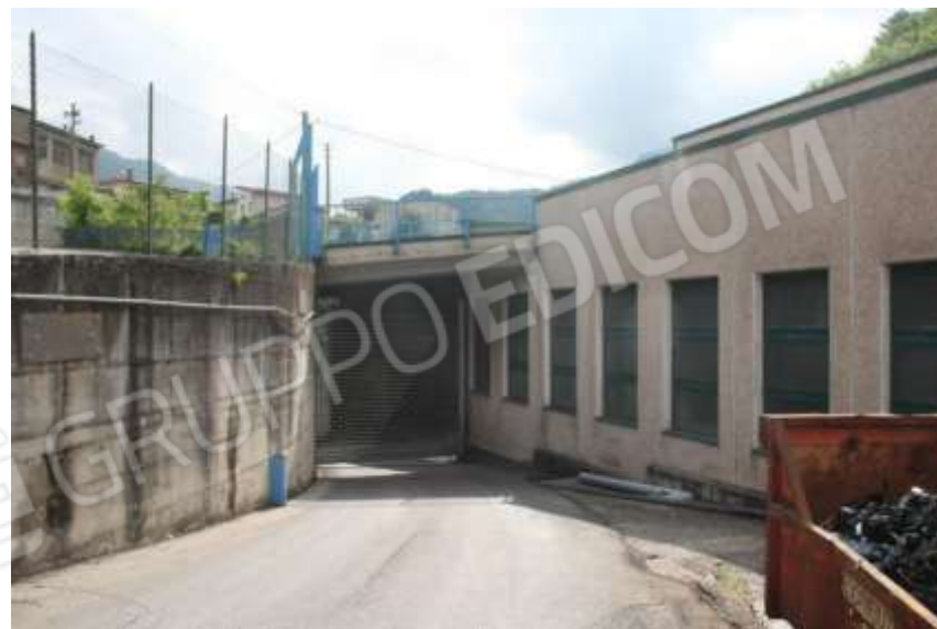
FOTOGRAFIA 02 - ACCESSO VIA MAINONE CIV.50