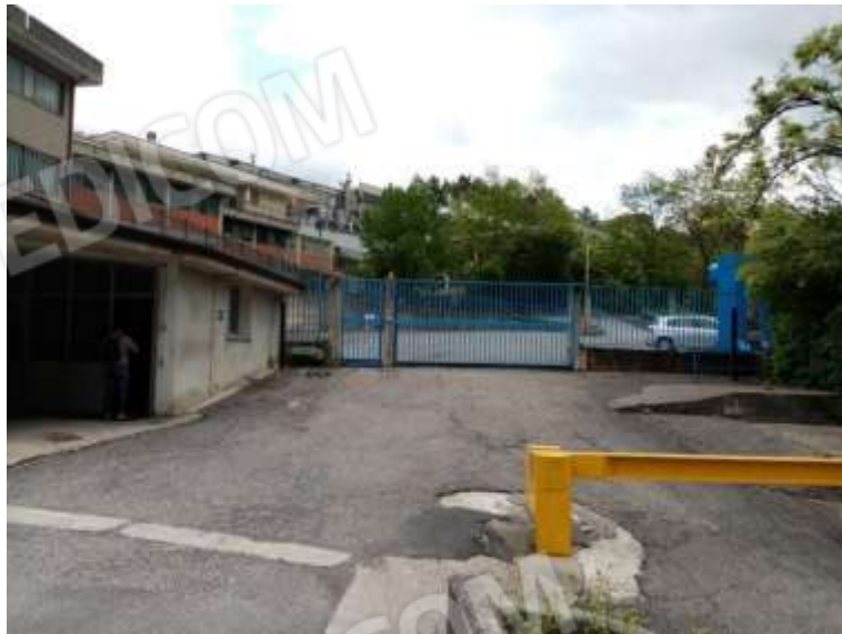
FOTOGRAFIA 15 - ACCESSO CIV. 56F