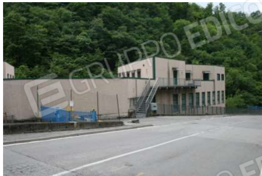
FOTOGRAFIA 04 - ACCESSO AL CIV. 48 (SCALA)