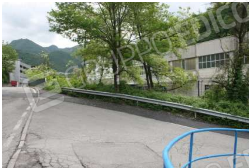
FOTOGRAFIA 12 - ATTRAVERSAMENTO SU TORRENTE GOBBIA