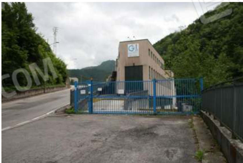
FOTOGRAFIA 01 - ACCESSO VIA MAINONE CIV.46