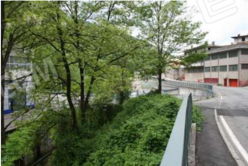
FOTOGRAFIA 13 - TERRAPIENO SU TORRENTE GOBBIA