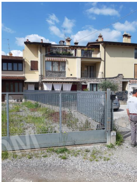
PROSPETTO FRONTE SUD