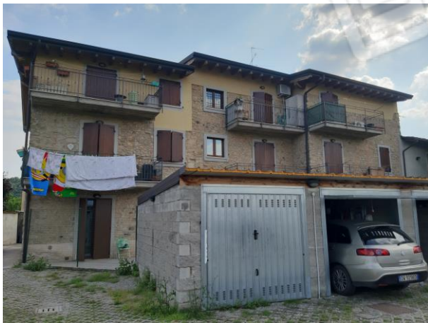
PROSPETTO FRONTE NORD CON AUTORIMESSE