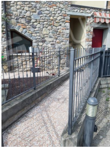
VIALE CONDOMINIALE A SUD