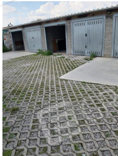
AUTORIMESSA MAPP. 89 SUB. 18