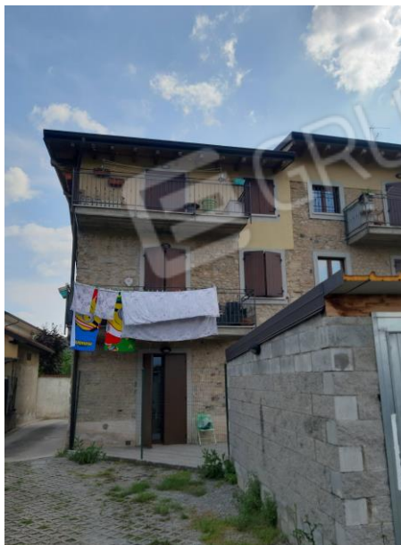
PROSPETTO FRONTE NORD