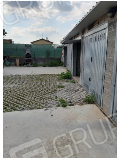
AUTORIMESSA MAPP. 89 SUB. 18