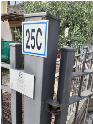
INGRESSO PEDONALE A SUD