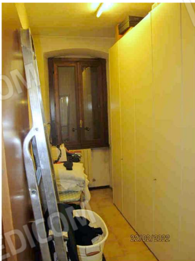
Immagine 28 –Lotto 2 – Sub. 19 - Ripostiglio