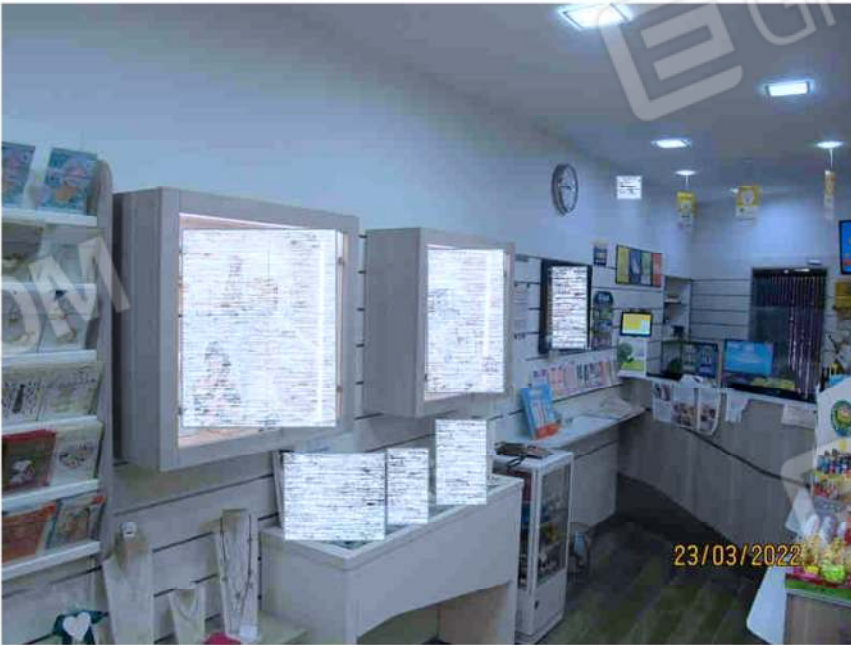
Immagine 8 -Lotto 1 - Interno