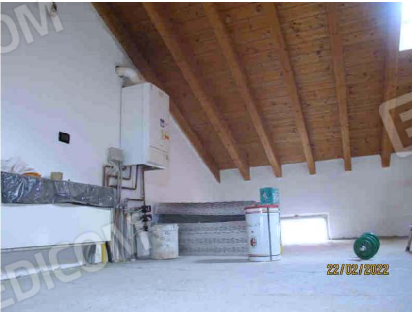
Immagine 38 - Lotto 2 – Sub. 19 – Sottotetto