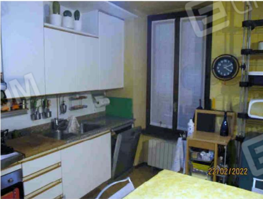
Immagine 26 – Lotto 2 – Sub.15 – Interno - Cucina