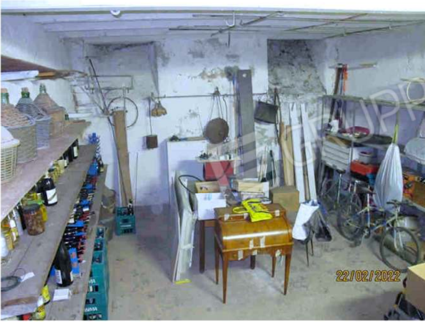
Immagine 41 – Lotto 2 – Sub.15 – Cantina