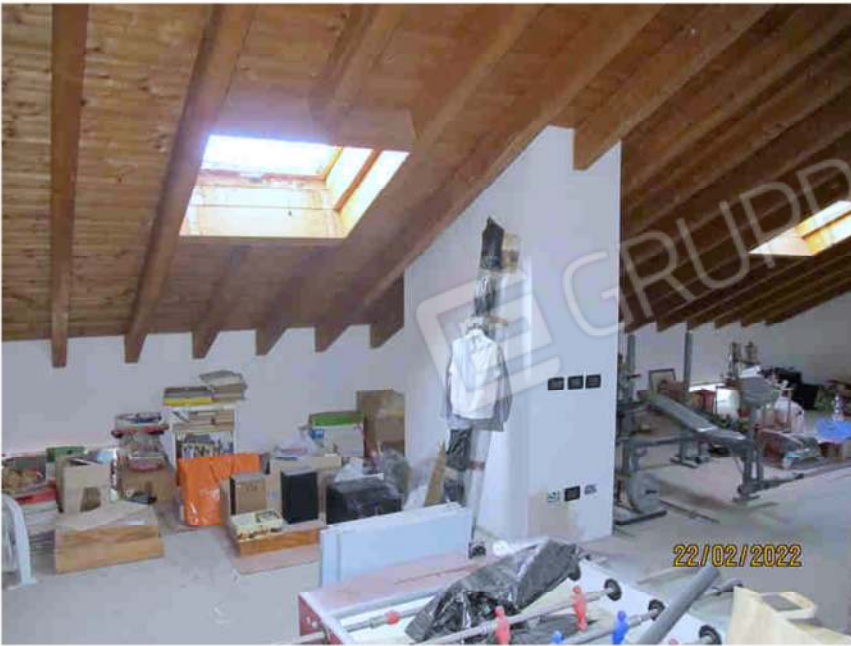
Immagine 39 – Lotto 2 – Sub. 19 – Scala retrattile accesso Sottotetto