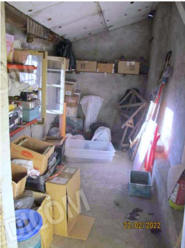
Immagine 20 – Lotto 2 – Sub.15 – Ripostiglio esterno piano Primo - Interno