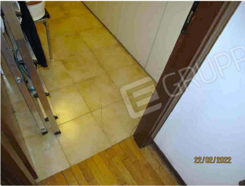
Immagine 35 – Lotto 2 – Sub. 19 – Pavimentazioni