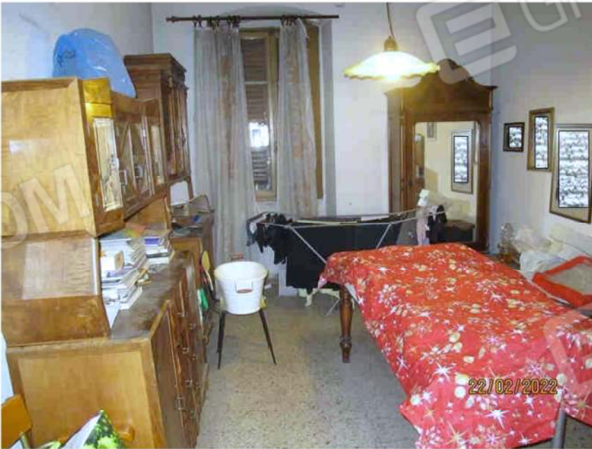
Immagine 48 – Lotto 3 – Sub.18 – Interno