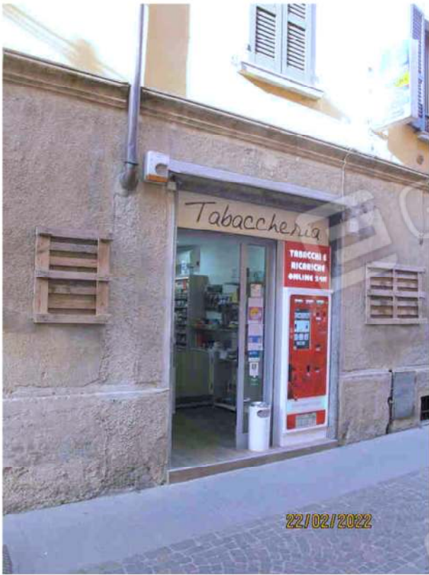
Immagine 5 –Lotto 1 – Affaccio su via San Martino