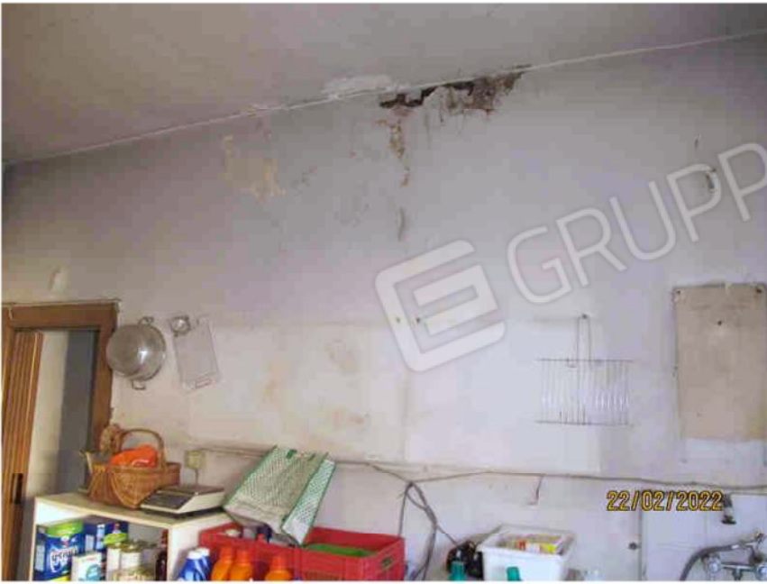
Immagine 47 – Lotto 3 – Sub.18 – Interno