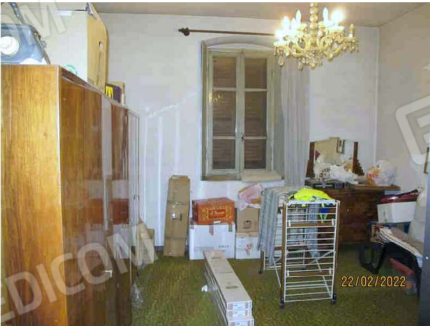
Immagine 50 – Lotto 3 – Sub.18 – Interno