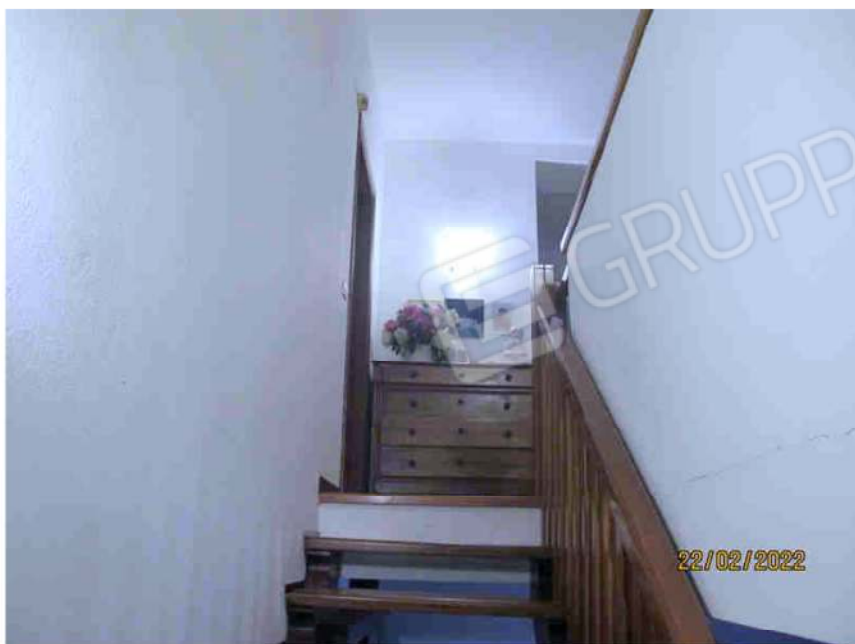
Immagine 27 –Lotto 2 – Scale interne accesso da sub. 15 a Sub. 19