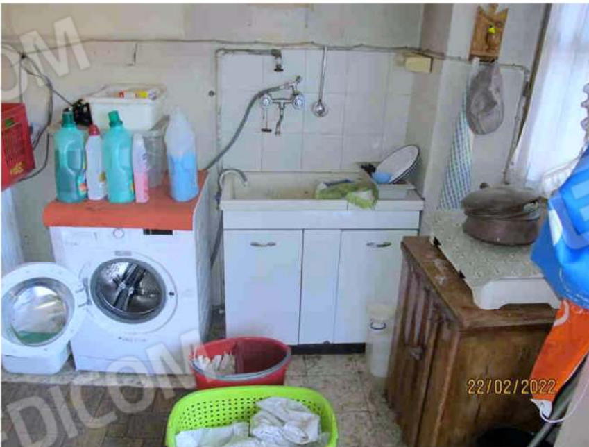
Immagine 46 – Lotto 3 – Sub.18 – Interno