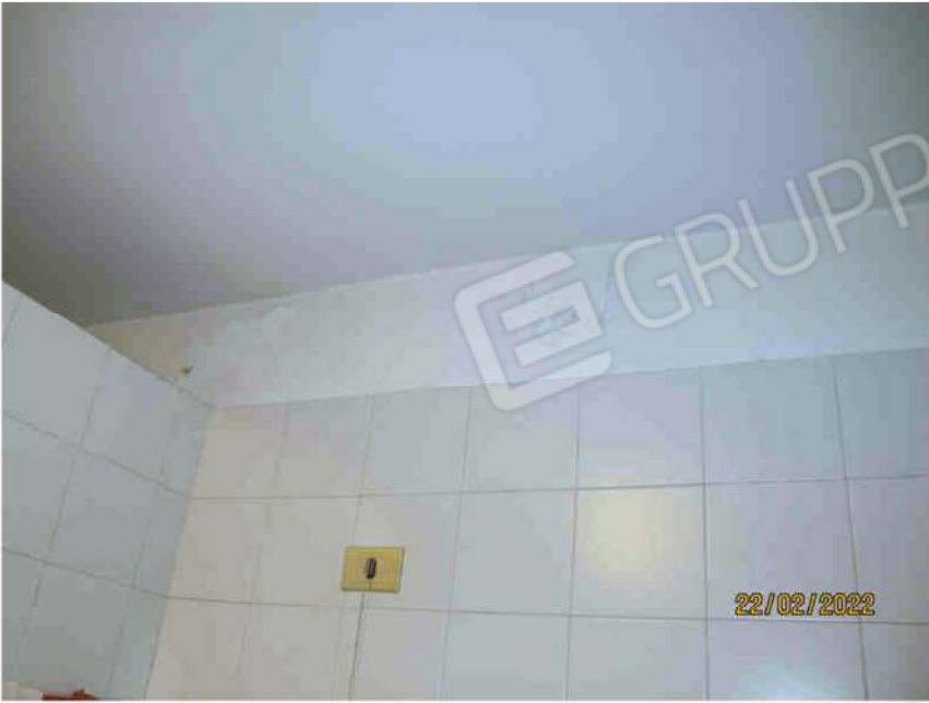
Immagine 33 – Lotto 2 – Sub. 19 – Bagno - Particolare