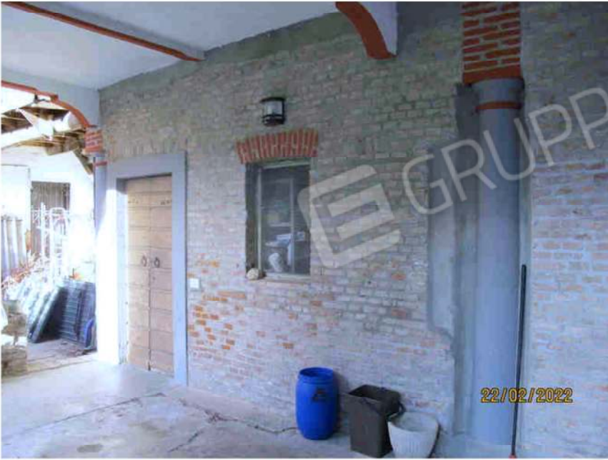
Immagine 15 –Lotto 2 – Sub.15 – Ripostiglio esterno sinistro piano Terra