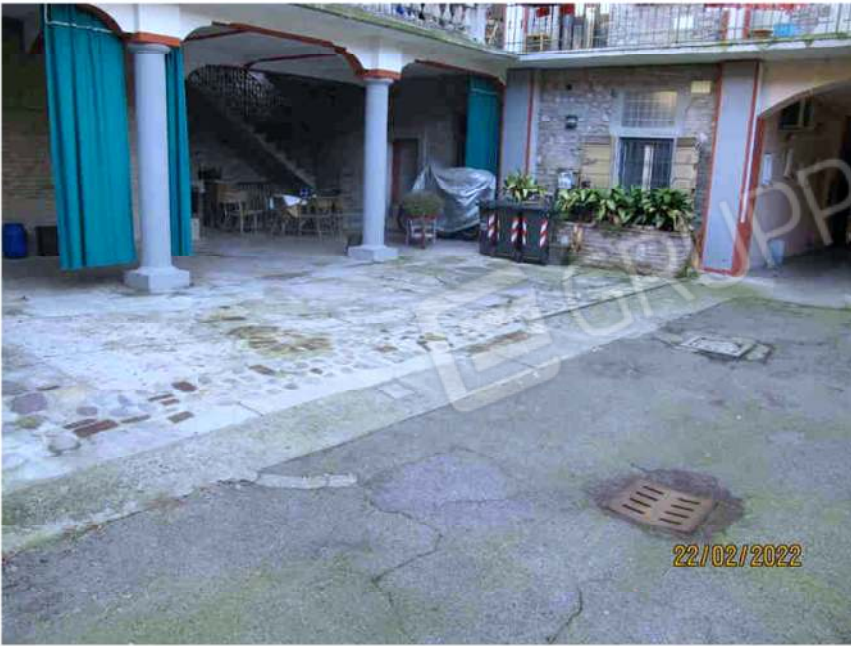
Immagine 13 – Lotto 2 – Sub. 15 - Corte Esclusiva su corte interna fabbricato