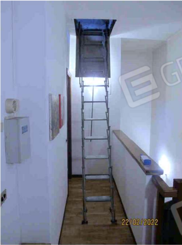
Immagine 37 – Lotto 2 – Sub. 19 – Scala retrattile accesso Sottotetto