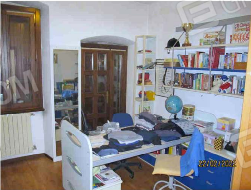
Immagine 30 – Lotto 2 – Sub. 19 – Camera