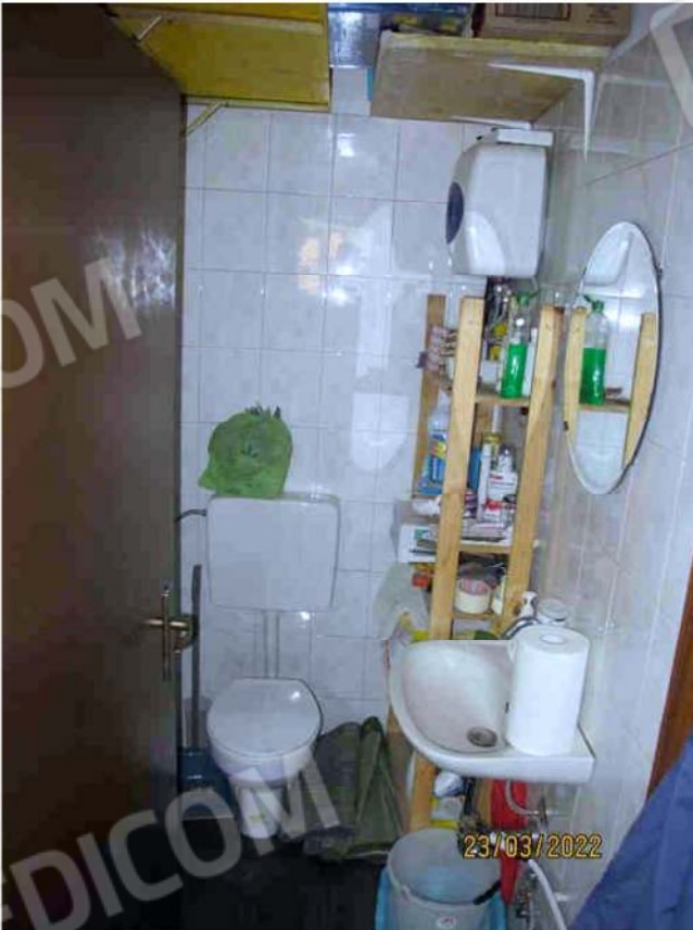
Immagine 10 -Lotto 1 - Bagno