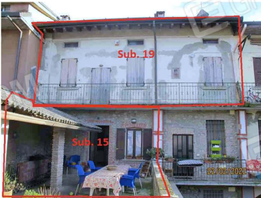
Immagine 22 – Lotto 2 – Sub.15 e 19 – Fronte Cortile con individuazione Subalterni