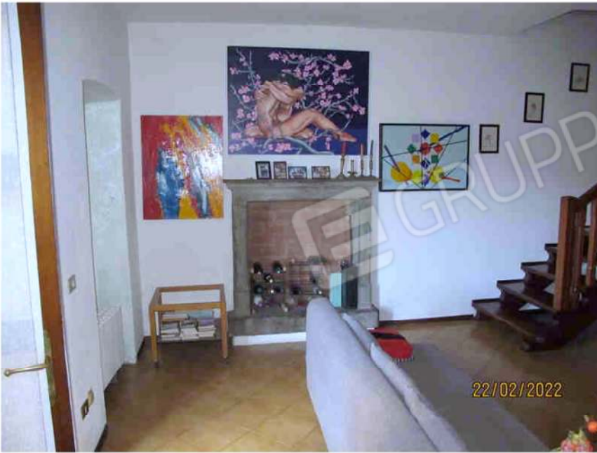
Immagine 23 – Lotto 2 – Sub.15 – Interno - Sala