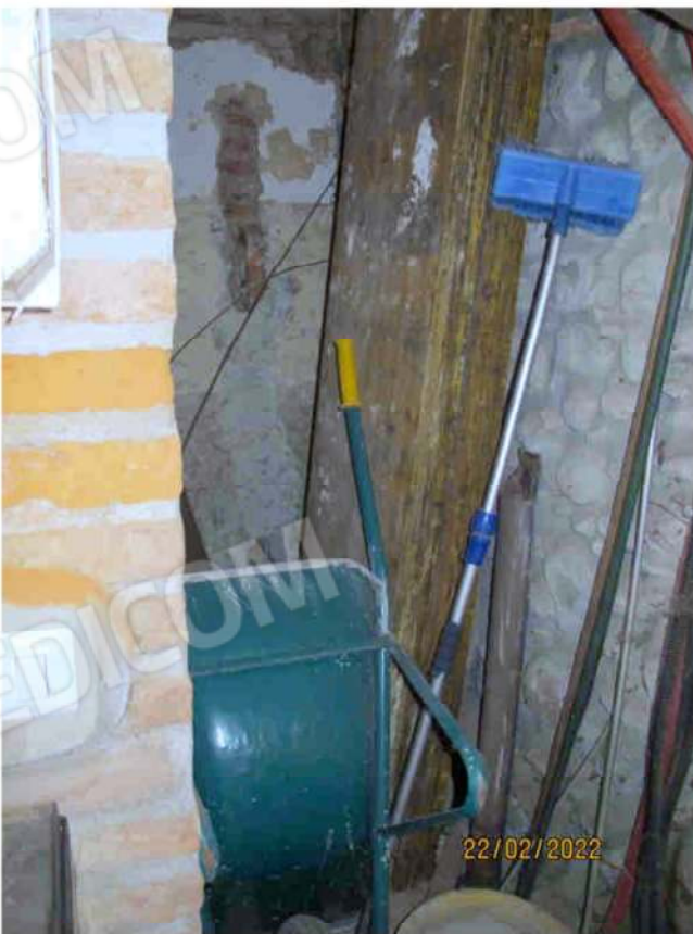
Immagine 18 – Lotto 2 – Sub.15 – Ripostiglio esterno sinistro piano Terra - Interno