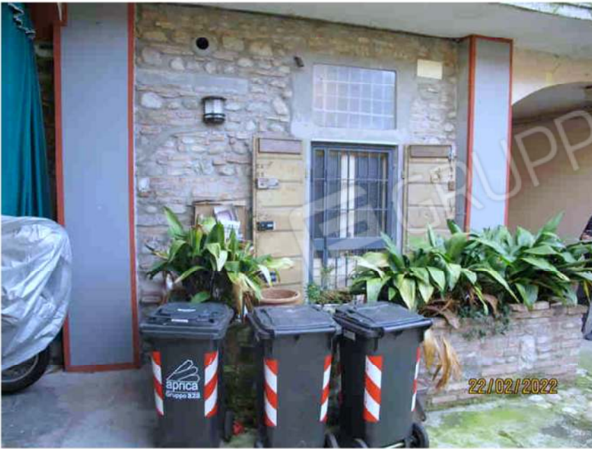
Immagine 7 -Lotto 1 – fronte su corte interna