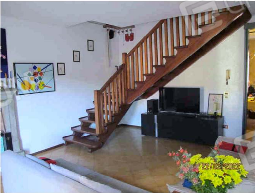
Immagine 24 – Lotto 2 – Sub.15 – Interno - Sala