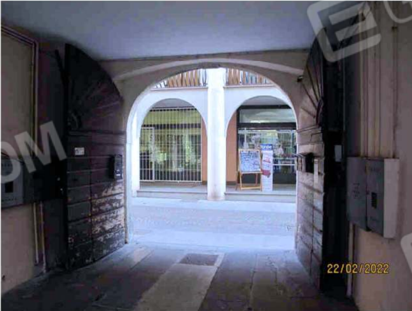
Immagine 4 – Androne Comune