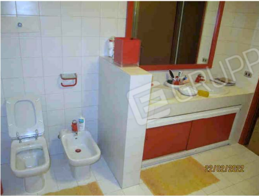
Immagine 31 – Lotto 2 – Sub. 19 - Bagno