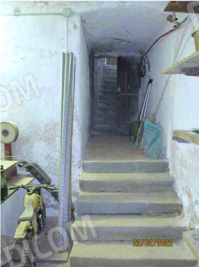
Immagine 40 – Lotto 2 – Sub.15 – Scala acceso Cantina Interrato