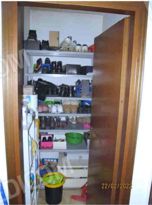
Immagine 34 – Lotto 2 – Sub. 19 - Ripostiglio