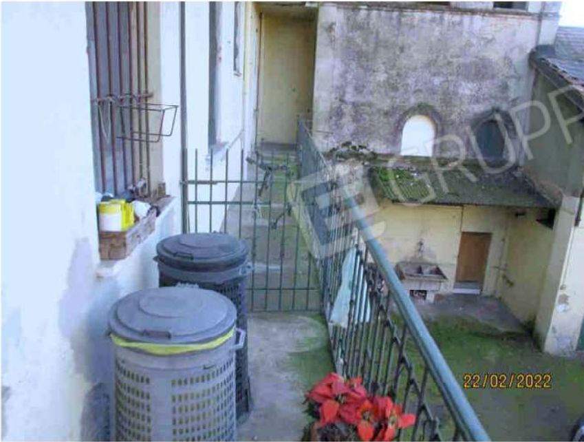
Immagine 43 – Ballatoio Comune nella Corte per accedere al bene Lotto 3 sub. 18.