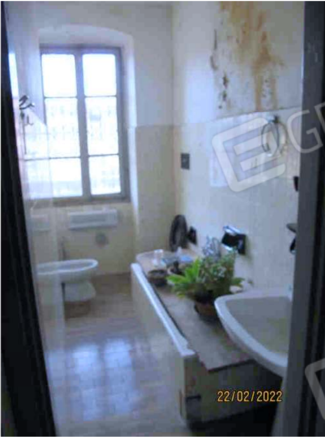
Immagine 49 – Lotto 3 – Sub.18 – Bagno