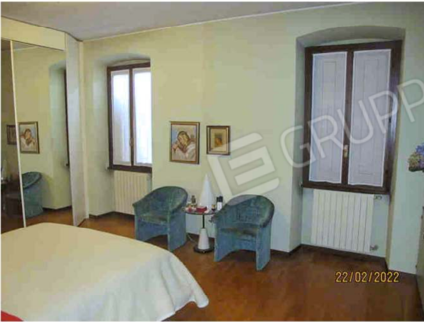
Immagine 29 – Lotto 2 – Sub. 19 - Camera