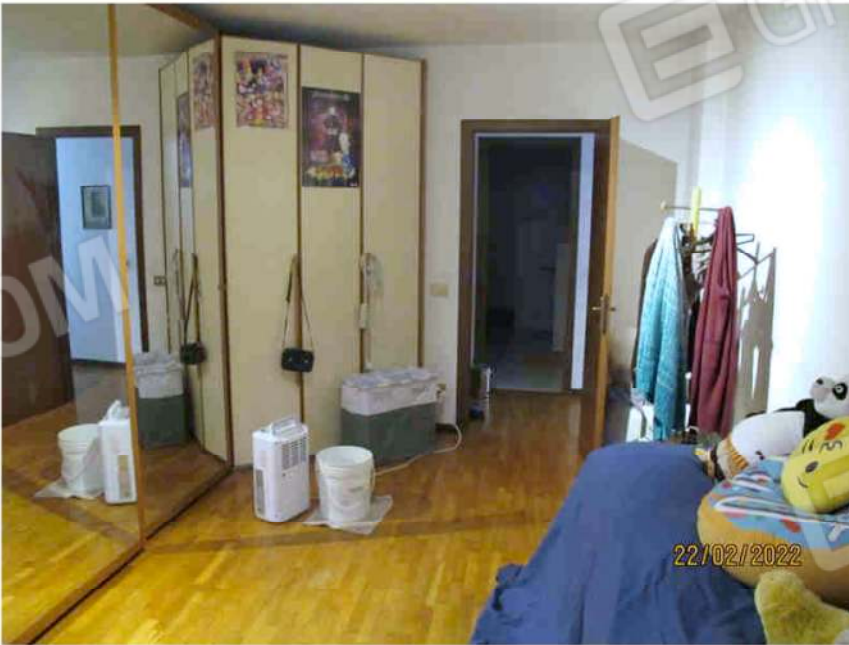
Immagine 36 – Lotto 2 – Sub. 19 – Camera