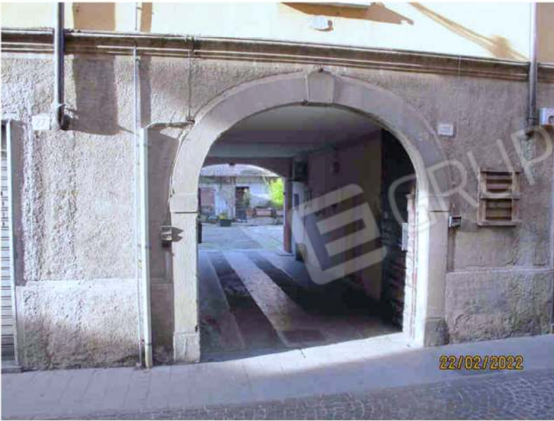
Immagine 3 – Accesso Androne Comune da via San Martino