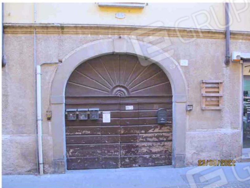
Immagine 2 – Accesso Androne Comune da via San Martino