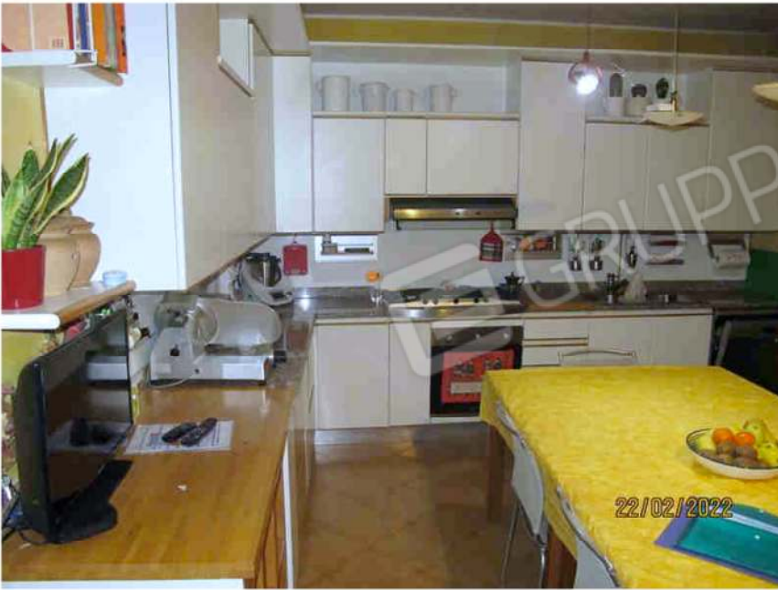
Immagine 25 – Lotto 2 – Sub.15 – Interno - Cucina