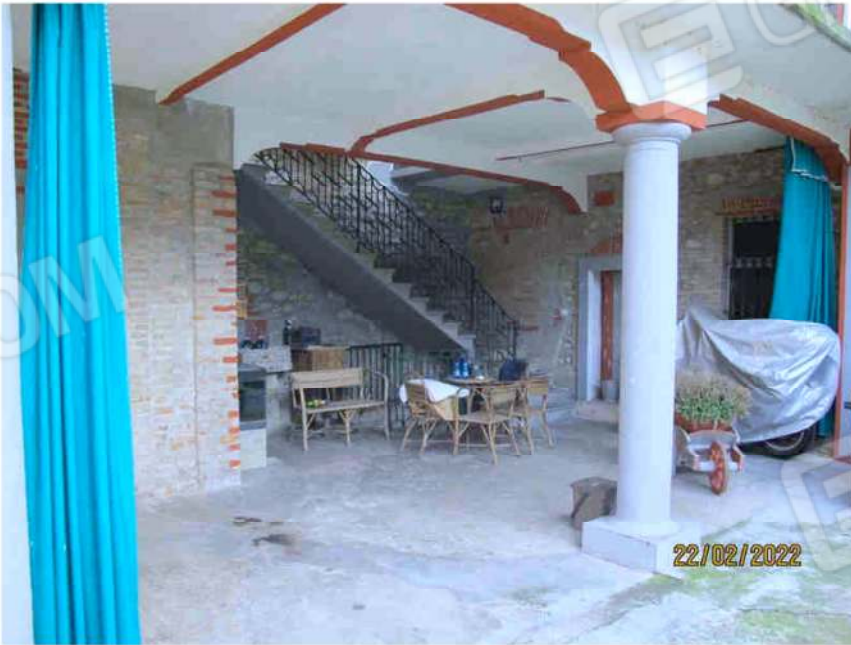
Immagine 14 –Lotto 2 – Sub. 15 - Porticato Piano Terra