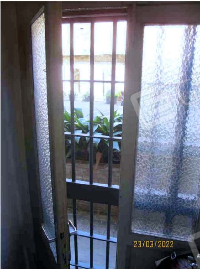
Immagine 11 –Lotto 1 – Affaccio su corte interna