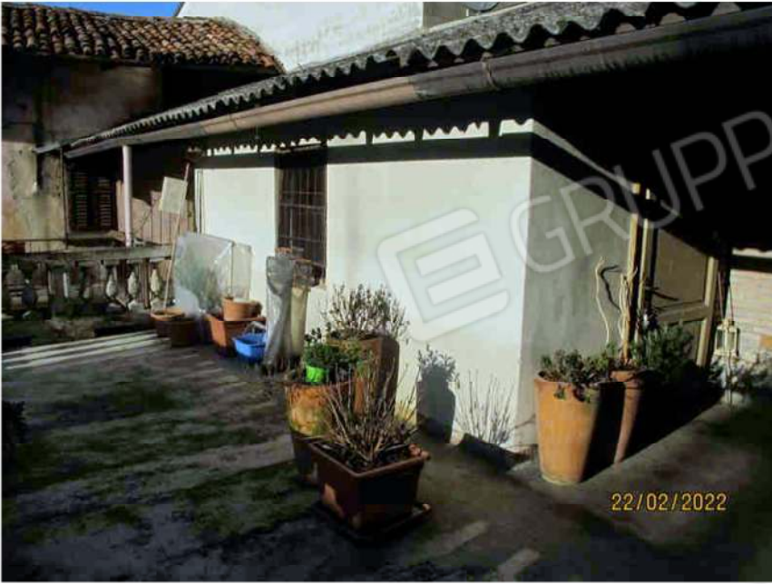
Immagine 19 – Lotto 2 – Sub.15 – Ripostiglio esterno piano Primo - Interno