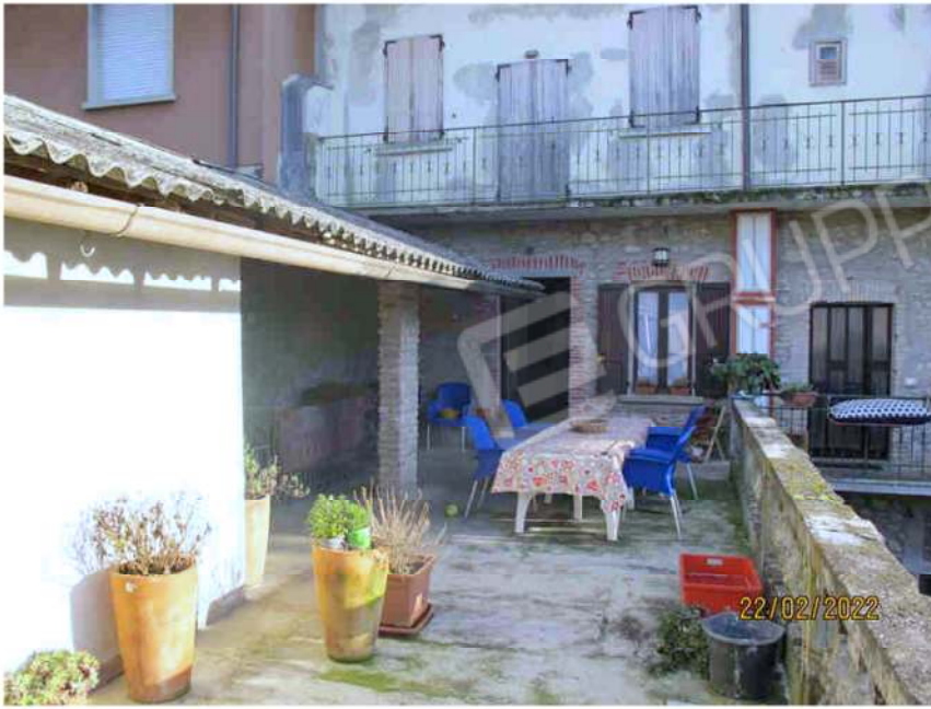
Immagine 21 – Lotto 2 – Sub.15 – Terrazza piano Primo