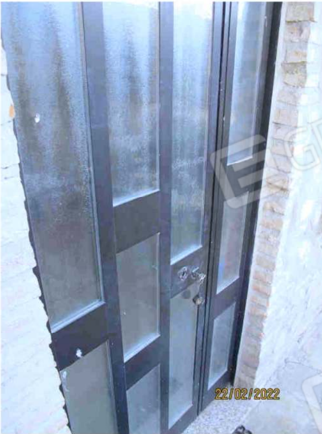
Immagine 45 – Lotto 3 – Sub.18 – Porta entrata unità