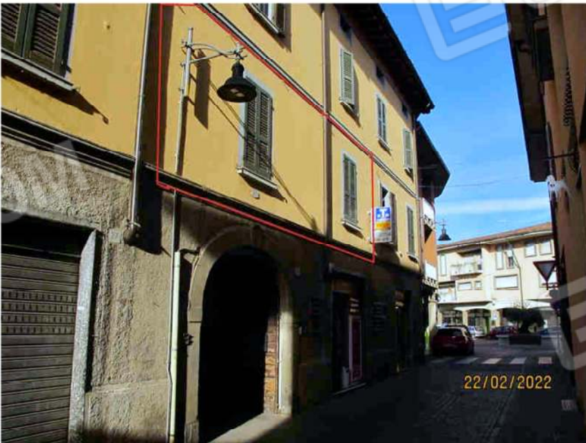
Immagine 54 – Lotto 3 – Sub.18 – Fronte su via San Martino