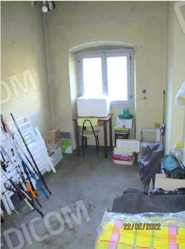
Immagine 52 – Lotto 3 – Sub.18 – Interno