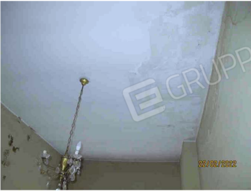
Immagine 51 – Lotto 3 – Sub.18 – Soffitto