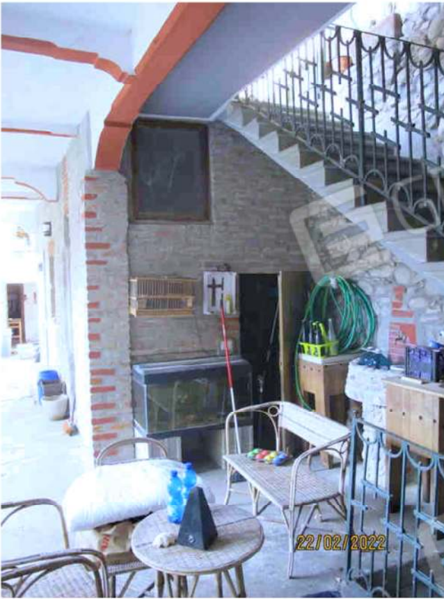
Immagine 17 – Lotto 2 – Sub.15 – Ripostiglio esterno destro piano Terra