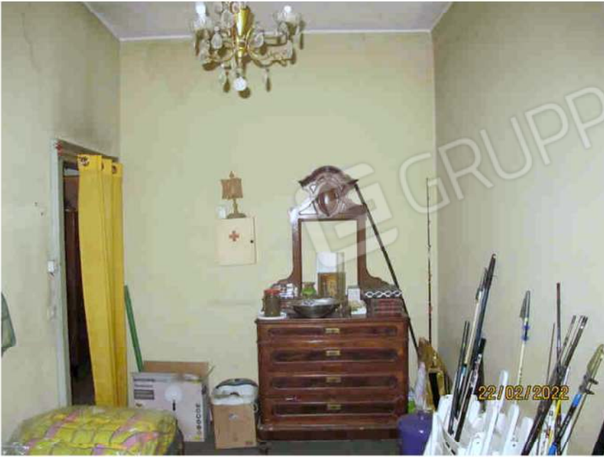
Immagine 53 – Lotto 3 – Sub.18 – Interno