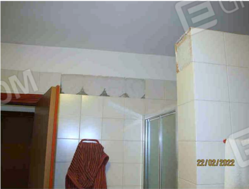
Immagine 32 – Lotto 2 – Sub. 19 – Bagno – Particolare