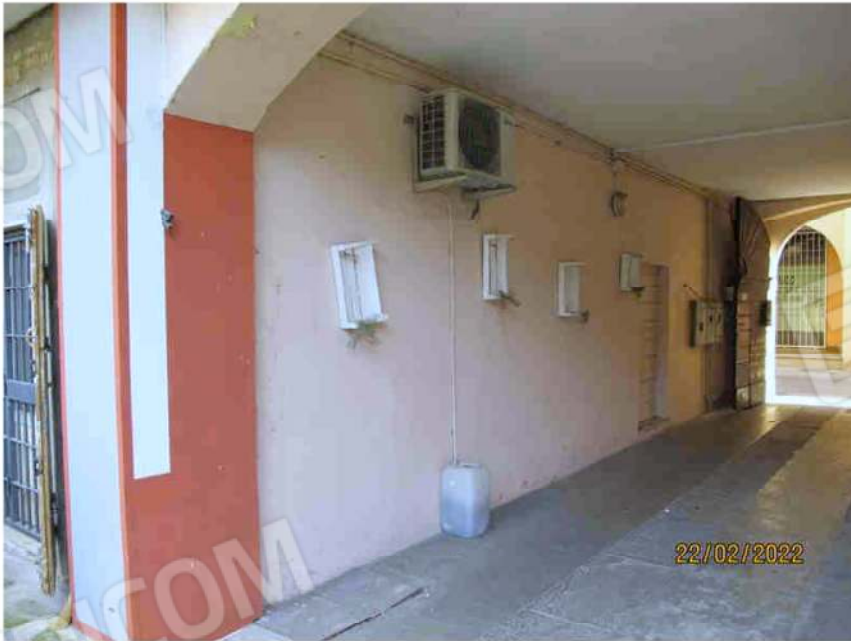
Immagine 6 –Lotto 1 – muraturasu androne comune