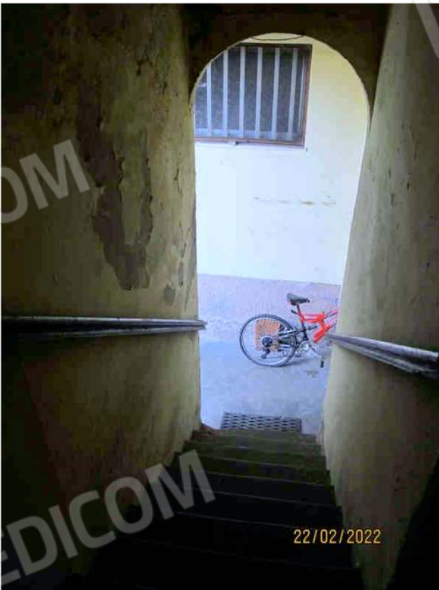
Immagine 42 – Scala comune per accesso Lotto 3 sub. 18.