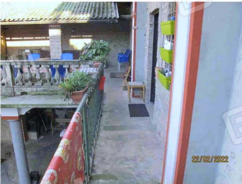
Immagine 44 – Ballatoio Comune nella Corte per accedere al bene Lotto 3 sub. 18.