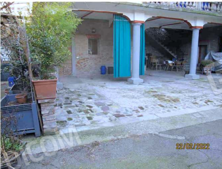
Immagine 12 –Lotto 2 – Sub. 15 - Corte Esclusiva su corte interna fabbricato