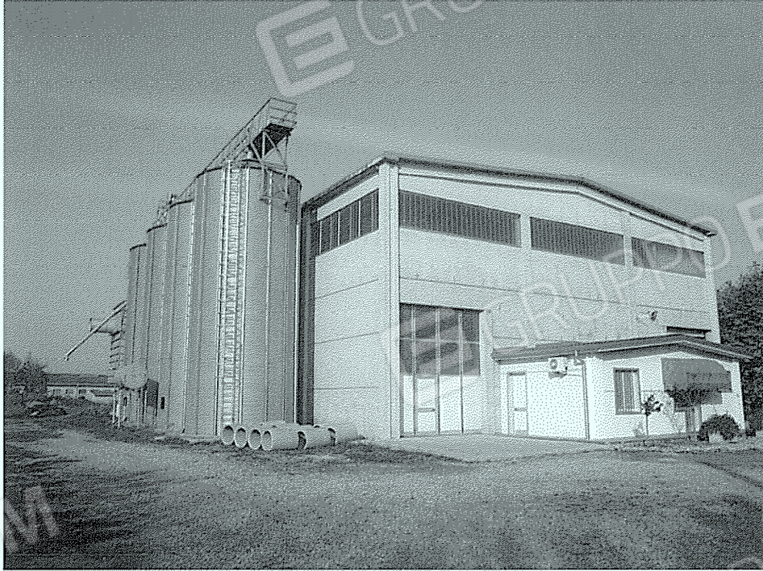
Corpo "1": mangificio