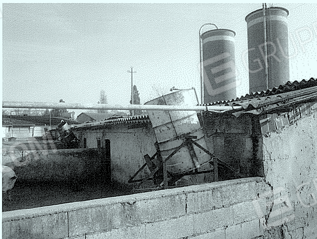
Corpo "8": zona stimolazione