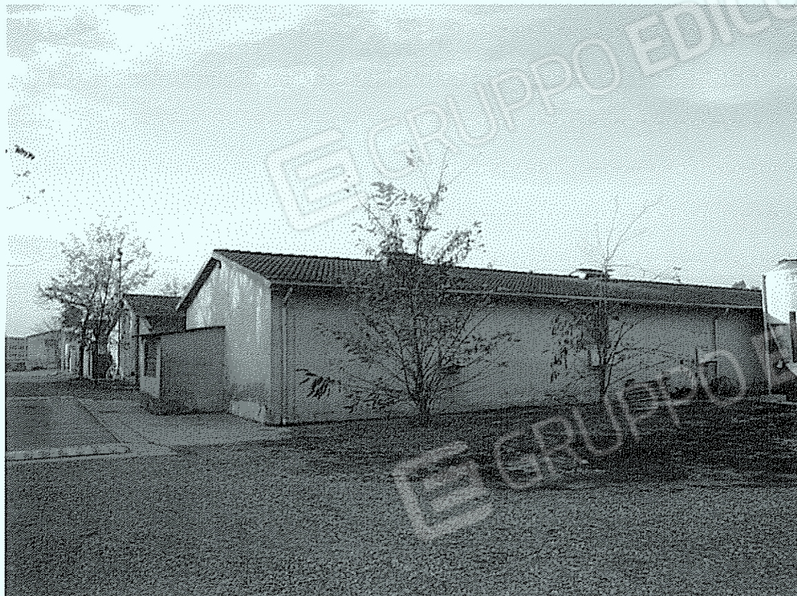
Corpi "3-4": scrofaie