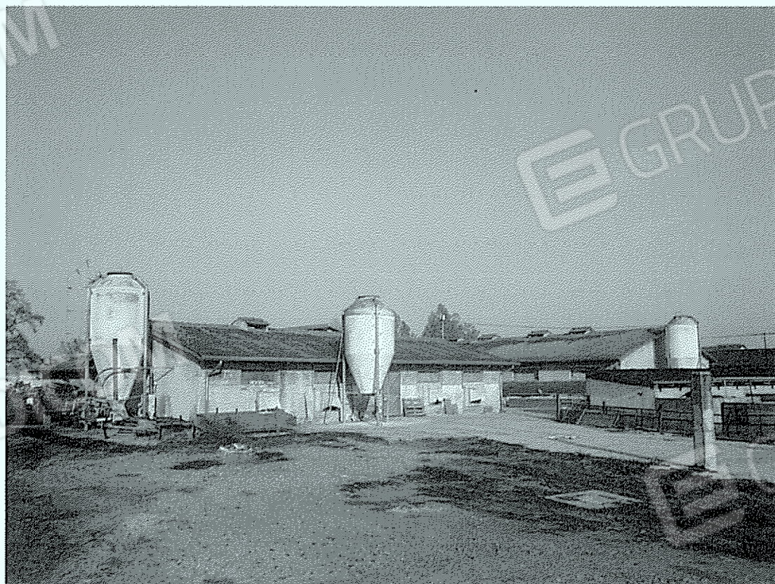
Corpo "7" (sulla sinistra), e Corpi "6" e "9" (sulla destra)