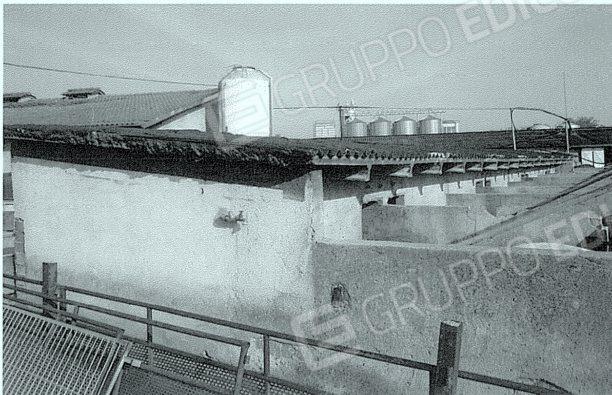
Corpo "9": zona stimolazione