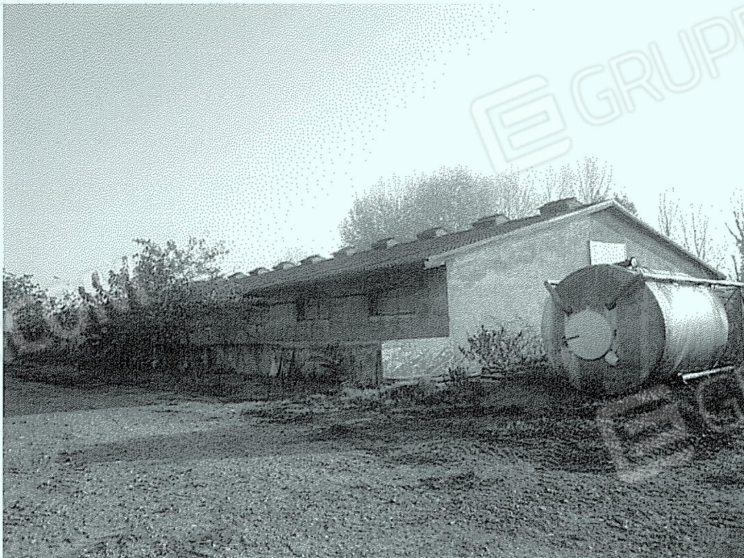
Corpo "11": ingresso