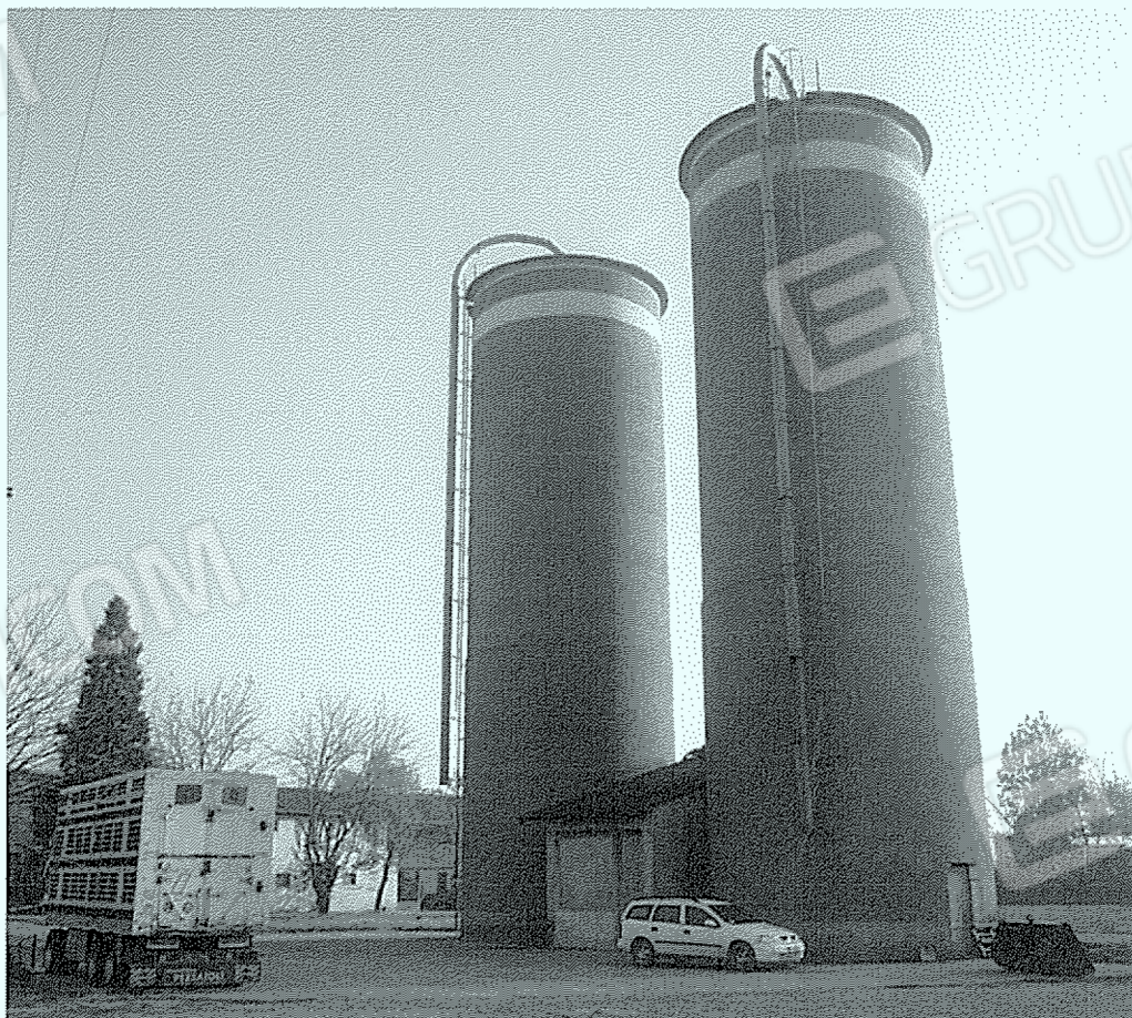
Corpo "14": silos e locale tecnico.