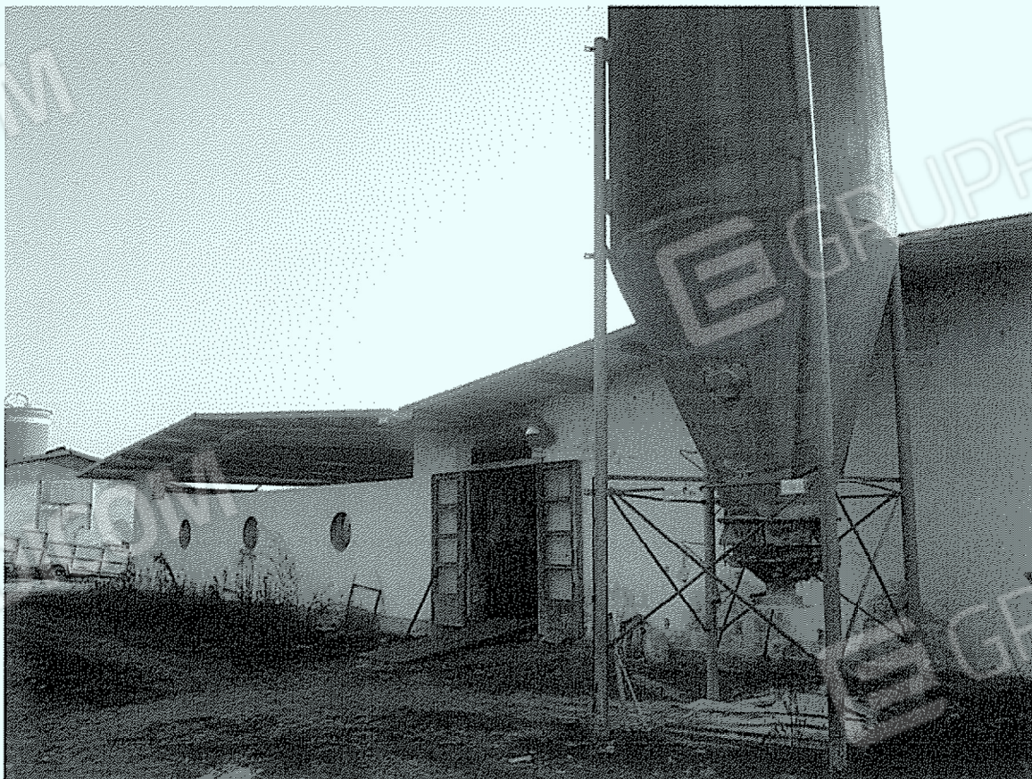
Corpo "12": svezamento e deposito attrezzi