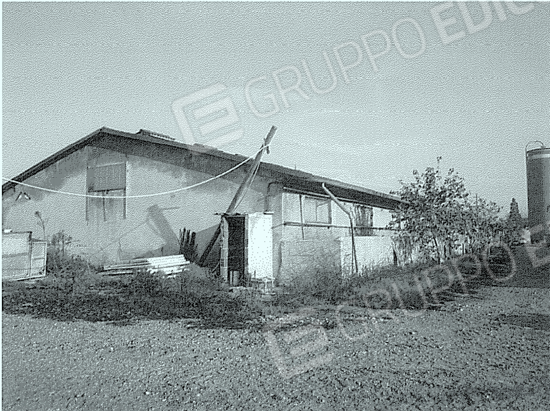
Corpo "10": ingresso