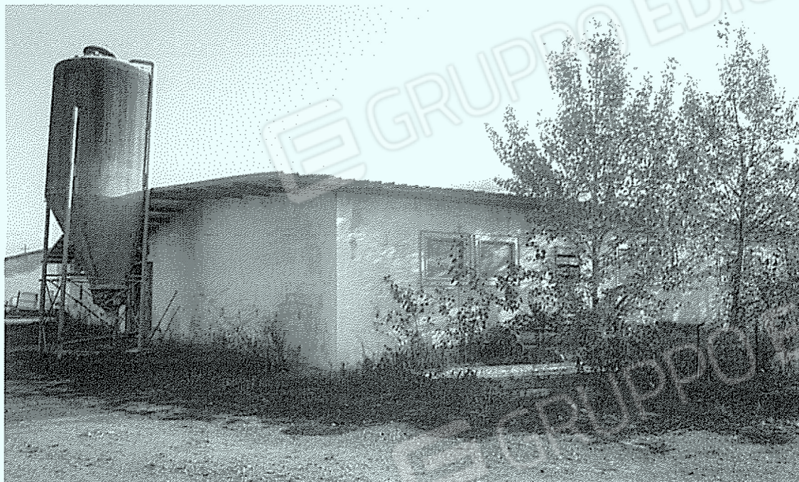
Corpo "12": svezamento e deposito attrezzi