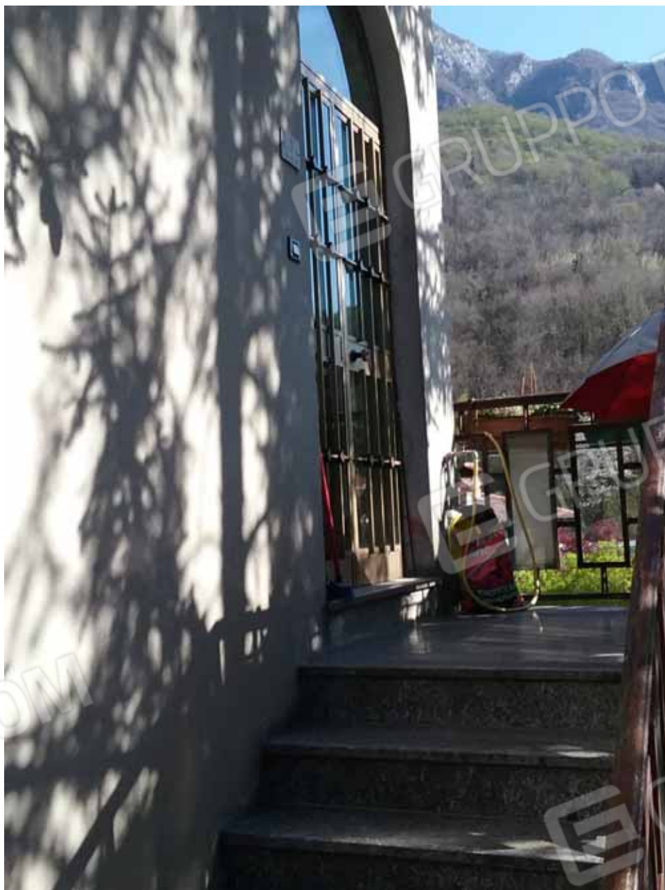
FOTO 21: Accesso all' unità abitativa al piano rialzato – LOTTO n. 7