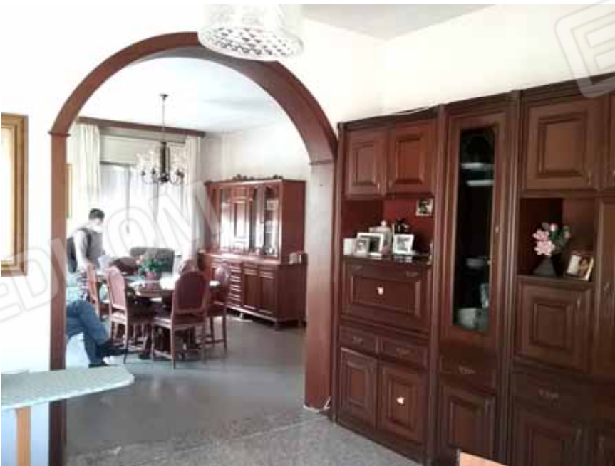
FOTO 56: Soggiorno e sala dell' unità abitativa al piano rialzato, censita alla sezione Urbana NCT, fg. 10, mapp. 231 sub 12 – LOTTO n. 7