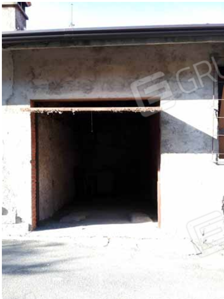
FOTO 3: Accesso all' autorimessa da via Villa Mattina – LOTTO n. 6