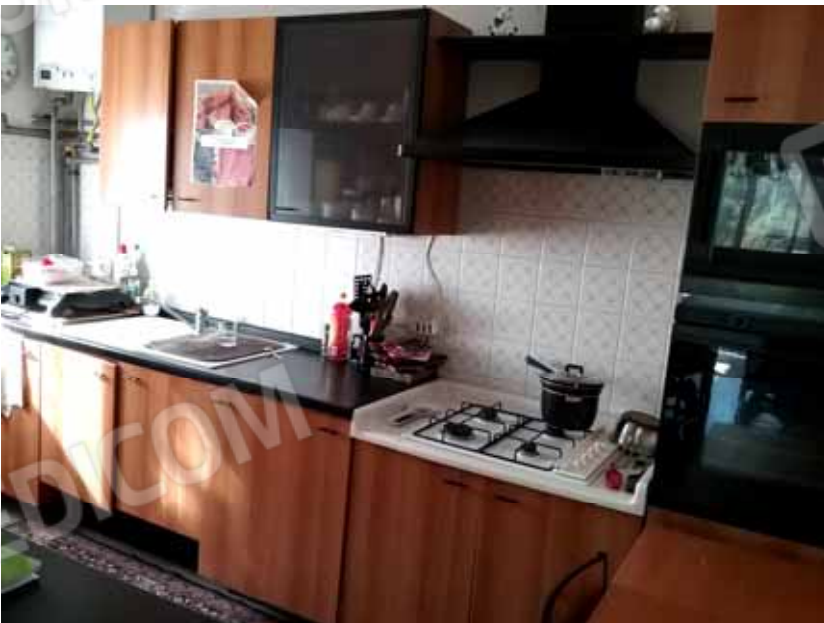
FOTO 58: Cucina dell' unità abitativa al piano rialzato, censita alla sezione Urbana NCT, fg. 10, mapp. 231 sub 12 – LOTTO n. 7