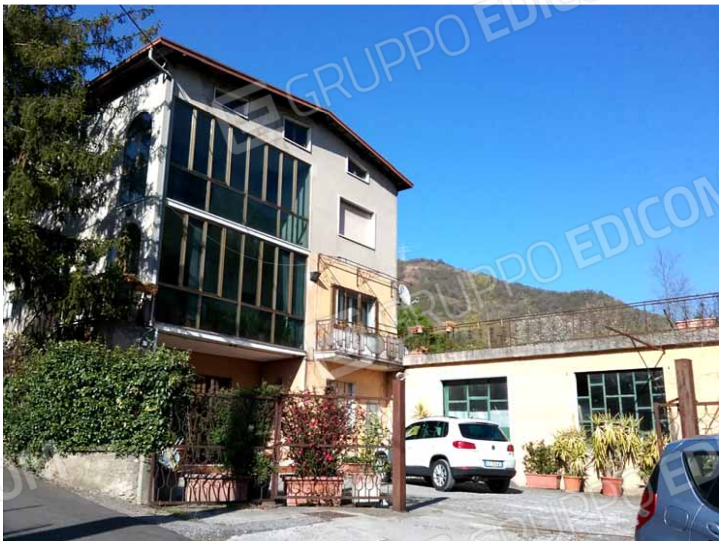
FOTO 17: Accesso carraio alla corte comune da via Tolzana - LOTTO n. 7