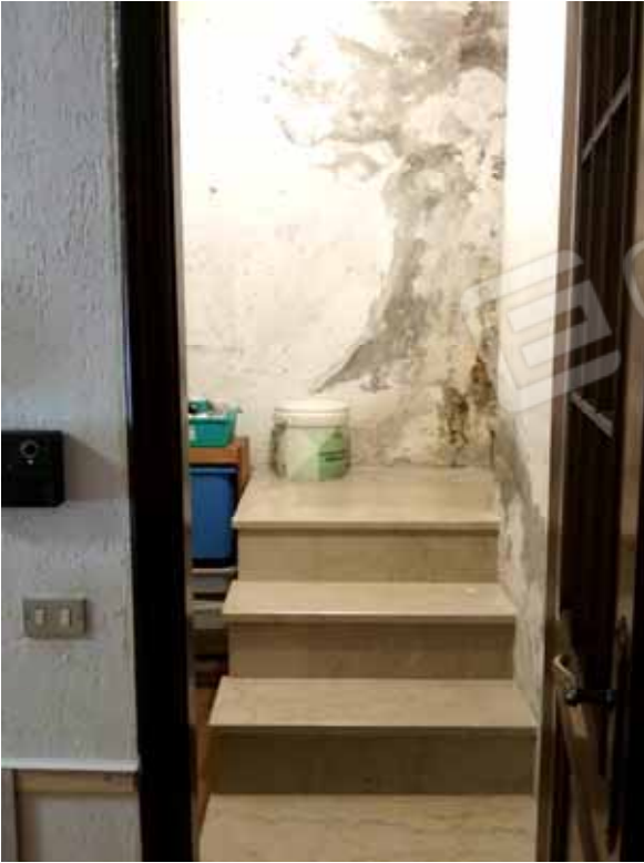
FOTO 38: scala interna di collegamento tra l'unità abitativa del piano seminterrato censita alla sezione Urbana NCT, fg. 10, mapp. 231 sub 15 e l'appartamento al piano rialzato censito alla sezione Urbana NCT, fg. 10, mapp. 231 sub 12 – LOTTO n. 7