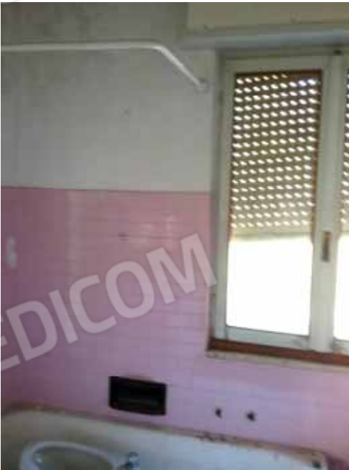
FOTO 70: Bagno non funzionante dell' unità abitativa ubicata al primo piano e censita alla sezione Urbana NCT, fg. 10, mapp. 231 sub 3– LOTTO n. 7