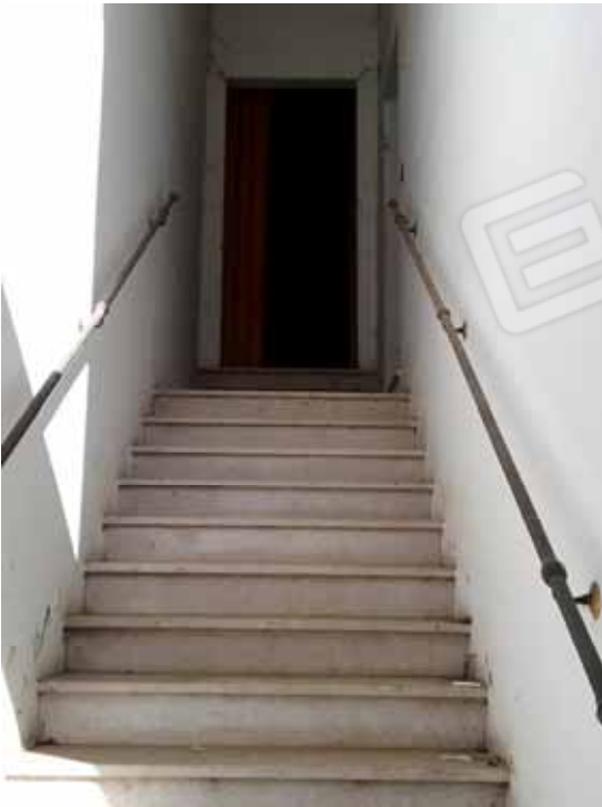
FOTO 69: Scala interna di accesso alle due unità abitative ubicate al primo piano e censite alla sezione Urbana NCT, fg. 10, mapp. 231 sub 3 e 13 – LOTTO n. 7