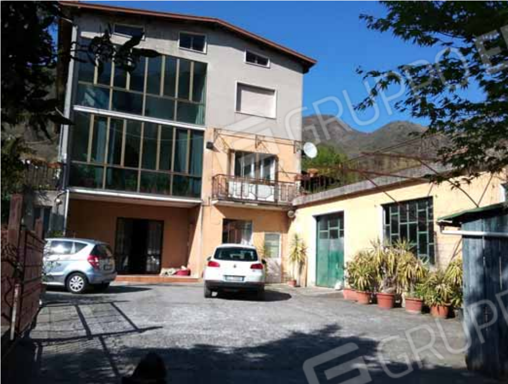
FOTO 42: Laboratorio dismesso – deposito ubicato nel piano seminterrato attiguo al corpo di fabbrica principale, accessibile dalla corte comune e censito alla sezione Urbana NCT, fg. 10, mapp. 231 sub 14 – LOTTO n. 7