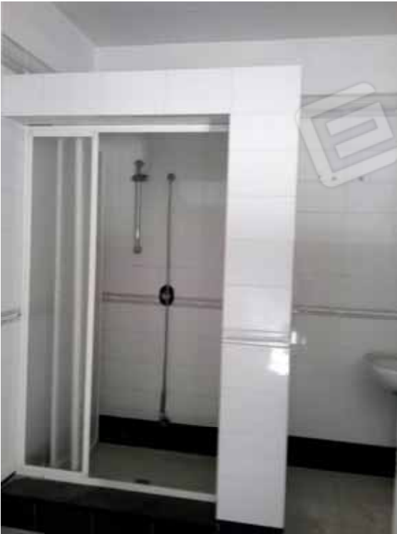
FOTO 76: angolo doccia dell' unità abitativa ubicata al primo piano e censita alla sezione Urbana NCT, fg. 10, mapp. 231 sub 13 – LOTTO n. 7