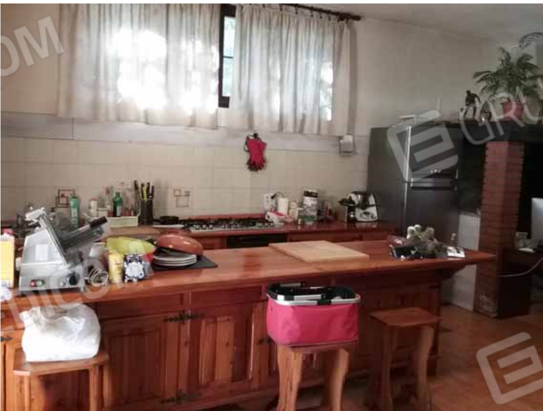
FOTO 34: Dettaglio dell'angolo cottura dell'unità abitativa del piano seminterrato censita alla sezione Urbana NCT, fg. 10, mapp. 231 sub 15 – LOTTO n. 7