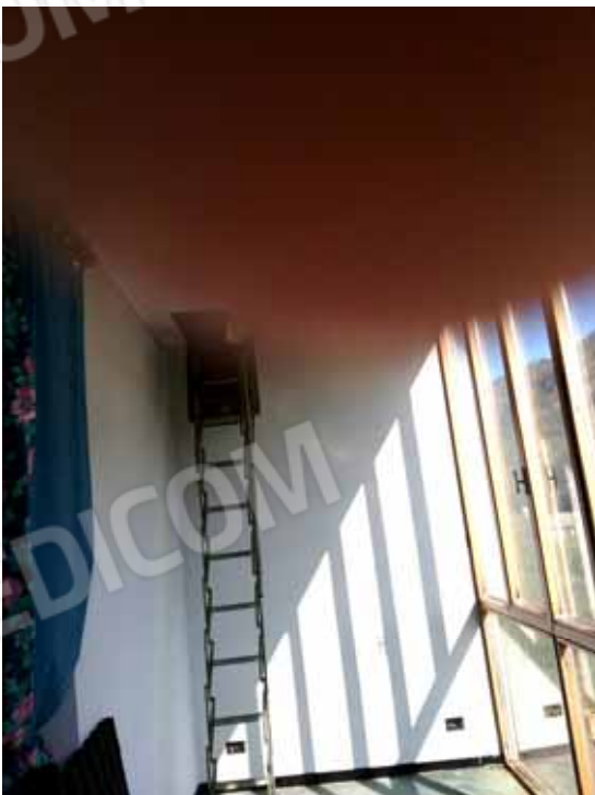
FOTO 79: Scala retrattile instabile di accesso al sottotetto ubicata nella veranda dell' unità abitativa ubicata al primo piano e censita alla sezione Urbana NCT, fg. 10, mapp. 231 sub 13 – LOTTO n. 7