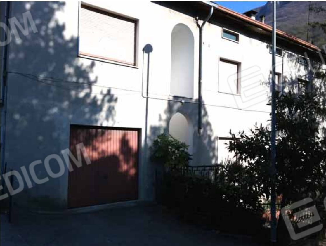
FOTO 29: Veduta dell' autorimessa e relativa corte comune con accesso da via Tolzana - LOTTO n. 7