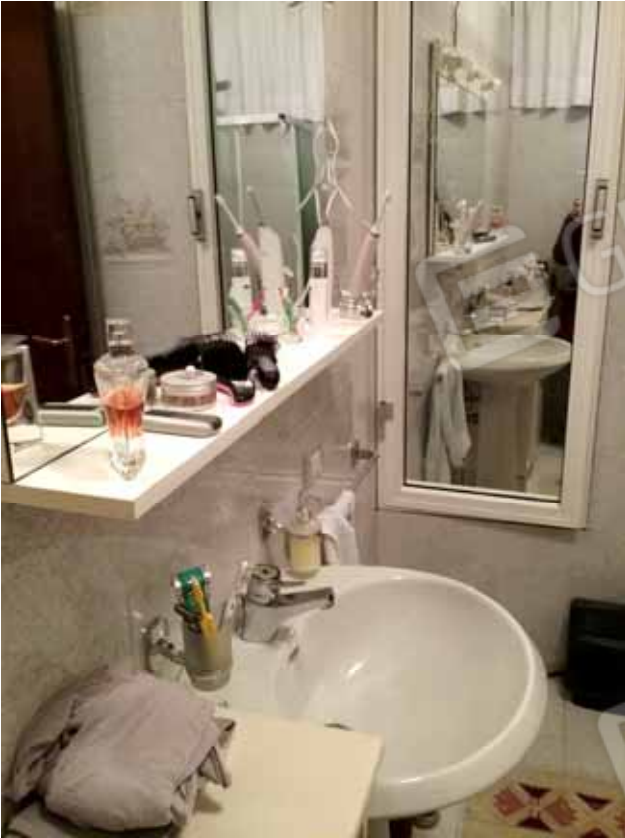
FOTO 36: bagno dell'unità abitativa del piano seminterrato censita alla sezione Urbana NCT, fg. 10, mapp. 231 sub 15 – LOTTO n. 7