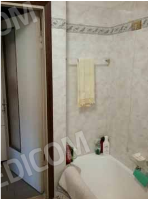
FOTO 62: Particolare del bagno e delle finiture dell' alloggio al piano rialzato censito alla sezione Urbana NCT, fg. 10, mapp. 231 sub 12 – LOTTO n. 7