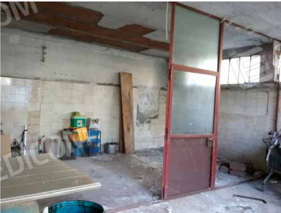
FOTO 45: Altro interno attestante lo stato di degrado del laboratorio ubicato nel piano seminterrato e censito alla sezione Urbana NCT, fg. 10, mapp. 231 sub 14 – LOTTO n. 7