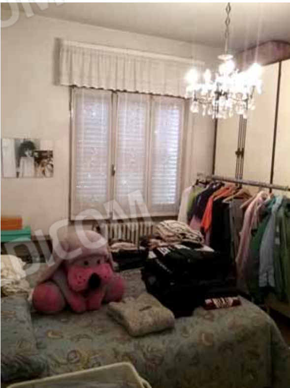
FOTO 60: Altra camera dell' unità abitativa ubicata al piano rialzato e censita alla sezione Urbana NCT, fg. 10, mapp. 231 sub 12 – LOTTO n. 7