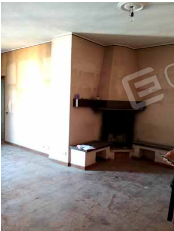
FOTO 7: Veduta interna del soggiorno con l'angolo camino – LOTTO n. 6