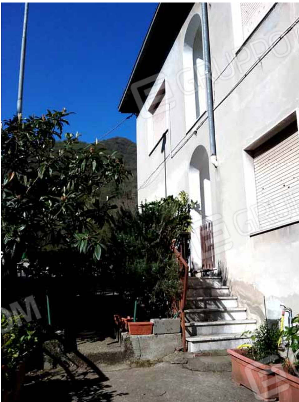
FOTO 20: Accesso ai due appartamenti ubicati al 1° piano – LOTTO n. 7