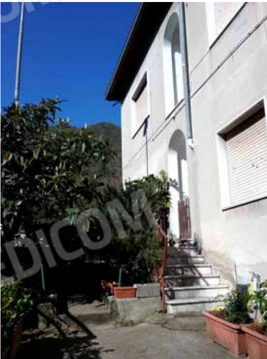
FOTO 68: Scala esterna di accesso alle due unità abitative ubicate al primo piano e censite alla sezione Urbana NCT, fg. 10, mapp. 231 sub 3 e 13 – LOTTO n. 7