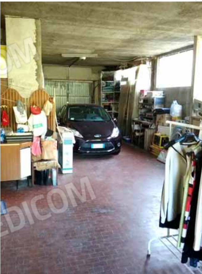
FOTO 54: Interno dell' autorimessa ubicata al piano terra, censita alla sezione Urbana NCT, fg. 10, mapp. 231 sub 7 collegata a mezzo di scala interna con le unità abitative al piano rialzato: sub 12 ed al piano seminterrato: sub 15 – LOTTO n. 7