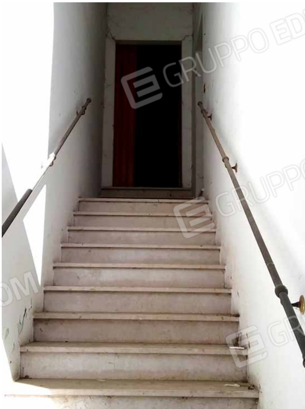
FOTO 27: Scala interna di accesso agli alloggi del piano primo - LOTTO n. 7