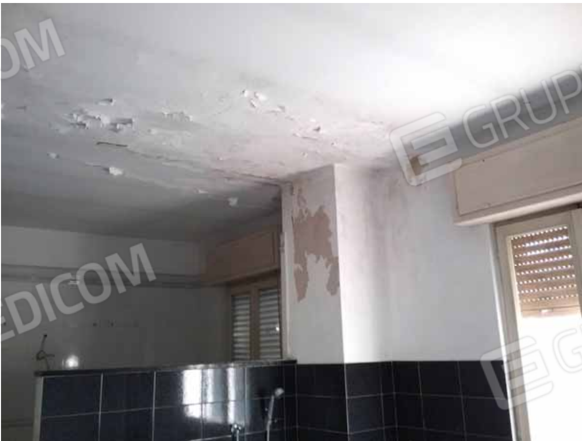
FOTO 75: Stato di degrado dell' unità abitativa ubicata al primo piano e censita alla sezione Urbana NCT, fg. 10, mapp. 231 sub 13 – LOTTO n. 7