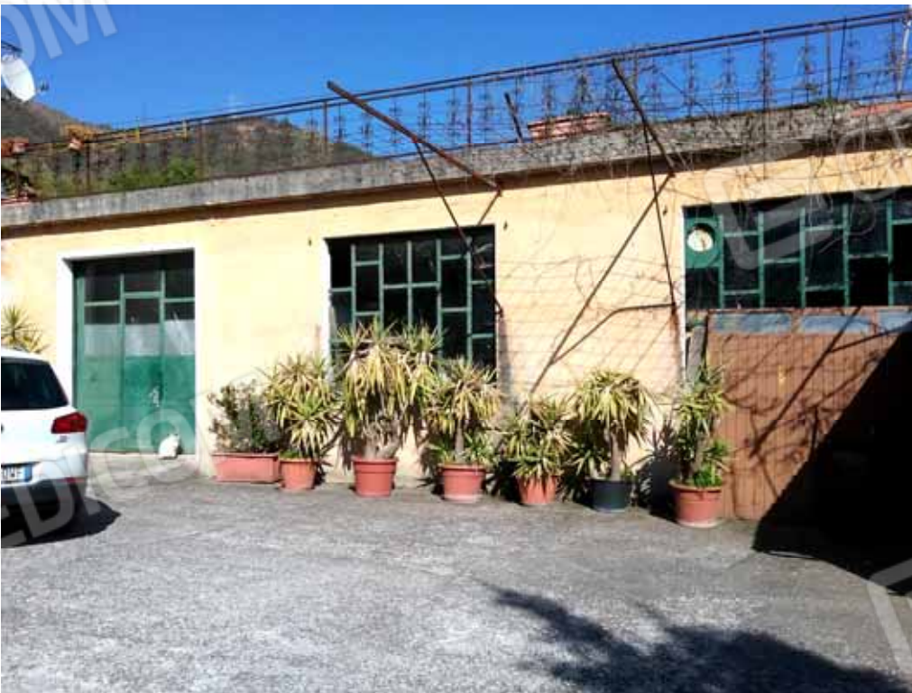
FOTO 43: Particolare del laboratorio dismesso ubicato nel piano seminterrato censito alla sezione Urbana NCT, fg. 10, mapp. 231 sub 14 – LOTTO n. 7