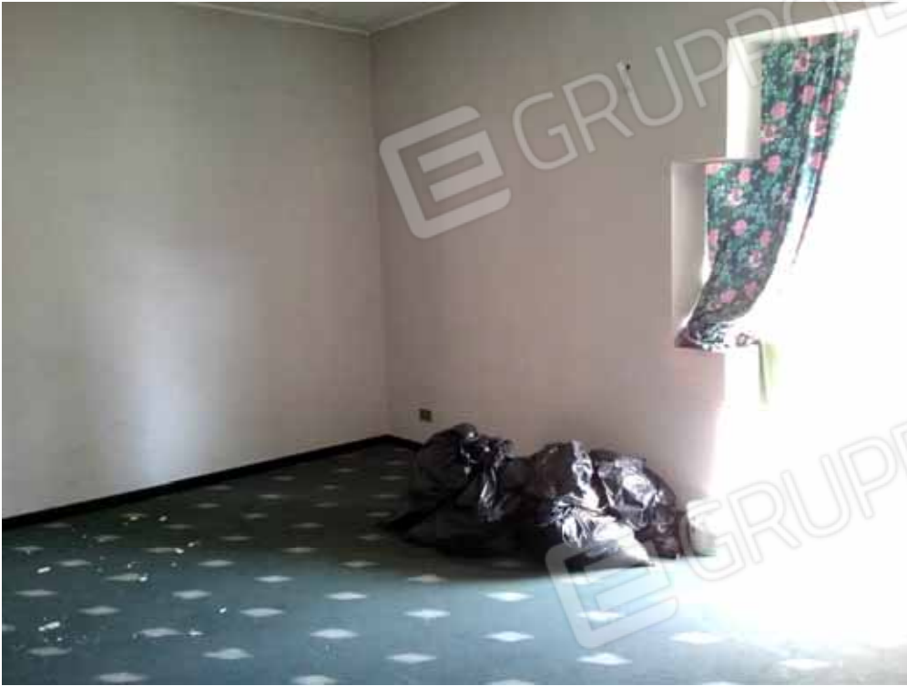
FOTO 78: Soggiorno, comunicante con la veranda: unità abitativa ubicata al primo piano e censita alla sezione Urbana NCT, fg. 10, mapp. 231 sub 13 – LOTTO n. 7