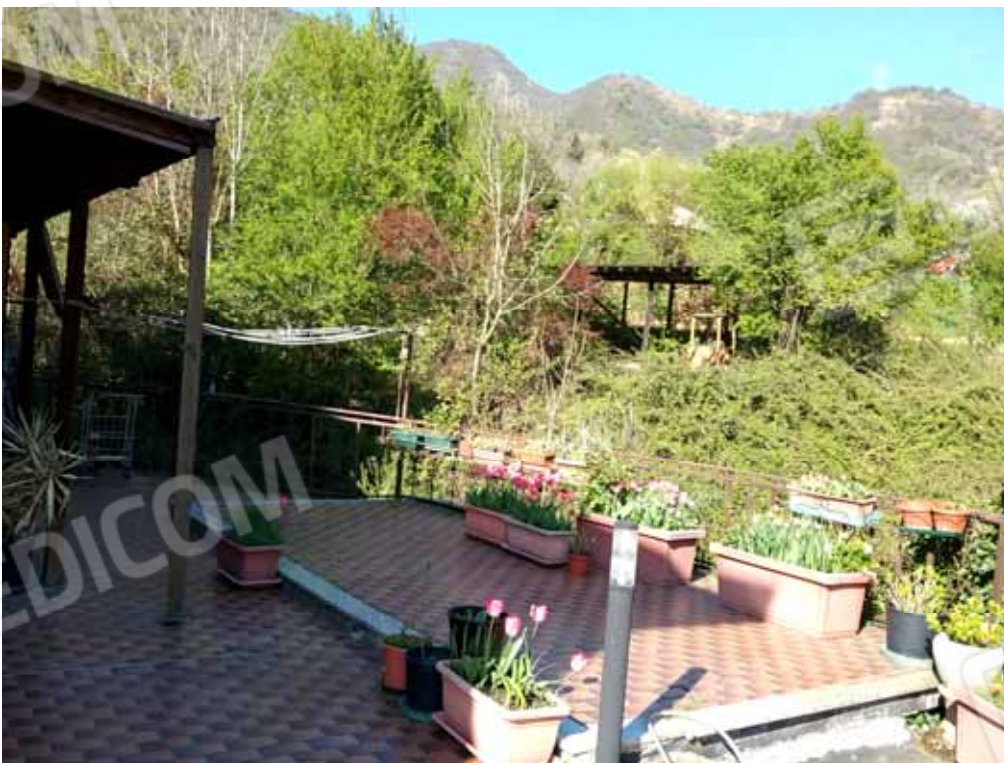
FOTO 66: Particolare della terrazza esclusiva dell' alloggio al piano rialzato e censito alla sezione Urbana NCT, fg. 10, mapp. 231 sub 12 – LOTTO n. 7