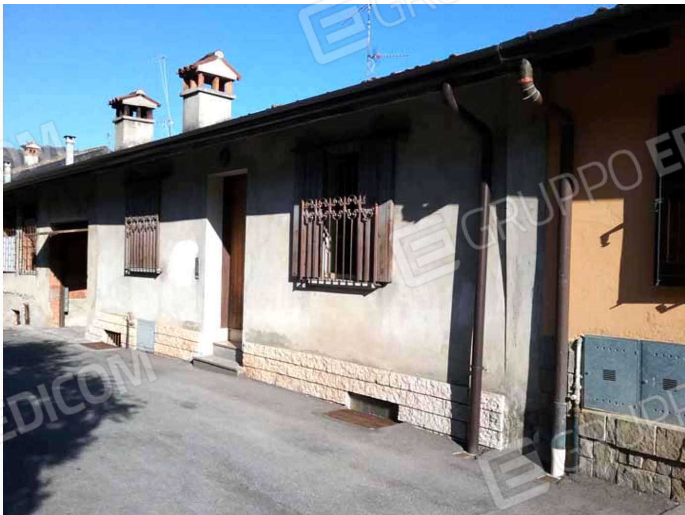
FOTO 1: Veduta d' insieme dell' appartamento con accesso da via Villa Mattina – LOTTO n. 6

LOTTO 6: APPARTAMENTO al piano terra con annesso piano sottotetto censito nel Catasto Fabbricati del Comune di Caino (BS) alla sezione urbana NCT, foglio 13, mapp. 22 Sub 2, Cat. A/3 ed attigua autorimessa al piano terra, censita nel Catasto Fabbricati del Comune di Caino (BS) alla sezione urbana NCT, foglio 13, mapp. 23 Sub 3, Cat. C/6; entrambi siti In Comune di Caino (BS) in Via Villa Mattina snc.