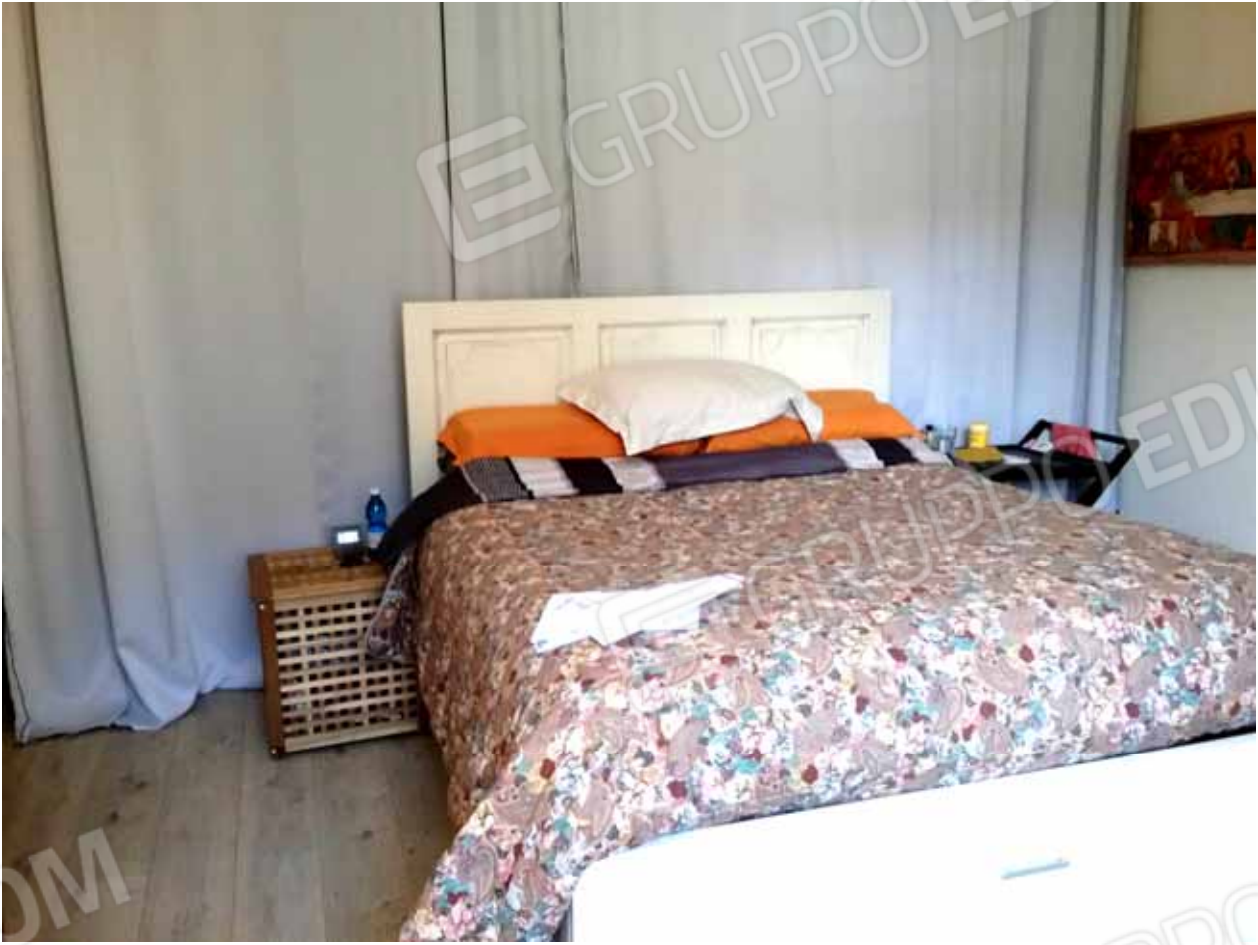
FOTO 35: camera da letto dell'unità abitativa del piano seminterrato censita alla sezione Urbana NCT, fg. 10, mapp. 231 sub 15 – LOTTO n. 7