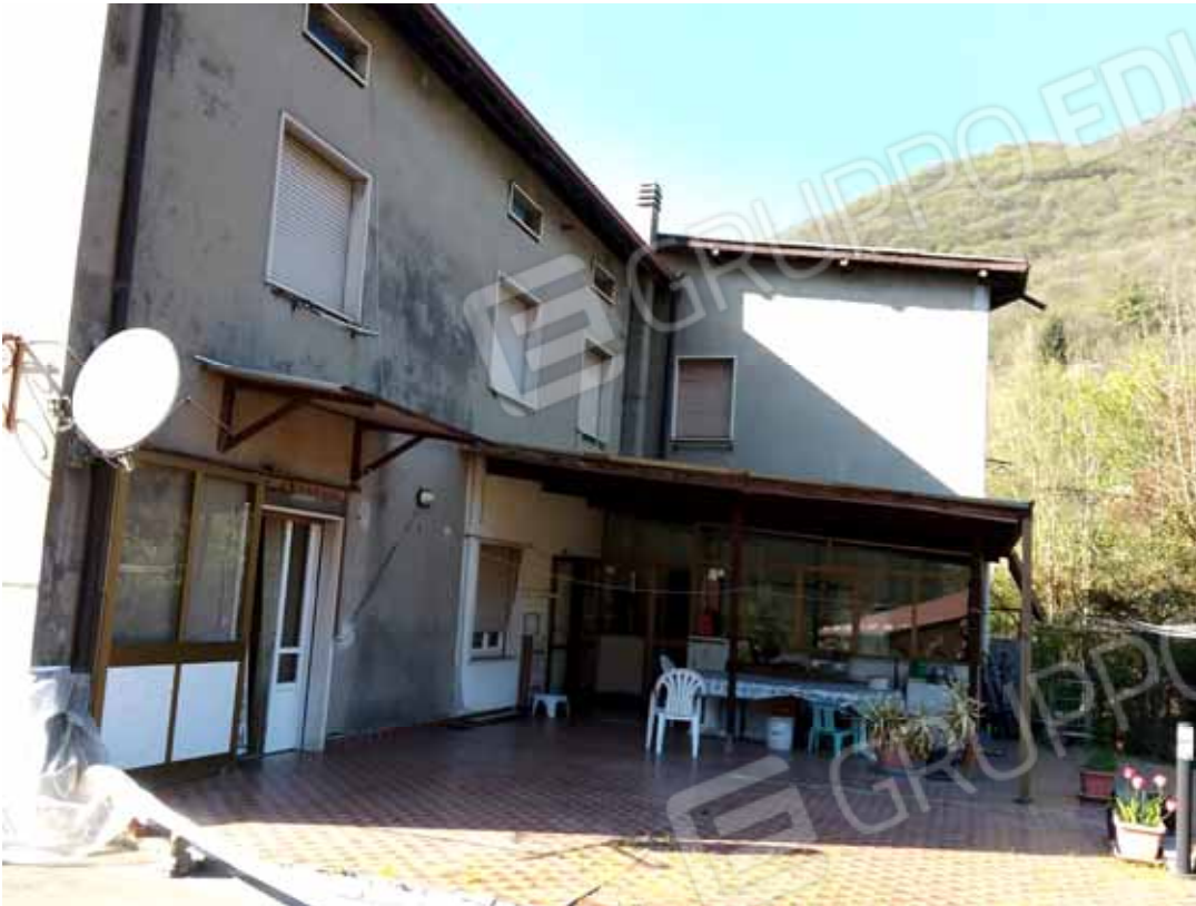
FOTO 65: Veduta dalla terrazza esclusiva dell' unità abitativa al piano rialzato e censita alla sezione Urbana NCT, fg. 10, mapp. 231 sub 12 – LOTTO n. 7