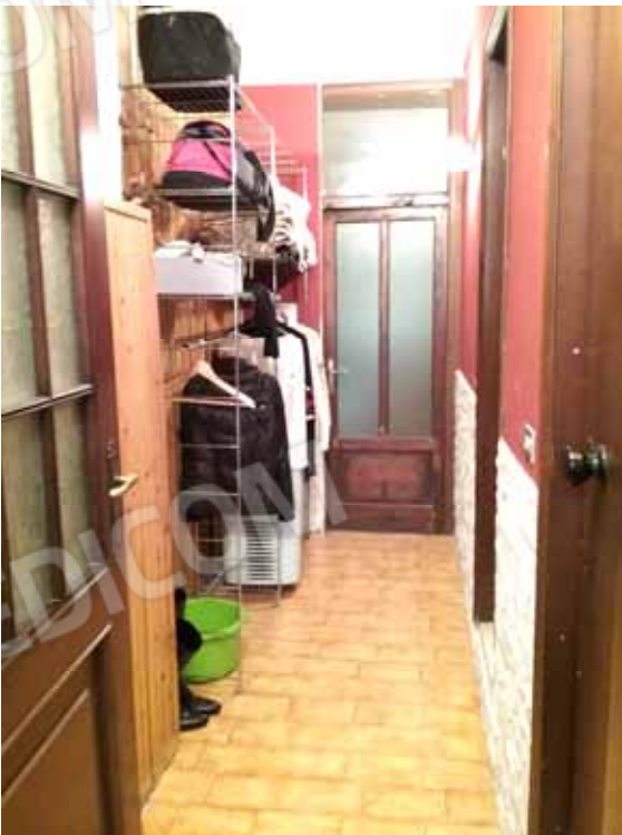
FOTO 39: disimpegno e vani accessori: bagno, ripostiglio e lavanderia dell'unità abitativa del piano seminterrato censita alla sezione Urbana NCT, fg. 10, mapp. 231 sub 15 – LOTTO n. 7