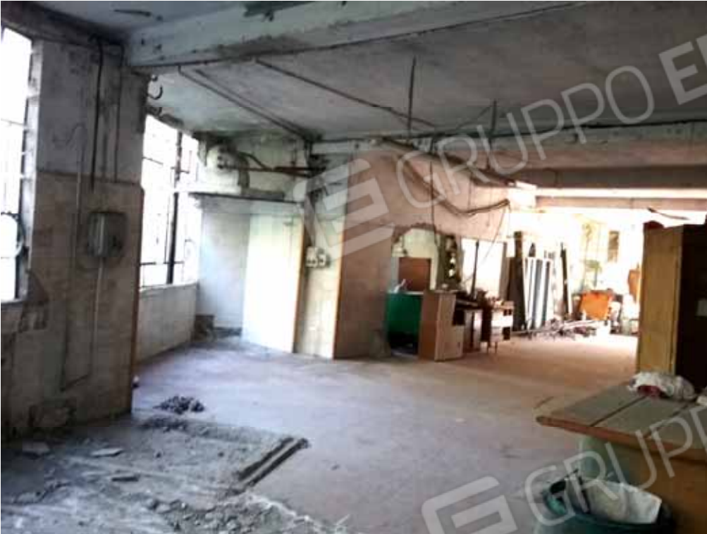
FOTO 46: Altro dettaglio del laboratorio dismesso ubicato nel piano seminterrato censito alla sezione Urbana NCT, fg. 10, mapp. 231 sub 14 – LOTTO n. 7