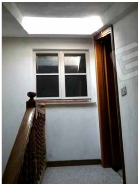
FOTO 14: Pianerottolo di accesso al piano sottotetto – LOTTO n. 6