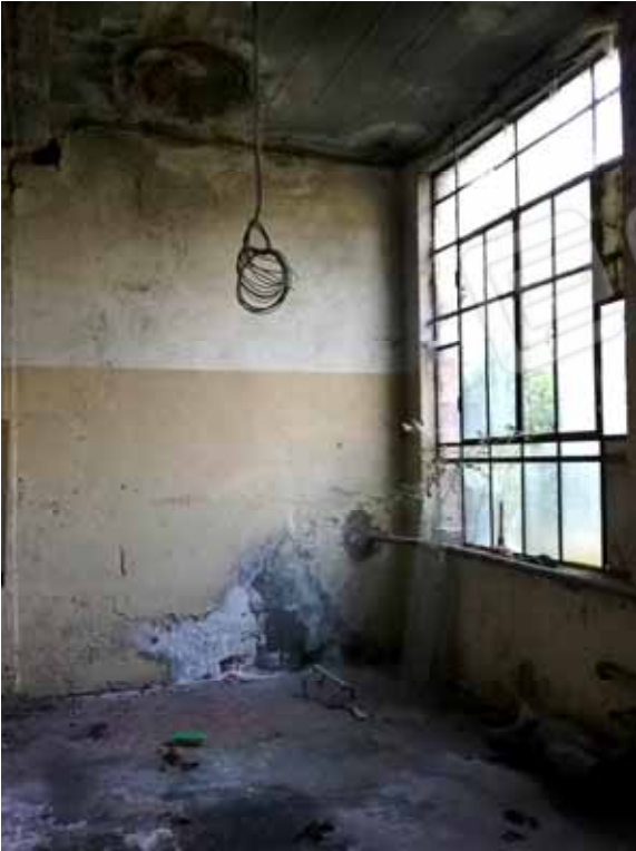
FOTO 50: Locale caldaia del laboratorio dismesso ubicato nel piano seminterrato e censito alla sezione Urbana NCT, fg. 10, mapp. 231 sub 14 – LOTTO n. 7