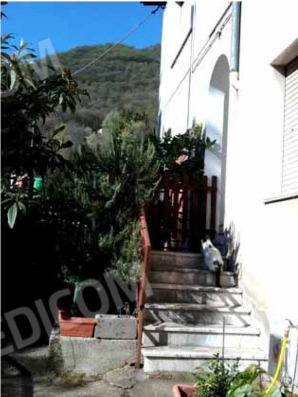
FOTO 26: Scala di accesso agli alloggi del piano primo, comunicante con la corte ed il percorso pedonale entrambi comuni - LOTTO n. 7