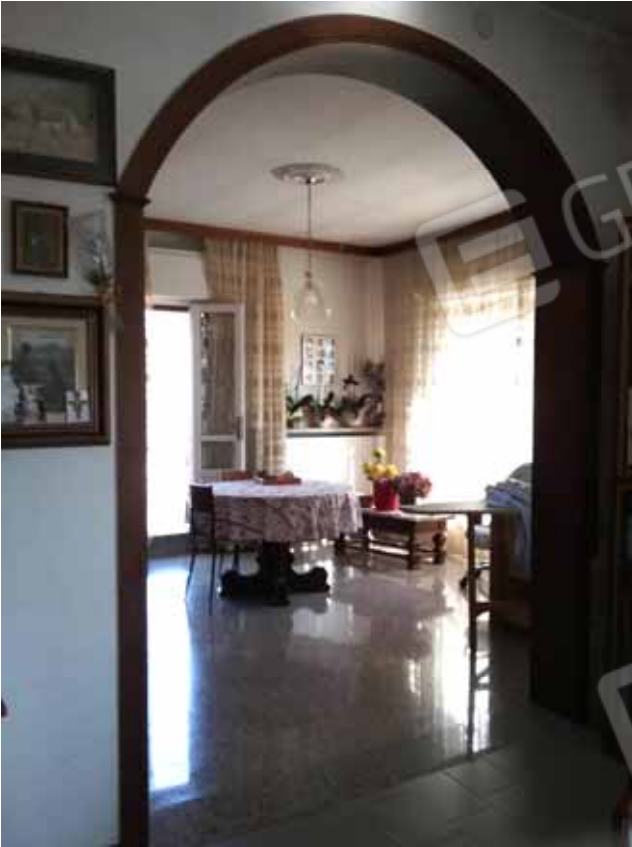
FOTO 57: Interno dell' unità abitativa al piano rialzato censita alla sezione Urbana NCT, fg. 10, mapp. 231 sub 12 – LOTTO n. 7