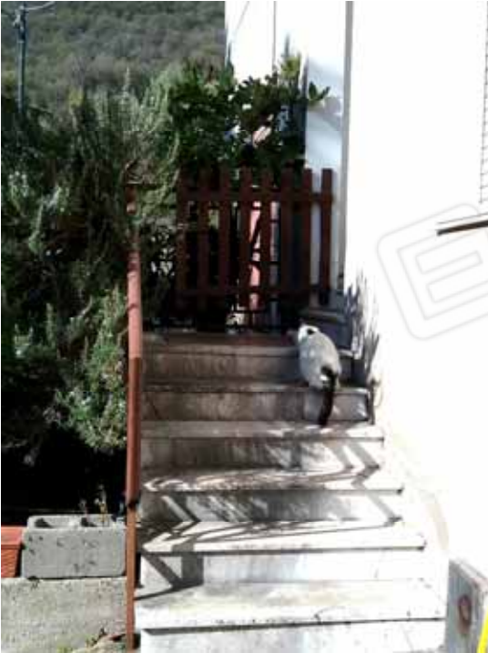
FOTO 25: Particolare della scala esterna di accesso al piano primo - LOTTO n. 7