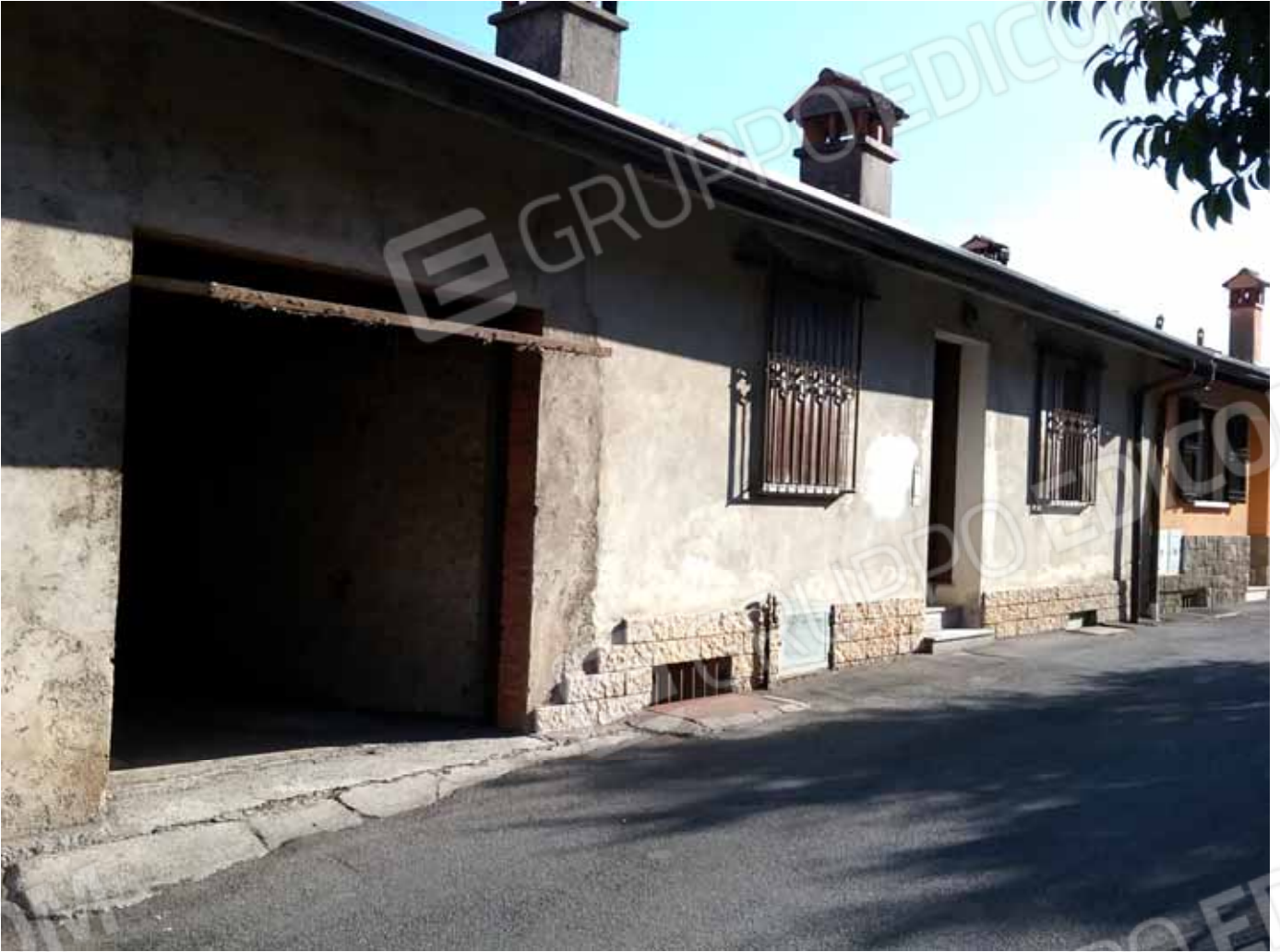
FOTO 2: Veduta d' insieme dell' appartamento e dell' attigua autorimessa; entrambi con accesso da via Villa Mattina – LOTTO n. 6