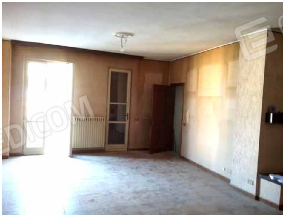
FOTO 10: Veduta interna del soggiorno comunicante con la scala interna di accesso al piano sottotetto – LOTTO n. 6