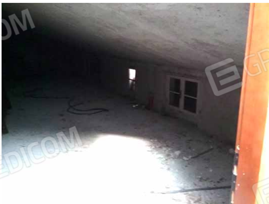
FOTO 15: Veduta interna del piano sottotetto allo stato grezzo – LOTTO n. 6