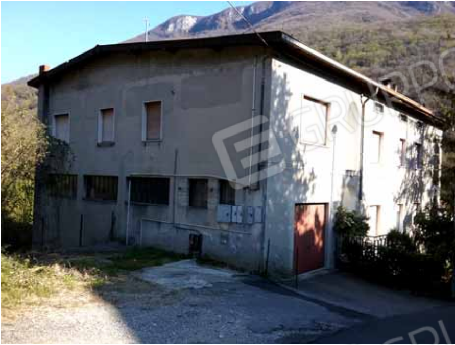
FOTO 53: Autorimessa al piano terra e corte comune antistante la via Tolzana; il tutto Censito alla sezione Urbana NCT, fg. 10, mapp. 231 sub 7 – LOTTO n. 7