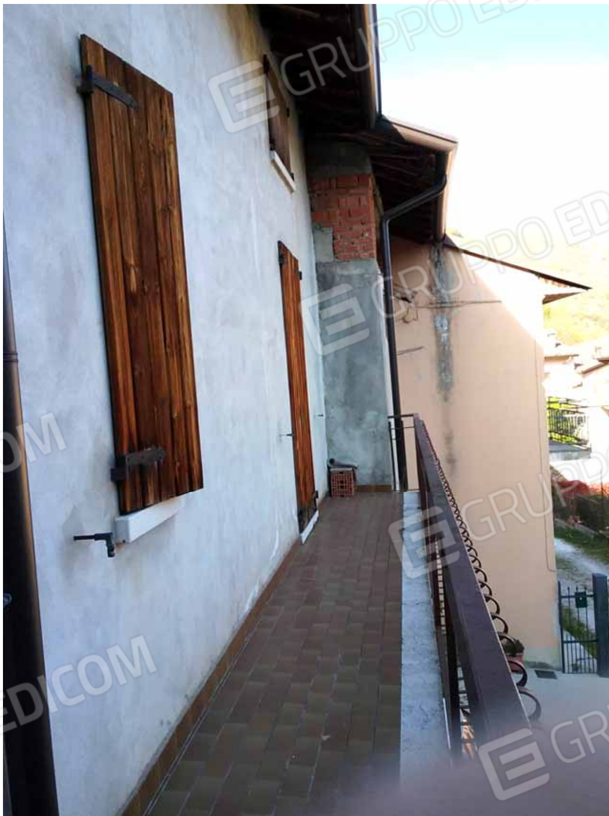
FOTO 11: Veduta del balcone comunicante con il soggiorno ed una camera da letto – LOTTO n. 6