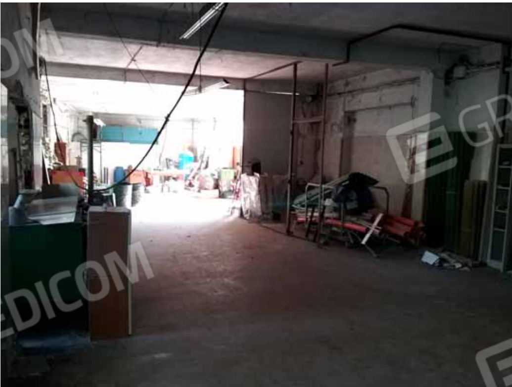
FOTO 47: Interno del laboratorio dismesso, attualmente adibito a rimessa di ogni genere di merce ubicato nel piano seminterrato censito alla sezione Urbana NCT, fg. 10, mapp. 231 sub 14 – LOTTO n. 7