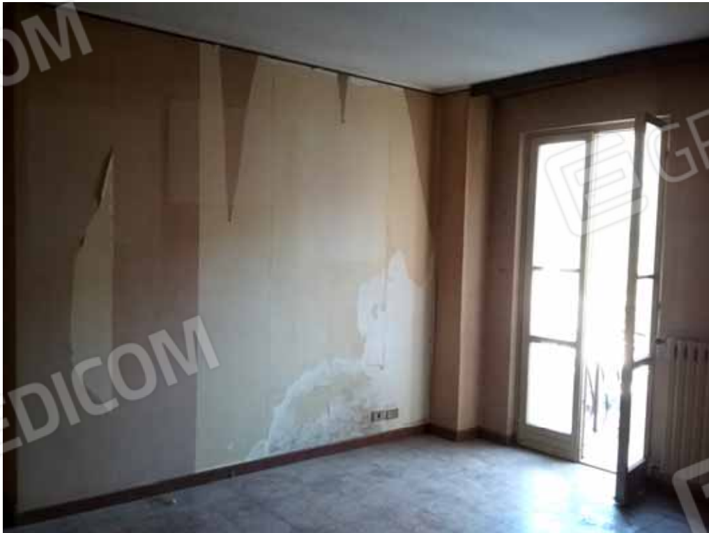
FOTO 8: Veduta interna del soggiorno comunicante con il balcone – LOTTO n. 6