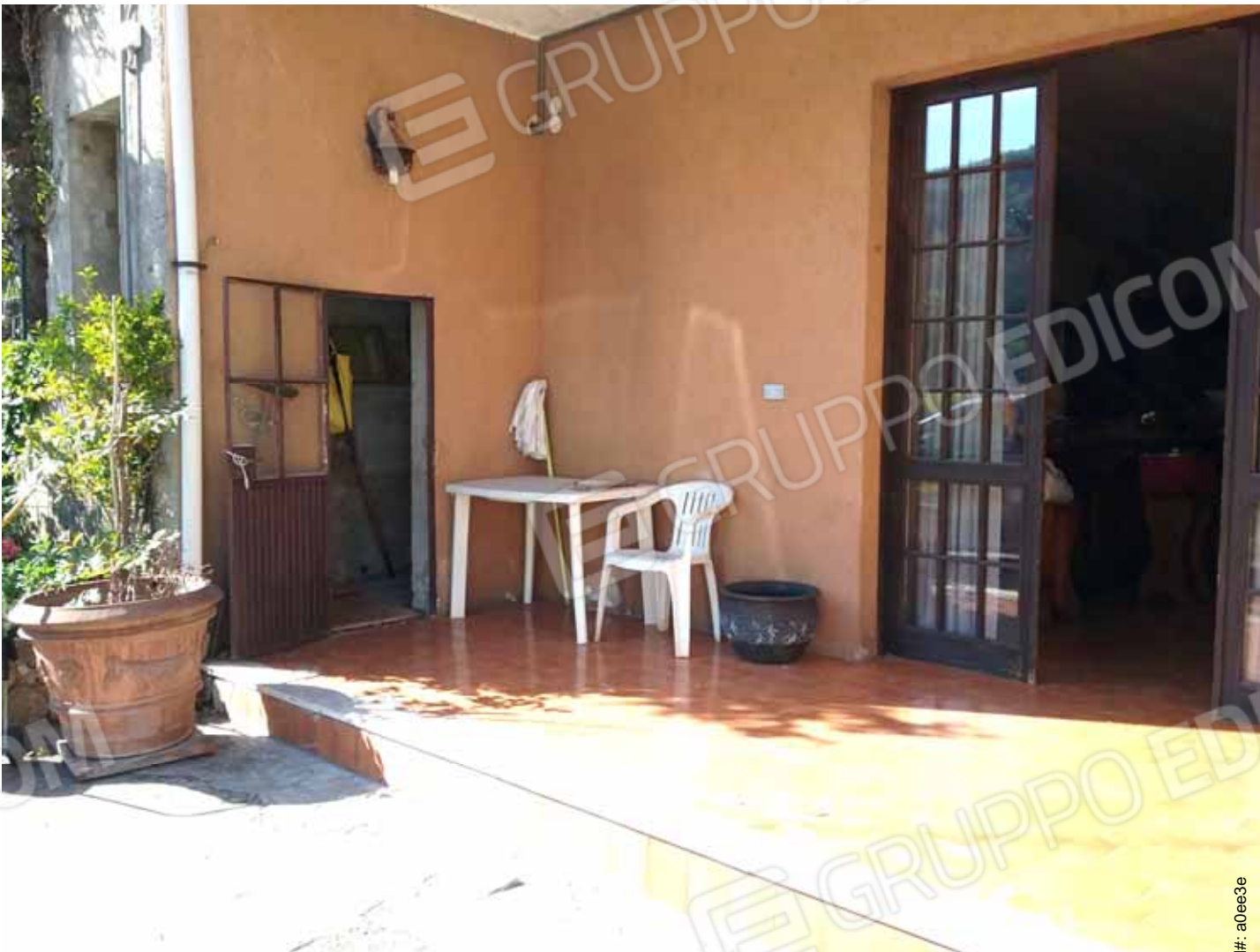
FOTO 41: Particolare del sottoscala adibito a lavatoio, al servizio dell'unità abitativa del piano seminterrato censita alla sezione Urbana NCT, fg. 10, mapp. 231 sub 15 – LOTTO n. 7