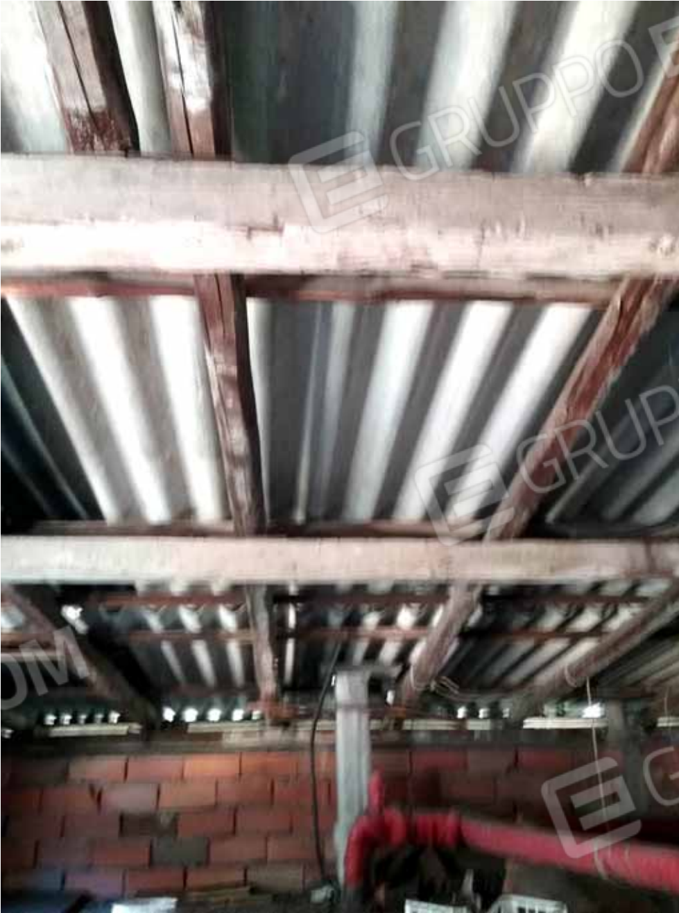
FOTO 31: Particolare del degrado del sottotetto e della relativa copertura, da rimuovere – LOTTO n. 7