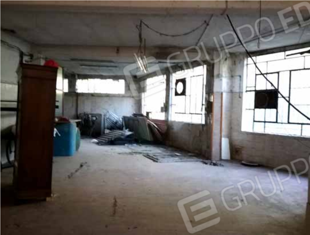
FOTO 44: Interno del laboratorio fatiscente ed in disuso, ubicato nel piano seminterrato e censito alla sezione Urbana NCT, fg. 10, mapp. 231 sub 14 – LOTTO n. 7