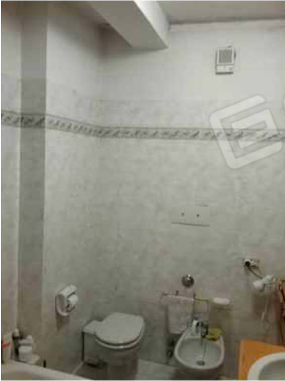
FOTO 61: Bagno dell' alloggio al piano rialzato, censito alla sezione Urbana NCT, fg. 10, mapp. 231 sub 12 – LOTTO n. 7