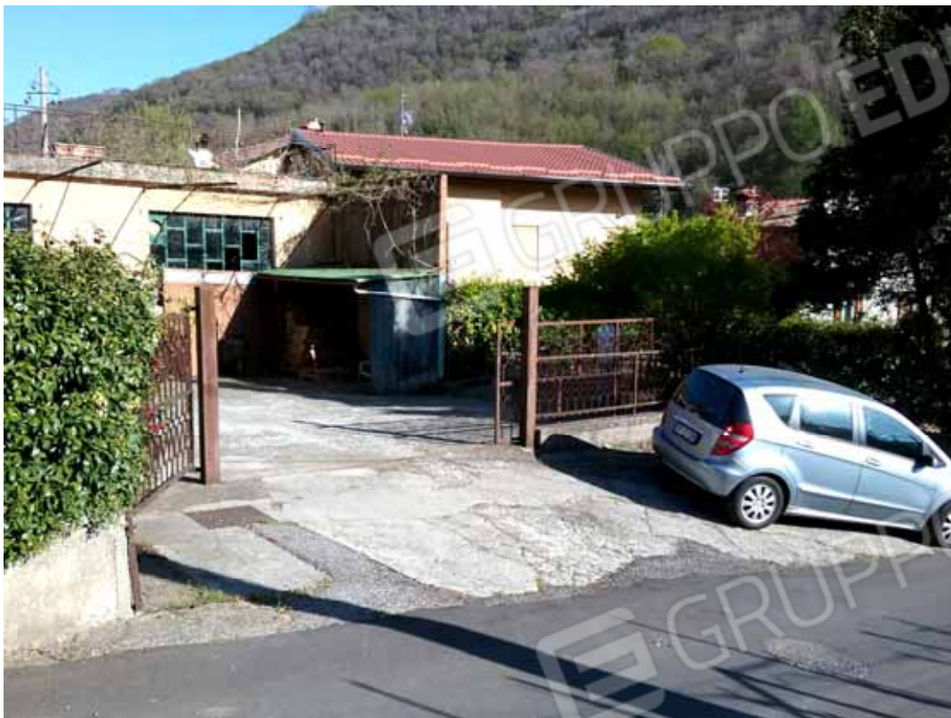
FOTO 18: Accesso carraio da via Tolzana alla corte comune ed al laboratorio dismesso – LOTTO n. 7