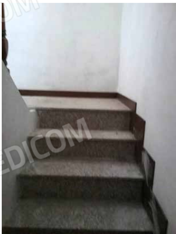
FOTO 13: Scala interna comunicante con l'appartamento, di accesso al piano sottotetto – LOTTO n. 6