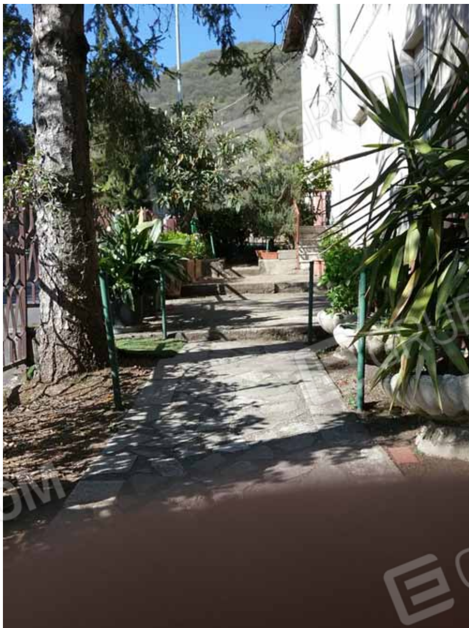
FOTO 22: Percorso pedonale comune di accesso agli appartamenti situati al piano rialzato ed al 1° piano – LOTTO n. 7