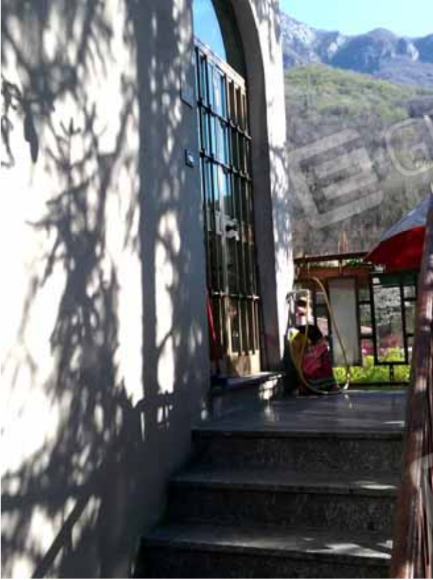
FOTO 55: Particolare della scala di accesso all' unità abitativa al piano rialzato, censita alla sezione Urbana NCT, fg. 10, mapp. 231 sub 12 – LOTTO n. 7