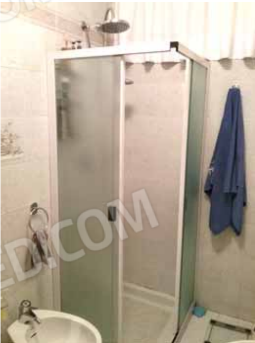
FOTO 37: altra veduta del bagno: unità abitativa del piano seminterrato censita alla sezione Urbana NCT, fg. 10, mapp. 231 sub 15 – LOTTO n. 7