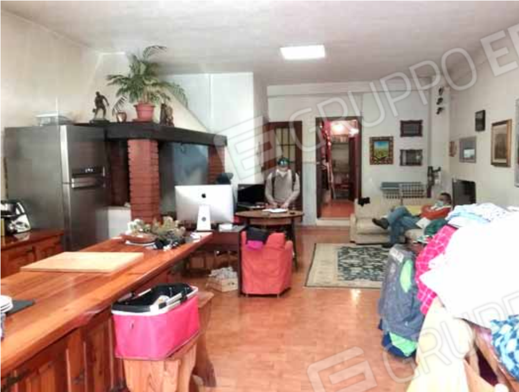
FOTO 33: ampio soggiorno con angolo cottura dell'unità abitativa del piano seminterrato censita alla sezione Urbana NCT, fg. 10, mapp. 231 sub 15 – LOTTO n. 7