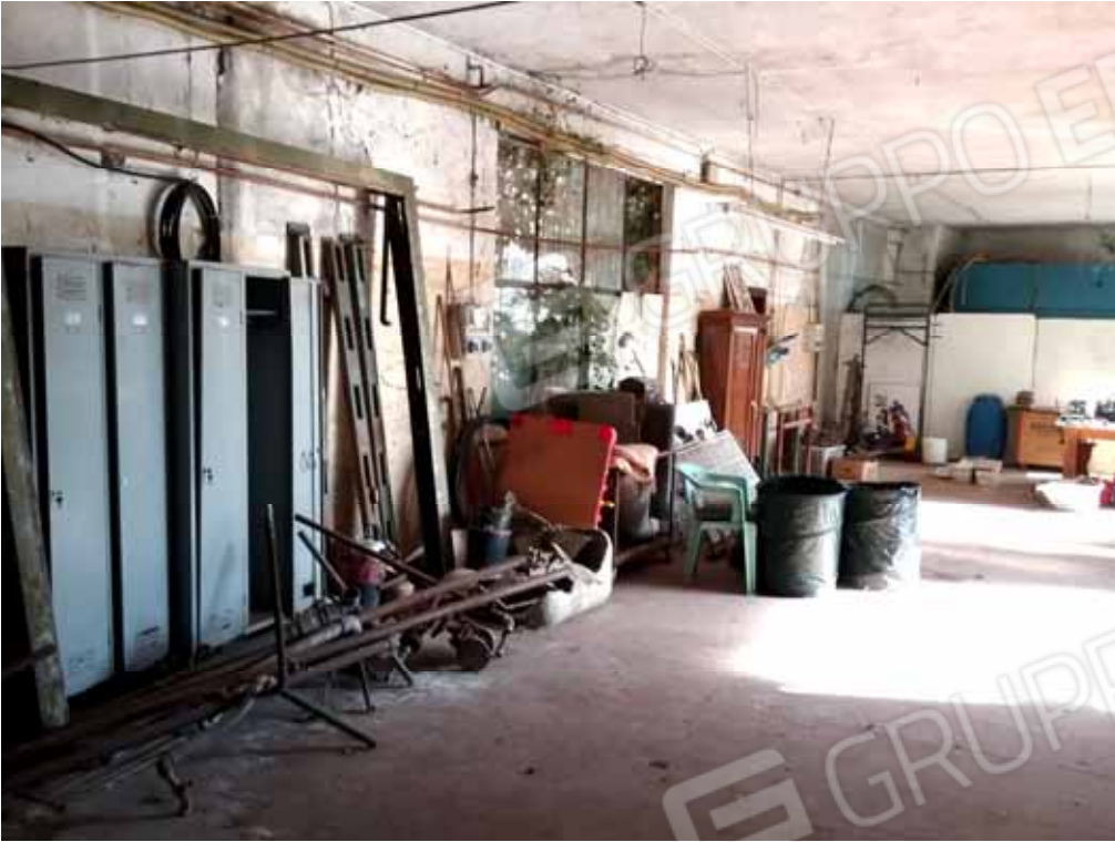
FOTO 48: Altro interno del laboratorio dismesso ubicato nel piano seminterrato censito alla sezione Urbana NCT, fg. 10, mapp. 231 sub 14 – LOTTO n. 7