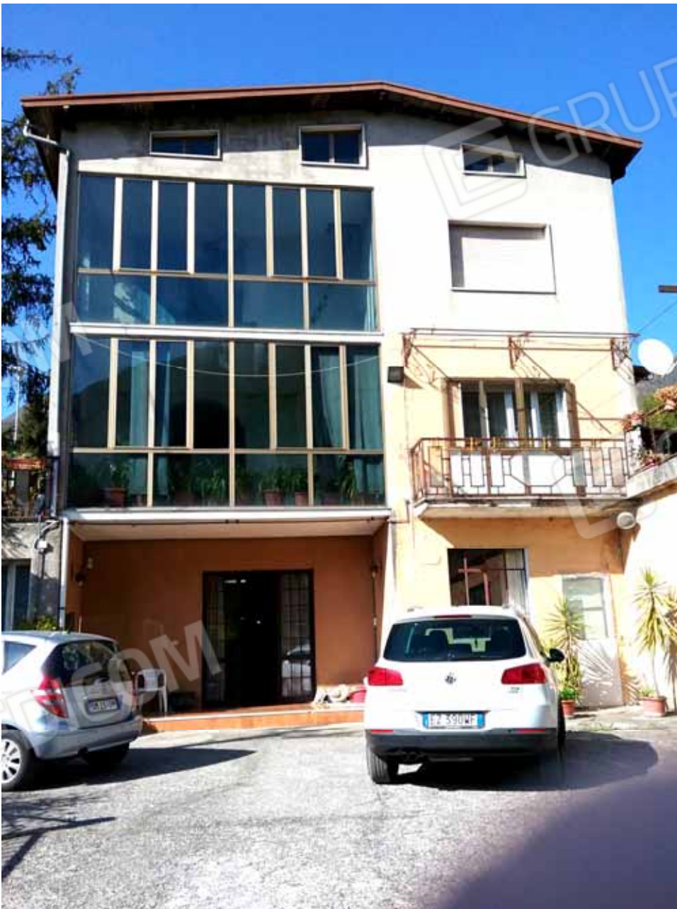
FOTO 16: Veduta dei tre appartamenti dalla corte comune - LOTTO n. 7

LOTTO 7: APPARTAMENTO: ampio bilocale con vani accessori al piano seminterrato censito nel Catasto Fabbricati del Comune di Caino (BS) alla sezione urbana NCT foglio 10, mapp. 231 Sub 15, Cat. A/3, LABORATORIO dismesso destinato a deposito al piano seminterrato censito nel Catasto Fabbricati del Comune di Caino (BS) alla sezione urbana NCT foglio 10, mapp. 231 Sub 14, Cat. C/3, ampia AUTORIMESSA al piano terra, censita nel Catasto Fabbricati del Comune di Caino (BS) alla sezione urbana NCT foglio 10, mapp. 231 Sub 7, Cat. C/6, APPARTAMENTO al piano rialzato con ampia terrazza esclusiva censito nel Catasto Fabbricati del Comune di Caino (BS) alla sezione urbana NCT foglio 10, mapp. 231 Sub 12, Cat. A/3, APPARTAMENTO al piano primo censito nel Catasto Fabbricati del Comune di Caino (BS) alla sezione urbana NCT foglio 10, mapp. 231 Sub 3, Cat. A/3 ed APPARTAMENTO al piano primo censito nel Catasto Fabbricati del Comune di Caino (BS) alla sezione urbana NCT foglio 10, mapp. 231 Sub 13, Cat. A/3; il tutto sito In Comune di Caino (BS) in Via Tolzana.