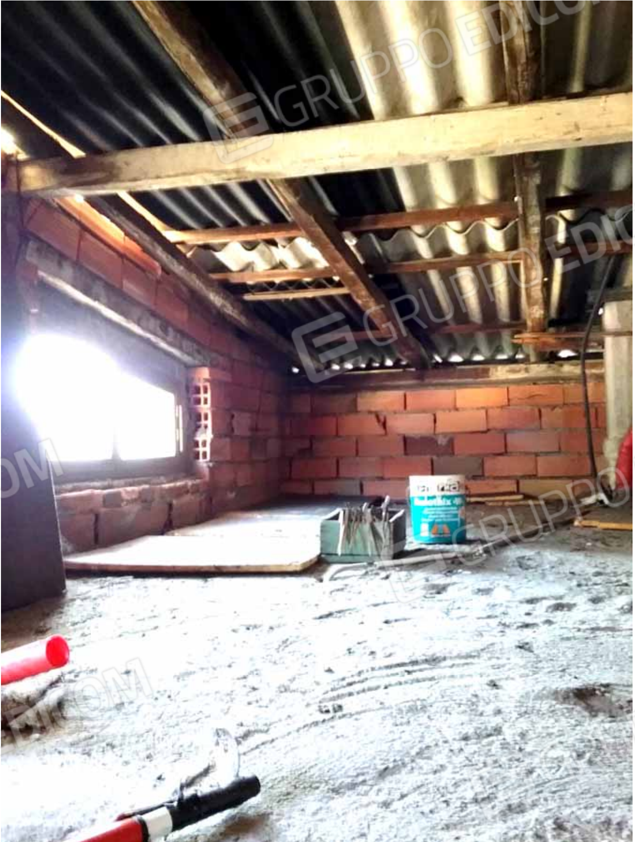
FOTO 30: Copertura provvisoria ed in pessimo stato del sottotetto - LOTTO n. 7