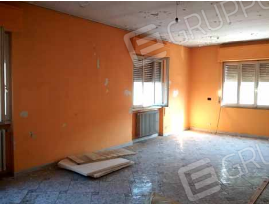
FOTO 72: Soggiorno dell' unità abitativa ubicata al primo piano e censita alla sezione Urbana NCT, fg. 10, mapp. 231 sub 13 – LOTTO n. 7