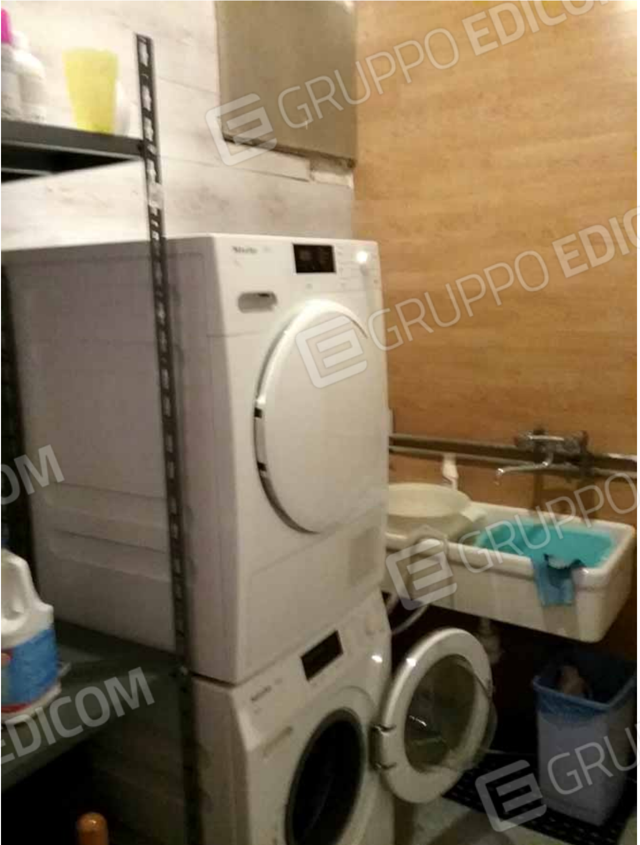
FOTO 40: lavanderia dell'unità abitativa del piano seminterrato censita alla sezione Urbana NCT, fg. 10, mapp. 231 sub 15 – LOTTO n. 7