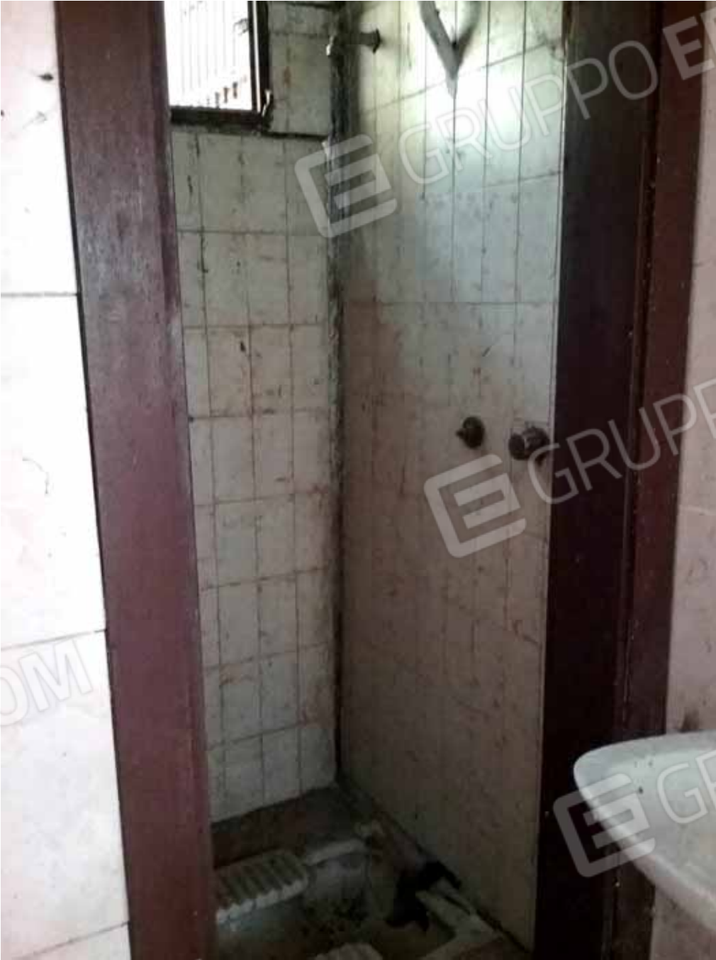
FOTO 52: Servizio igienico del laboratorio dismesso ubicato nel piano seminterrato e censito alla sezione Urbana NCT, fg. 10, mapp. 231 sub 14 – LOTTO n. 7