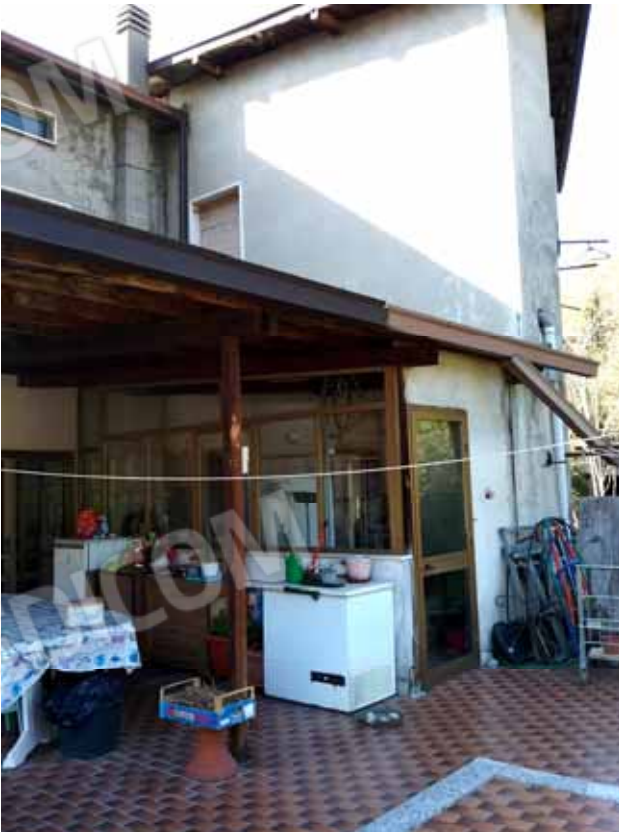
FOTO 64: Altro dettaglio del locale lavanderia al servizio dell' alloggio ubicato al piano rialzato e censito alla sezione Urbana NCT fg. 10, mapp. 231 sub 12 – LOTTO n. 7