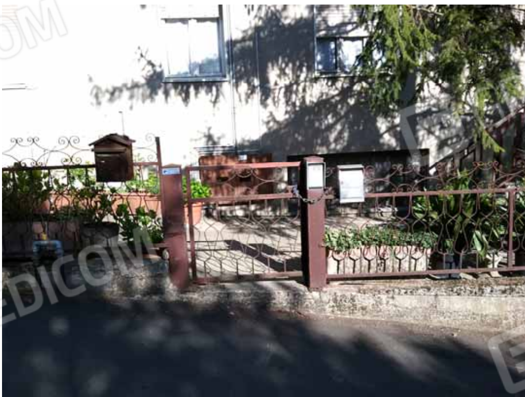
FOTO 19: Accesso pedonale al compendio immobiliare di via Tolzana - LOTTO n. 7