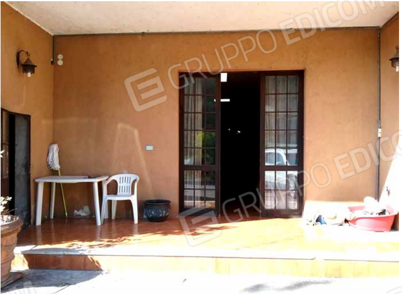
FOTO 32: Accesso dalla corte comune all' unità abitativa del piano seminterrato: ampio BILOCALE con vani accessori, censito alla sezione Urbana NCT, fg. 10, mapp. 231 sub 15 – LOTTO n. 7