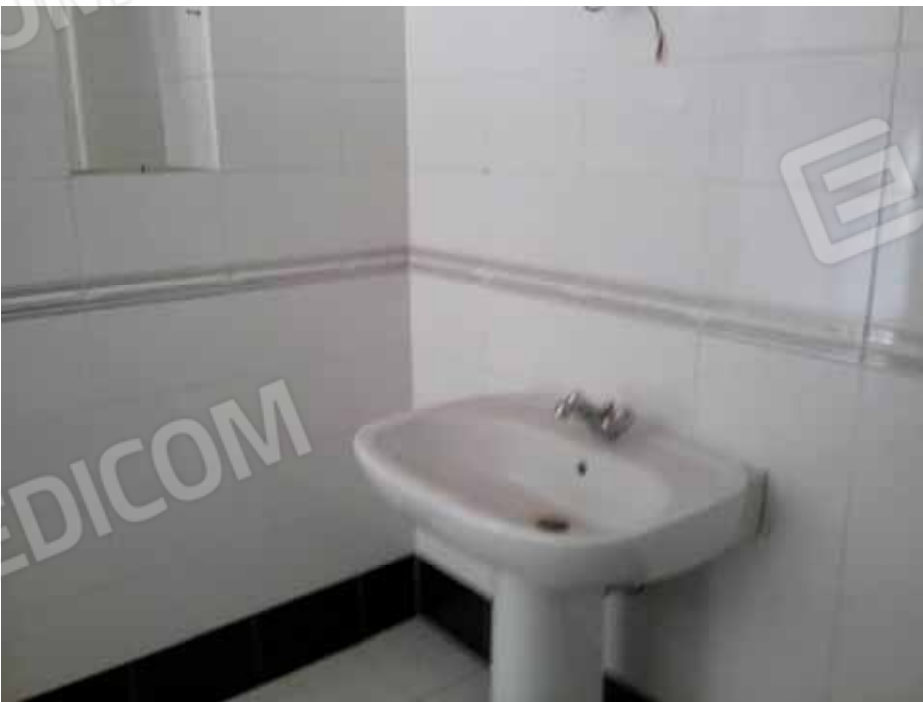
FOTO 73: Bagno dell' unità abitativa ubicata al primo piano e censita alla sezione Urbana NCT, fg. 10, mapp. 231 sub 13 – LOTTO n. 7