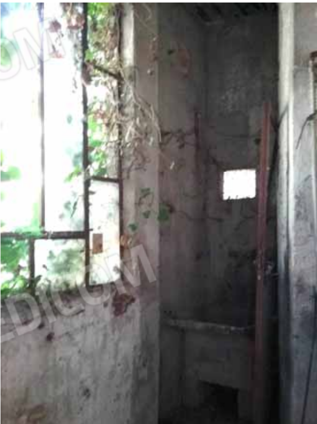
FOTO 49: Particolare dei locali accessori del laboratorio dismesso ubicato nel piano seminterrato e censito alla sezione Urbana NCT, fg. 10, mapp. 231 sub 14 – LOTTO n. 7