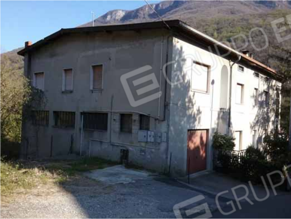
FOTO 28: Veduta d' insieme del compendio immobiliare eseguito da via Tolzana - LOTTO n. 7