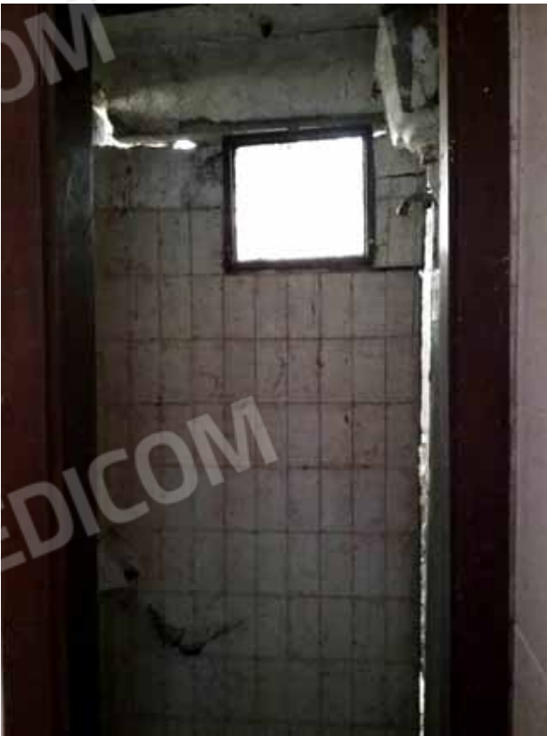
FOTO 51: Servizio igienico del laboratorio dismesso ubicato nel piano seminterrato e censito alla sezione Urbana NCT, fg. 10, mapp. 231 sub 14 – LOTTO n. 7