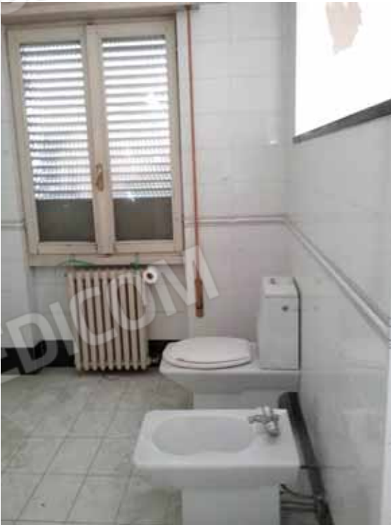
FOTO 77: Servizio igienico dell' unità abitativa ubicata al primo piano e censita alla sezione Urbana NCT, fg. 10, mapp. 231 sub 13 – LOTTO n. 7