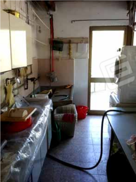
FOTO 63: Lavanderia dell' unità abitativa al piano rialzato, comunicante con l' estesa terrazza: copertura piana del laboratorio dismesso, censita alla sezione Urbana NCT, fg. 10, mapp. 231 sub 12 – LOTTO n. 7