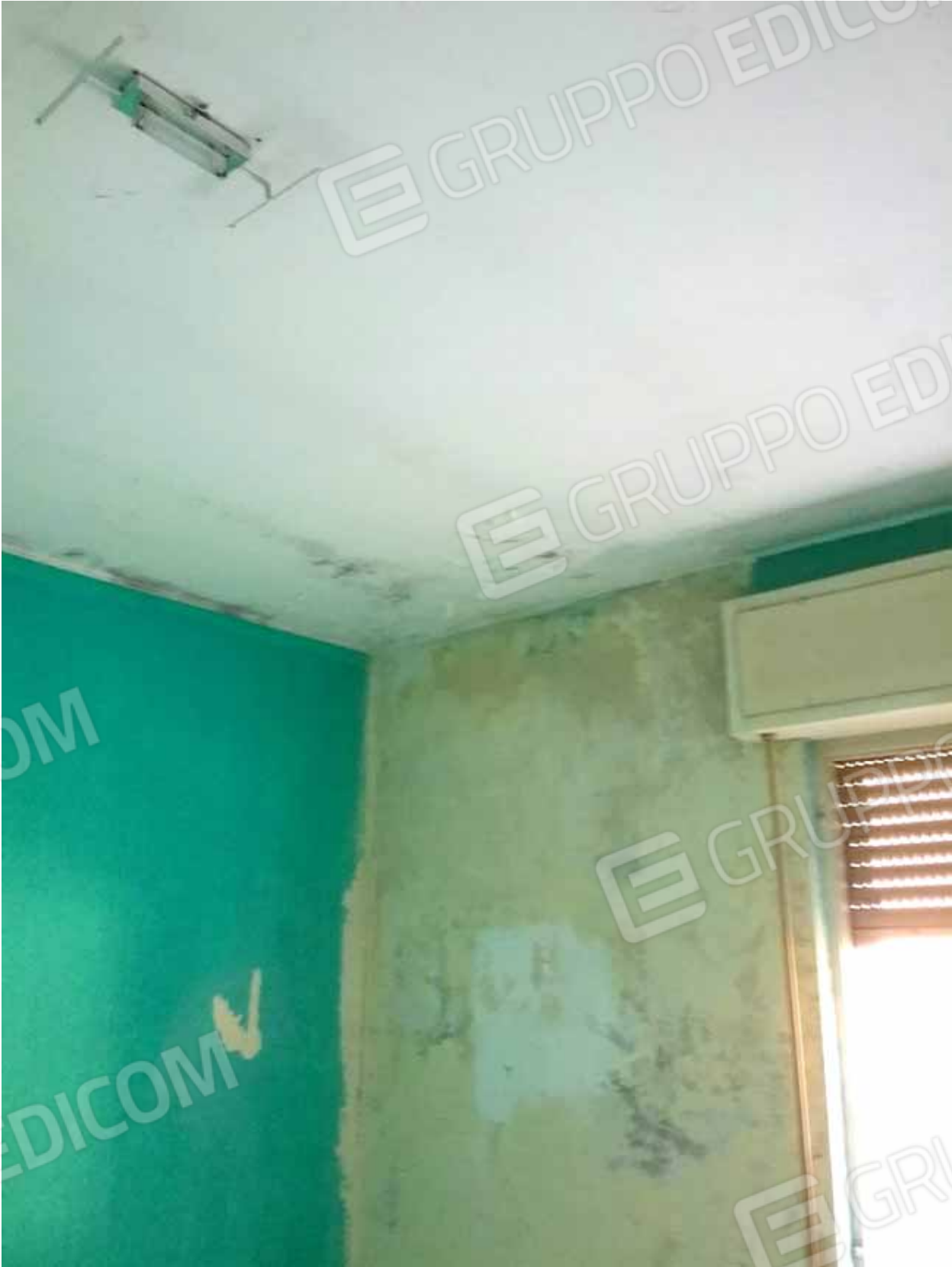
FOTO 71: Dettaglio di uno dei locali dell' appartamento non utilizzato al primo piano e censito alla sezione Urbana NCT, fg. 10, mapp. 231 sub 3- LOTTO n. 7