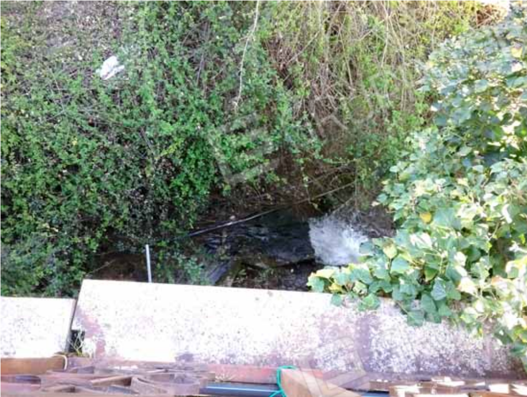
FOTO 67: Particolare del laboratorio dismesso e della soprastante copertura a terrazza realizzati anteriormente al 1° settembre 1967 sopra al torrente che confluisce nel limitrofo torrente Garza e censito alla sezione Urbana NCT, fg. 10, mapp. 231 sub 12 – LOTTO n. 7