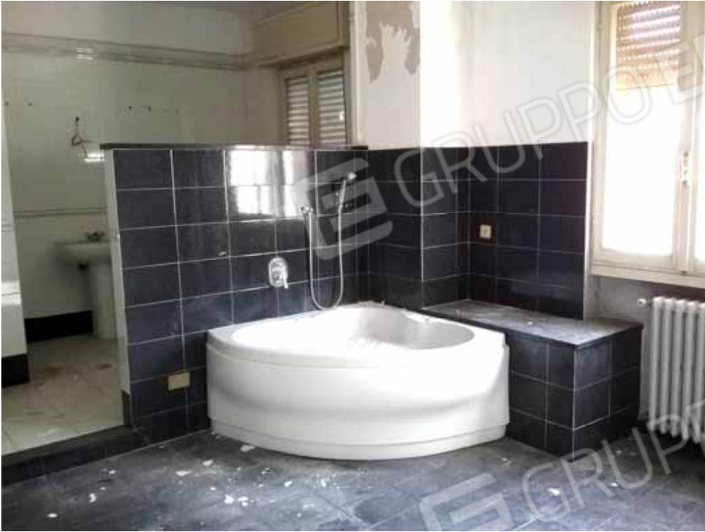
FOTO 74: bagno dell' unità abitativa ubicata al primo piano e censita alla sezione Urbana NCT, fg. 10, mapp. 231 sub 13 – LOTTO n. 7