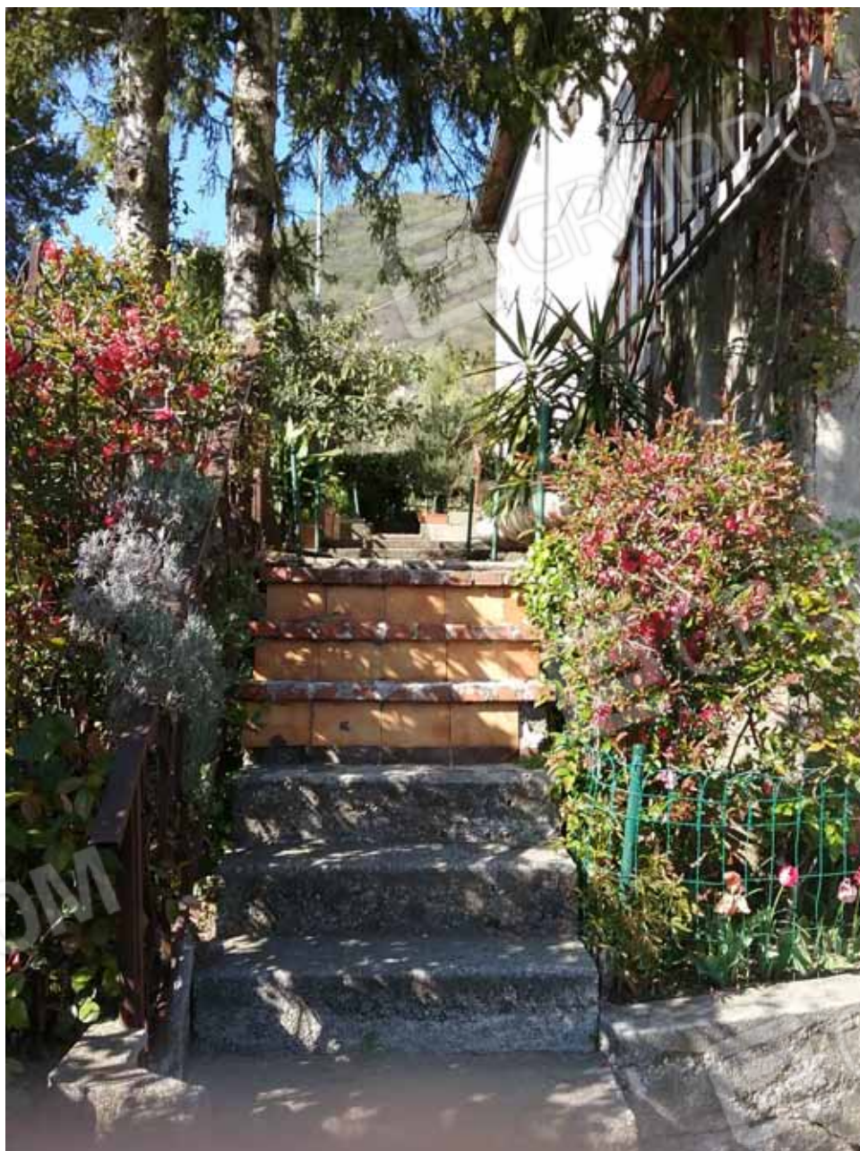
FOTO 24: Particolare della scala di accesso al piano rialzato - LOTTO n. 7