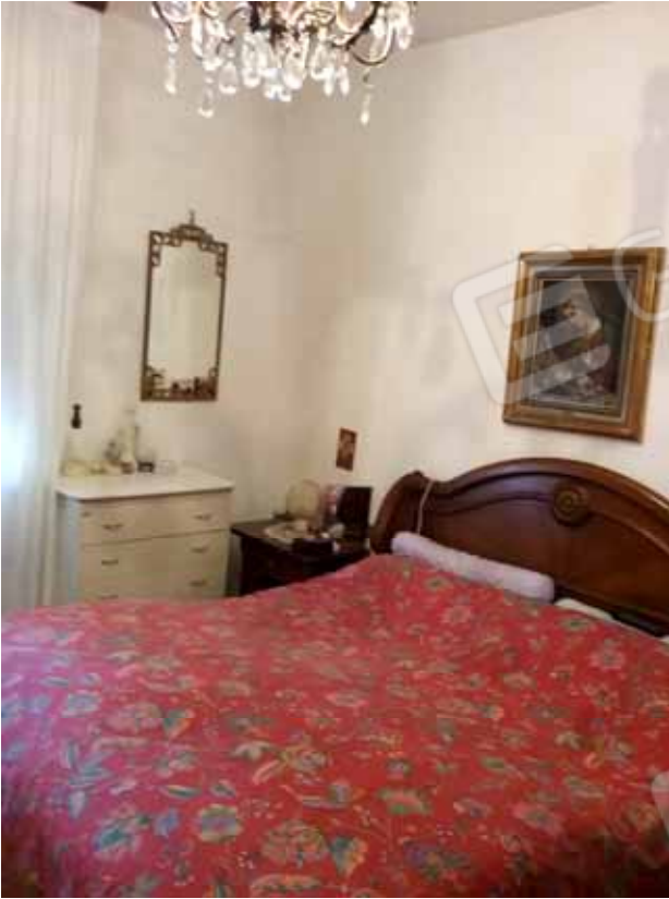
FOTO 59: Camera da letto dell' unità abitativa al piano rialzato censita alla sezione Urbana NCT, fg. 10, mapp. 231 sub 12 – LOTTO n. 7