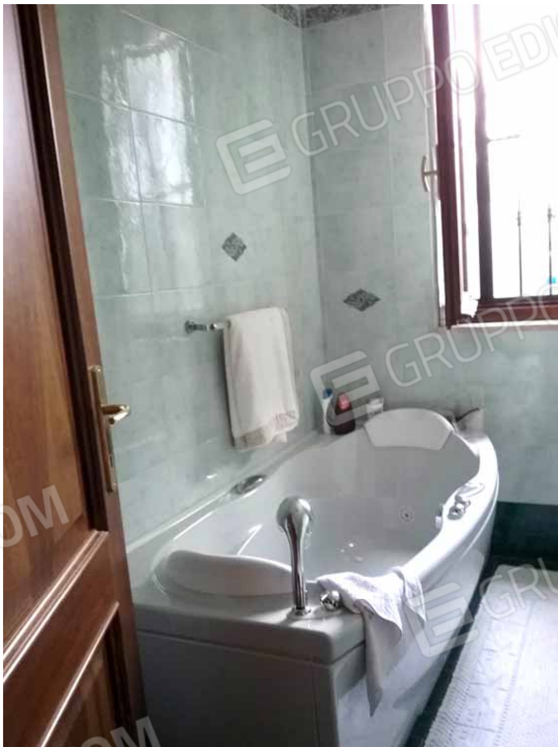
Foto 51: vasca idromassaggio e particolare delle porte interne del bilocale INTERNO 2 - LOTTO n. 3