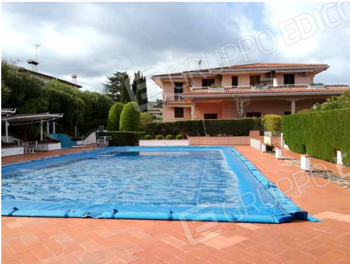
FOTO 12: Veduta della piscina condominiale indivisa del Residence agli Oleandri