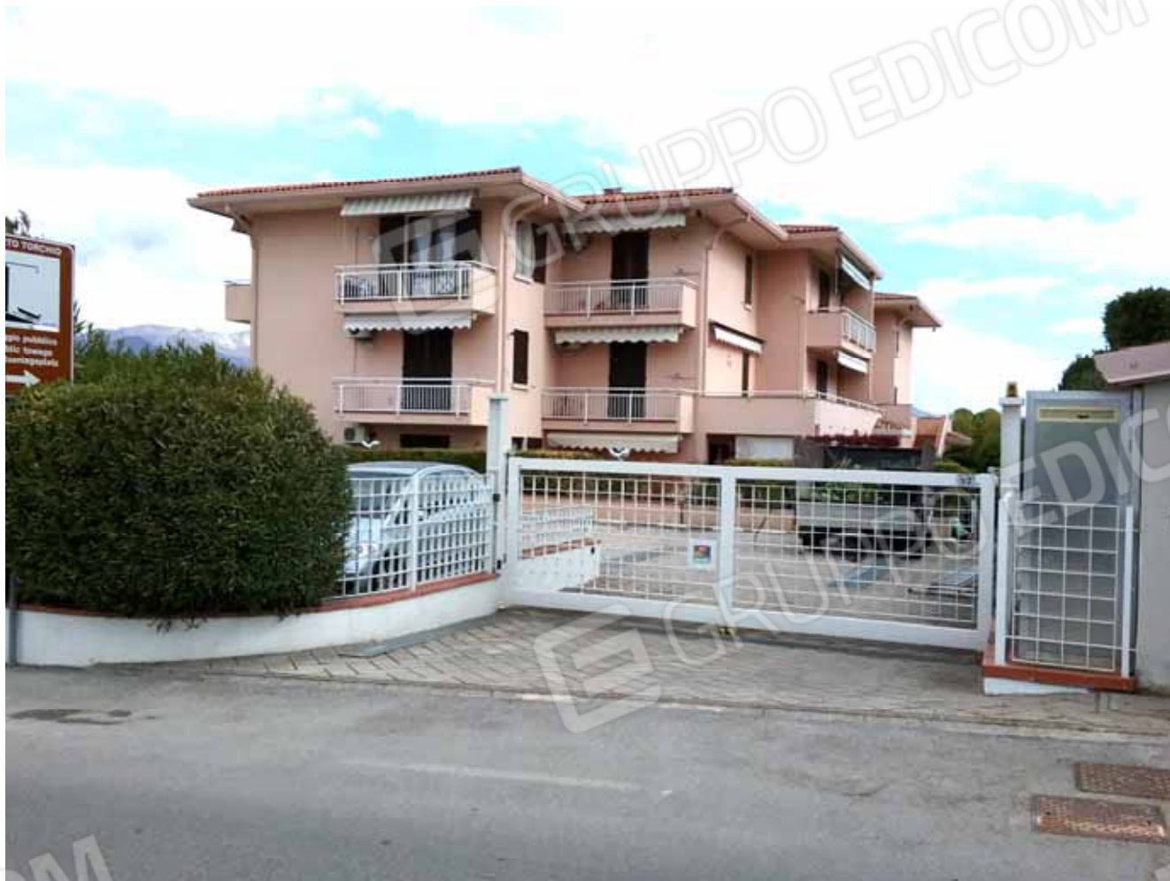
FOTO 5: Veduta del Residence agli Oleandri dal passo carraio al n. civico 52 di via degli Alpini