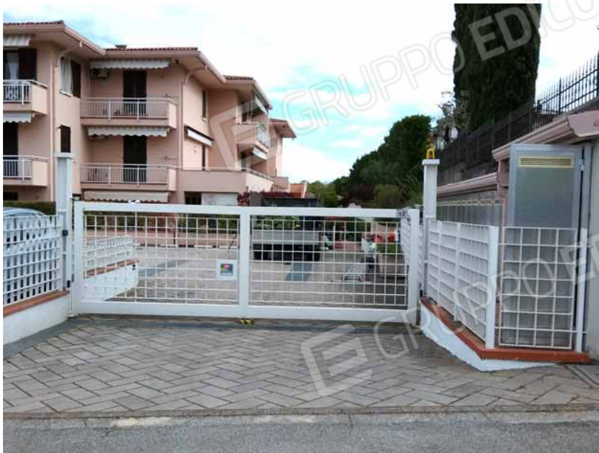
FOTO 9: Ingresso carraio per l' accesso ai posti auto del Residence agli Oleandri