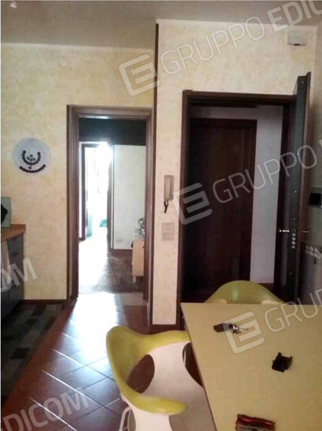
Foto 41: Veduta dell' accesso esclusivo a mezzo di porta blindata al monocale INTERNO 3 dal disimpegno interno comune e del varco di collegamento con il bilocale INTERNO 2 – LOTTO n. 3