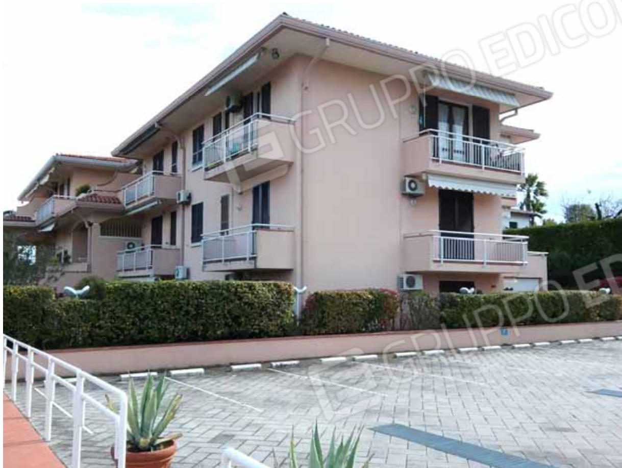
FOTO 2: Altra veduta d'insieme del Residence agli Oleandri dal parcheggio interno