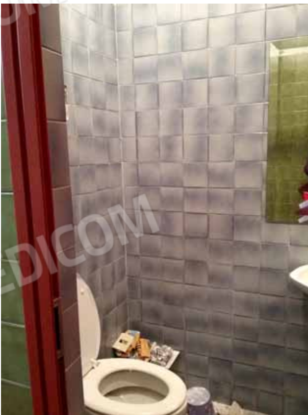
Foto 35: Servizio igienico esclusivo limitrofo alla piscina - LOTTO n. 2