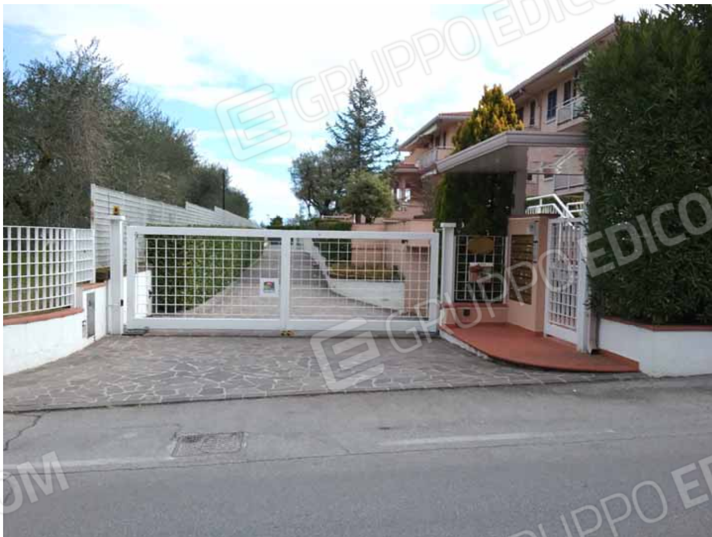
FOTO 4: Accessi al Residence agli Oleandri dal n. civico 54 di via degli Alpini