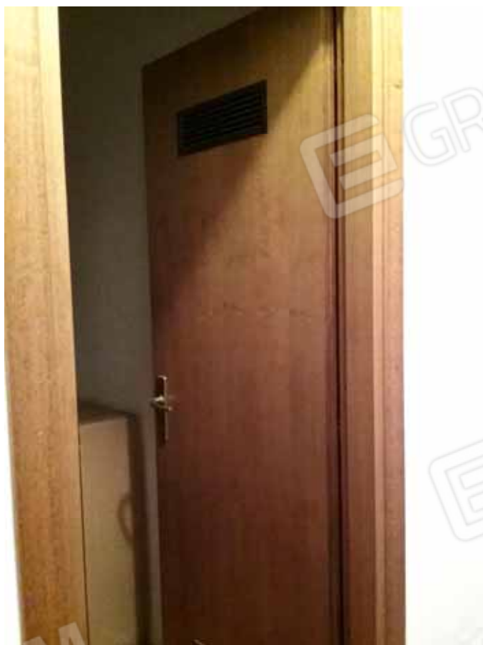
Foto 36: Accesso alla cantina nel piano seminterrato esclusiva dell' unità abitativa: LOTTO n. 2