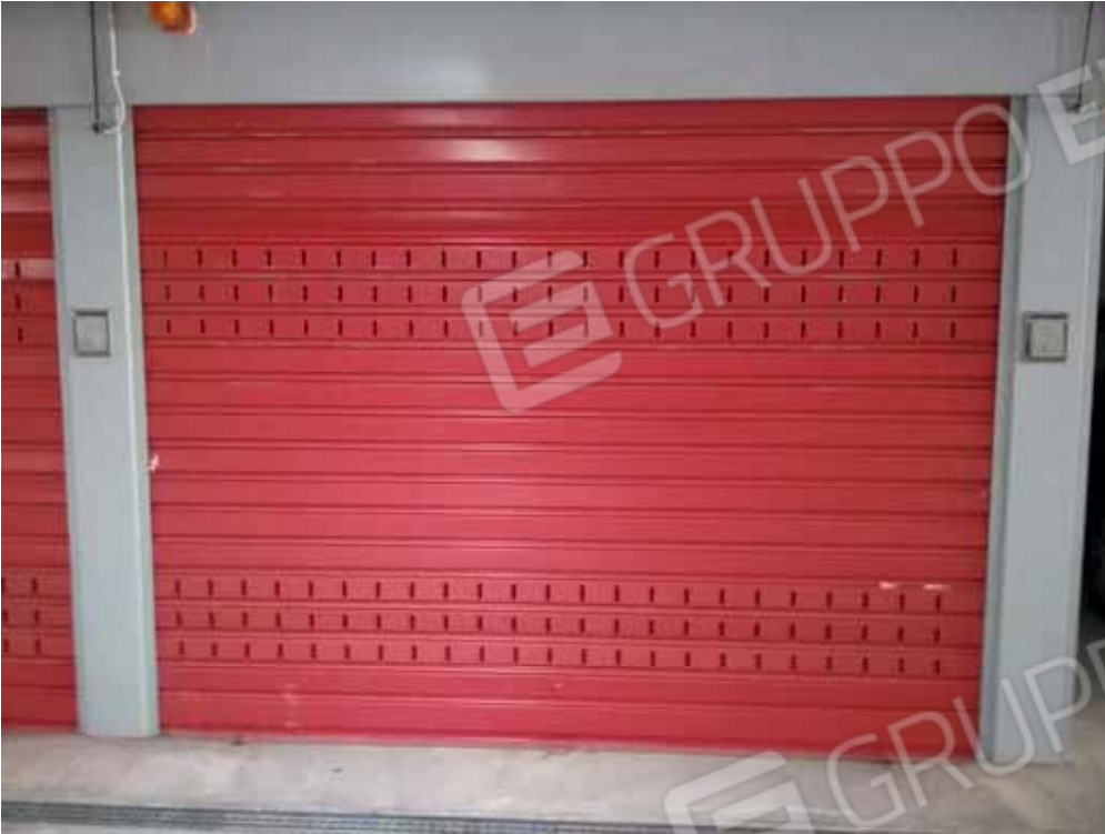
Foto 53: autorimessa denominata "G7" con apertura automatizzata - LOTTO n. 3