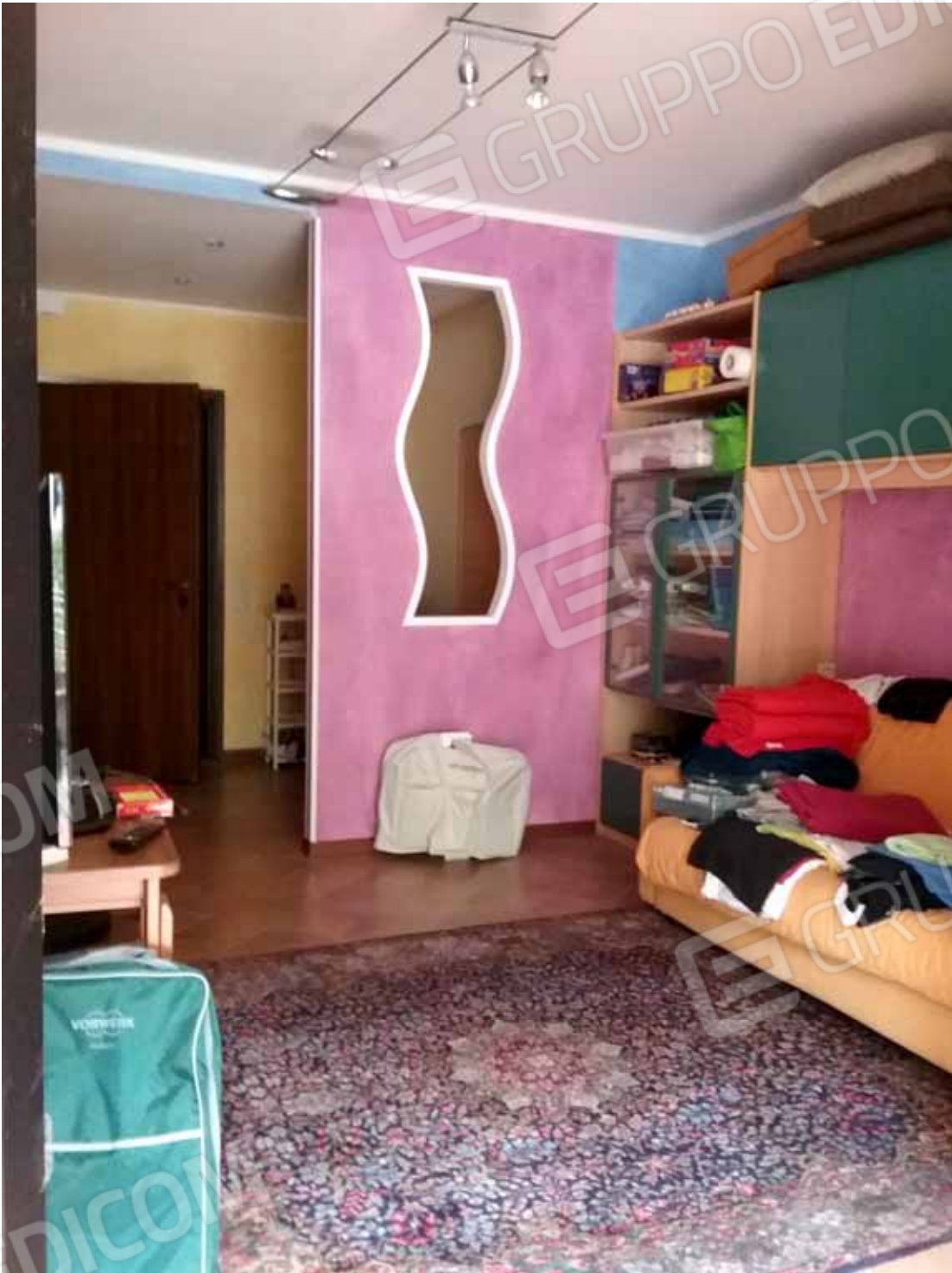
Foto 33: Accesso al monolocale dal disimpegno condominiale interno - LOTTO n. 2