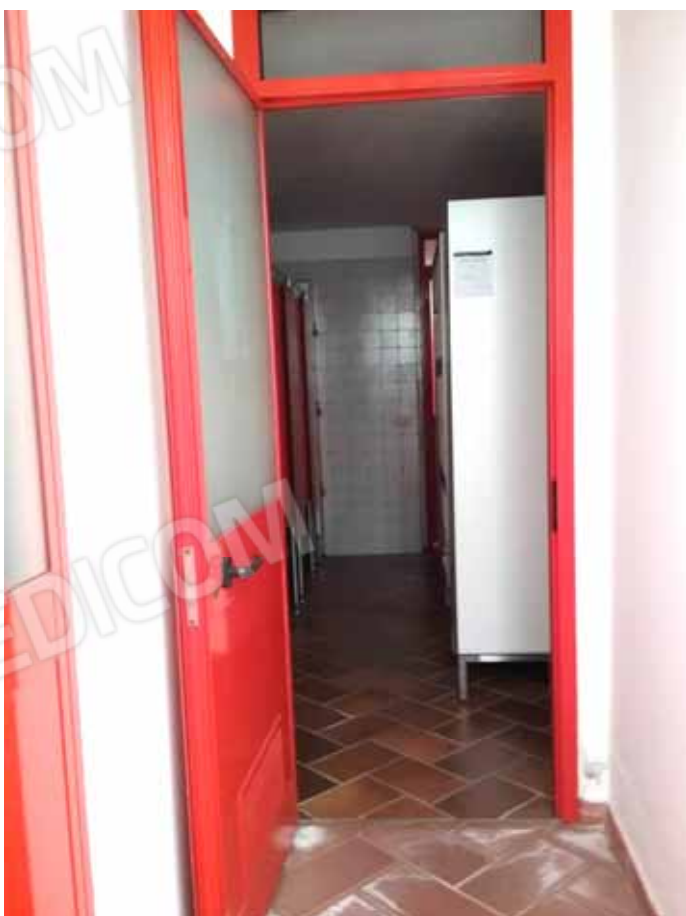
FOTO 15: Locali accessori della piscina: servizi igienici, docce e spogliatoi