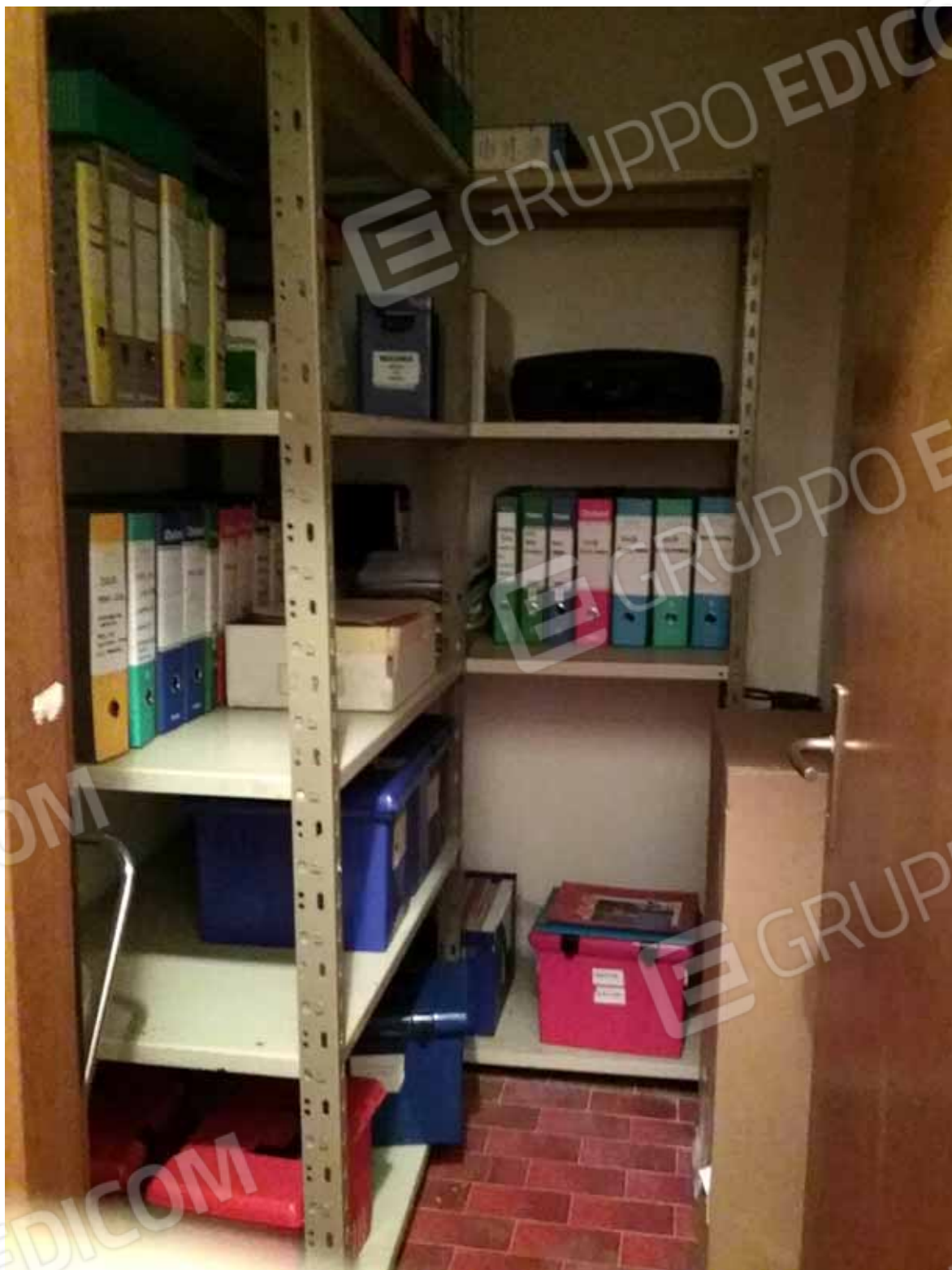
Foto 26: Cantina nel piano seminterrato annessa all' unità abitativa del LOTTO n. 1