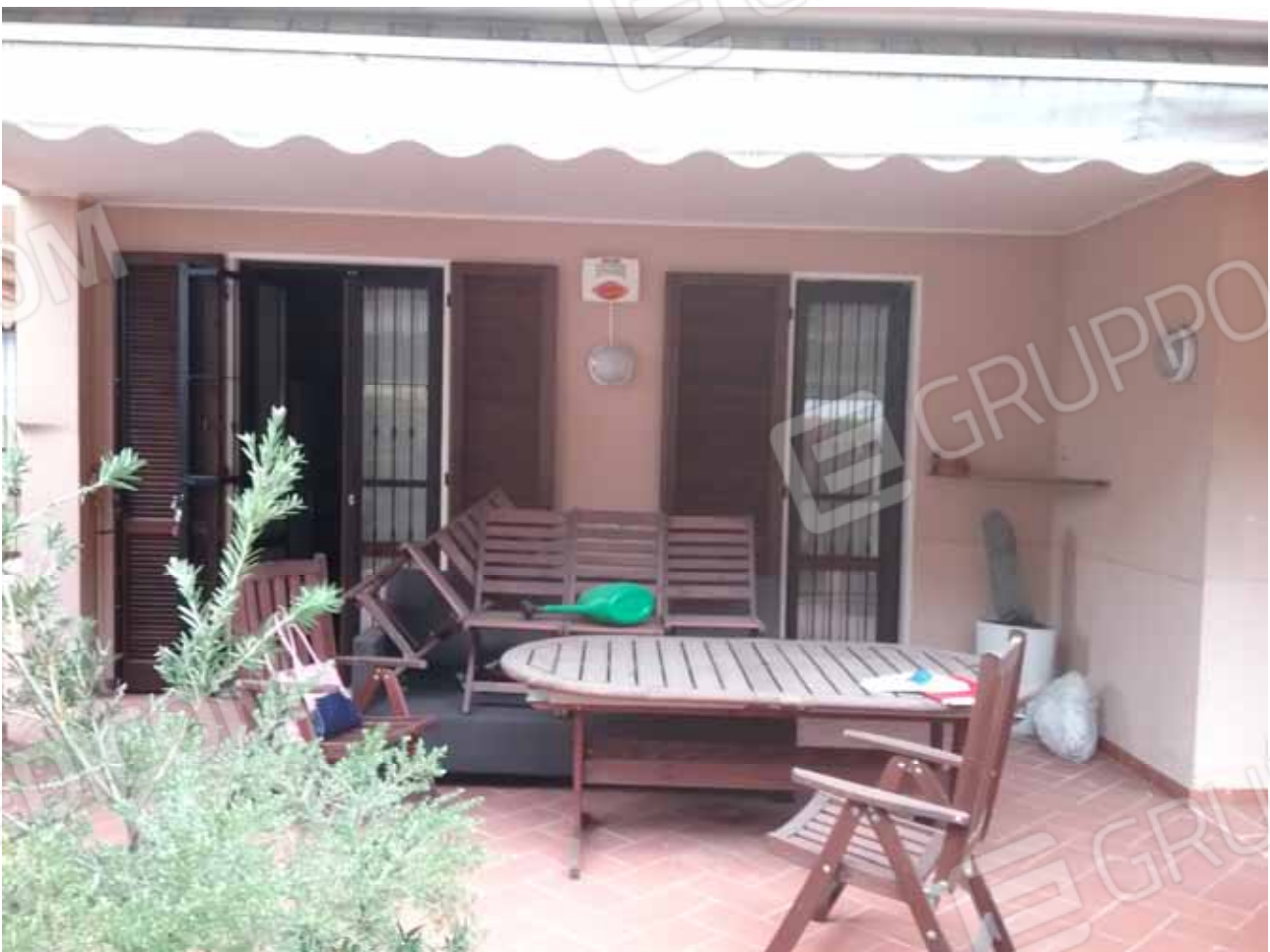
Foto 38: Portico e giardino esclusivo del monolocale INTERNO 3 - LOTTO n. 3

LOTTO 3: APPARTAMENTO ottenuto dall' unione di un monolocale al piano terra con portico e giardino esclusivi: INTERNO 3 con annessa cantina nel piano seminterrato censito nel Catasto Fabbricati del Comune di Manerba del Garda (BS) al foglio 8, mapp. 2738 Sub 39 con Prot. 11690-16906, Cat. A/2, ripostiglio: wc censito al foglio 8, mapp. 2738 Sub 47 con Prot. 16914, Cat. C/2, posto auto: "C" censito al foglio 8, mapp. 2738 Sub 78 con Prot. 16946, Cat. C/6 e proprietà indivisa pro quota 25,99/1000 della piscina e locali accessori censiti al foglio 8, mapp. 2738 Sub 43 con Prot. 16910, Cat. D/6 e bilocale al piano terra con giardino esclusivo: INTERNO 2 con annessa cantina nel piano seminterrato censito al foglio 8, mapp. 2738 Sub 40 con Prot. 16907, Cat. A/2, autorimessa: "G7" al piano seminterrato censita al foglio 8, mapp. 2738 Sub 54 con Prot. 16922, Cat. C/6, ripostiglio: doccia censito al foglio 8, mapp. 2738 Sub 45 con Prot. 16912, Cat. C/2, posto auto: "R" censito al foglio 8, mapp. 2738 Sub 87 con Prot. 16955, Cat. C/6 e proprietà indivisa pro quota 38,70/1000 della predetta piscina e locali accessori; il tutto facente parte del Condominio "Residence agli Oleandri" in via degli Alpini nn. 52-54 Manerba Del Garda (BS).