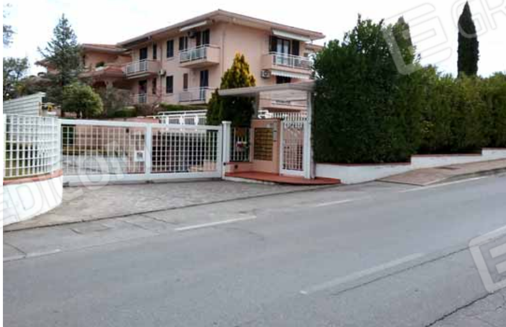
FOTO 3: Accessi: pedonale e carraio al Residence agli Oleandri dal n. civico 54 di via degli Alpini