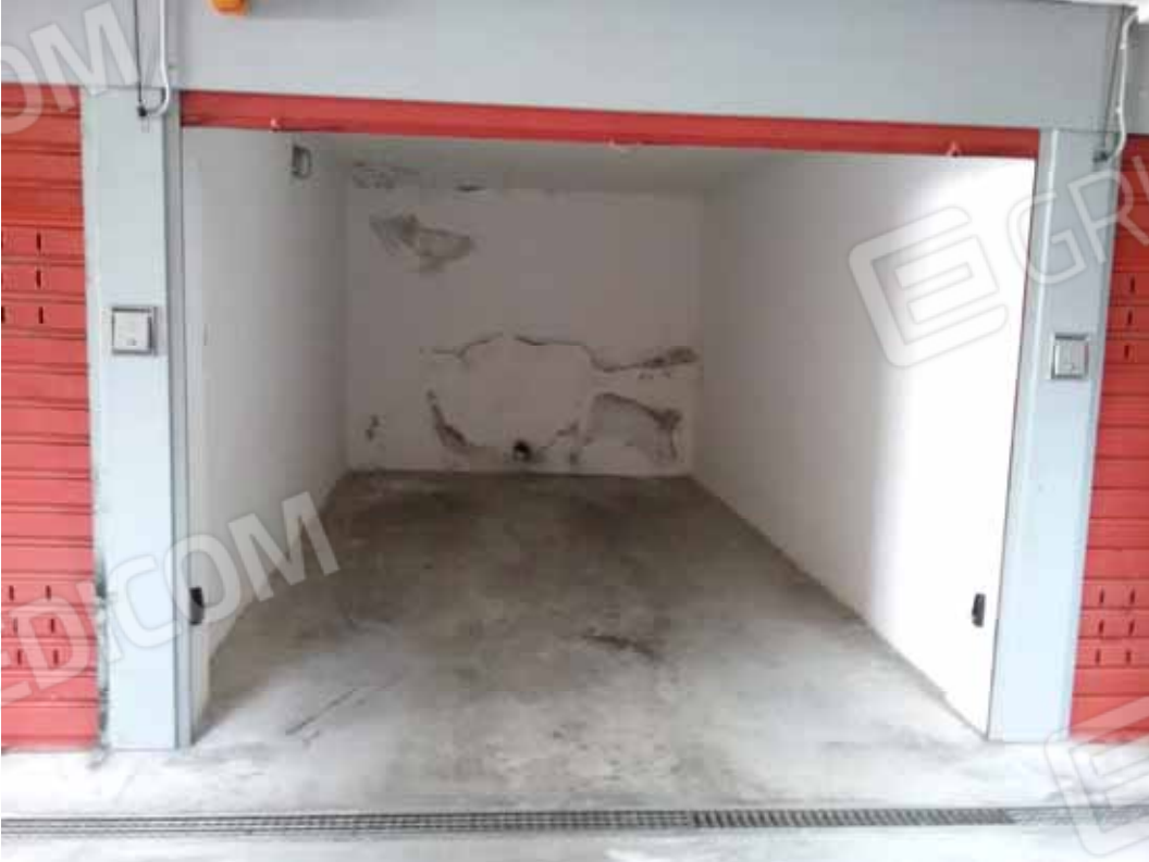
Foto 54: Interno dell' autorimessa "G7" con rilevate macchie d' umidità - LOTTO n. 3