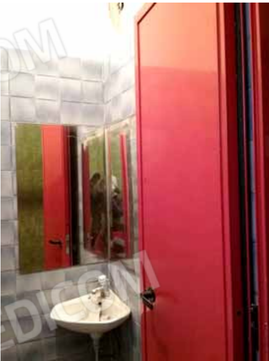
Foto 56: Ripostiglio adibito a servizio igienico esclusivo limitrofo alla piscina ed ai locali accessori comuni - LOTTO n. 3