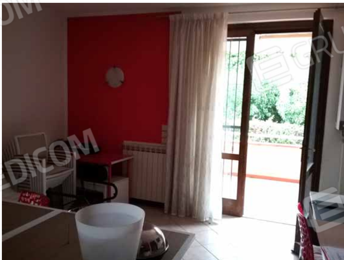
Foto 22: Accesso dalla terrazza esclusiva all'unità abitativa del LOTTO n. 1