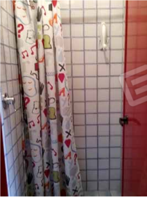
Foto 55: Ripostiglio doccia esclusivo, limitrofo all' area piscina - LOTTO n. 3