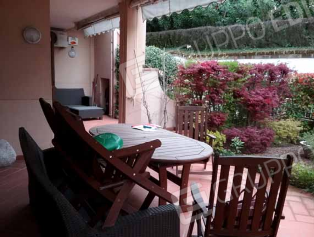
Foto 39: Altra veduta del portico esclusivo del monocale - LOTTO n. 3