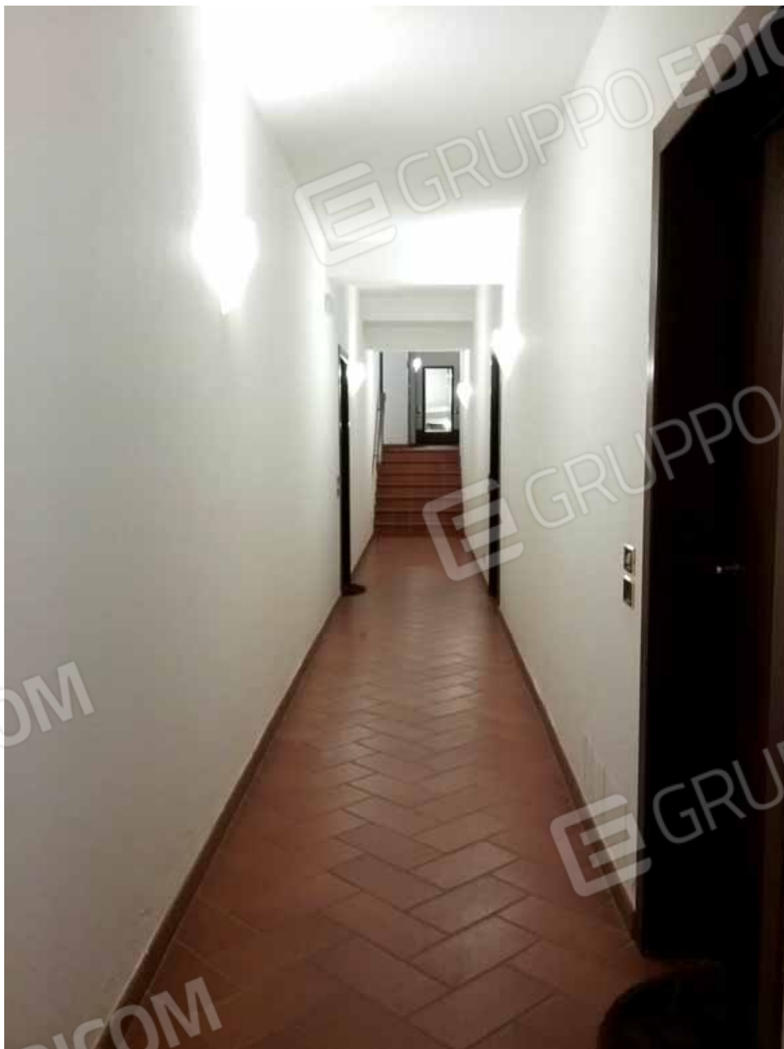
FOTO 17: Veduta interna del disimpegno comune di accesso alle unità abitative, cantine esclusive, locali accessori esclusivi: docce e wc, ai locali comuni: servizi igienici, spogliatoi, vani tecnici d'ispezione della piscina ed alla medesima