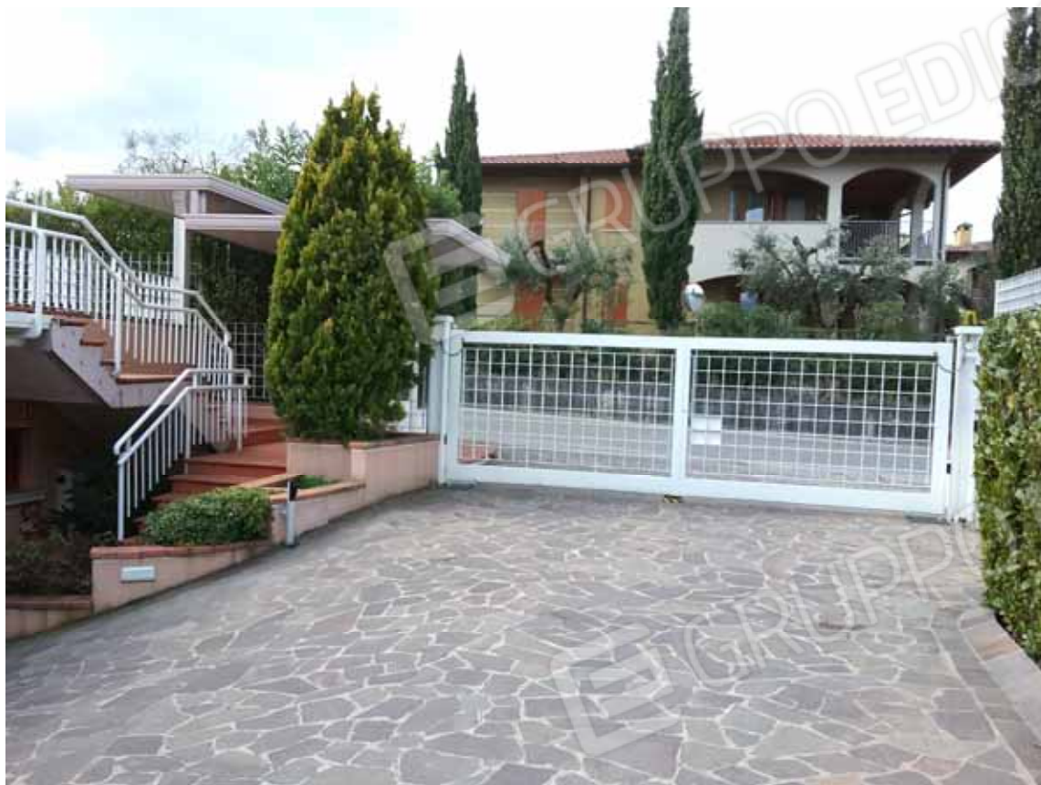
FOTO 7: Veduta dell' ingresso carraio con lo scivolo di accesso ai box auto ubicati nel piano seminterrato.