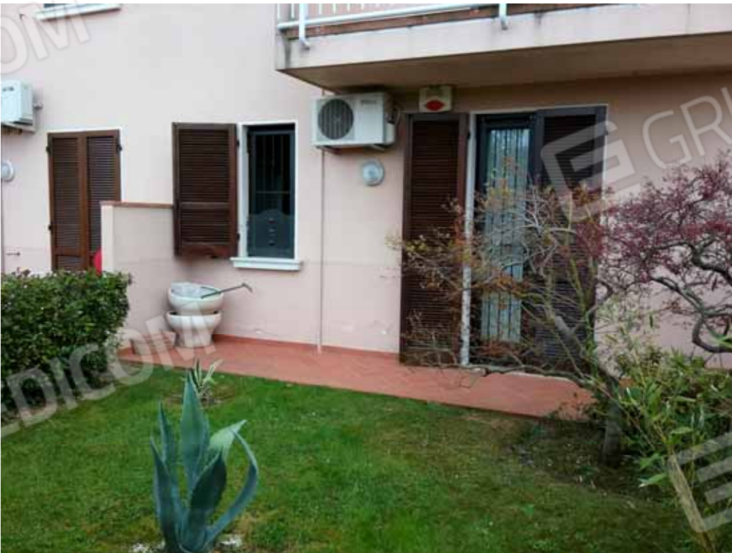
Foto 47: Giardino esclusivo contiguo con il bilocale INTERNO 2 - LOTTO n. 3