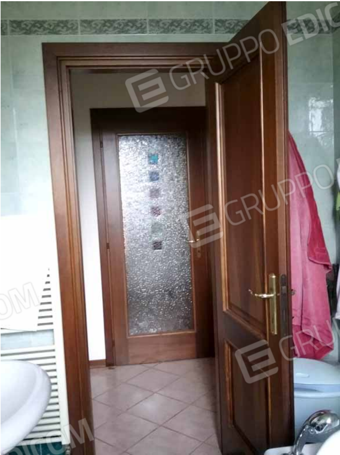
Foto 52: Dettagli delle porte del bilocale INTERNO 2 - LOTTO n. 3