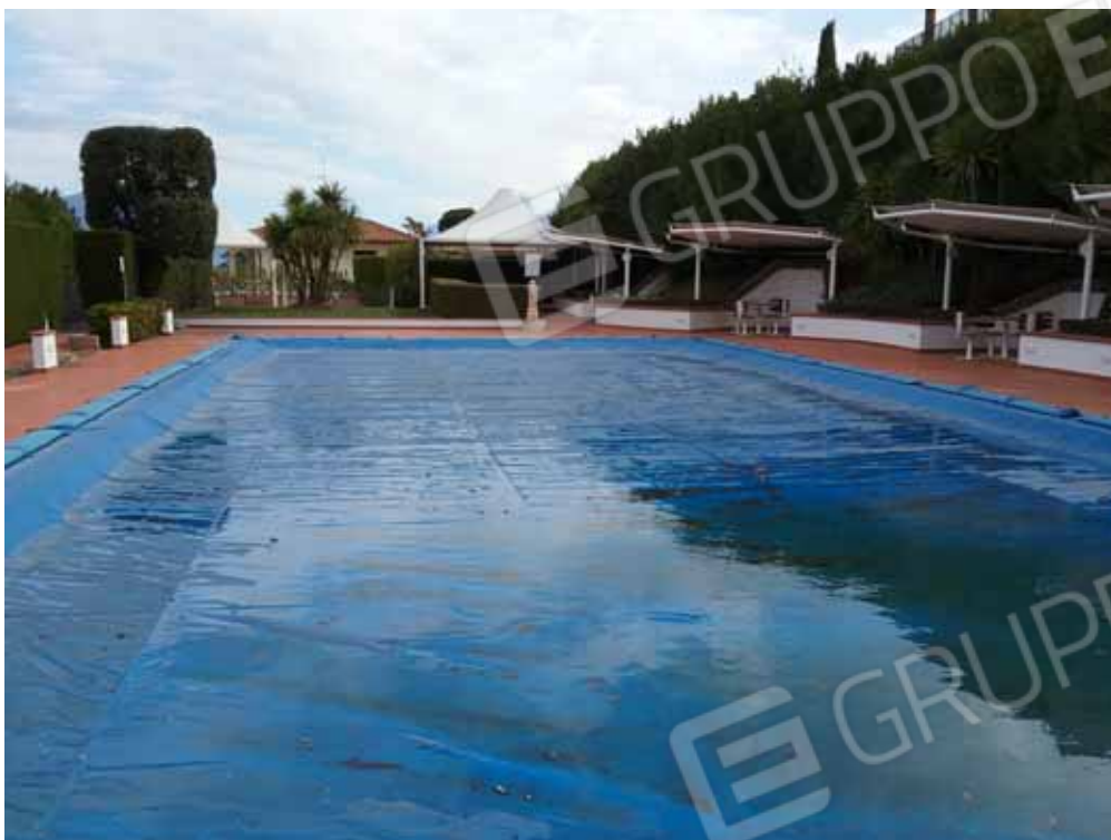
FOTO 14: Altra veduta panoramica della piscina e dei gazebo condominiali