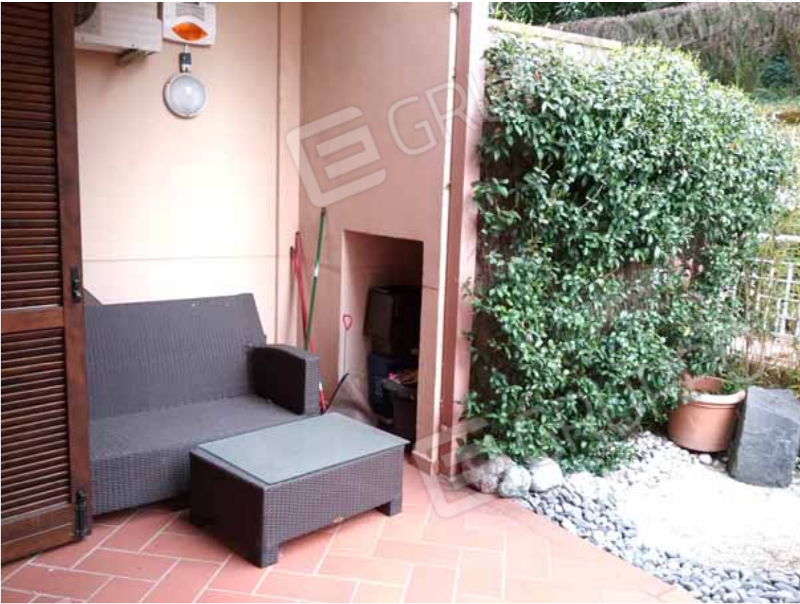
Foto 31: Veduta del portico e della corte esclusiva del LOTTO n. 2