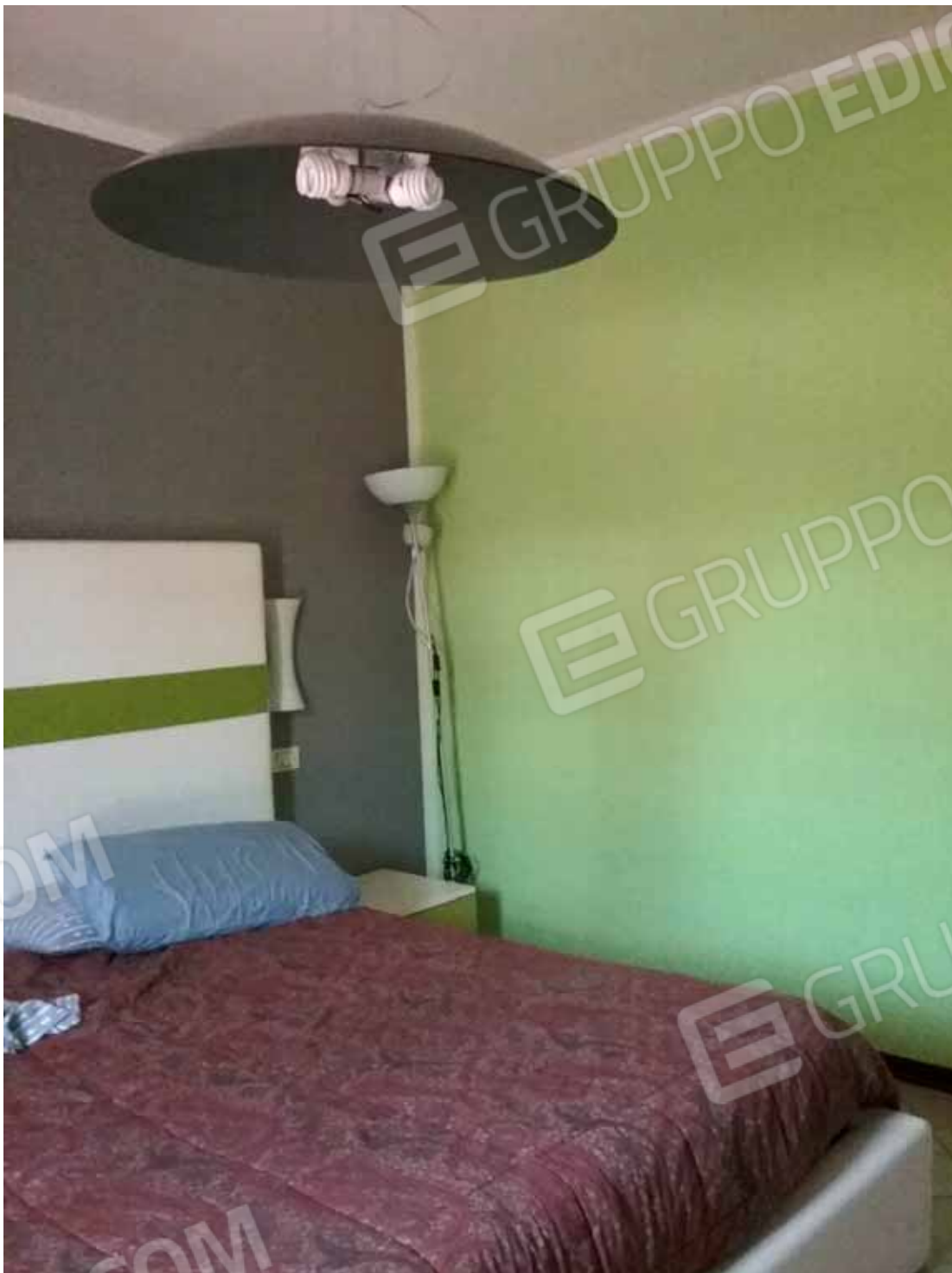
Foto 25: camera matrimoniale dell' unità abitativa del LOTTO n. 1