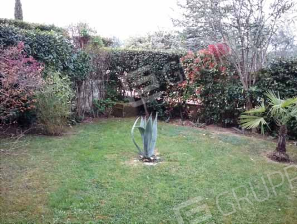
Foto 46: Veduta del giardino esclusivo del bilocale INTERNO 2 - LOTTO n. 3