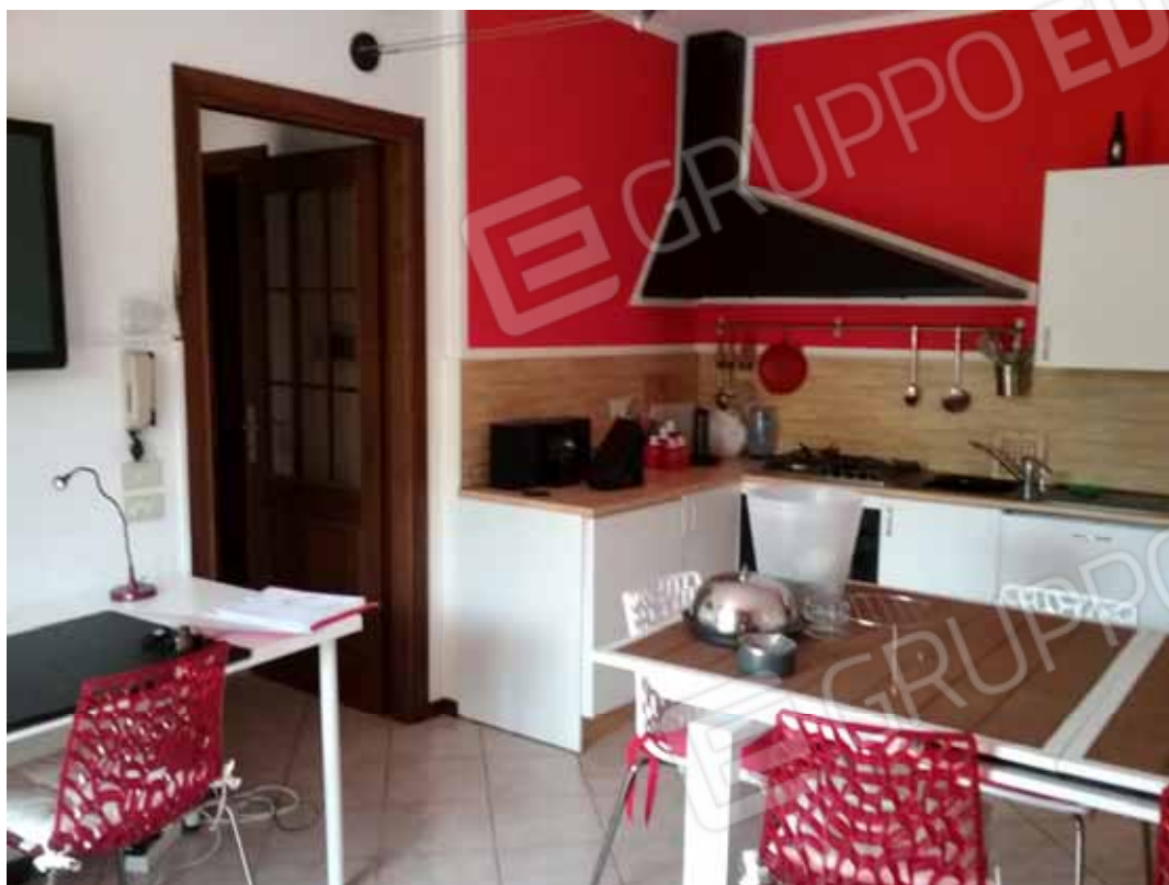
Foto 21: Soggiorno con angolo cottura dell'unità abitativa del LOTTO n. 1