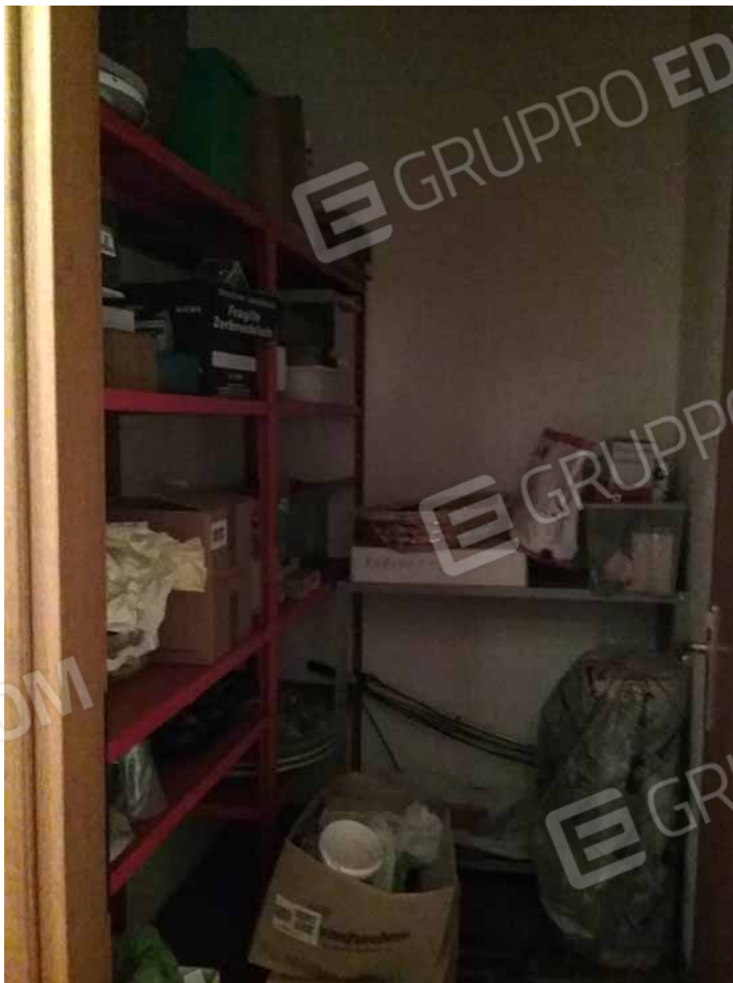
Foto 57: Cantina esclusiva annessa al bilocale INTERNO 2 - LOTTO n. 3