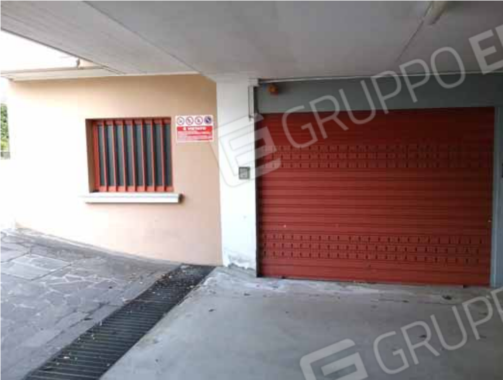
Foto 27: ampia autorimessa denominata: "G20" con apertura automatizzata - LOTTO n. 1