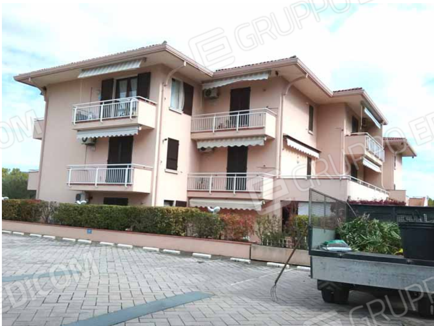
FOTO 1: Veduta del Residence agli Oleandri dal parcheggio condominiale interno

“RESIDENCE AGLI OLEANDRI” Via degli Alpini nn. 52-54