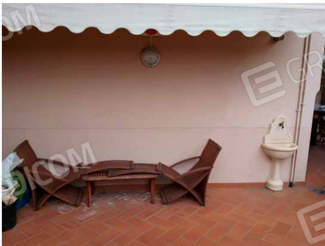
Foto 45: Percorso pedonale di collegamento tra la corte ed il giardino esclusivi del bilocale INTERNO 2 - LOTTO n. 3