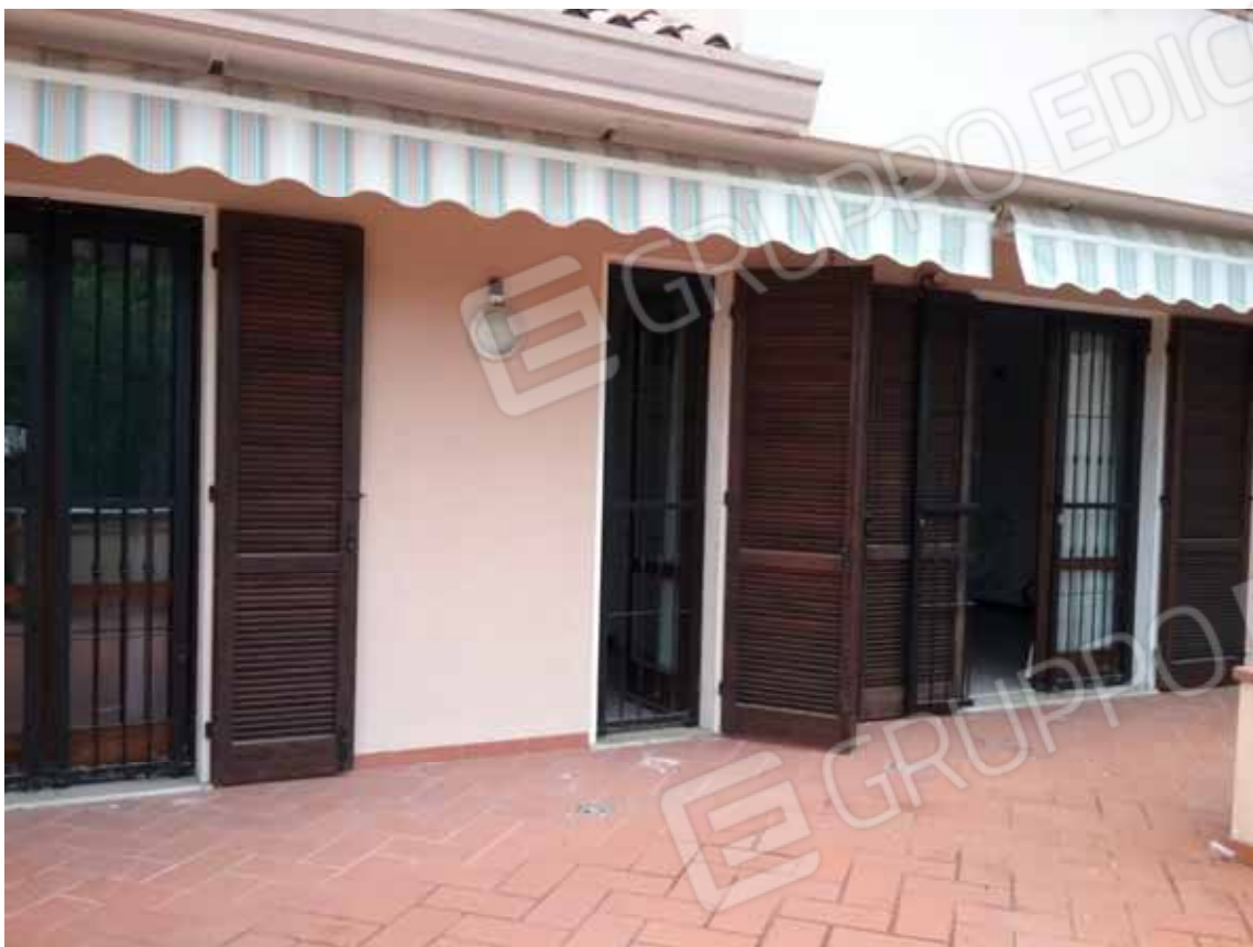
Foto 19: Terrazza esclusiva con l'accesso all'unità abitativa al 1° piano del LOTTO n. 1