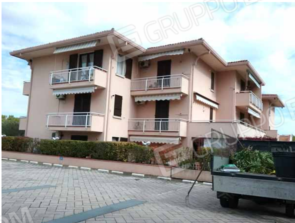
FOTO 11: Veduta d' insieme dei posti auto esclusivi dei condomini del Residence agli Oleandri