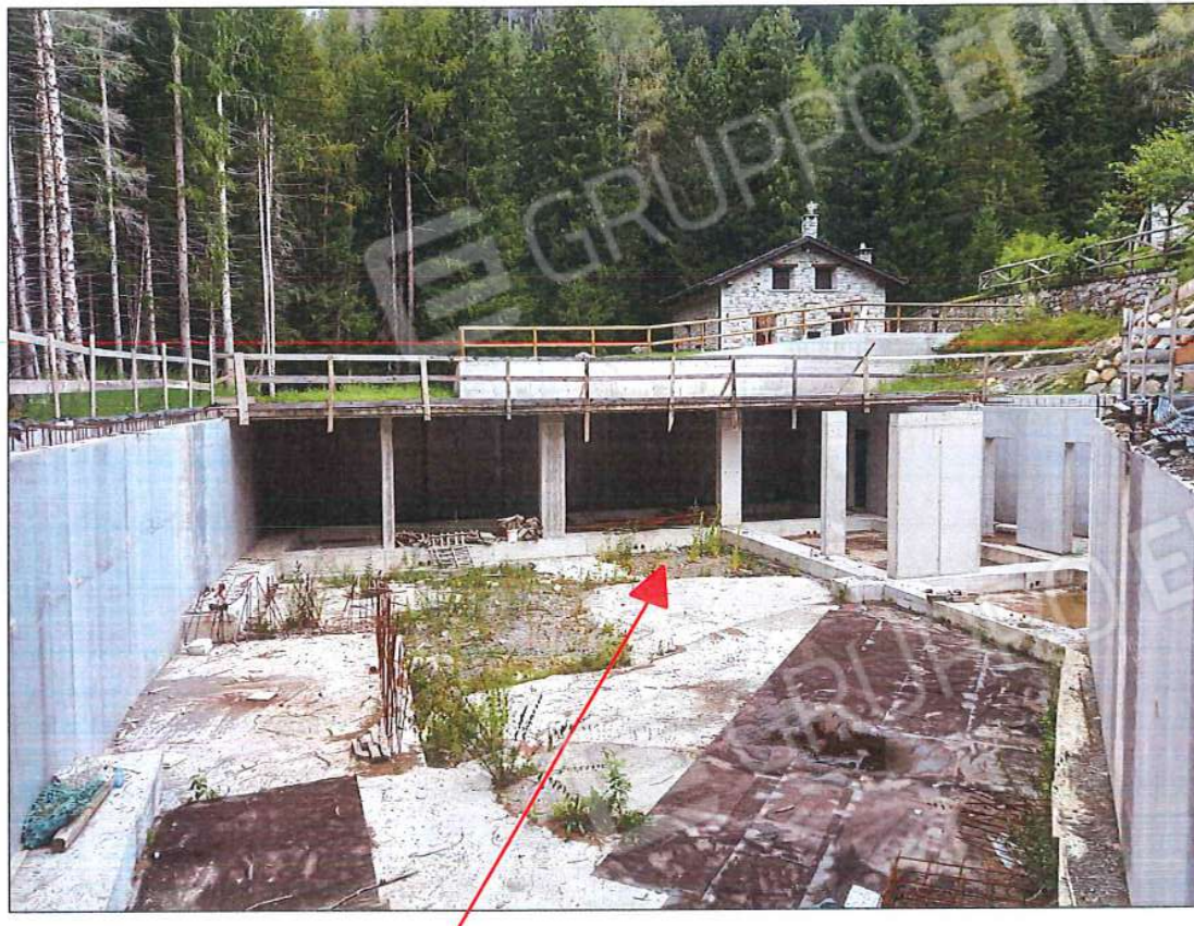
Immobile oggetto di stima, sez. urb. NCT, foglio n. 66, particella n. 131, sub. n. 2