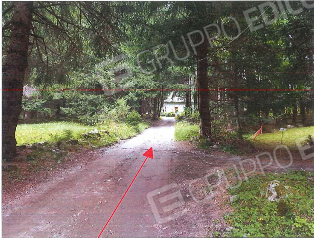
Strada comunale di accesso (via Case Sparse di Valsozzine)

Accesso all'immobile oggetto di stima, sez. urb. NCT, foglio n. 66, particella n. 131, sub. n. 2 dalla strada comunale di accesso (via Case Sparse di Valsozzine)