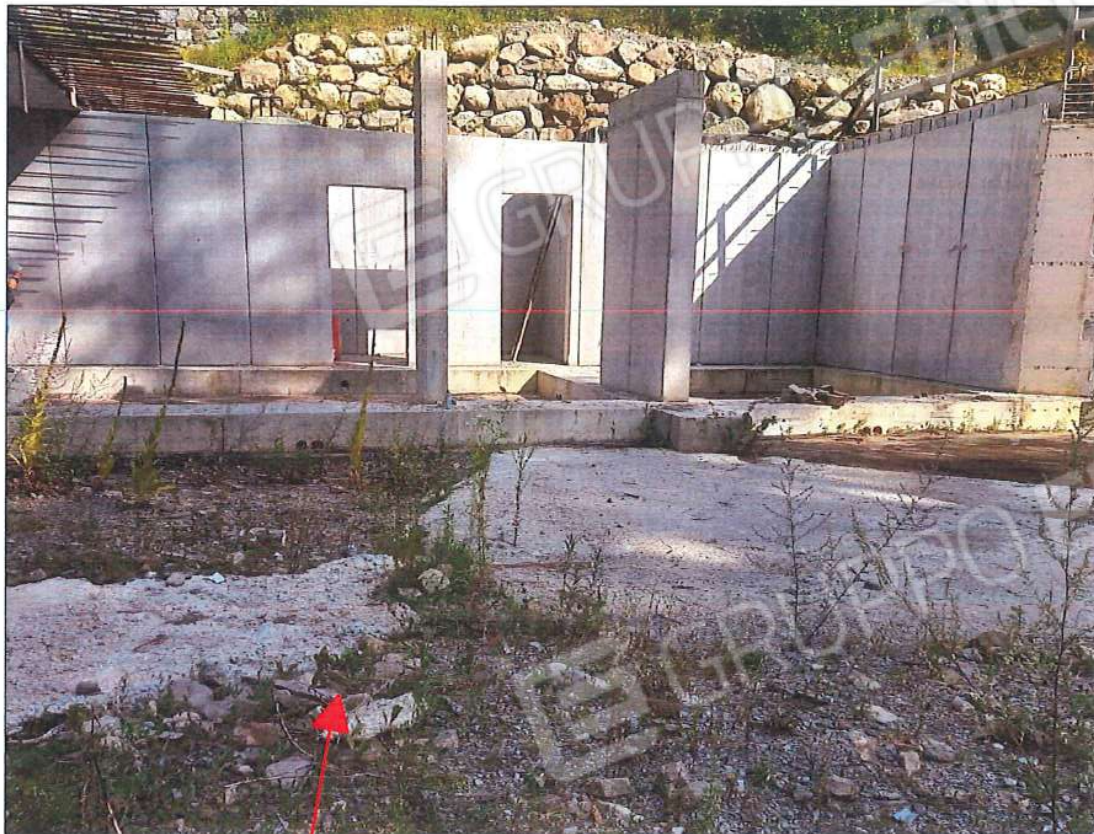
Immobile oggetto di stima, sez. urb. NCT, foglio n. 66, particella n. 131, sub. n. 2