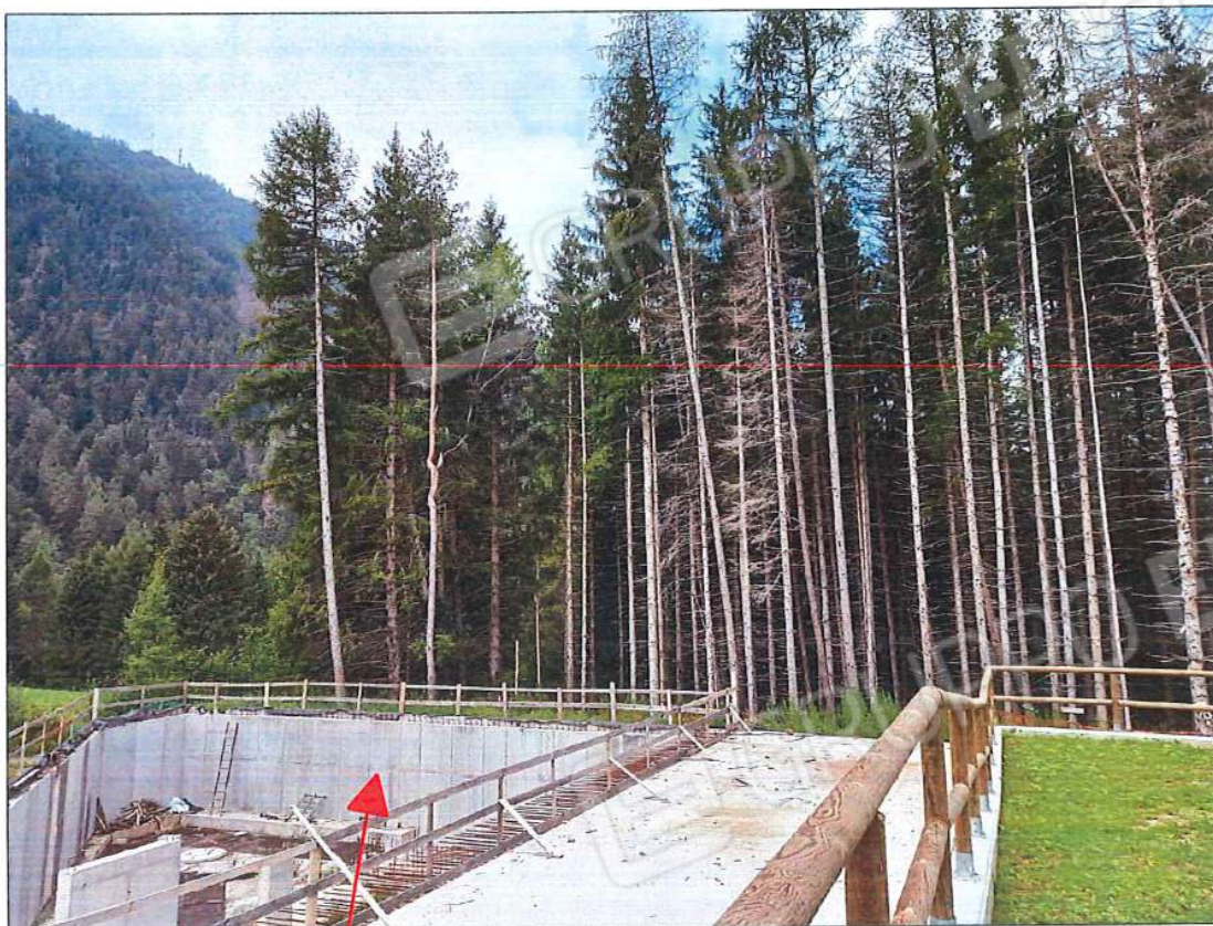
Immobile oggetto di stima, sez. urb. NCT, foglio n. 66, particella n. 131, sub. n. 2