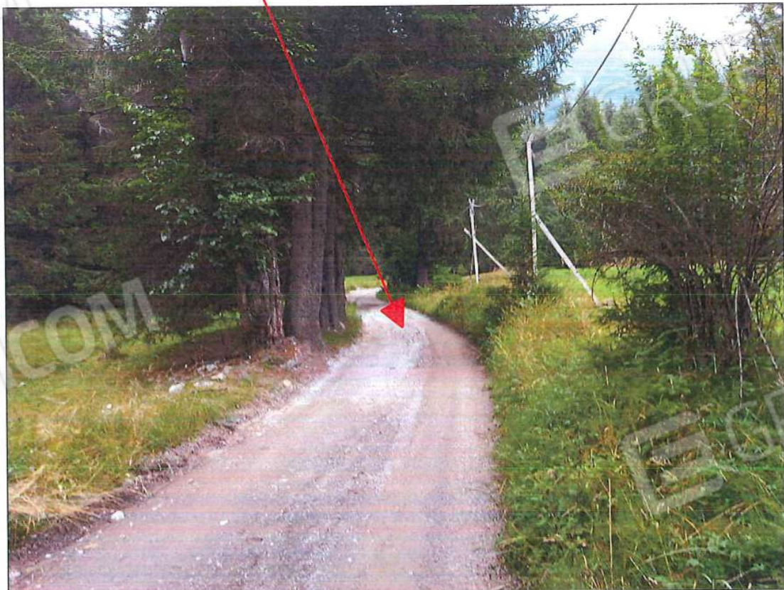
Strada comunale di accesso (via Case Sparse di Valsozzine)