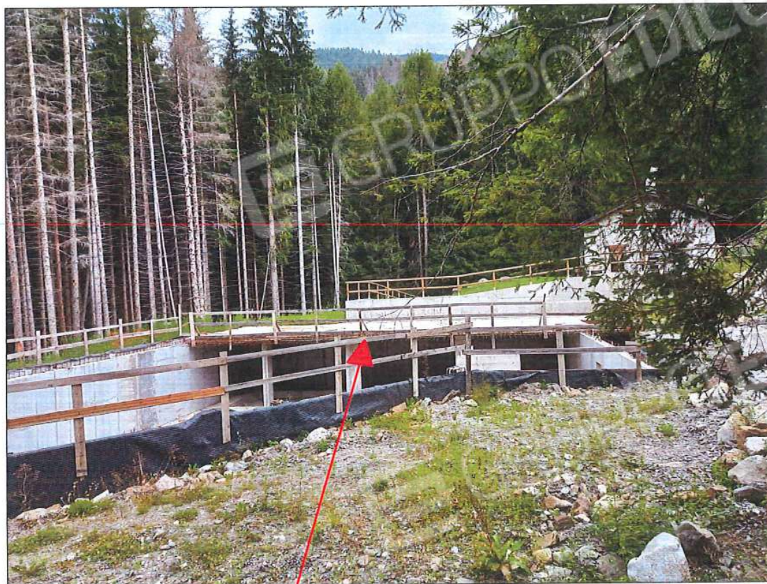
Immobile oggetto di stima, sez. urb. NCT, foglio n. 66, particella n. 131, sub. n. 2