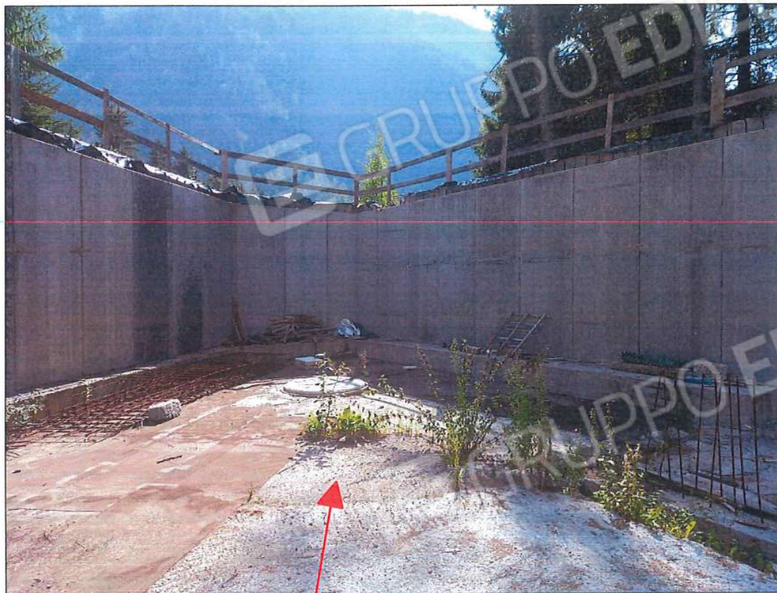
Immobile oggetto di stima, sez. urb. NCT, foglio n. 66, particella n. 131, sub. n. 2