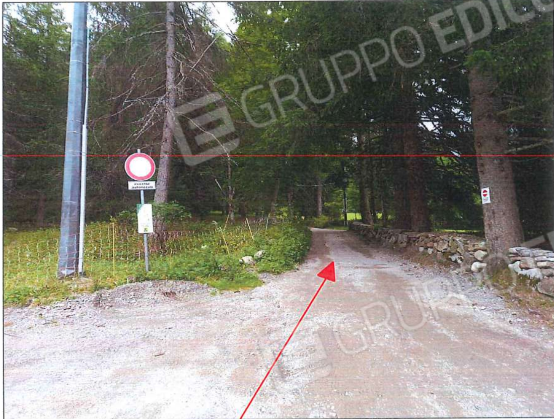
Strada comunale di accesso (via Case Sparse di Valsozzine) con il segnale di divieto di transito eccetto autorizzati