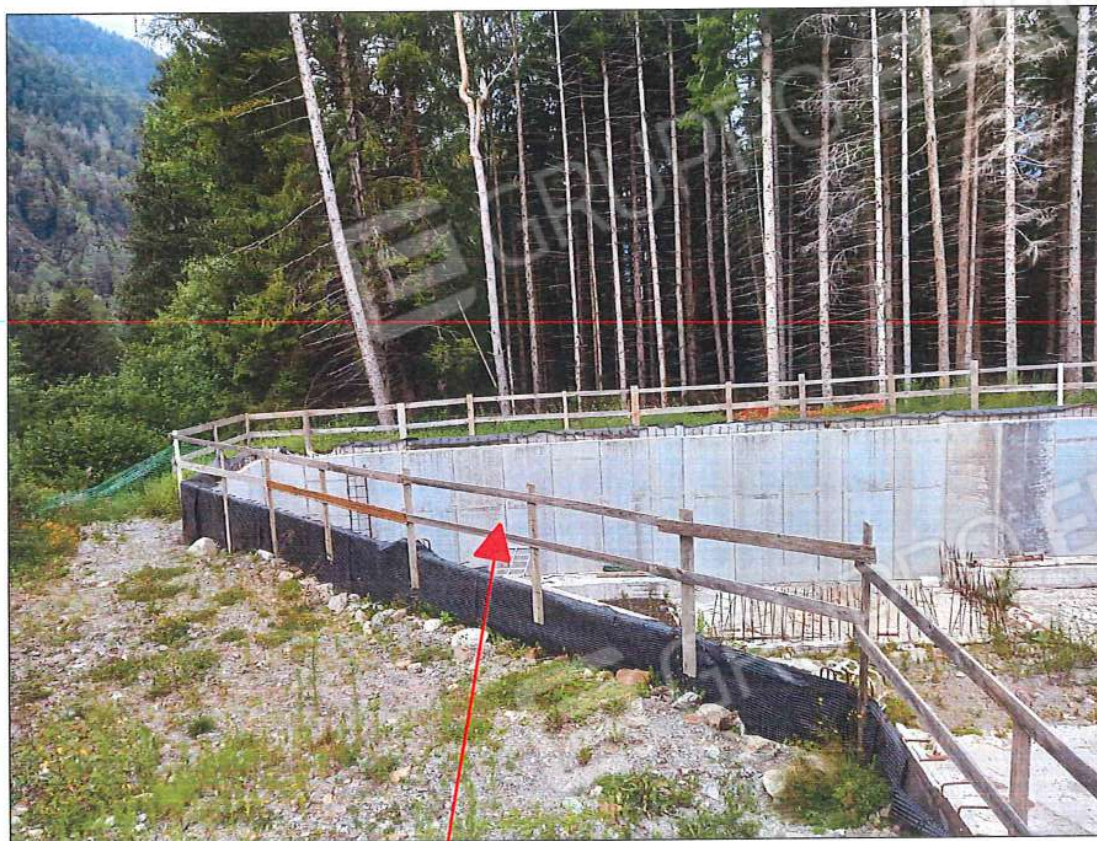
Immobile oggetto di stima, sez. urb. NCT, foglio n. 66, particella n. 131, sub. n. 2