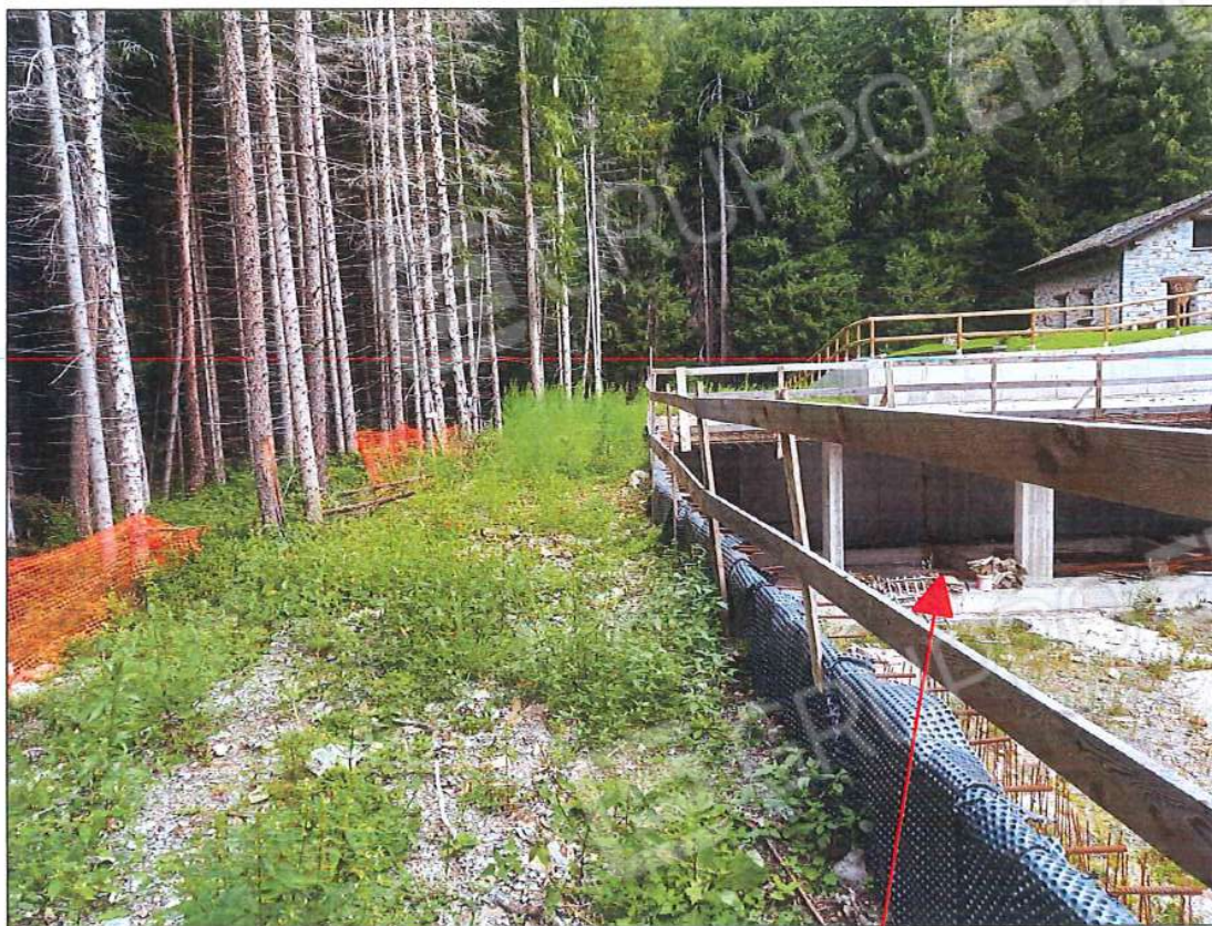
Immobile oggetto di stima, sez. urb. NCT, foglio n. 66, particella n. 131, sub. n. 2