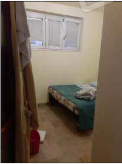
Camera matrimoniale con finestra rialzata che va sulla scala di collegamento piano primo sub 13 con disimpegno di pertinenza sub 13 al piano terra