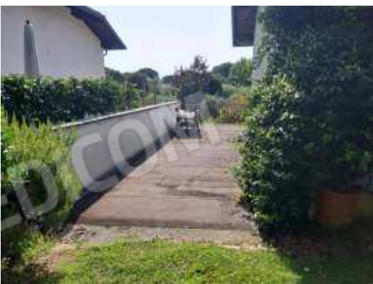
Balcone laterale uso esclusivo app. sub 13