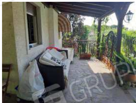
Portico in legno uso esclusivo appartamento sub 13