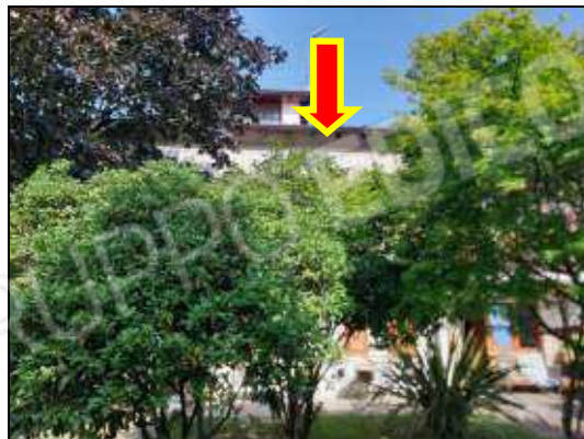
Unità immobiliare piano terra sub 13