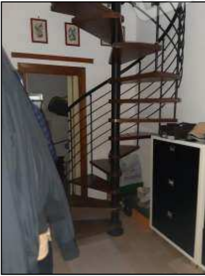
Scala di collegamento a chiocciola appartamento piano terra sub 12 con appartamento piano primo sub 13