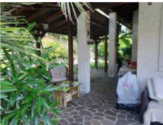
Portico in legno uso esclusivo appartamento sub 13