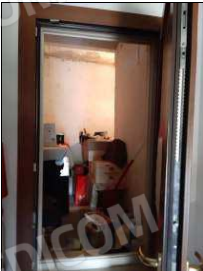
Nel disimpegno esiste una finestra che porta sottoscala utilizzato come ripostiglio vano abusivo