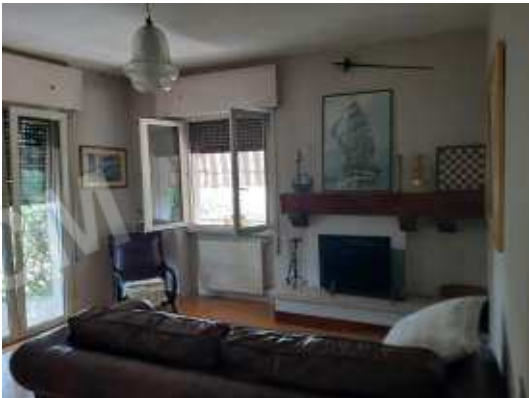
Soggiorno con camino a pellet