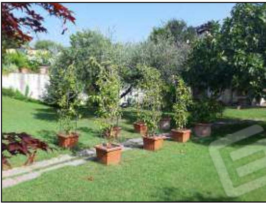
giardino comune alle due unità immobiliari – sub 15