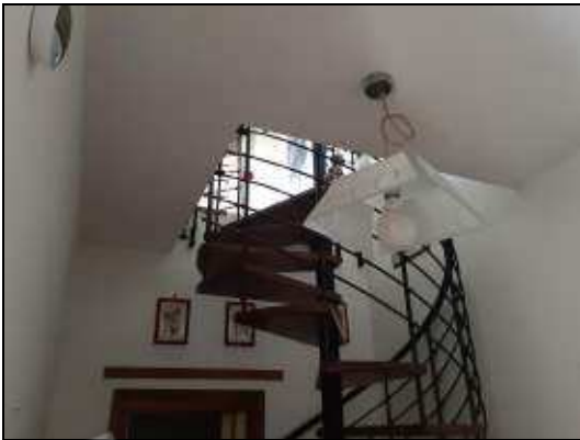
Foro nel solaio per passaggio scala a chiocciola