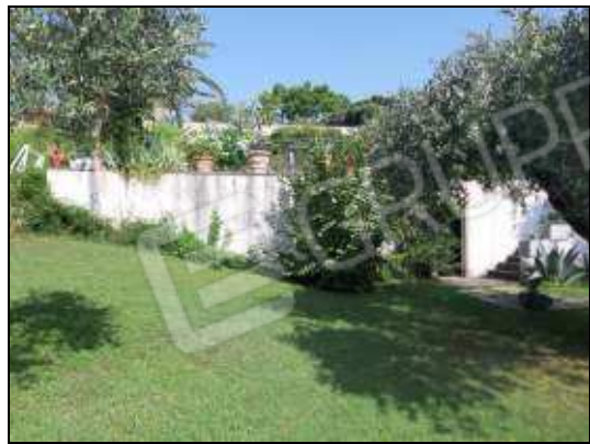
Scala di collegamento tra giardino comune (sub 15) e piscina comune (sub 14)