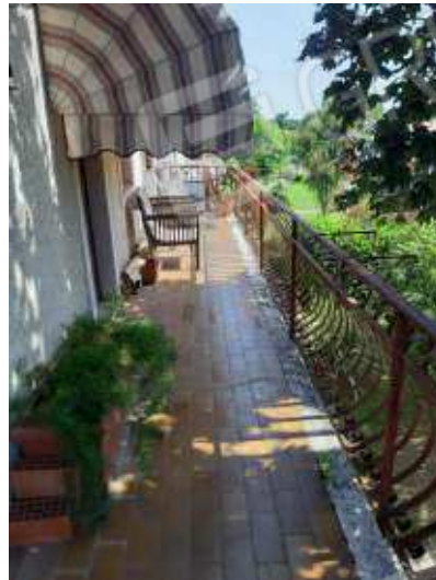
Balcone con accesso dal soggiorno