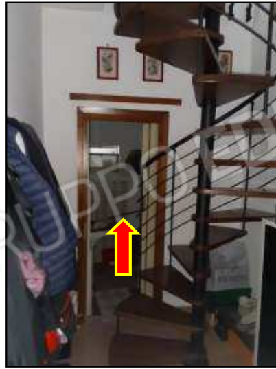
porta a soffietto che porta al secondo bagnetto