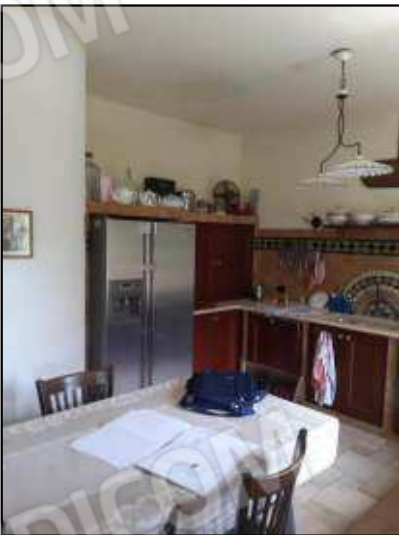
Cucina in muratura