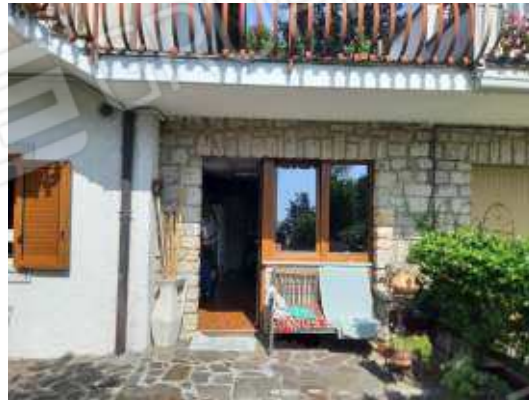
esterno disimpegni piano terra di uso escluso dell'appartamento piano primo sub 13

Formalmente è una rimessa, il cambio di destinazione d'uso non è stato autorizzato abuso