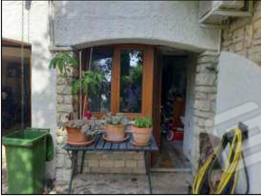
Ripostiglio esterno sub 12 non comunicante con interno abitazione