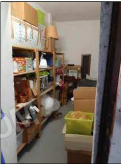
Interno alla porta porta – magazzino abusivo

La parte in fondo al ripostiglio e la porta a dx che conduce ad un secondo magazzino è da ritenersi abusiva