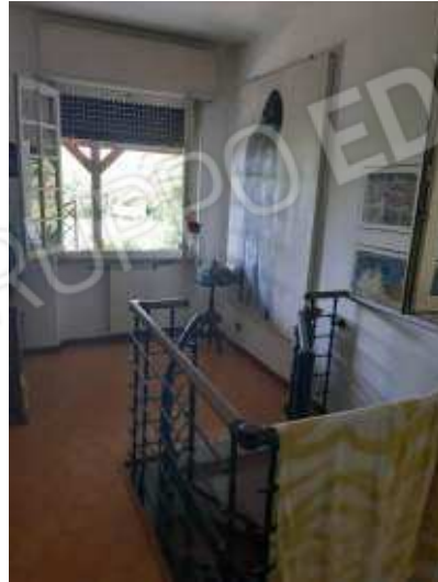
a lato ingresso scala di collegamento piano terra / primo abusiva