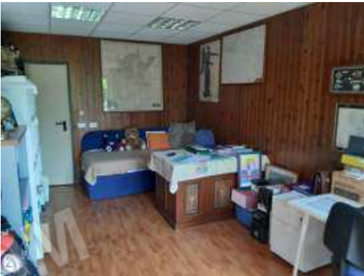
Interno secondo disimpegno

Formalmente è una rimessa, il cambio di destinazione d'uso non è stato autorizzato abuso