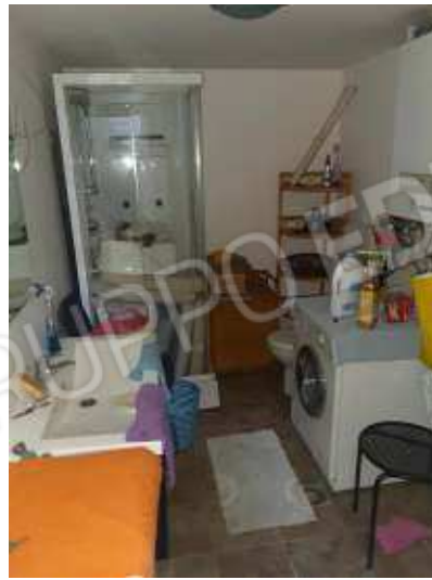
interno disimpegno sub 13

Formalmente è una rimessa, il cambio di destinazione d'uso non è stato autorizzato abuso