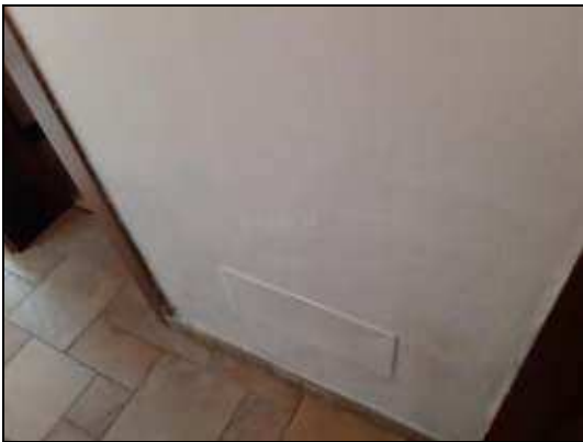
Problemi di umidità nella spalla di muro tra bagno / camera – nel disimpegno La proprietà afferma essere conseguente alla Ristrutturazione del bagno