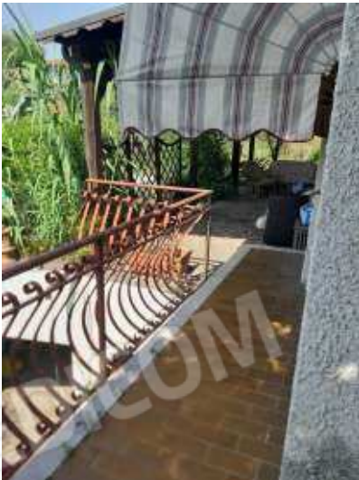
Balcone con accesso dal soggiorno