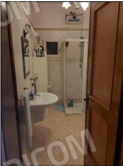
Bagno con finestrelle con apertura nel sottoscala