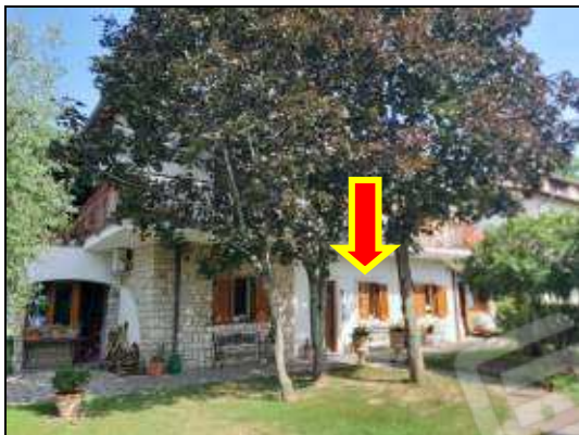
Unità immobiliare piano terra sub 12