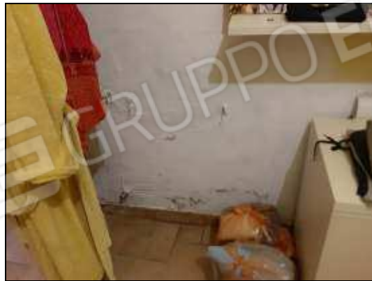
Problemi di umidità in camera sul lato parete comune con il bagno