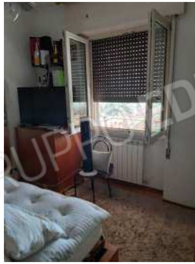
finestra prima camera