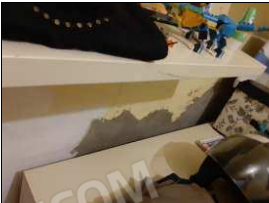
Problemi di umidità in camera sul lato parete comune con il bagno