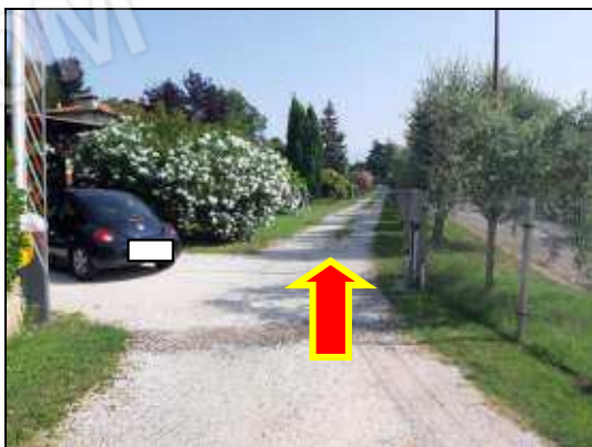
Servitù di passaggio registrata ai pubblici registri Immobiliari