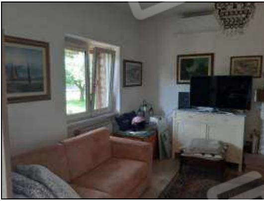
Soggiorno con camino a pellet