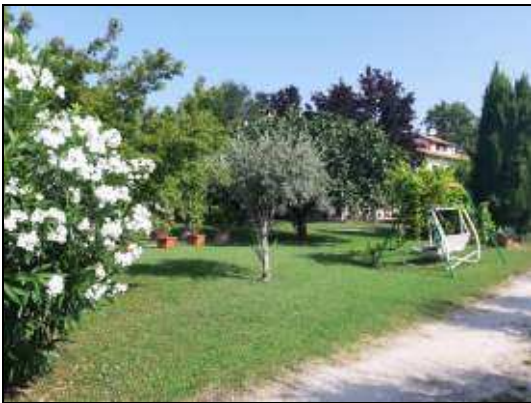
giardino comune alle due unità immobiliari – sub 15 vista del muro di contenimento della piscina (in comune)