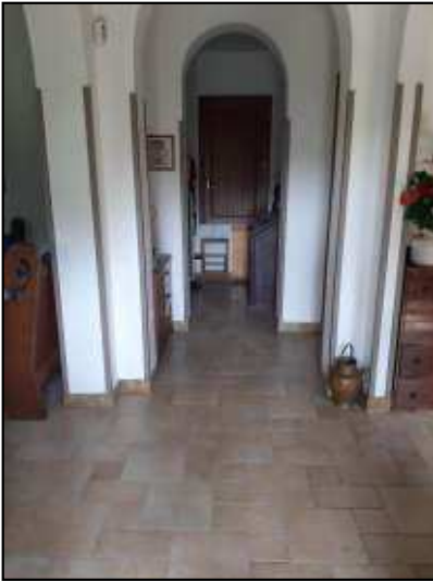
Accesso al disimpegno che conduce alla camera e ai bagni