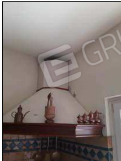
cappa cucina con problemi di umidità