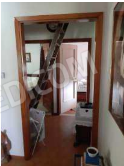
Disimpegno con scala a pioli che porta alla torretta sottotetto