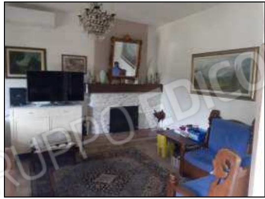
Soggiorno con camino a pellet