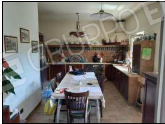
Cucina in muratura