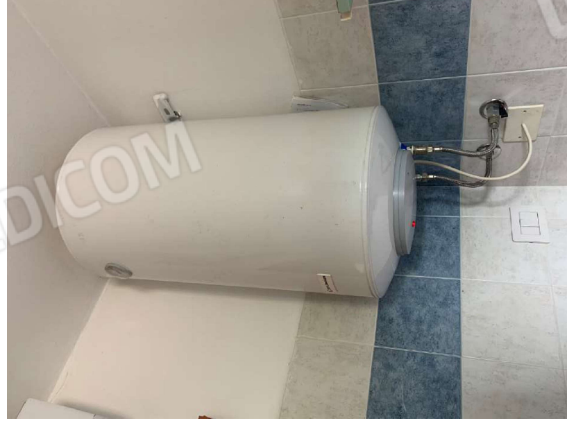
Boiler per ACS

Firmato Da: GENNARI SARA Emesso Da: ARUBAPEC S.P.A. NG CA.3 Serial#: 1046ae28e705b30a19431c5c767e2979