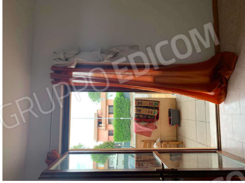
Porta d'ingresso principale