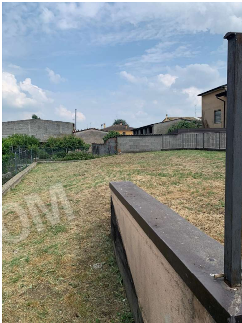
VISTA SUB 47 – AREA URBANA F1 VERDE