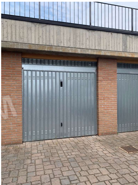
VISTA ESTERNA SUB 32 – BOX