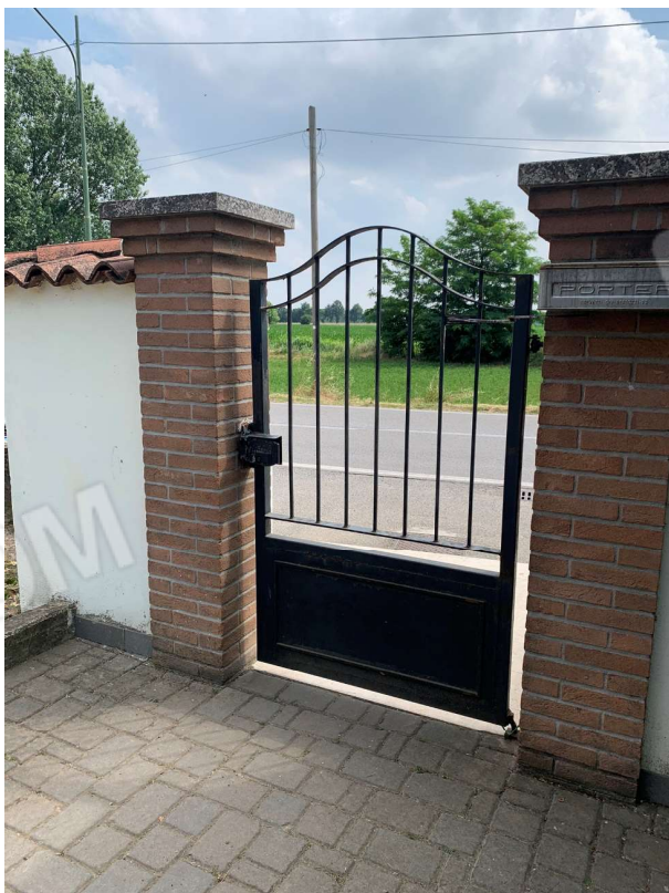
VISTA INTERNA ACCESSO PEDONALE