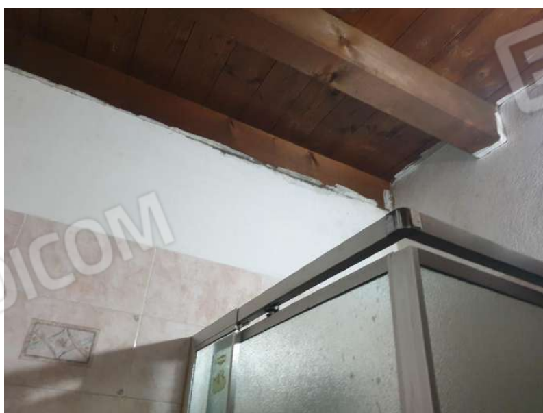
Figura 12 Bagno