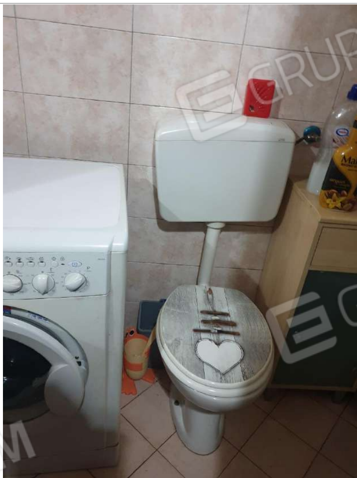
Figura 11 bagno