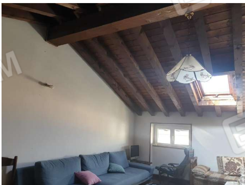
Figura 8 Vista sottotetto