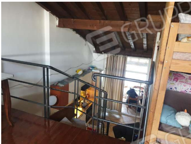
Figura 7 Vista zona giorno da sottotetto