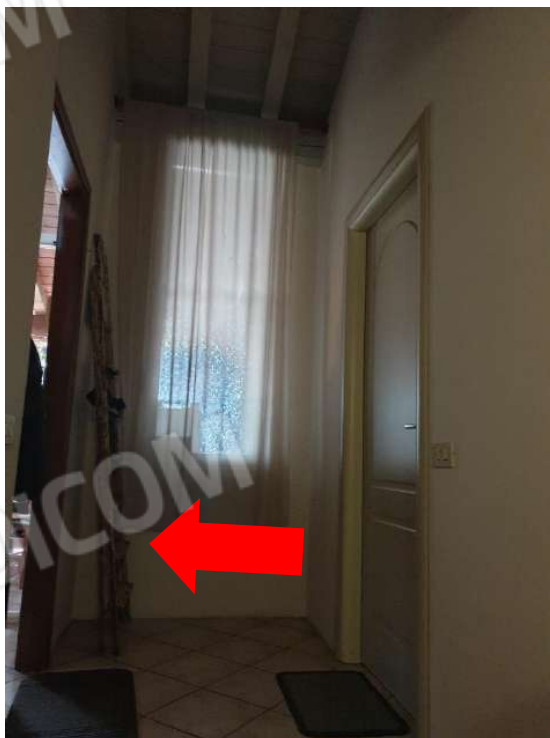
Figura 6 pianerottolo comune