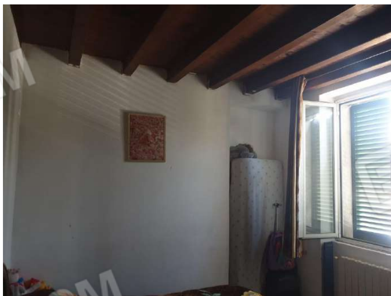
Figura 10 Camera piano primo