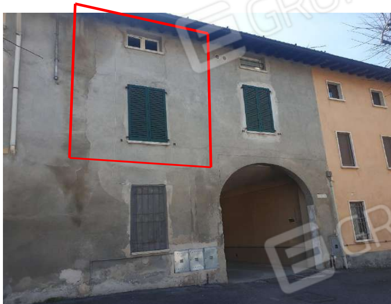
Figura 1 Vista su Via Castello