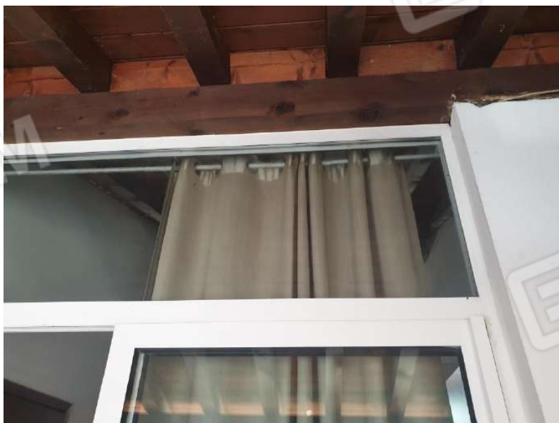
Figura 14 Loggia piano primo