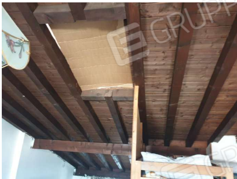
Figura 9 Sottotetto