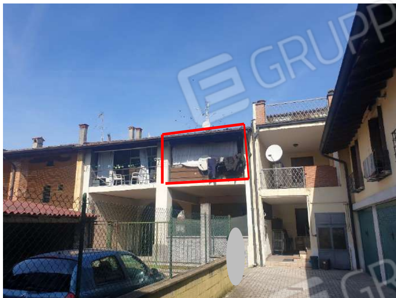
Figura 3 Vista cortile interno