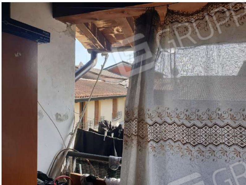
Figura 13 Loggia piano primo