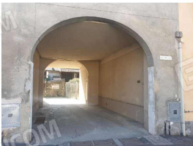
Figura 2 - Ingresso da Via Castello