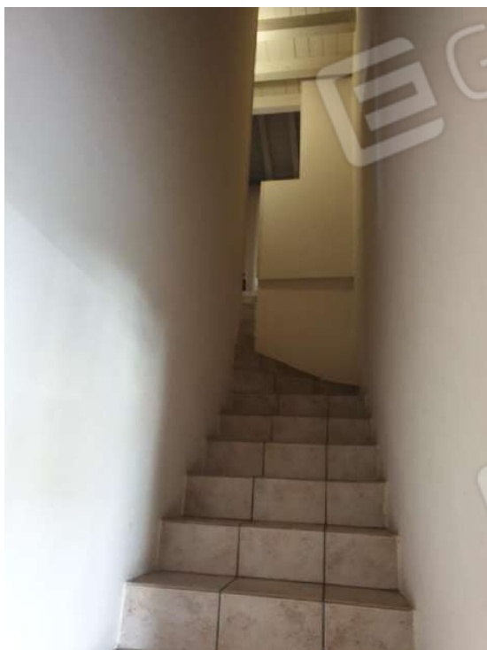
Figura 5 Scala ingresso comune