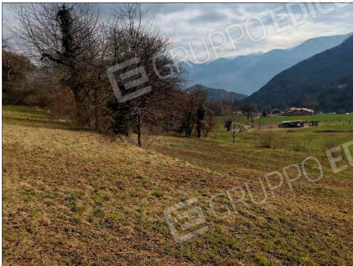
Fotografia n.08 (Rif.: Fg.25 - Mappali n.6208, n.6209, n.6212, n.6213, n.6214, n.6215, n.6216, n.6217, n.6218, n.6220, n.6222, n.6223, n.6224 e n.6225)