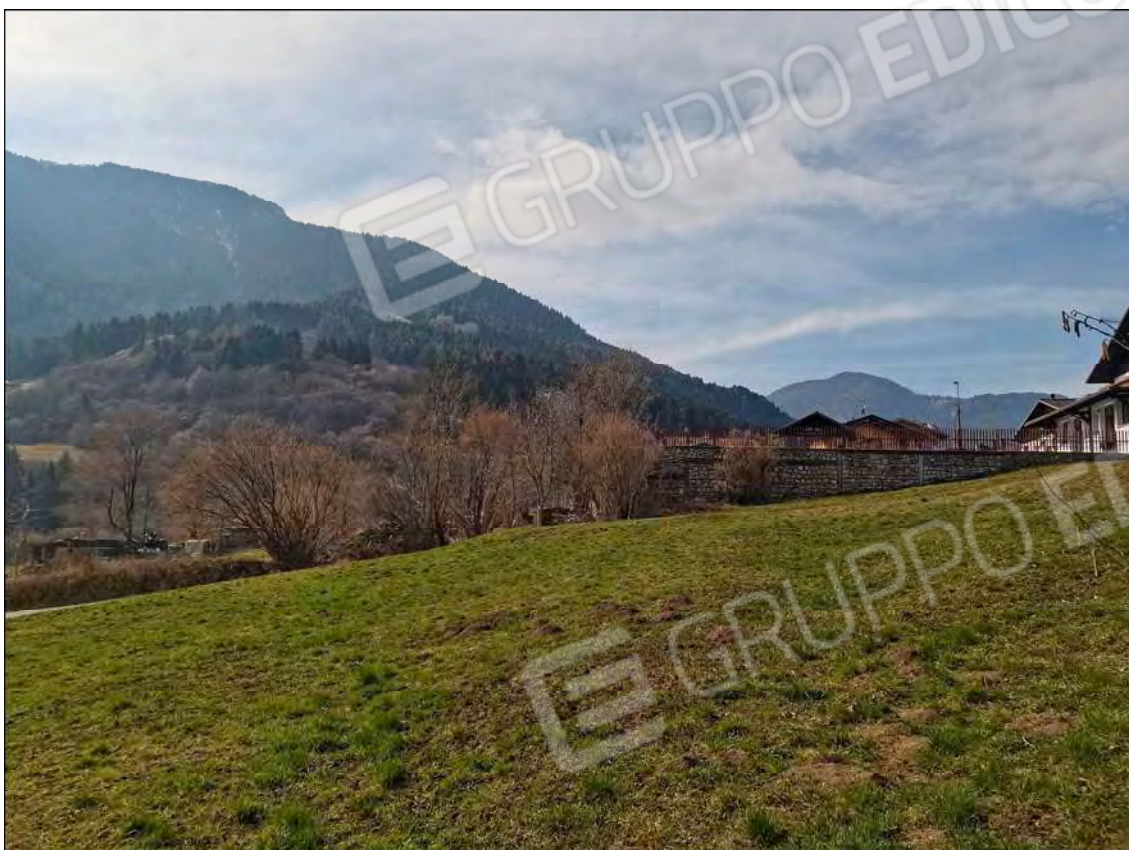
Fotografia n.12 (Rif.: Fg.25 - Mappali n.6208, n.6209, n.6212, n.6213, n.6214, n.6215, n.6216, n.6217, n.6218, n.6220, n.6222, n.6223, n.6224 e n.6225)