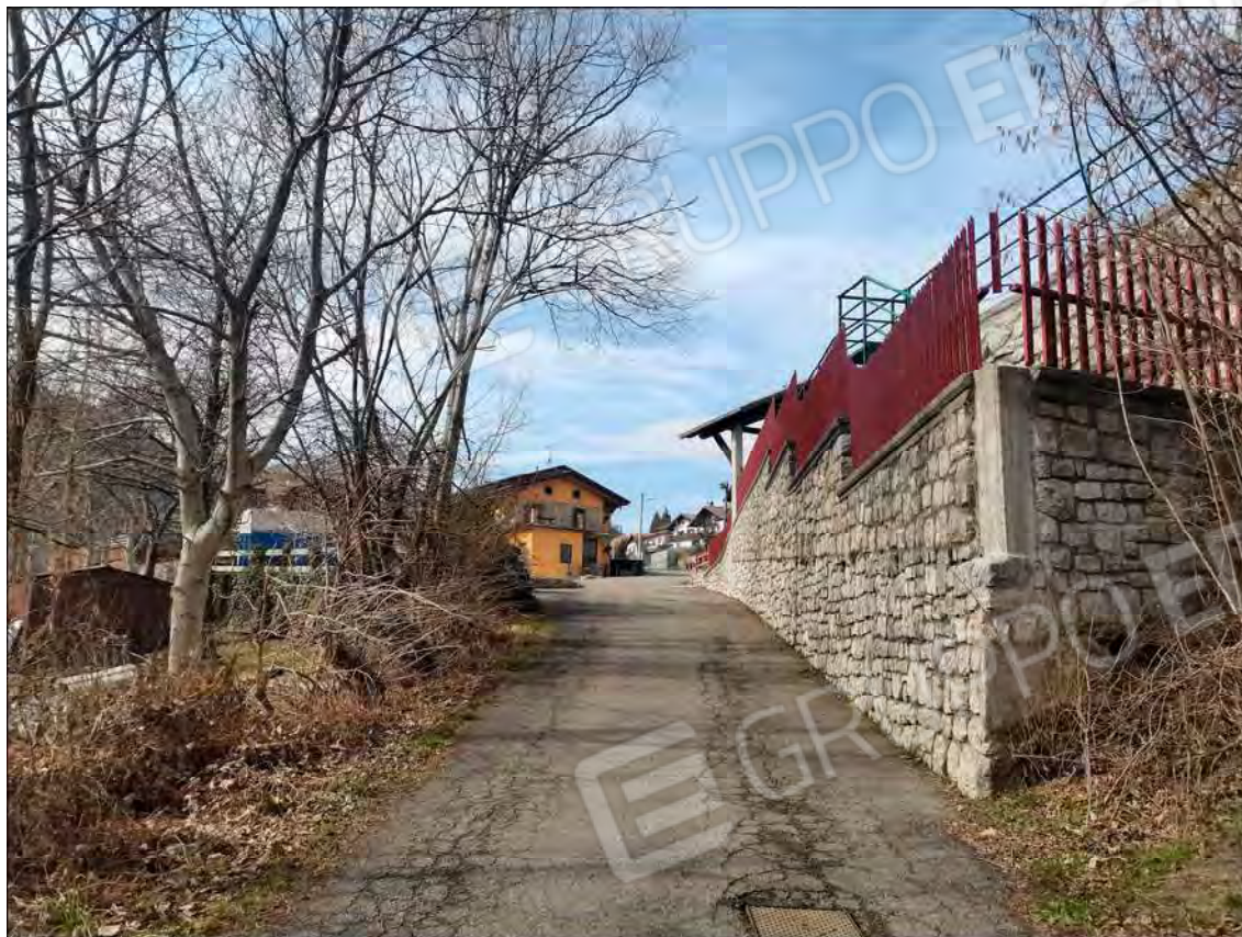
Fotografia n.02 (Rif.: Fg.25 - Mappali n.6208, n.6209, n.6212, n.6213, n.6214, n.6215, n.6216, n.6217, n.6218, n.6220, n.6222, n.6223, n.6224 e n.6225)