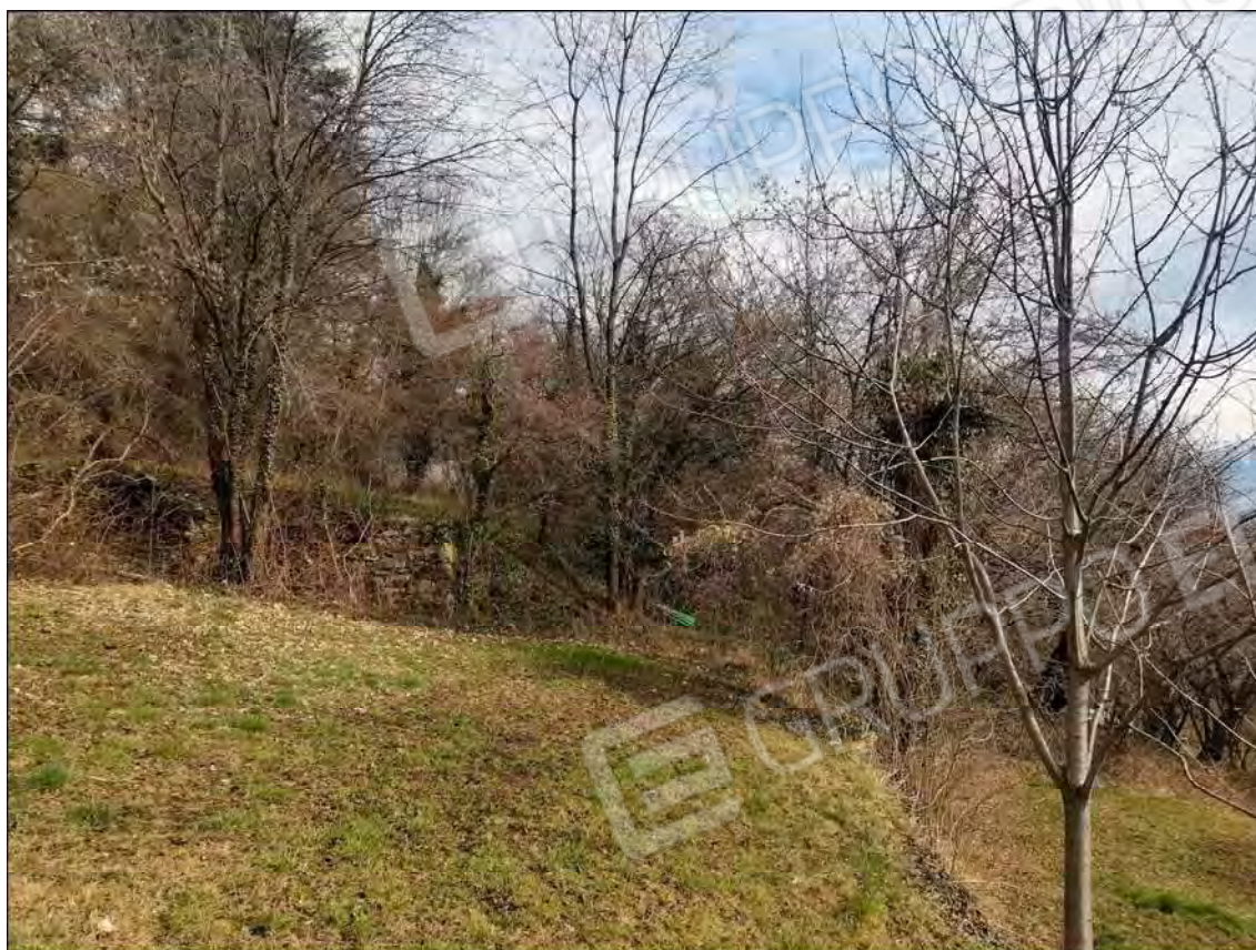
Fotografia n.06 (Rif.: Fg.25 - Mappali n.6208, n.6209, n.6212, n.6213, n.6214, n.6215, n.6216, n.6217, n.6218, n.6220, n.6222, n.6223, n.6224 e n.6225)