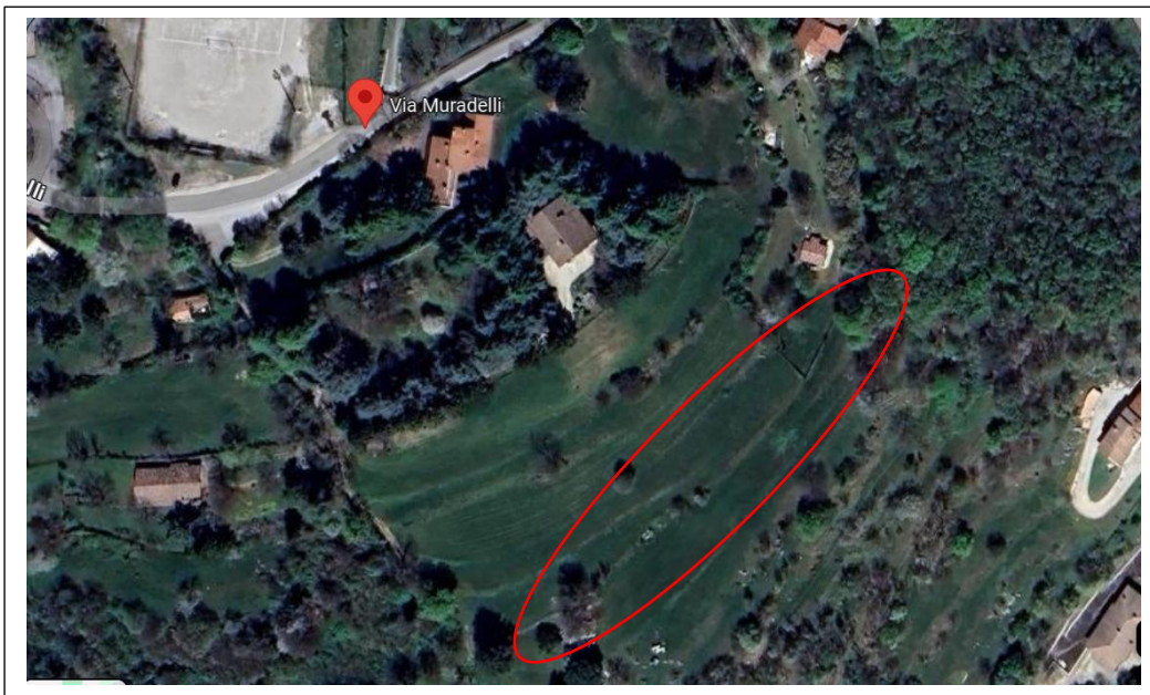
Fotografia aerea riprendente le particelle 53 e 160 (per l'identificazione precisa si rimanda alla visione dell'estratto mappa catastale)