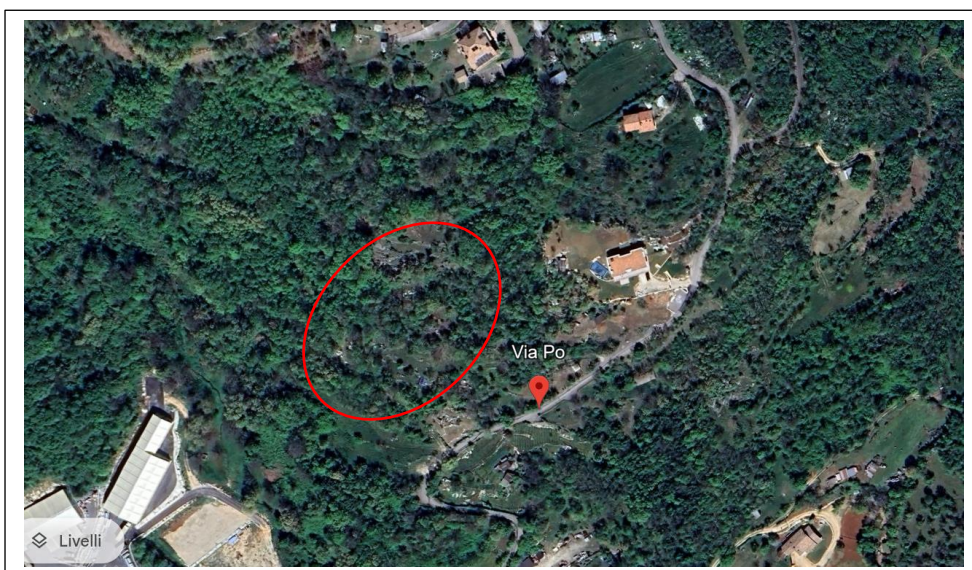
Fotografia aerea riprendente le particelle 287-276-338 tratta da Google maps (per l'identificazione precisa si rimanda alla visione dell'estratto mappa catastale)