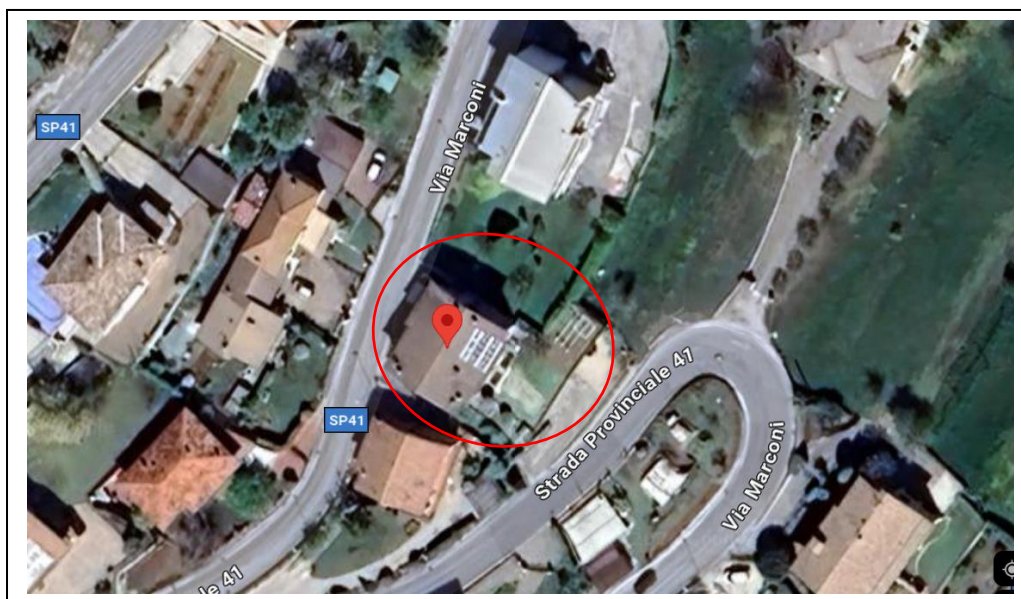
Fotografia aerea riprendente le particelle 38, 344,488, 39

Si allega inoltre copia dell'estratto mappa del Fg. 23 dove sono state evidenziate le particelle nn° 38-39-344-488 (vedasi allegato n° 28), copia dell'estratto mappa del Fg. 23 dove sono state evidenziate le particelle nn° 276-287-338 (vedasi allegato n° 29), copia dell'estratto mappa del Fg. 14 dove sono state evidenziate le particelle nn° 53-160 (vedasi allegato n° 30).