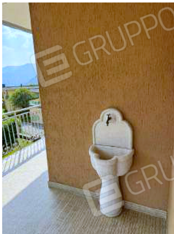
Fontanella sul balcone a sud