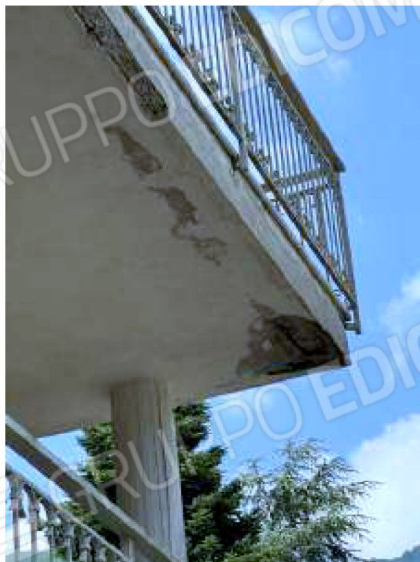
Distacco del calcestruzzo dalla soletta dei balconi