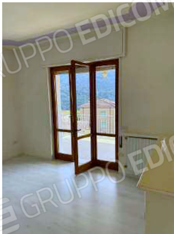
Portafinestra del soggiorno