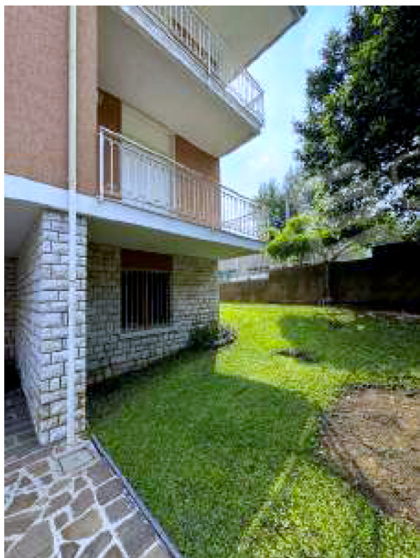
Pertinenza esterna a nord-ovest