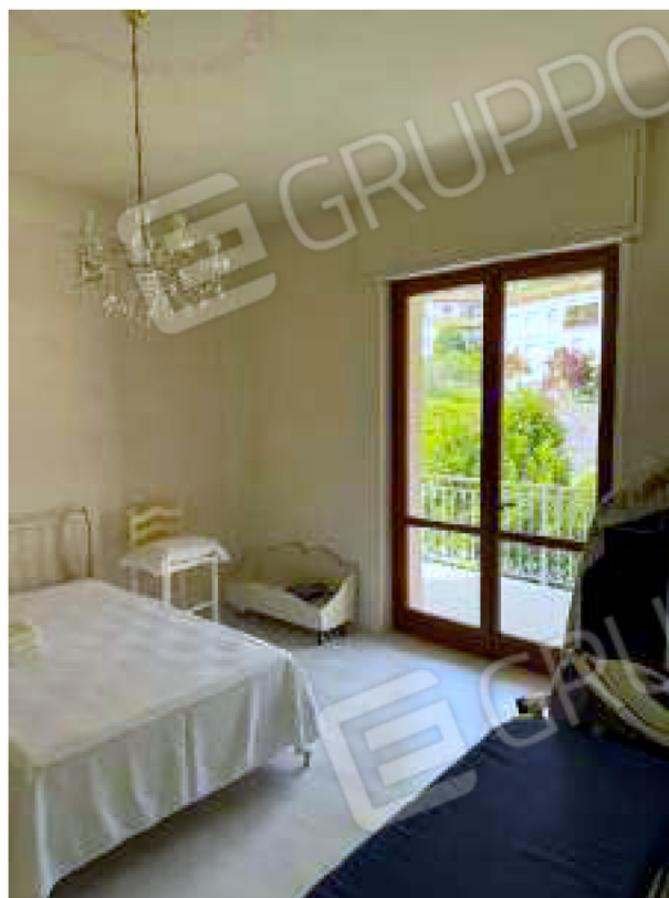
Camera da letto esposta a nord