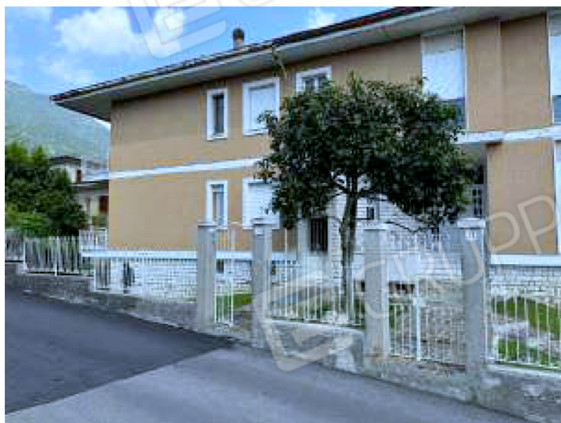
Facciata est verso nord