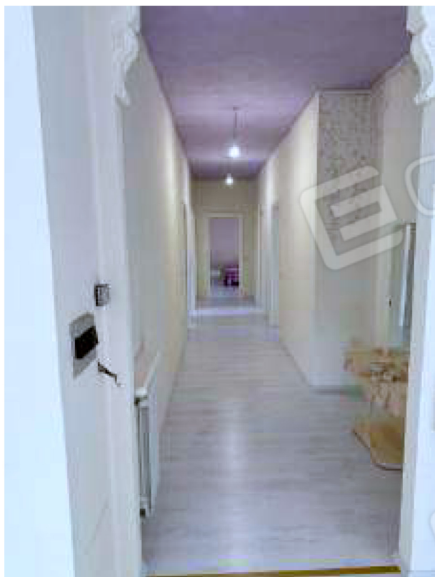
Corridoio della zona notte