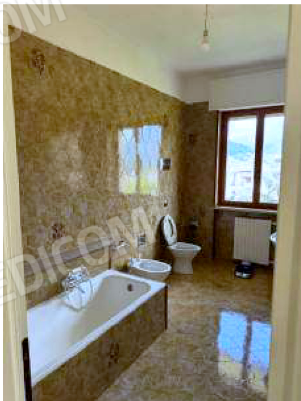
Bagno con vasca