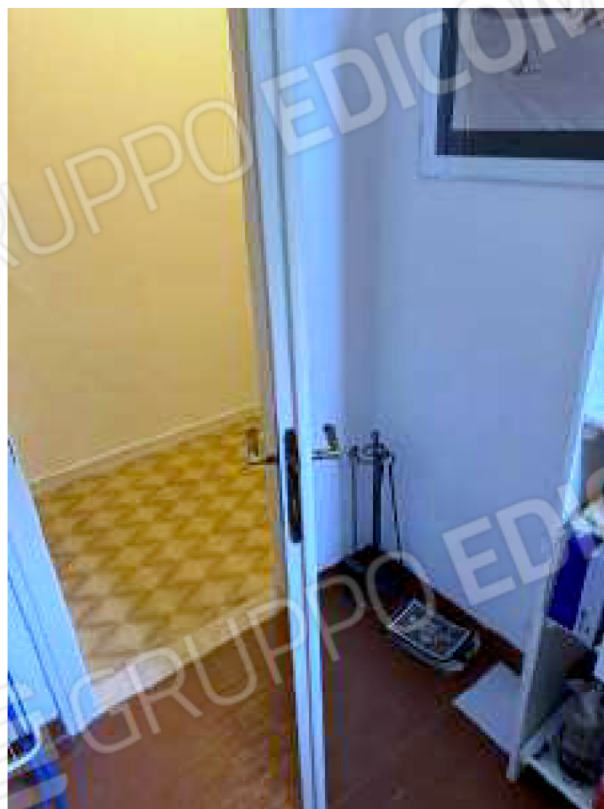
Particolare della porta di accesso alla cantina