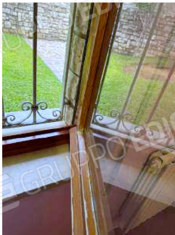
Particolare del serramento della lavanderia