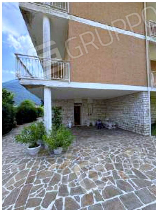
Pertinenza esterna comune a nord