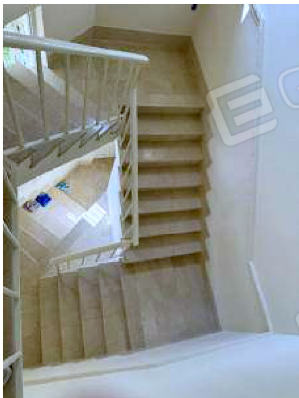
Scala interna comune