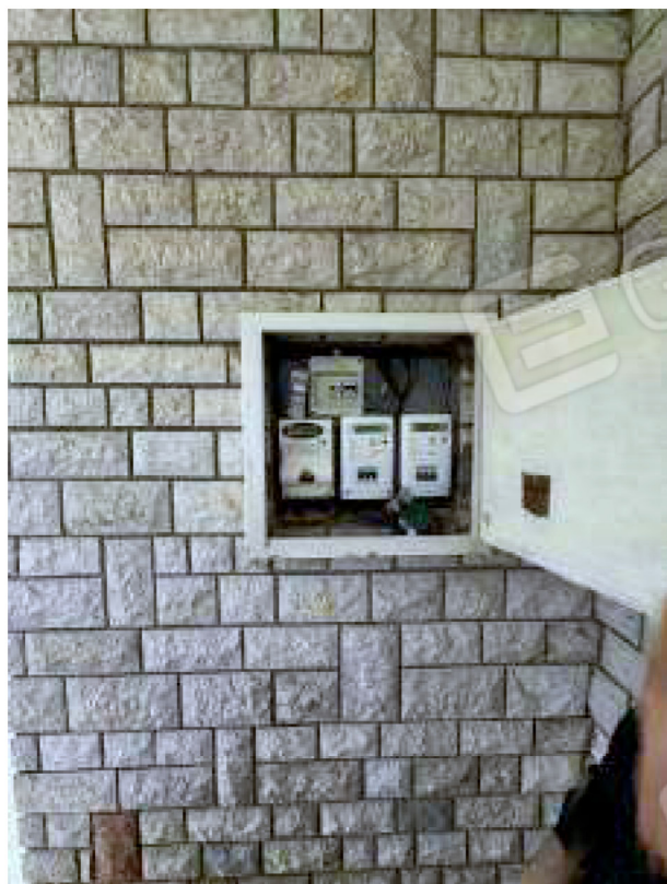
Contatore esterno al piano seminterrato