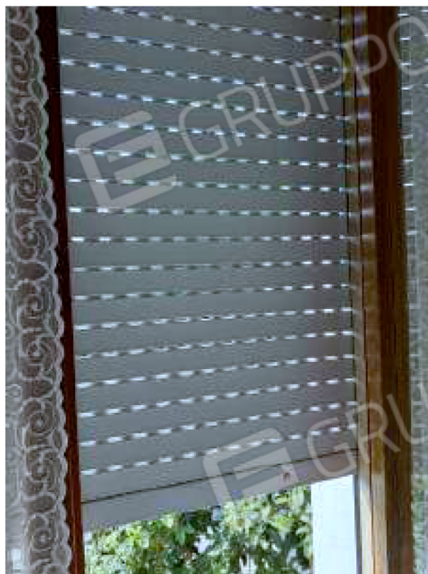
Tapparella in plastica