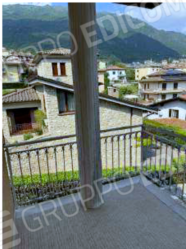
balcone della camera da letto a est