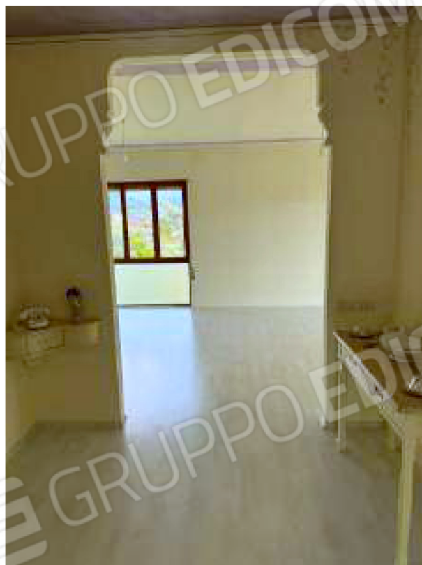
Ingresso verso il soggiorno