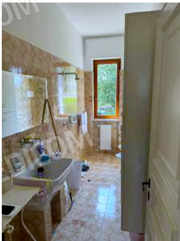
Bagno con doccia a pavimento