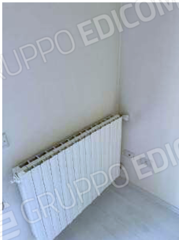
Particolare del calorifero di una camera da letto