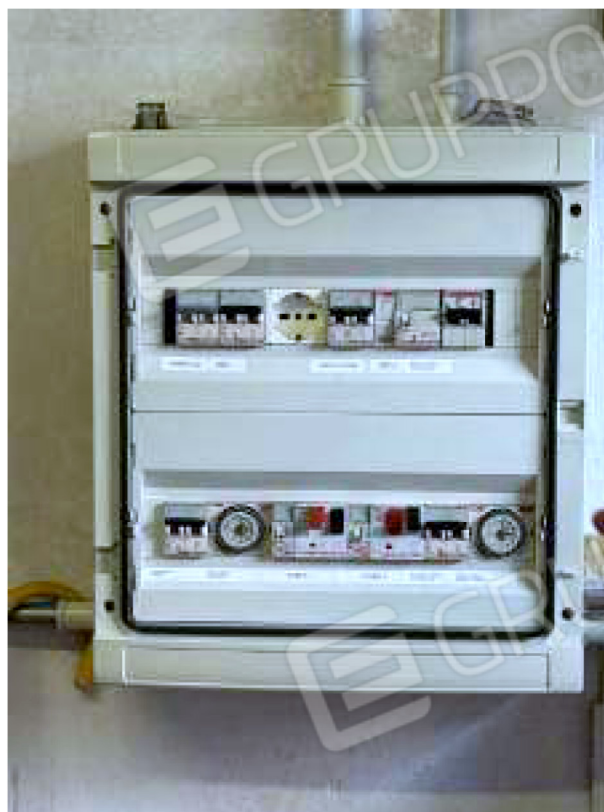
Quadro elettrico nel locale tecnico