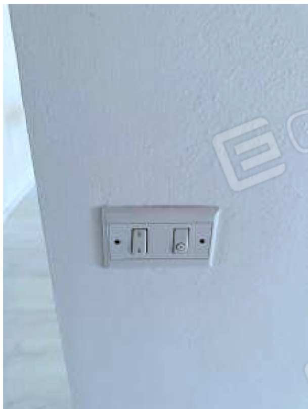
Particolare dei frutti dell'impianto elettrico