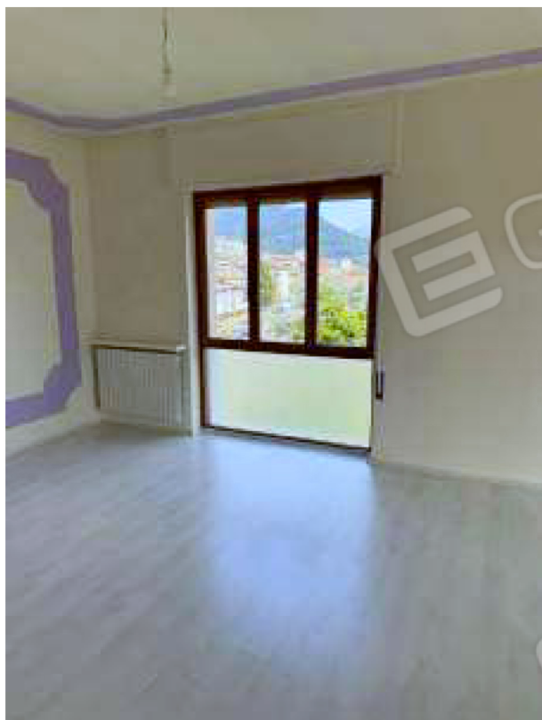
Finestra del soggiorno con sottoluce