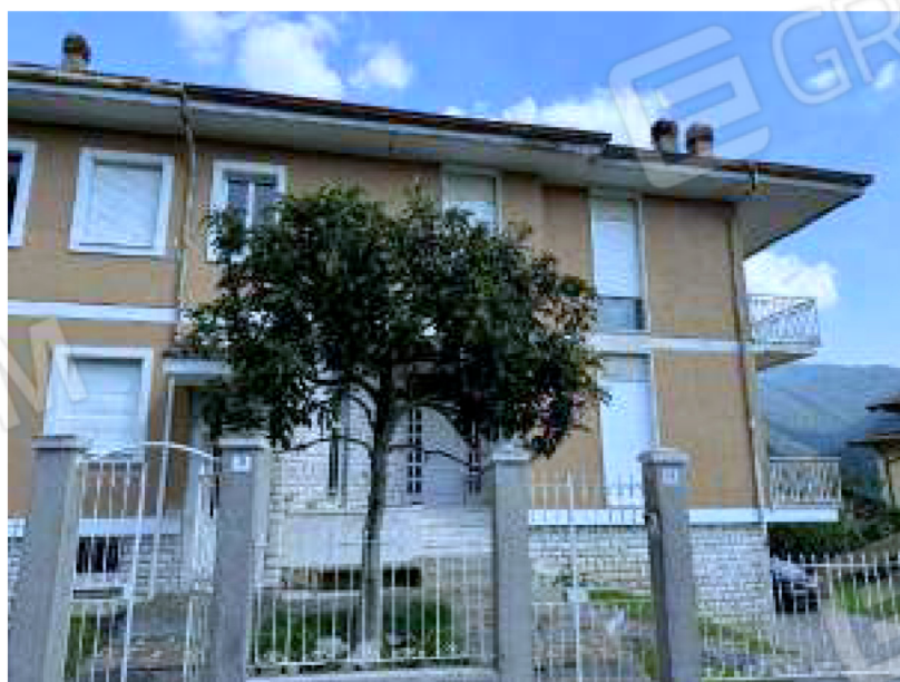
Facciata est verso sud