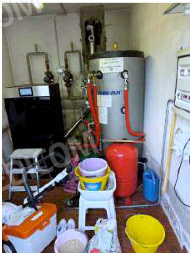
Caldaia a pellet e termoaccumulatore