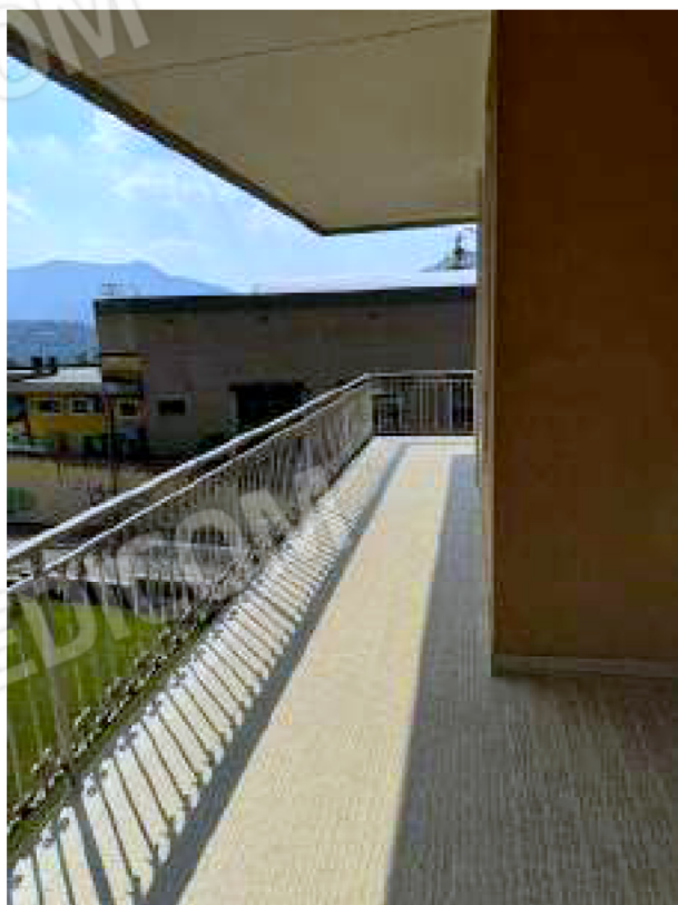
Balcone a sud