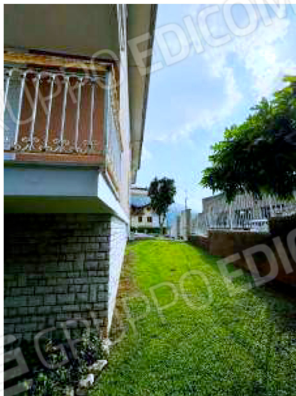
Pertinenza esterna verso via M. Montessori