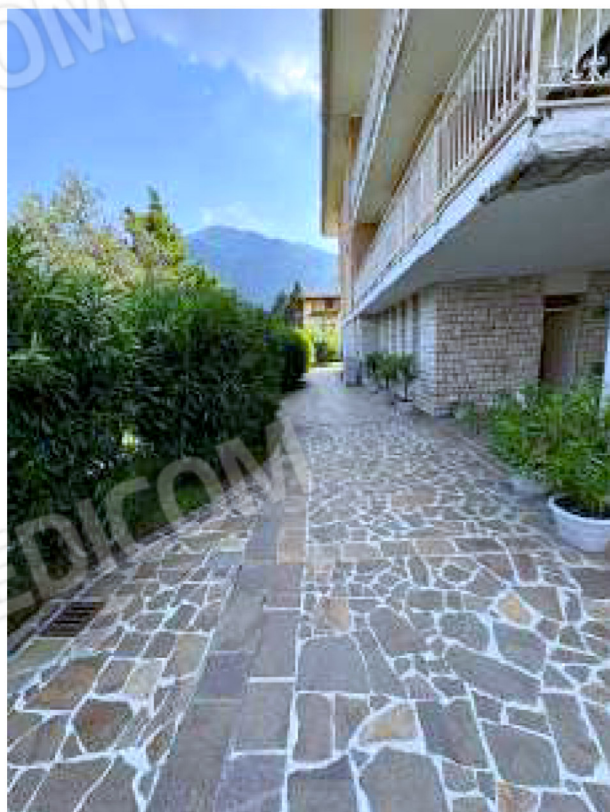
Pertinenza esterna comune a est