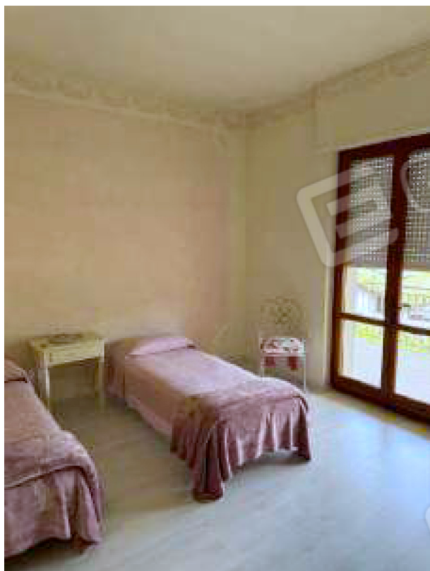
Camera da letto esposta a est