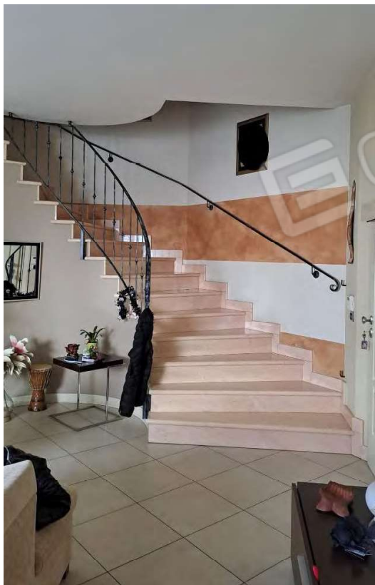
Scala in marmo di accesso al primo piano