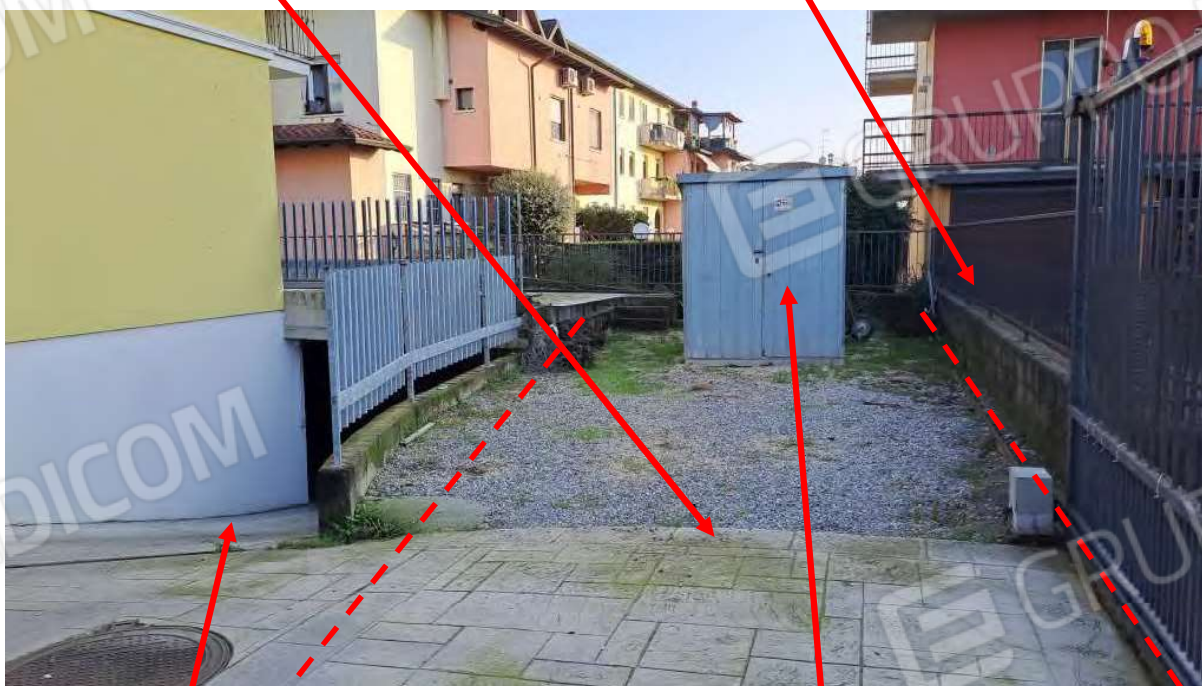
Rampa di accesso al corsello interrato