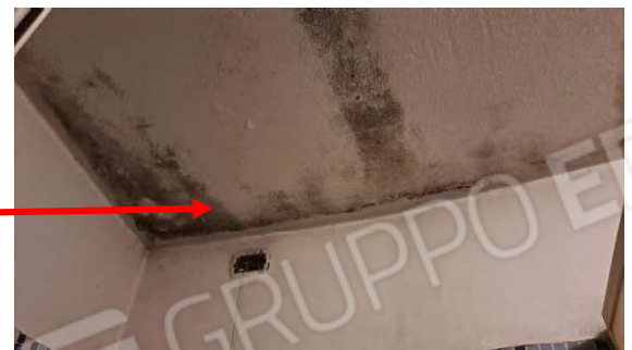
Evidenze di muffa e umidità nel bagno