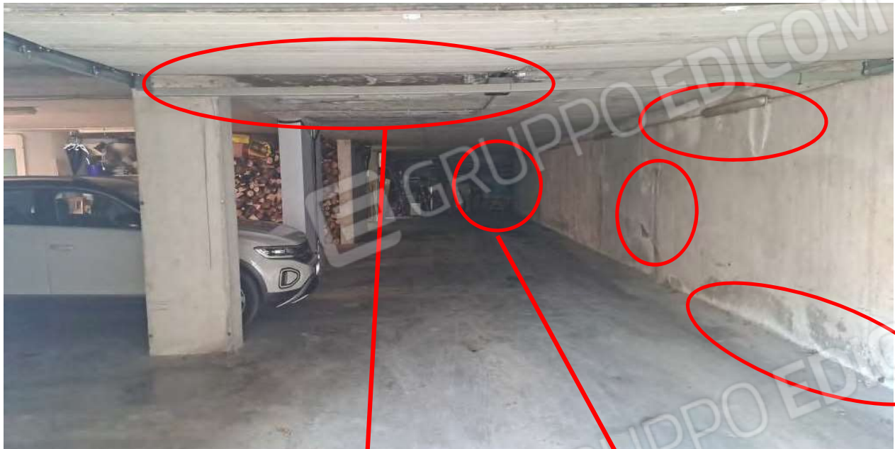
Segni evidenti di infiltrazioni