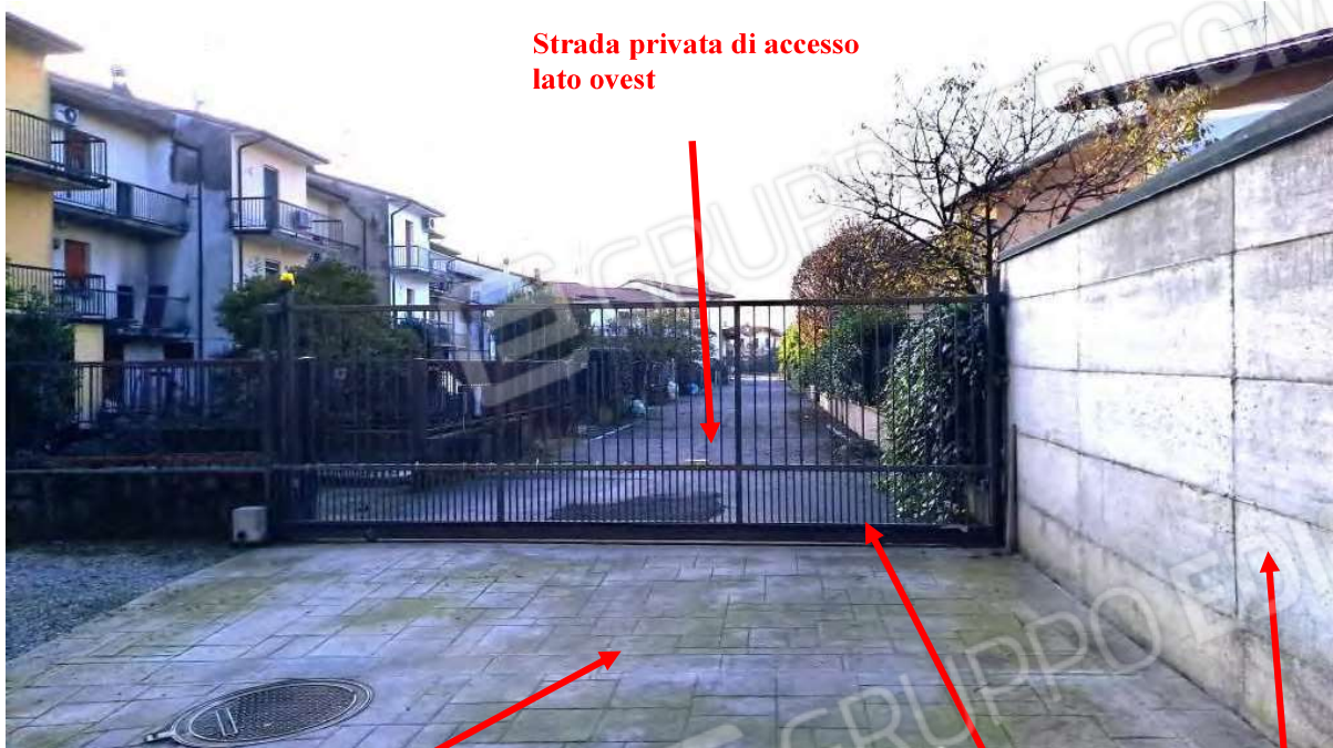
Strada privata di accesso lato ovest