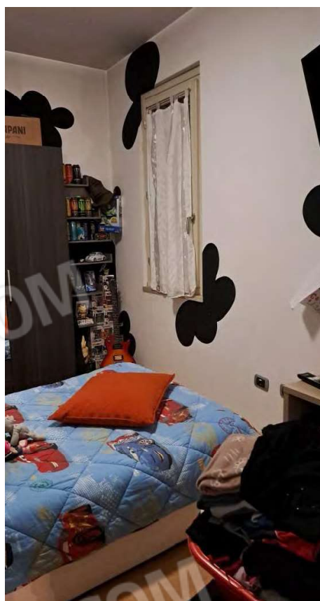
Stanza guardaroba utilizzata impropriamente come cameretta