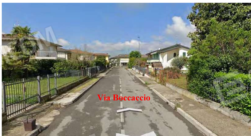
Viste dell'intorno in cui si inserisce il bene