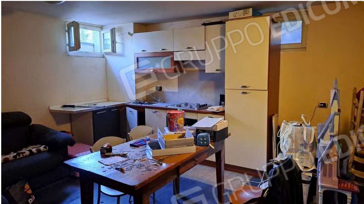
Lavanderia (sub. 13) e autorimessa (sub. 18) trasformati in taverna abusiva