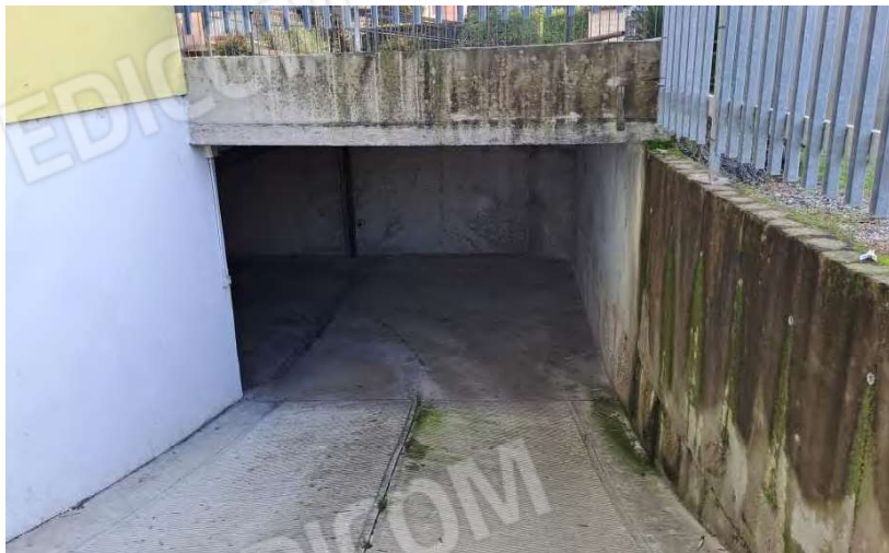
Viste del corsello comune e rampa di accesso alle autorimesse e stato di degrado