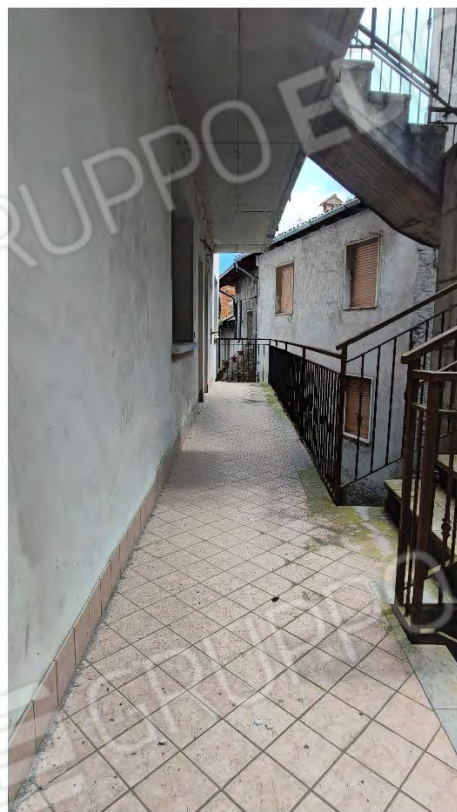
Foto n° 29 – 30 ( Scale di Accesso e Balconate tipo - Sub 5-6-8-9 )