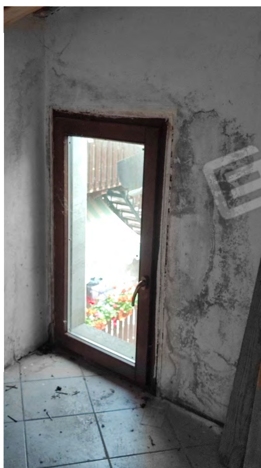
Assemblato Foto n° 57 ( Tracce Umidità )