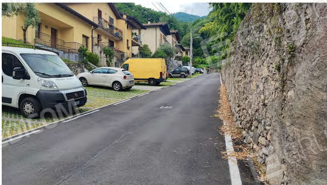
Foto n° 2 ( Vista dalla viabilità di Accesso – Parcheggio Via Fontana )