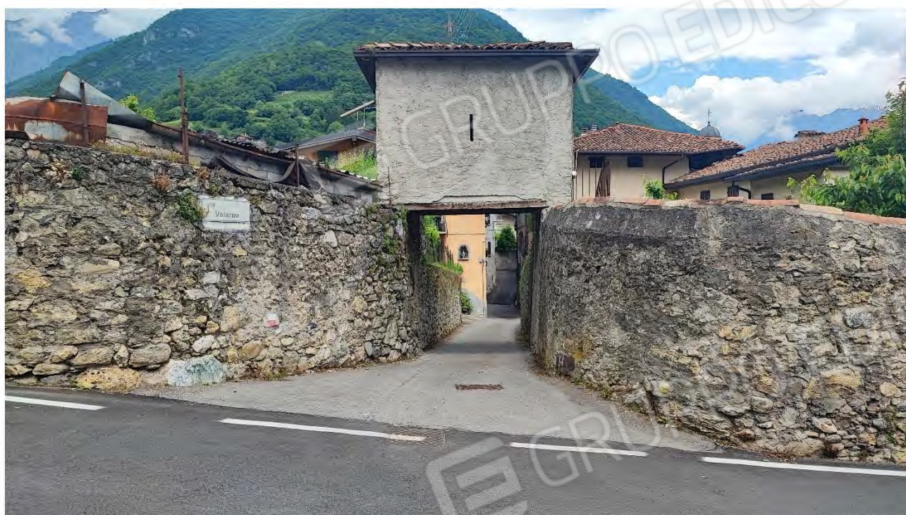
Foto n° 3 ( Vista dalla viabilità di Accesso – Ingresso Via Valarno )