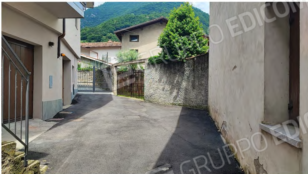
Foto n° 5 ( Vista dalla viabilità di Accesso – Tratto Conclusivo Via Valarno )