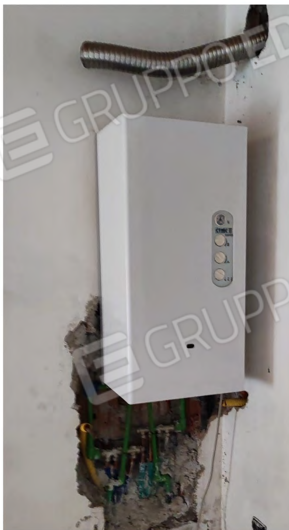
Assemblato Foto n° 56 ( Tipologia Impianto Termico )