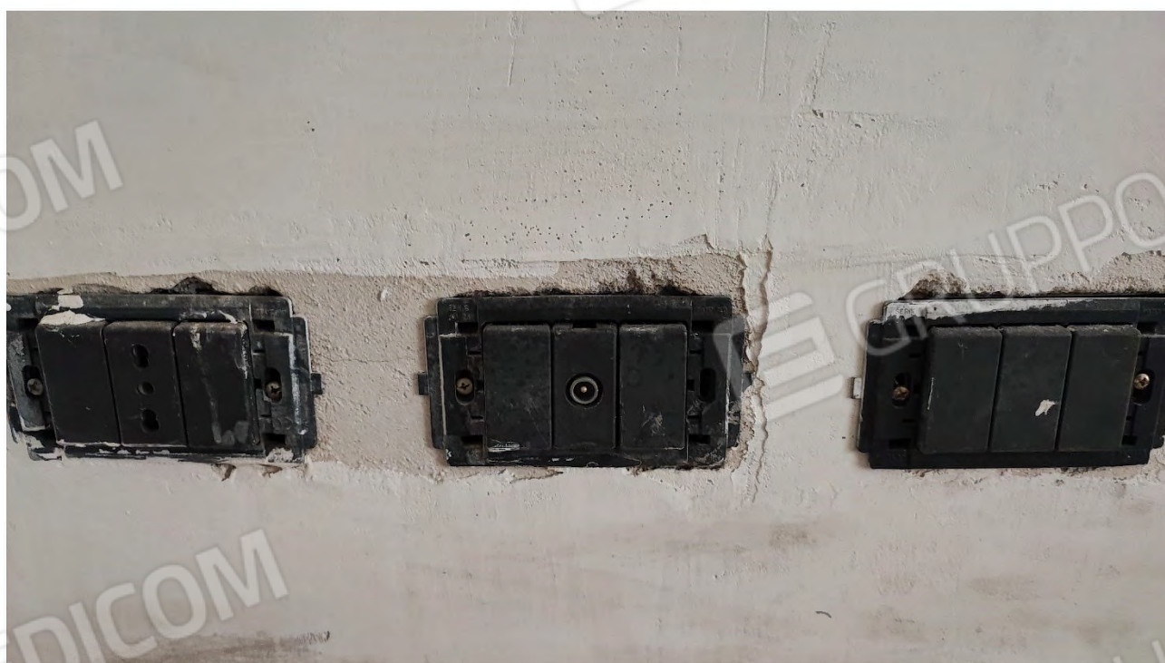
Assemblato Foto n° 55 ( Tipologia Impianto Elettrico )