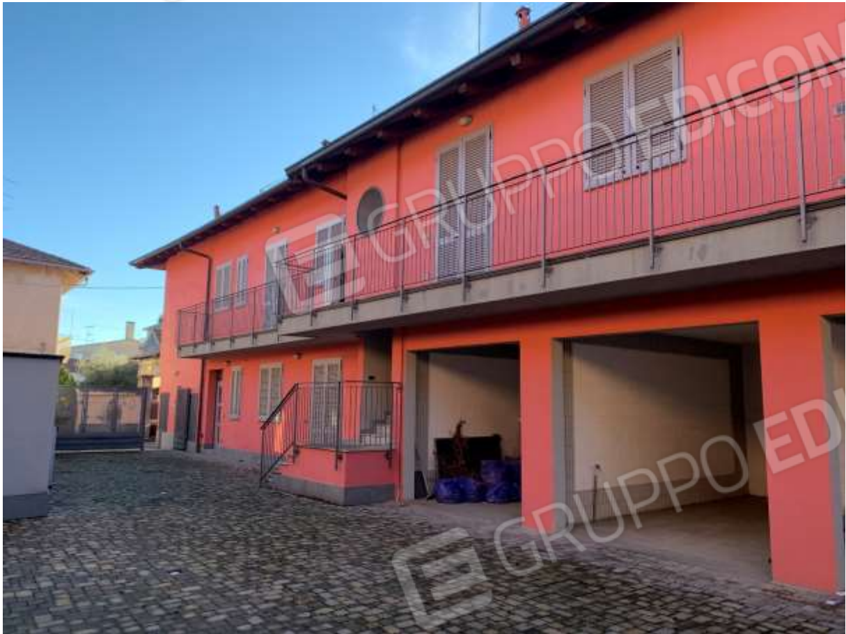
VISTA DALLA CORTE