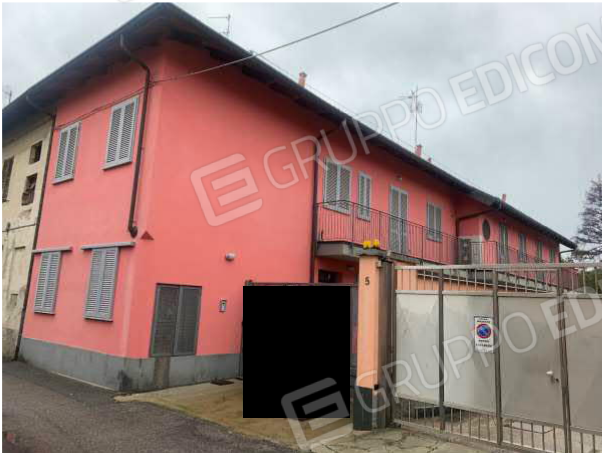
ACCESSO DA STRADA