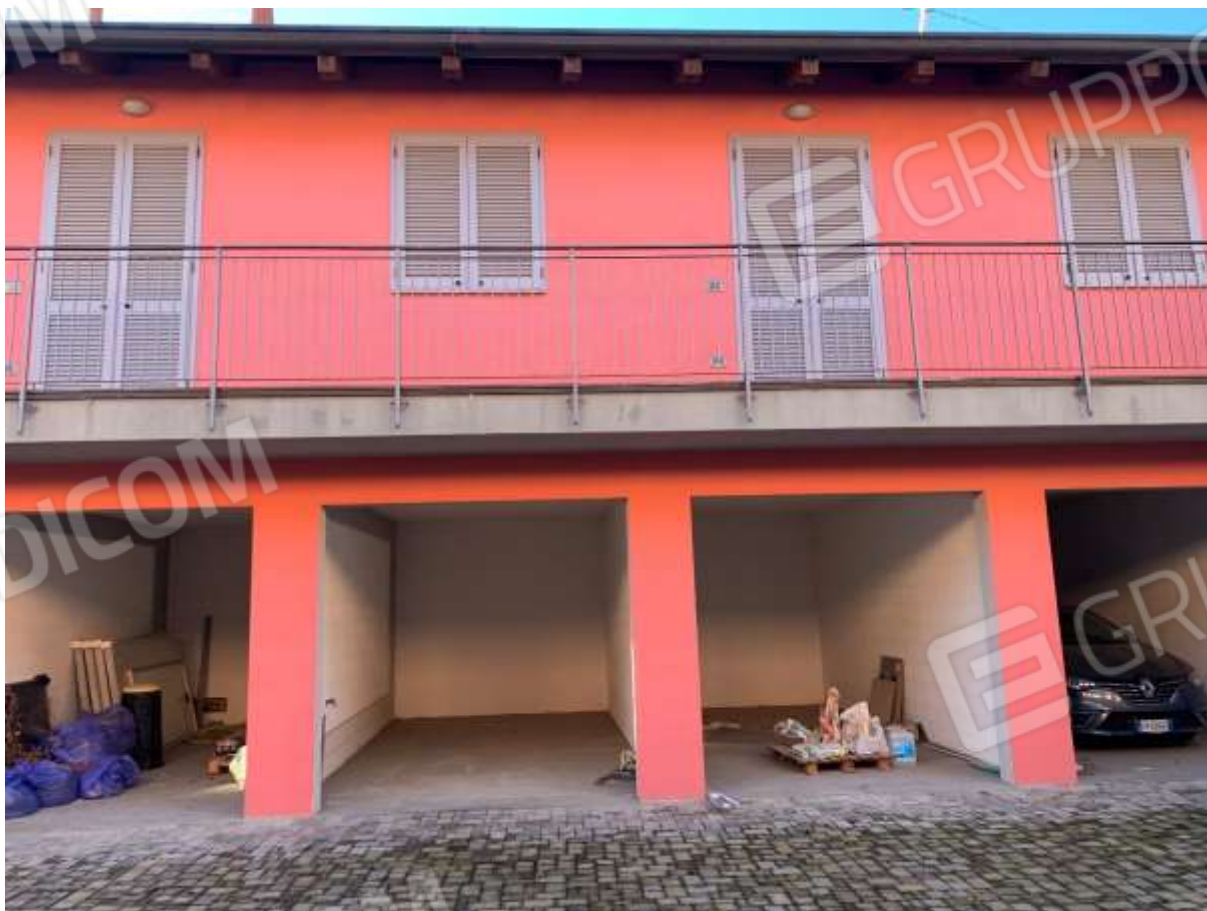
VISTA DALLA CORTE