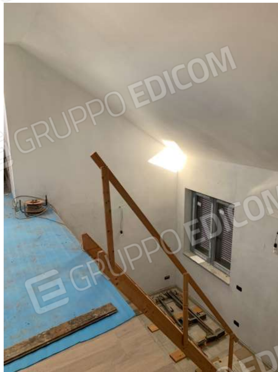
SOPPALCO ABUSIVO SOPRASTANTE IL SOGGIORNO