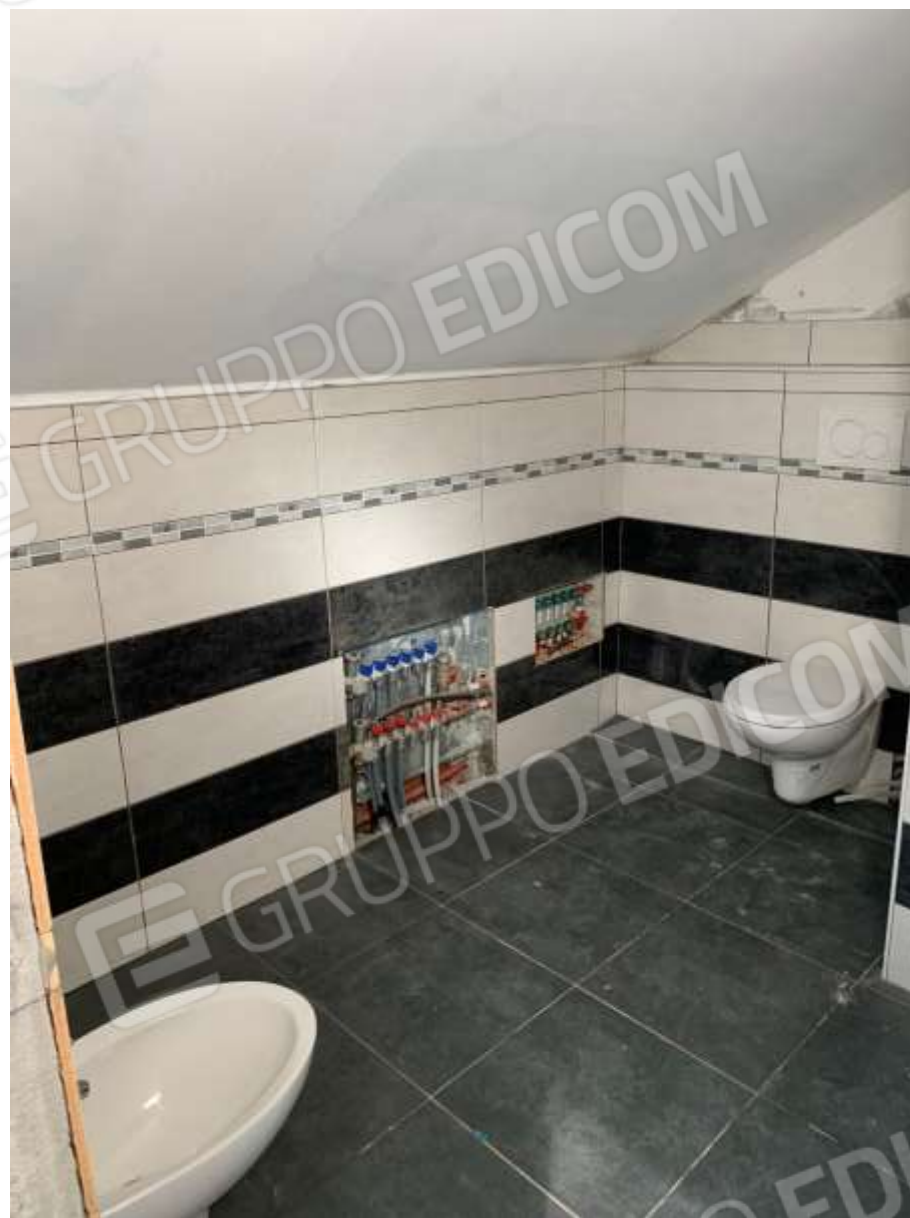
BAGNO ABUSIVO NEL SOPPALCO