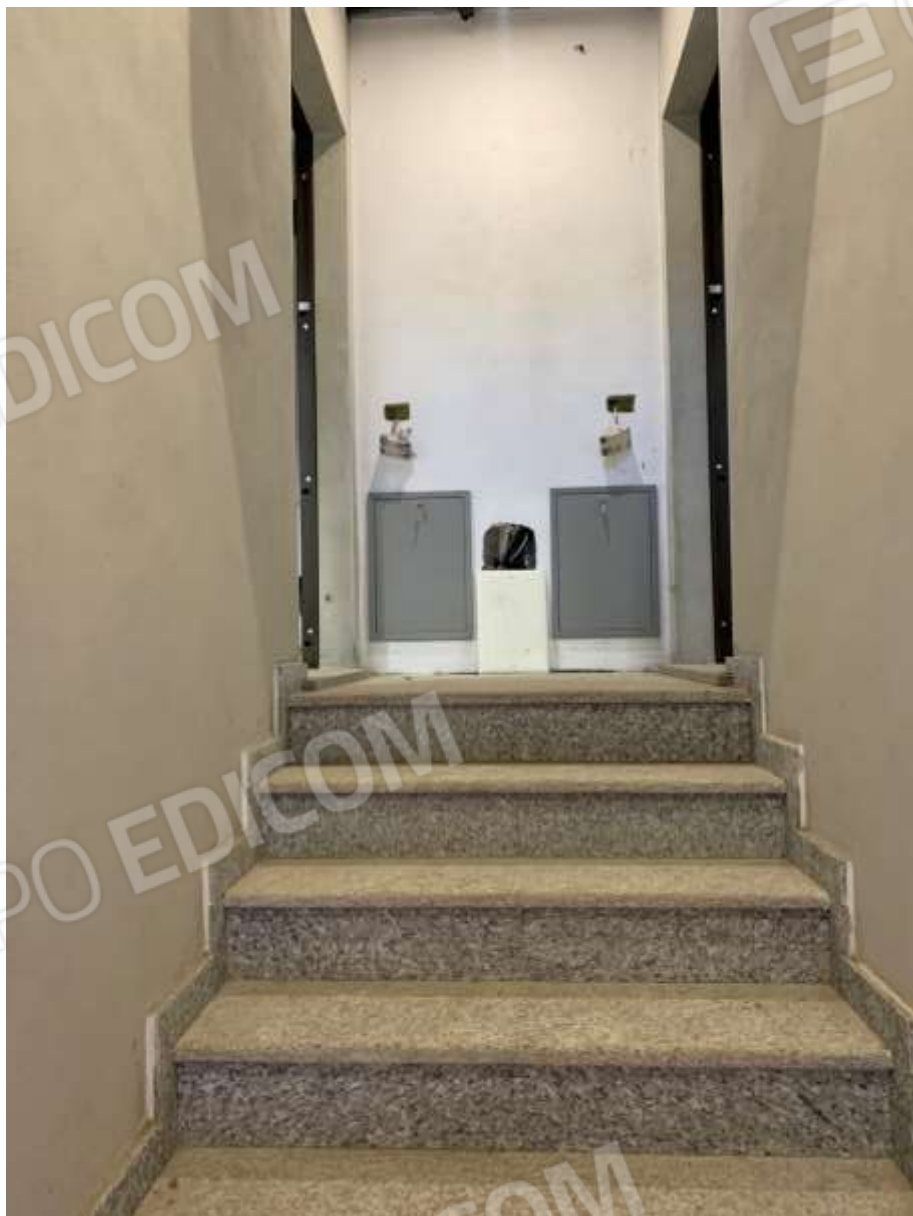
SBARCO SCALA AL PRIMO PIANO