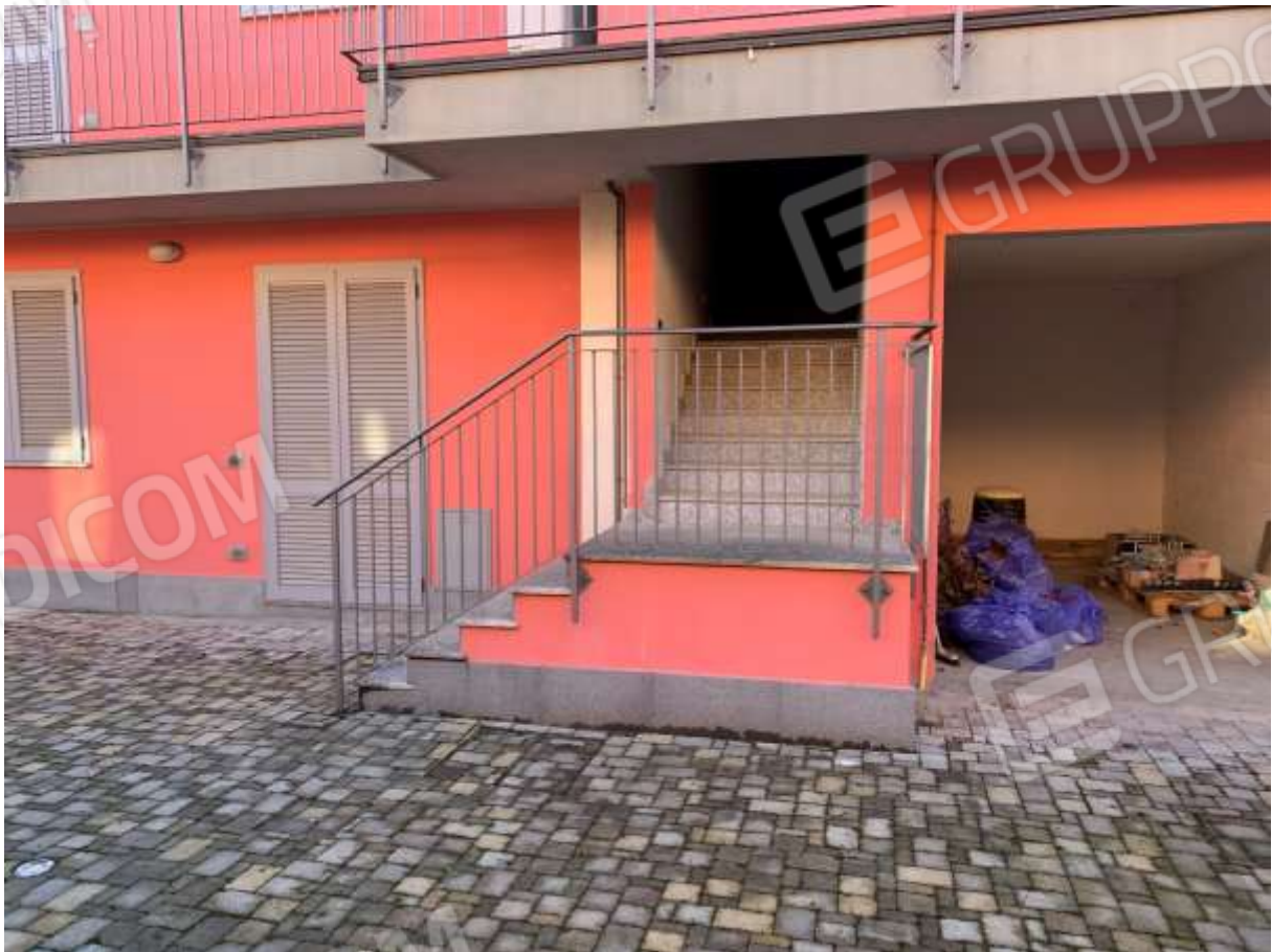
SCALA DI ACCESSO AL PRIMO PIANO