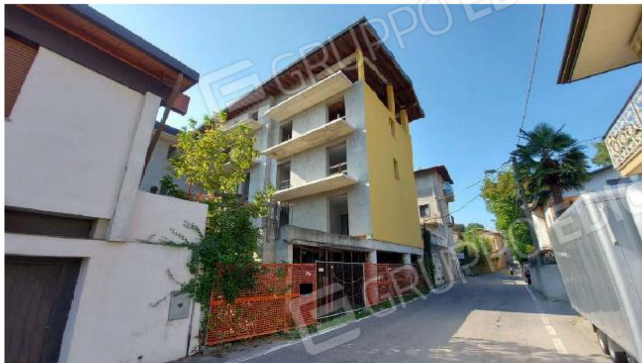
VISTA DA VIA ROMA