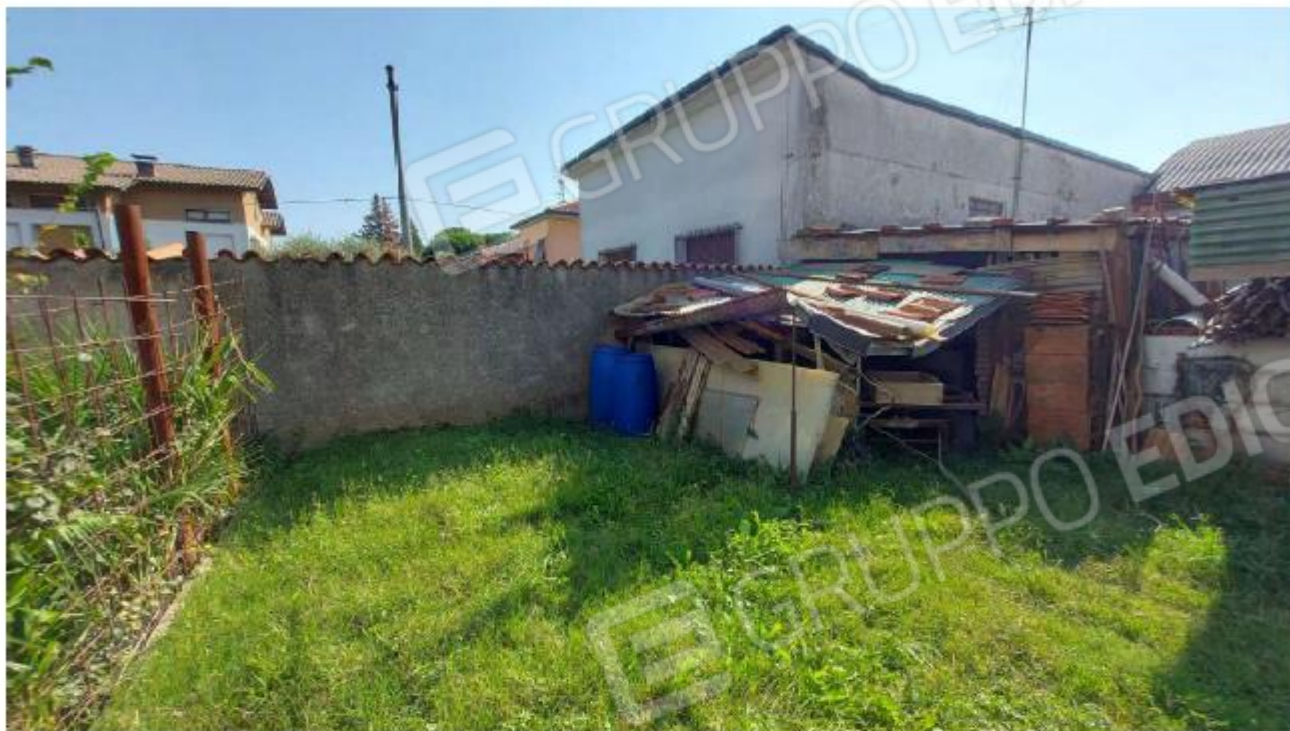
INGRESSO SECONDARIO DA VIA RONCACCIO DA PROPRIETA' DI TERZI