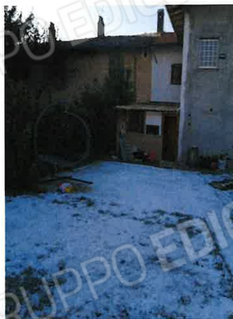
Altre viste del prospetto posteriore (con ampliamento volumetrico realizzato)