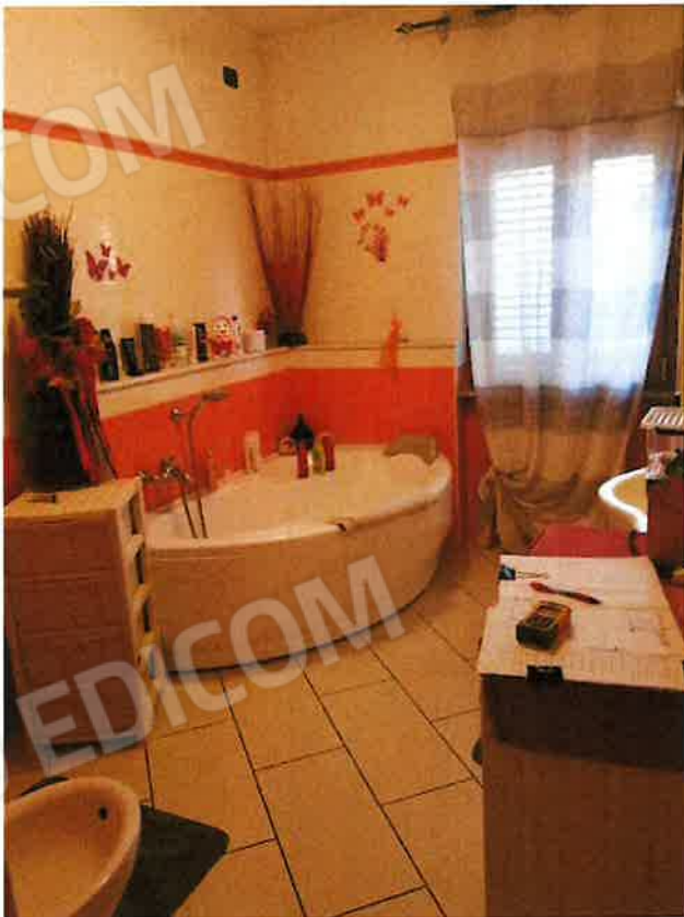
bagno 1 (p.t)