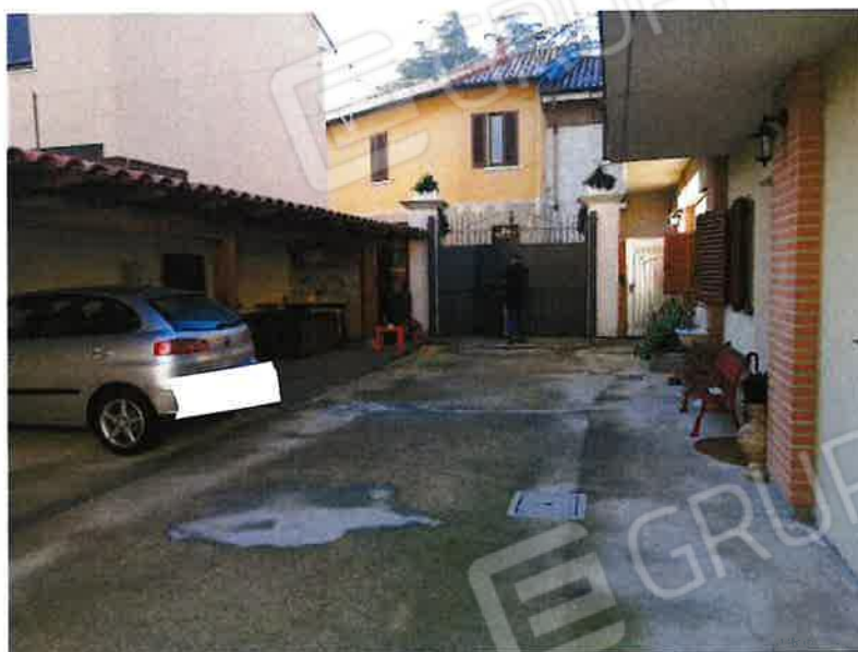
Viste cortile interno