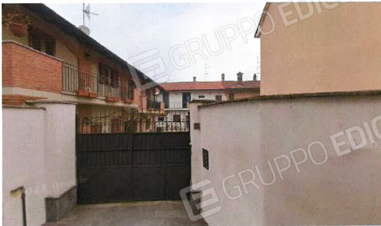
Viste ingresso da via Carducci n. 12

Unità abitativa sita in Buscate Via G. Carducci n. 12