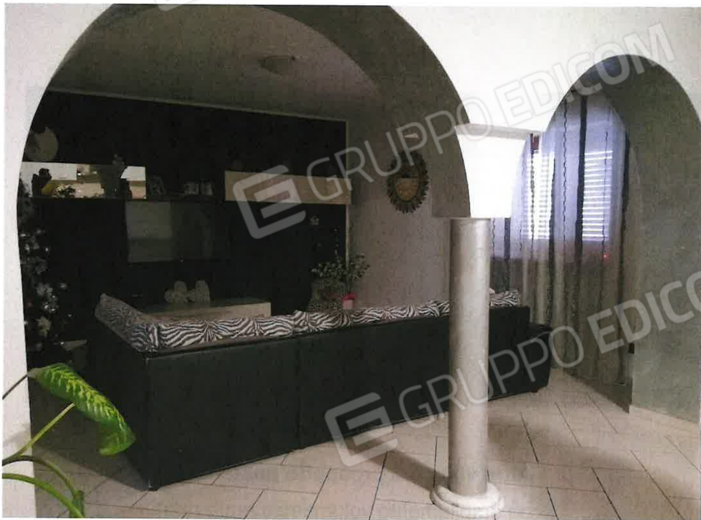
ingresso / soggiorno (p.terra)