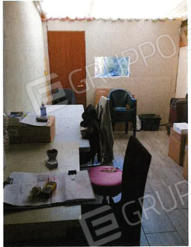
ripostiglio/tettoia chiusa (p.t)