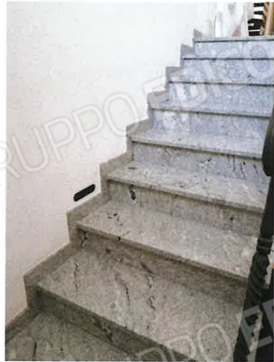
Scala interna di collegamento piano terra-primo