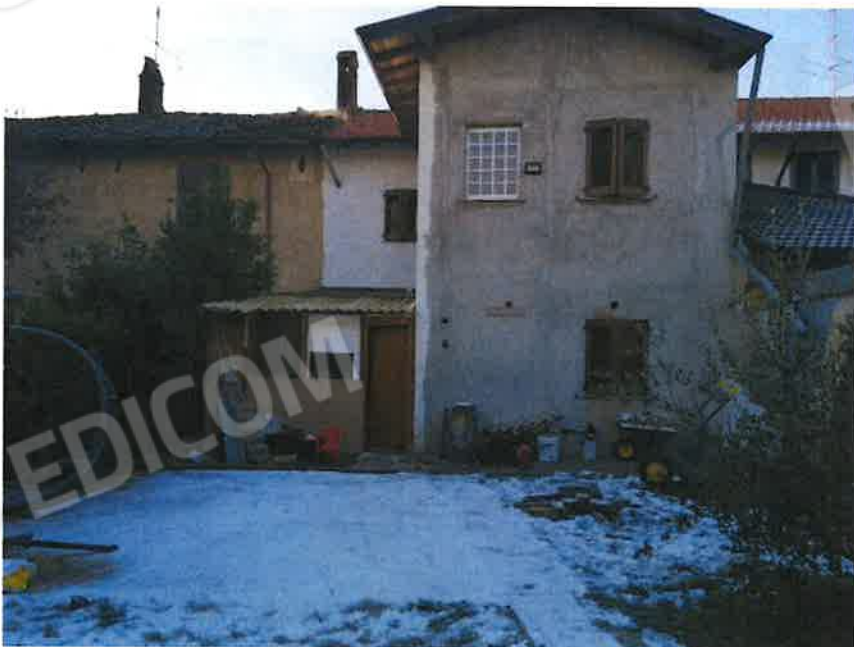
Prospetto posteriore unità abitativa