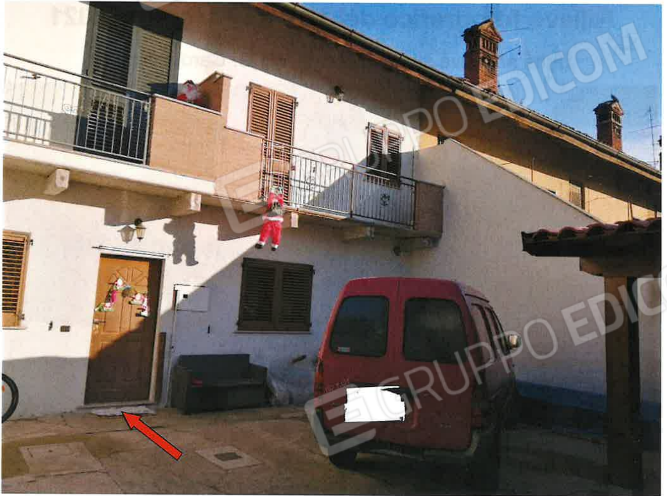
Prospetto anteriore unità abitativa