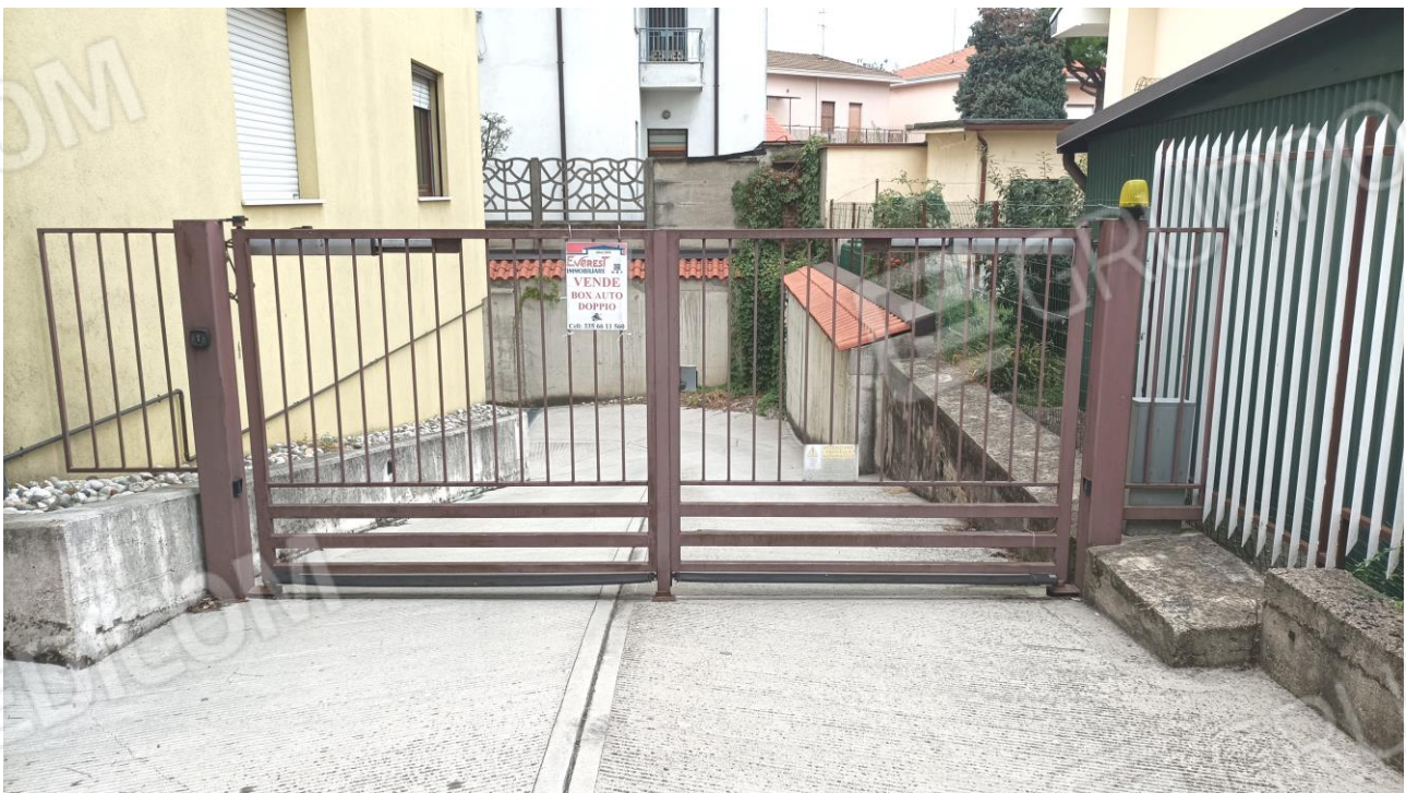
Vista dell'ingresso carraio, su via Bernina, della palazzina cui appartiene la u.i. oggetto di procedura / stima