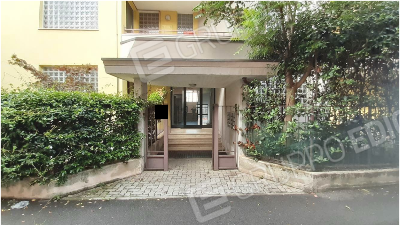
Vista dell'accesso pedonale, su via Bernina, della palazzina cui appartiene la u.i. oggetto di procedura / stima