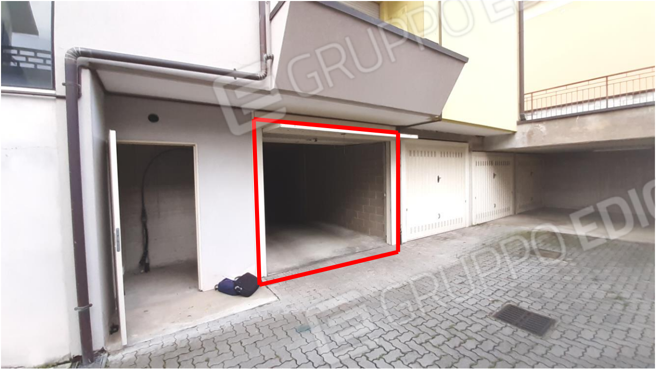
Viste esterne ed interna dell'u.i. oggetto di stima