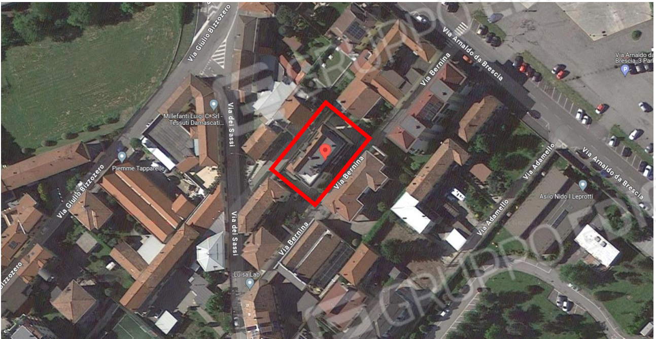
Viste aeree con localizzazione / identificazione della palazzina cui appartiene la u.i. oggetto di procedura / stima