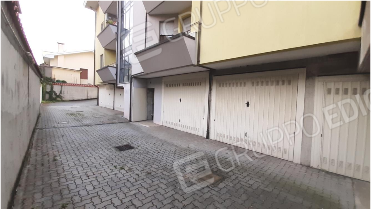
Vista del corsello di manovra comune