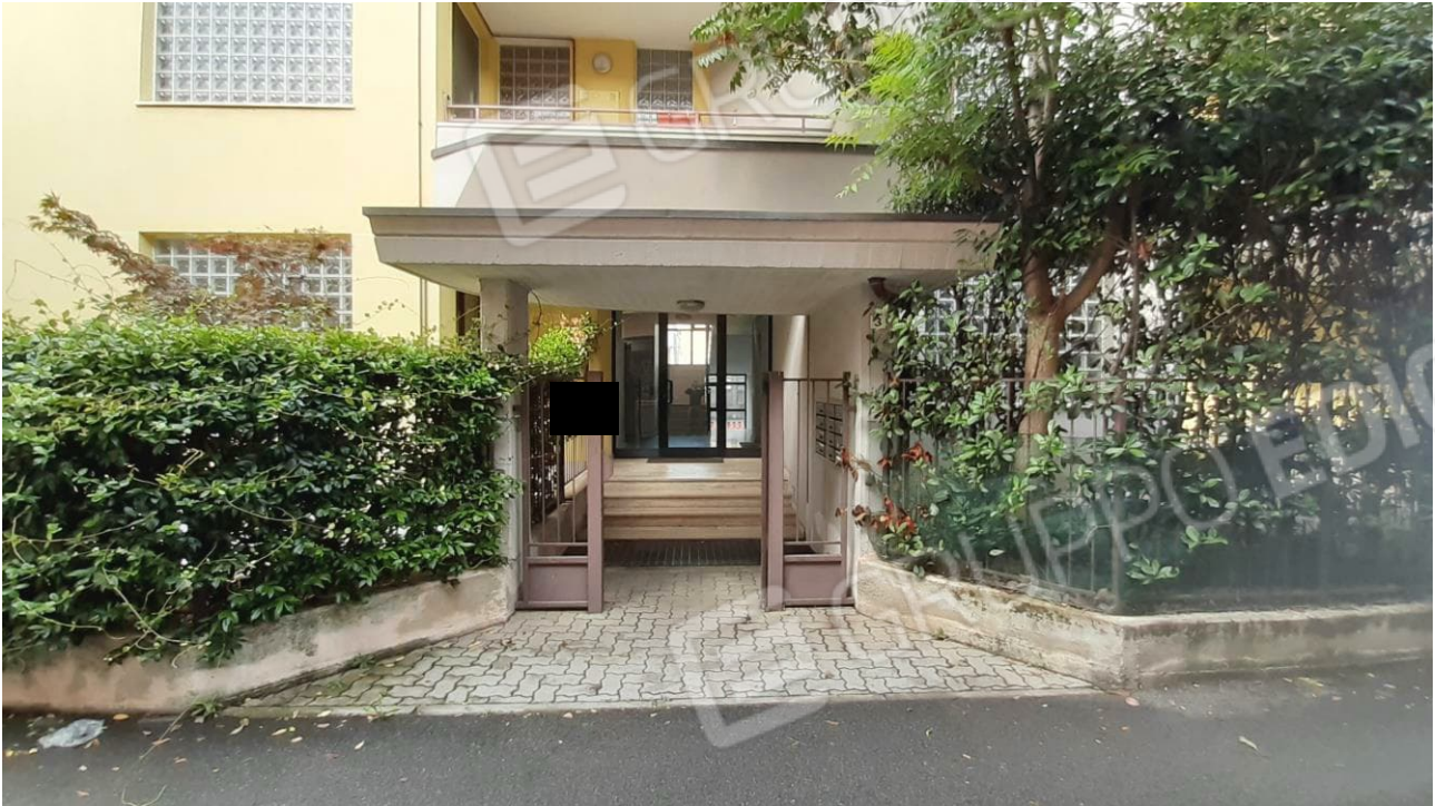
Vista dell'accesso pedonale, su via Bernina, della palazzina cui appartiene la u.i. oggetto di procedura / stima