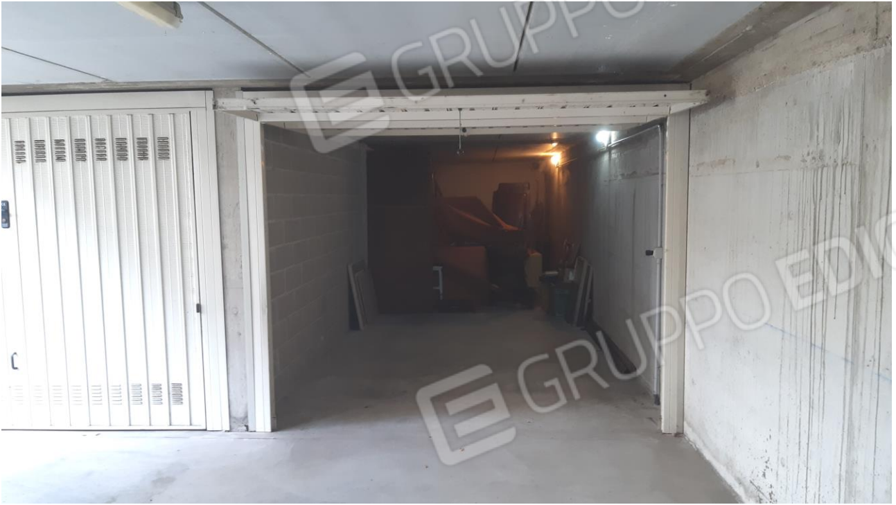
Viste interna ed esterna dell'u.i. oggetto di stima