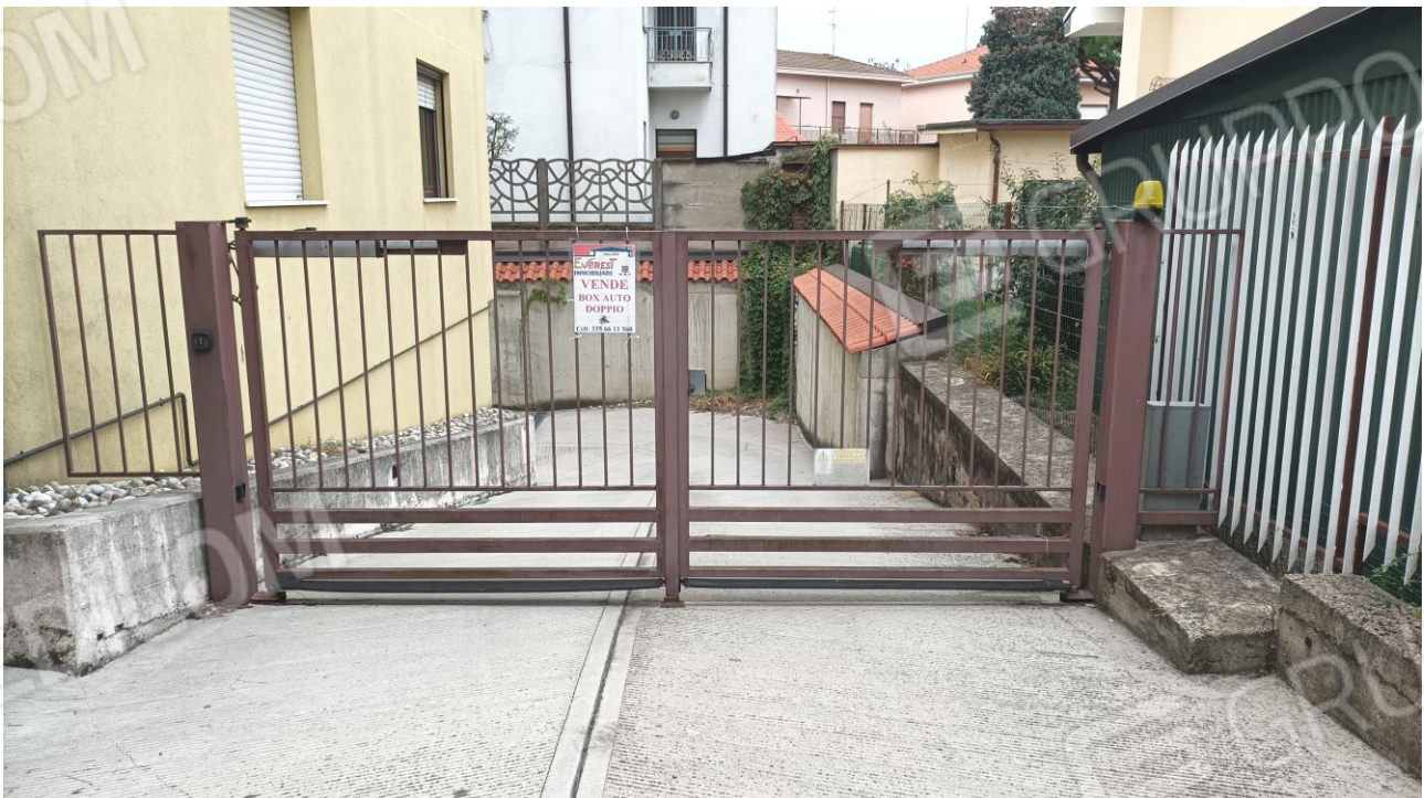
Vista dell'ingresso carraio, su via Bernina, della palazzina cui appartiene la u.i. oggetto di procedura / stima