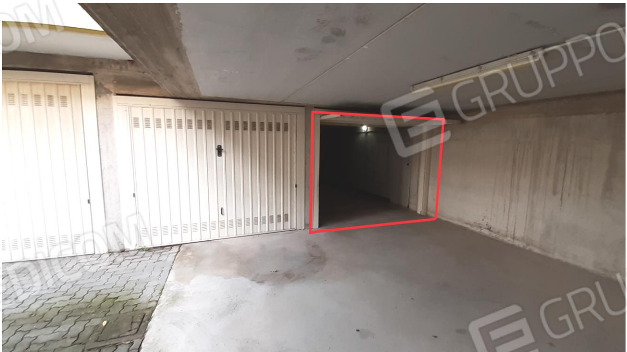
Vista esterna dell'u.i. oggetto di stima