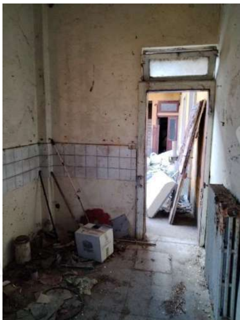
16) Ingresso alla bottega a piano terra con accesso su strada (fg.6, part.3; sub. 14)