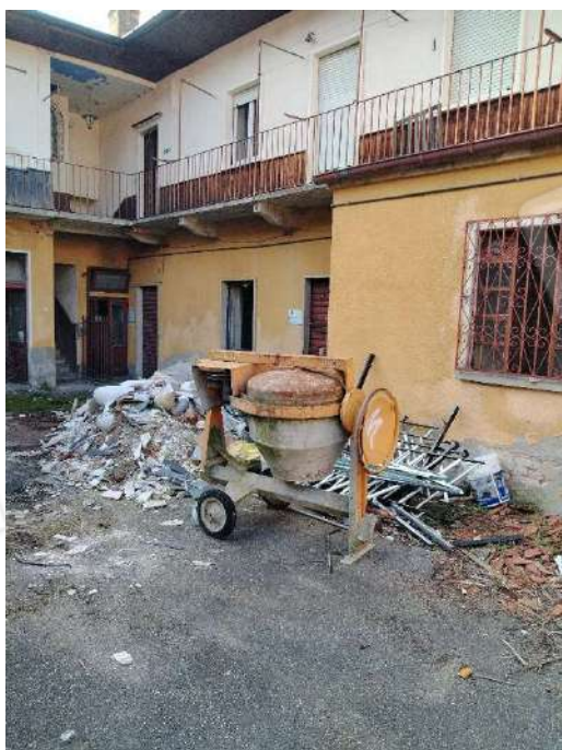
8) Retro dei fabbricati su strada che affacciano sulla corte Interna;