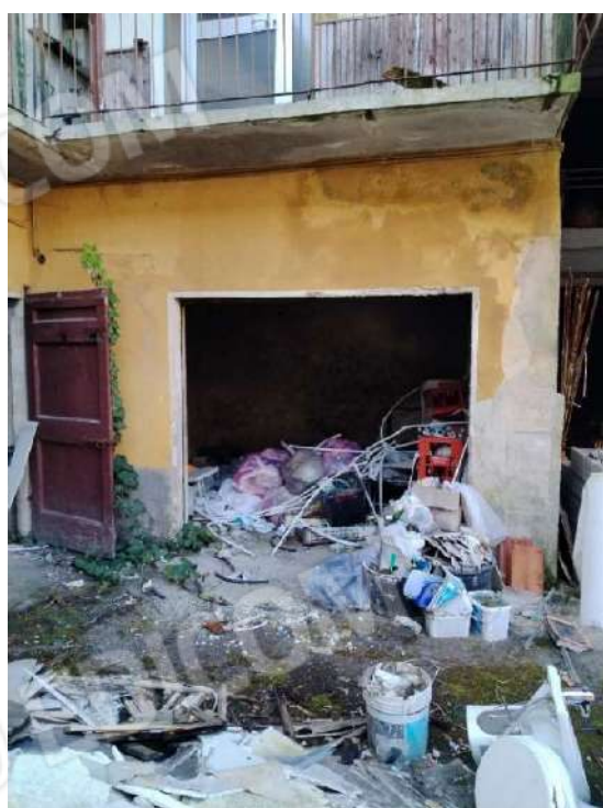
19) Deposito (fg.6, part.3; sub. 15);