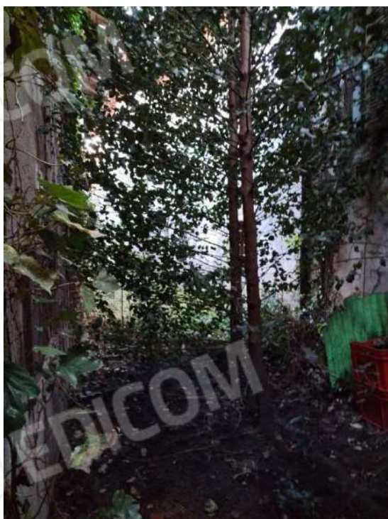
13) Magazzini per la lavorazione Prodotti Vinicoli (fg.6, part.3; sub. 12)