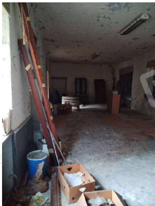
18) Bottega a piano terra con accesso su strada (fg.6, part.3; sub. 14);