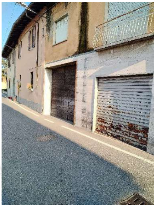
4) Prospetto della proprietà con fotografia da via Fratelli Rosselli ;