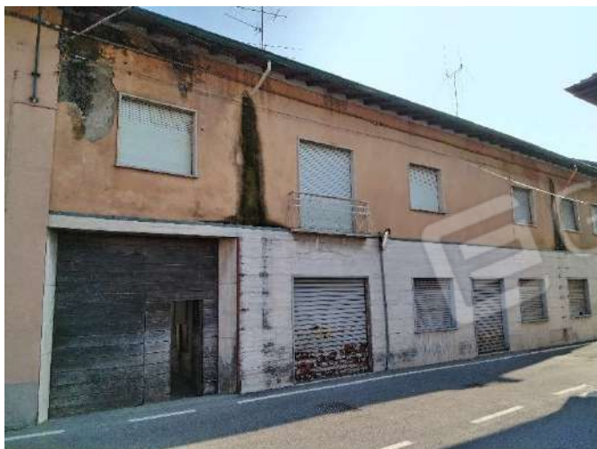
2) Ingresso dei fabbricati in P.zza Antonio Gramsci a Corgeno di Vergiate ,