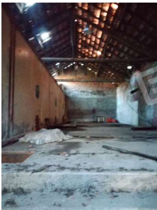
12) Magazzini per la lavorazione Prodotti Vinicoli (fg.6, part.3; sub. 12)