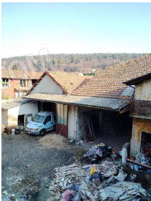
5) Fotografia dall'alto della corte interna;