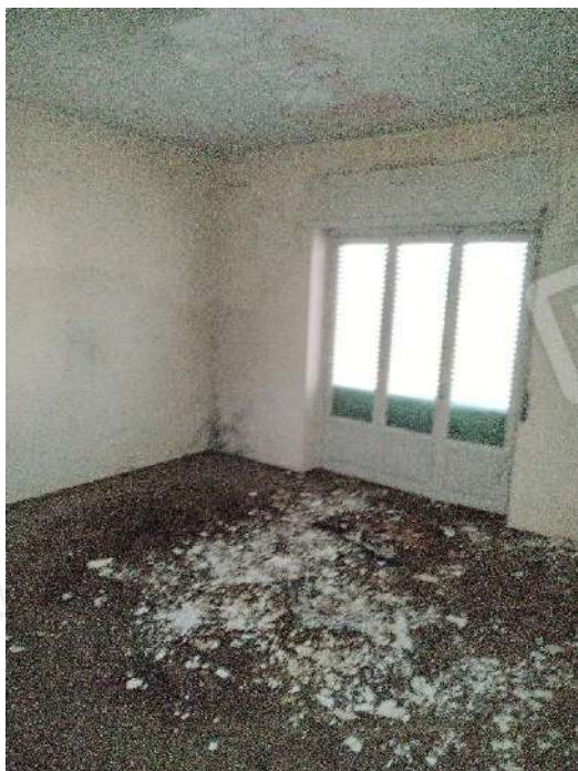
27) Appartamento a piano primo (fg.6, part.3; sub. 17);