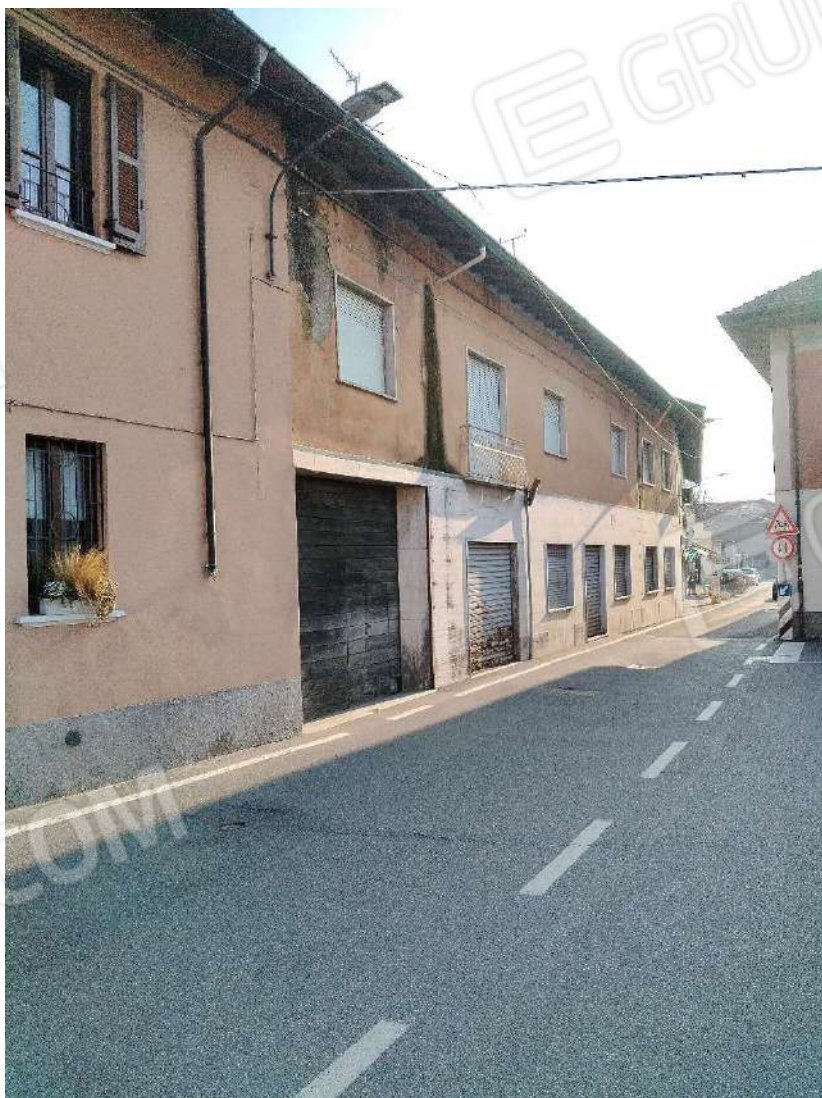
1) Panoramica dei fabbricati in P.zza Antonio Gramsci a Corgeno di Vergiate ,

LOTTO 4 _ Beni in Corgeno di Vergiate, P.zza Antonio Gramsci