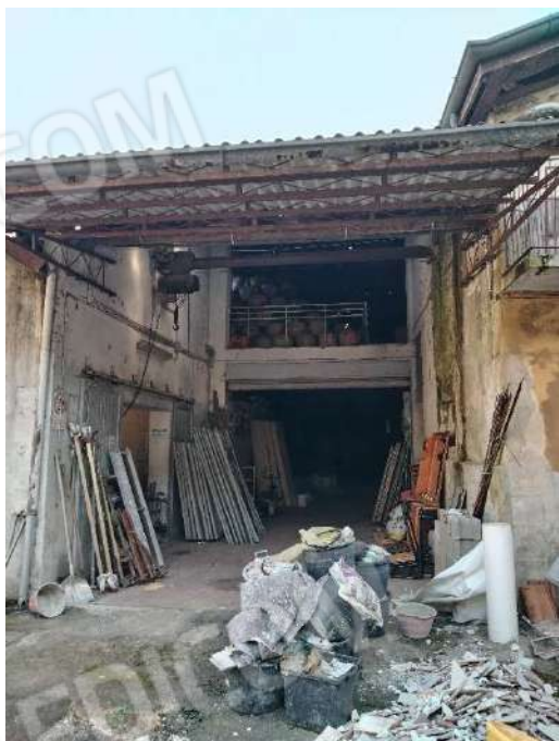
9) Ingresso dei magazzini per la lavorazione Prodotti Vinicoli (fg.6, part.3; sub. 12)