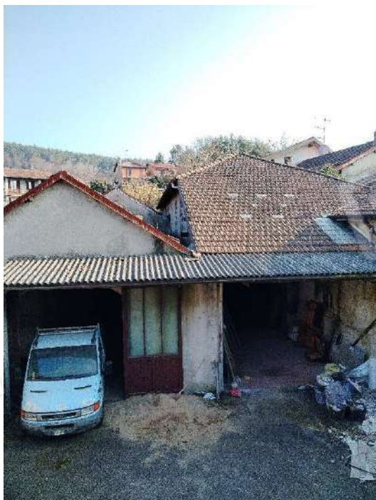
6) Fronte dei depositi verso la corte interna;