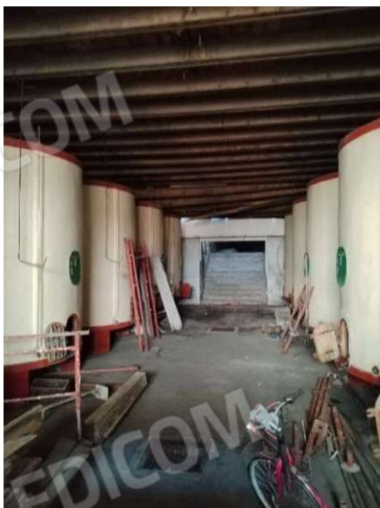
11) Magazzini per la lavorazione Prodotti Vinicoli (fg.6, part.3; sub. 12)