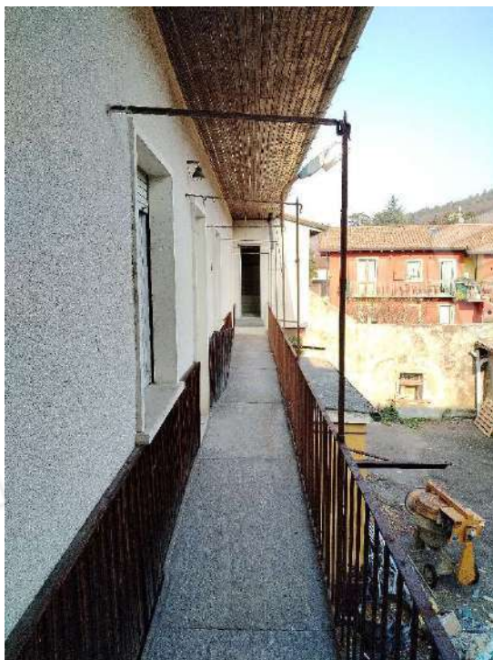
22) Ballatoio di distribuzione a piano primo ;