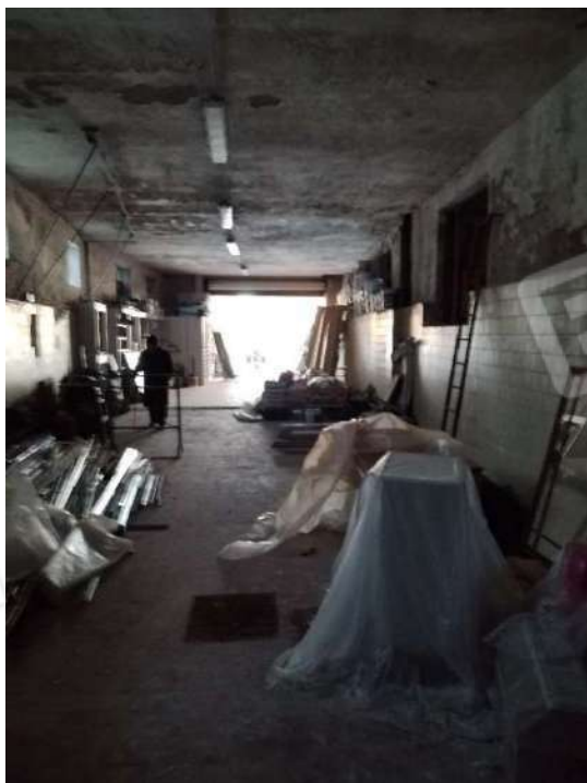
10) Magazzini per la lavorazione Prodotti Vinicoli (fg.6, part.3; sub. 12)