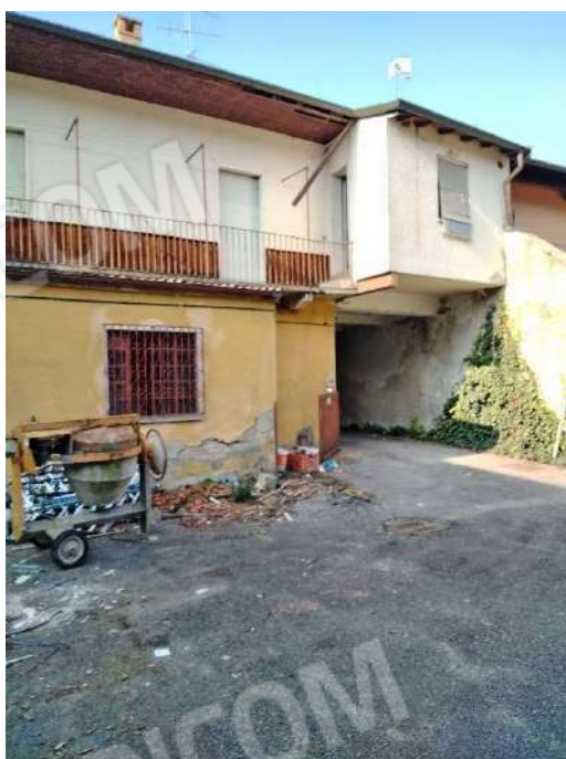
7) Retro dei fabbricati su strada che affacciano sulla corte interna;