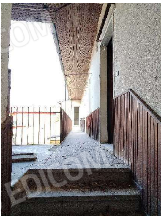
21) Accesso al ballatoio che distribuisce gli altri ambienti a piano primo ;

Non è stato possibile fare altre foto del subalterno per difficoltà ad accedere agli spazi