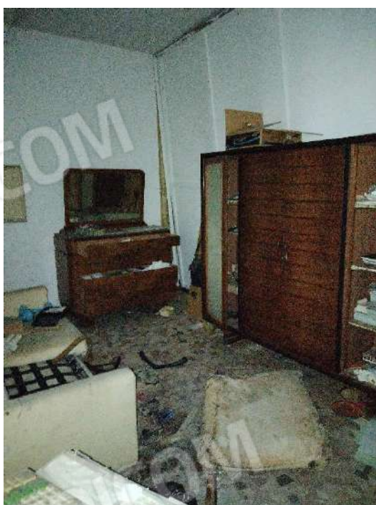
26) Altro ambiente (fg.6, part.3; sub. 16);