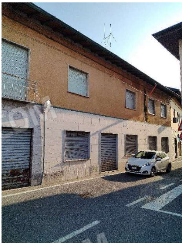
3) Prospetto della proprietà Lungo via Fratelli Rosselli ;