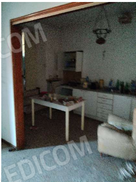
23) Appartamento a piano primo cucina (fg.6, part.3; sub. 16);