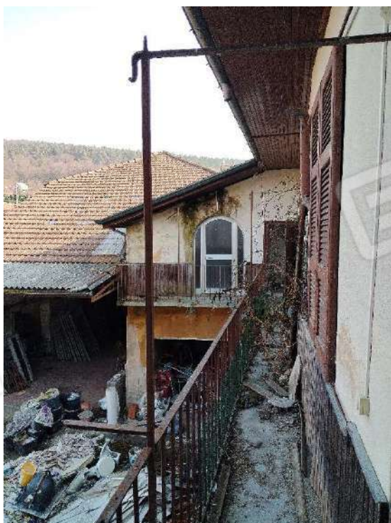
20) Cucina Rustica a piano primo (fig.6, part.3; sub. 19);

Non è stato possibile fare altre foto del subalterno per difficoltà ad accedere agli spazi