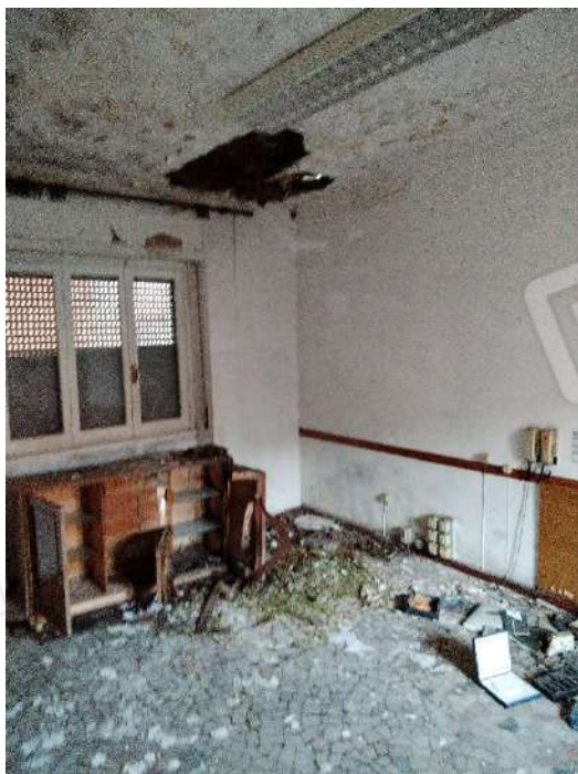
25) Ambiente a confine con la cucina (fg.6, part.3; sub. 16);