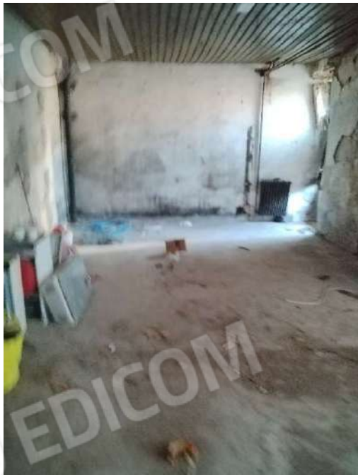
15) Deposito Materiali Vari (fg.6, part.3; sub. 13)