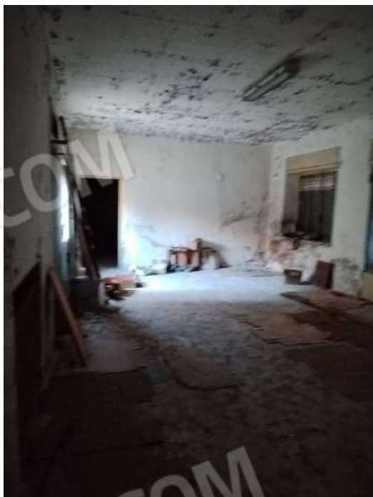
17) Bottega a piano terra con accesso su strada (fg.6, part.3; sub. 14);