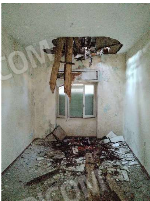
28) Appartamento a piano primo (fg.6, part.3; sub. 17);