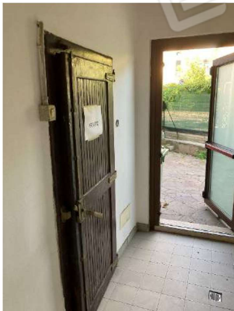
CELLA FRIGO – cella frigorifera raggiungibile da ingresso riservato all'attività