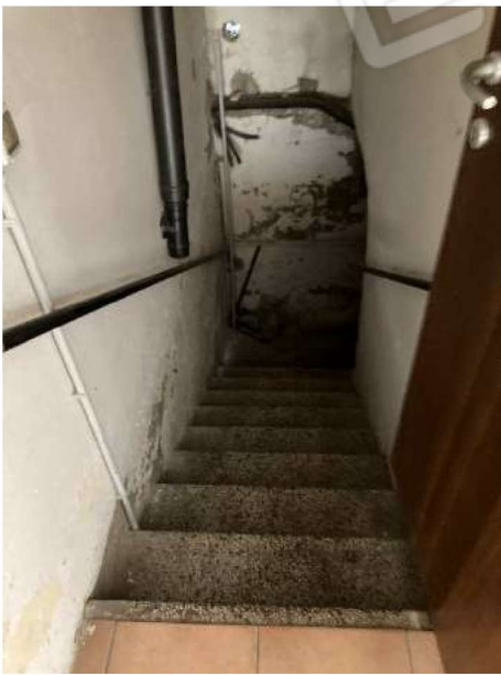
SCALA LOCALE TECNICO – scala di collegamento al locale tecnico interrato da disimpegno bar