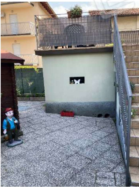
DEPOSITO – vista esterna deposito insistente su map.804 (scala e terrazza non oggetto di pignoramento).