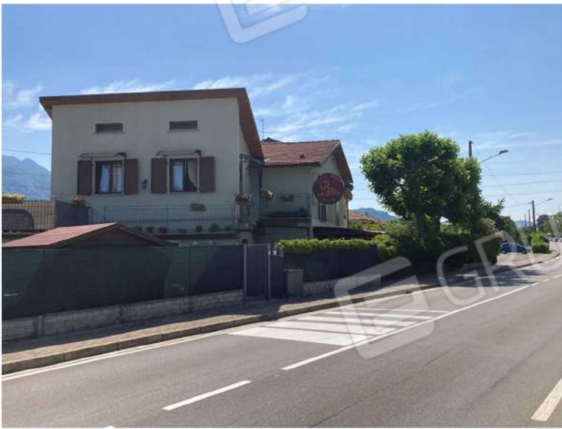
PROSPETTO NORD OVEST – vista d'angolo, accesso da cancello pedonale al map.804 da via Cesare Cantù