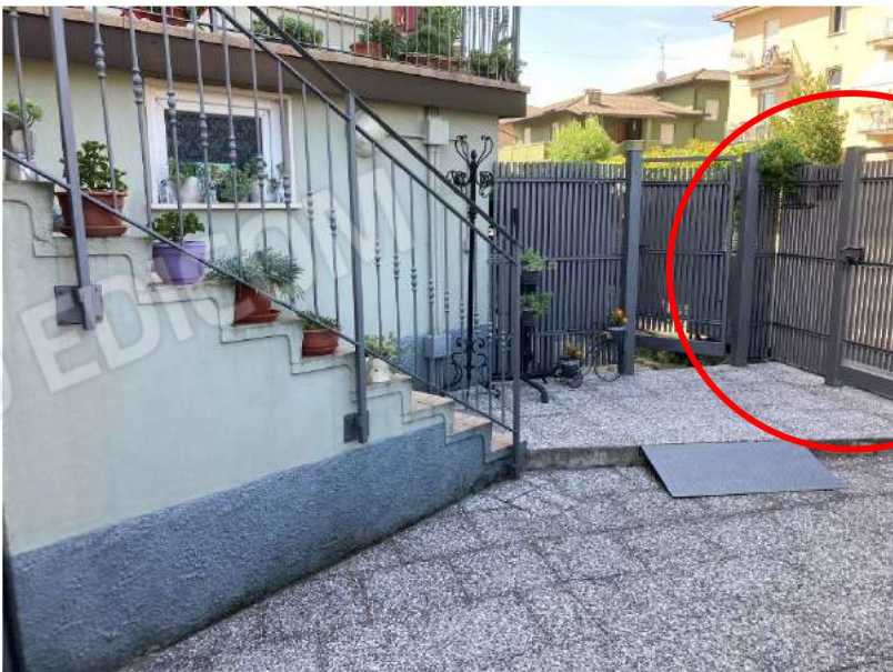
DETTAGLIO ACCESSO PEDONALE – vista cancello su via Cantù da cortile map.804