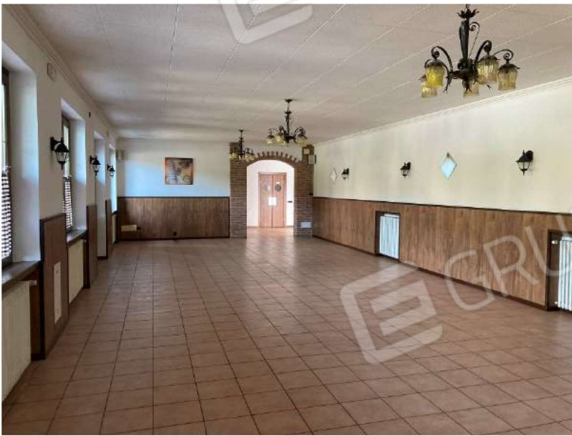
SALA RISTORANTE – vista 2