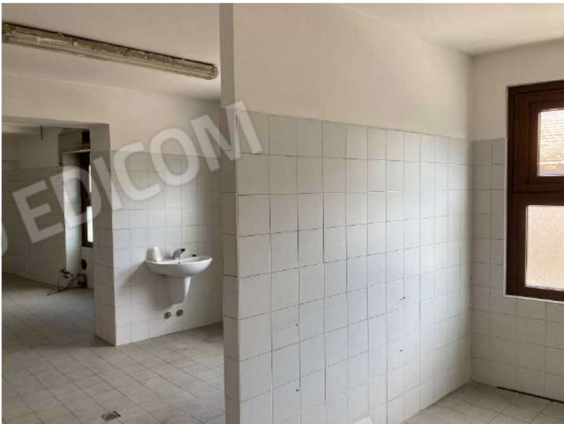
LOCALI LAVAGGIO E CUCINA – in sequenza zona lavaggio, cucina vano 1