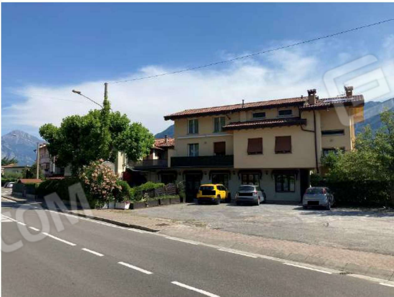
PROSPETTO OVEST – vista da via Cesare Cantù