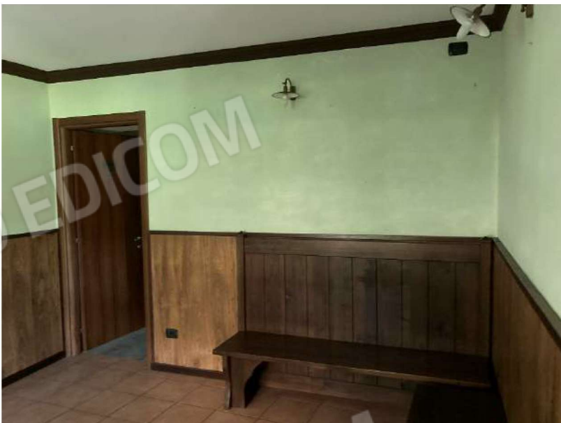
SALETTA BAR – vista saletta bar e accesso ai locali spogliatoi retrostanti