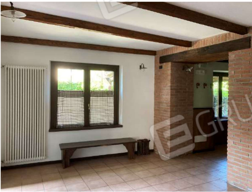
BAR – zona ingresso bar, vista verso portale saletta adiacente