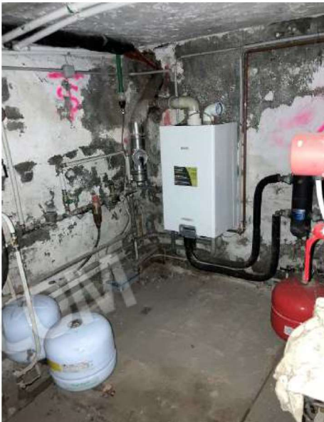
PIANO INTERRATO – locale tecnico, vista caldaia