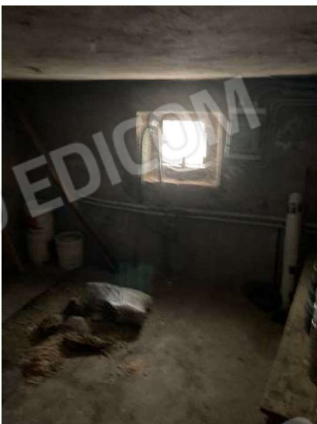
PIANO INTERRATO – locale deposito/cantina