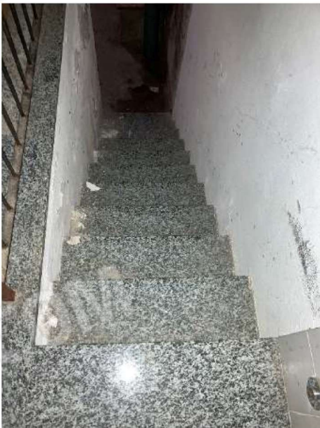
SCALA LOCALE DEPOSITO – scala di accesso al deposito/cantina interrato (dai locali spogliatoi)