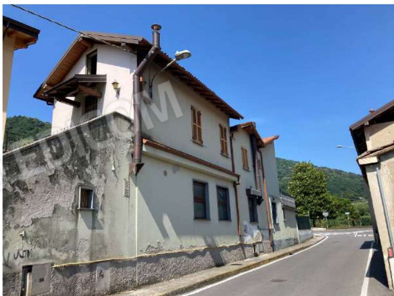
PROSPETTO EST – vista da via Campagnola