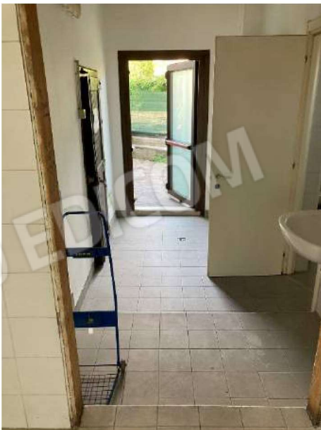
INGRESSO SECONDARIO – vista da interno