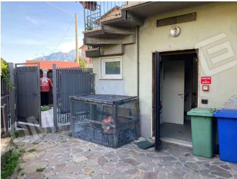
INGRESSO SECONDARIO – accesso dedicato all'attività da map.804