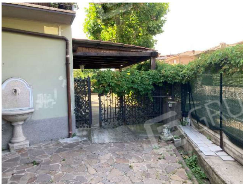
CORTILE ESTERNO – map.804 map.909 recinzione divisoria e tettoia insistente su map.909