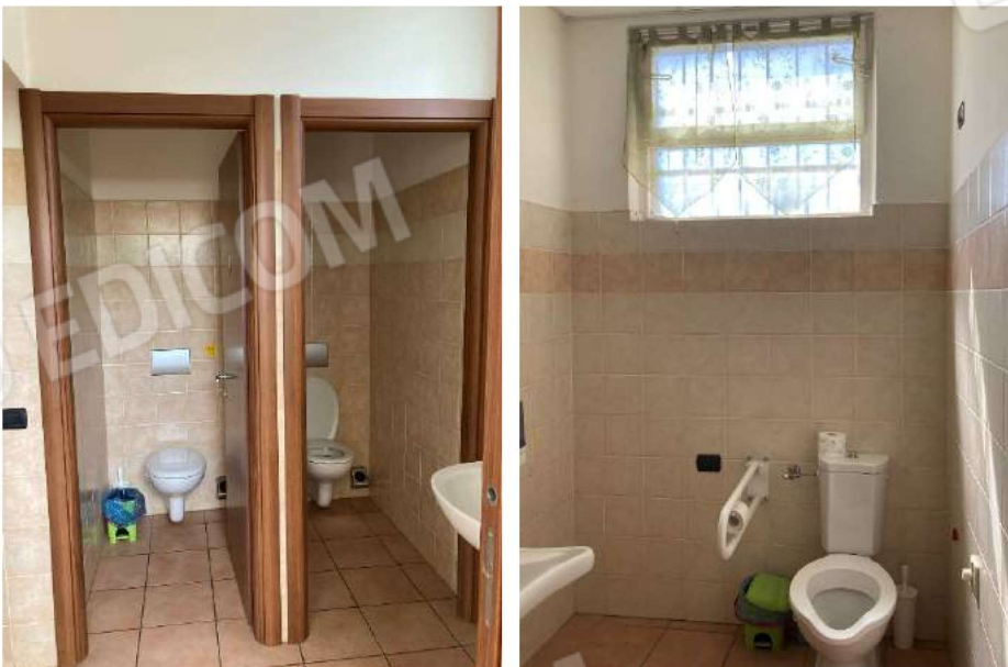
SERVIZI IGIENICI RISTORANTE – wc donna uomo e disabili