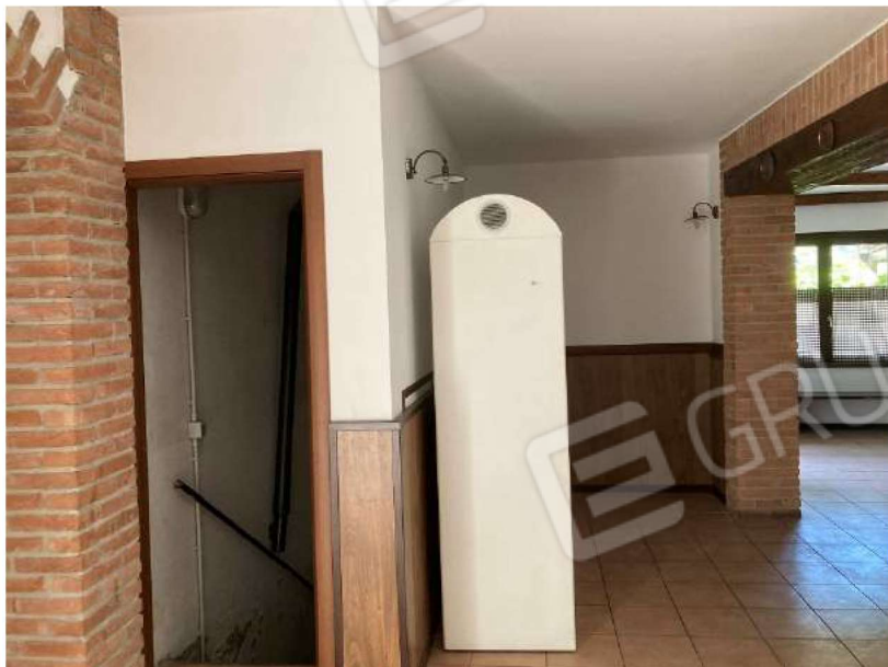
DISIMPEGNO BAR/RISTORANTE – locale disimpegno vista verso accesso locale tecnico interrato