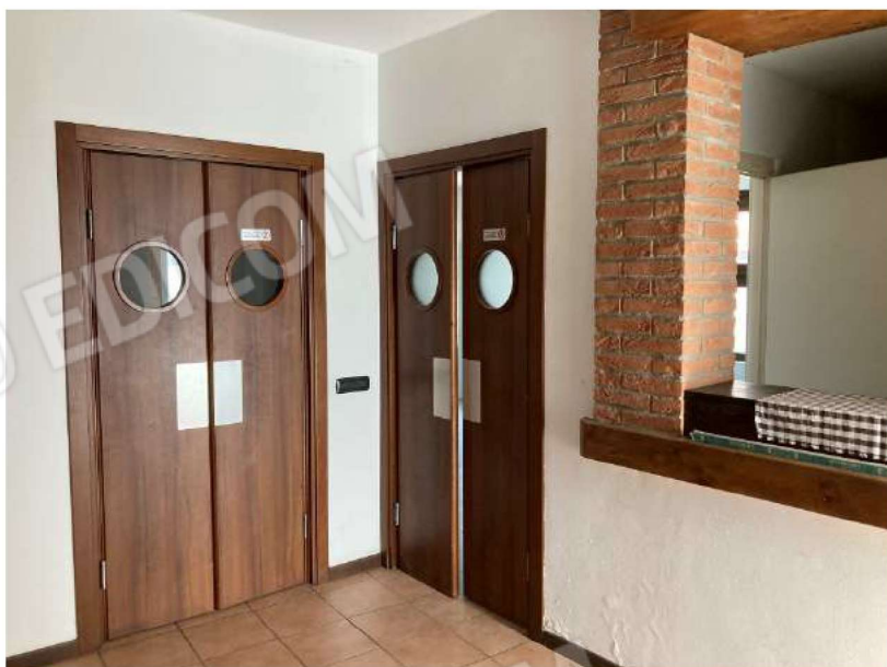
DISIMPEGNO BAR/RISTORANTE – vista accessi locale lavaggio, disimpegno 2 e vano passante verso locale preparazione pizze