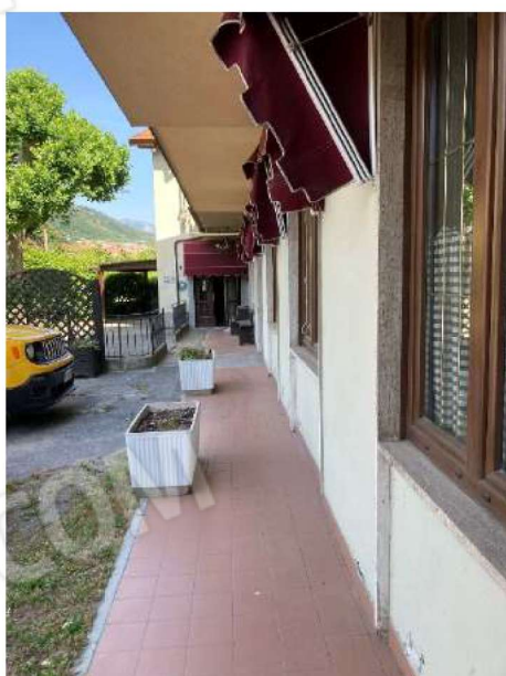
INGRESSO PRINCIPALE – vista esterna ingresso bar ristorante