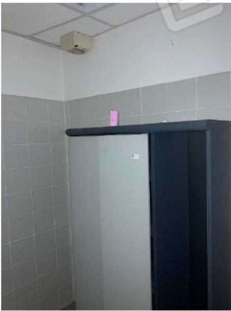
SPOGLIATOI PERSONALE – vista generica di un locale spogliatoio (divisi uomo donna)