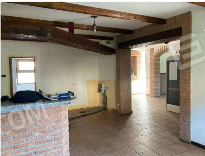
BAR – locale bar, vista verso disimpegno sala ristorante