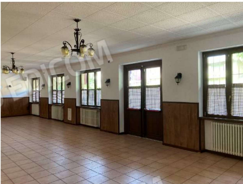
SALA RISTORANTE – vista 1