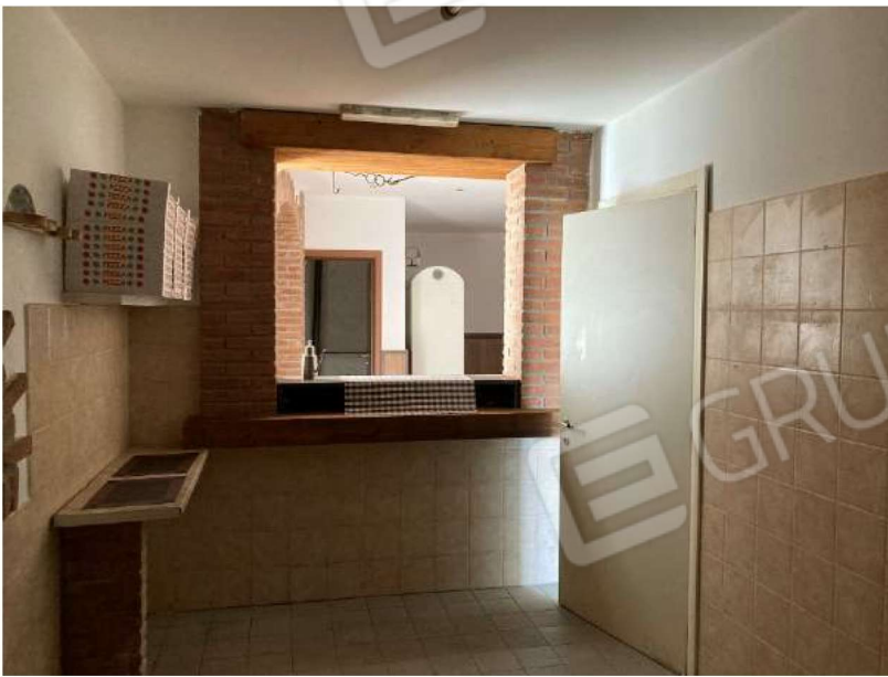
LOCALE PREPARAZIONE PIZZE – vista vano passante verso disimpegno bar/ristorante