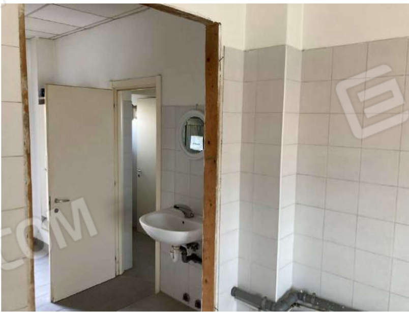
DISIMPEGNO INGRESSO SECONDARIO – vista da locale preparazione alimenti