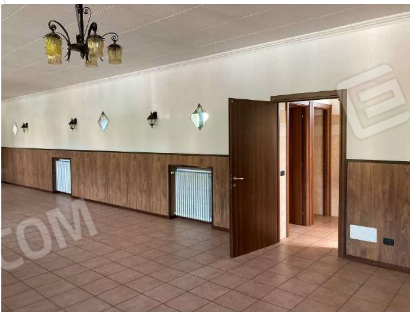
SALA RISTORANTE – vista accesso servizi igienici