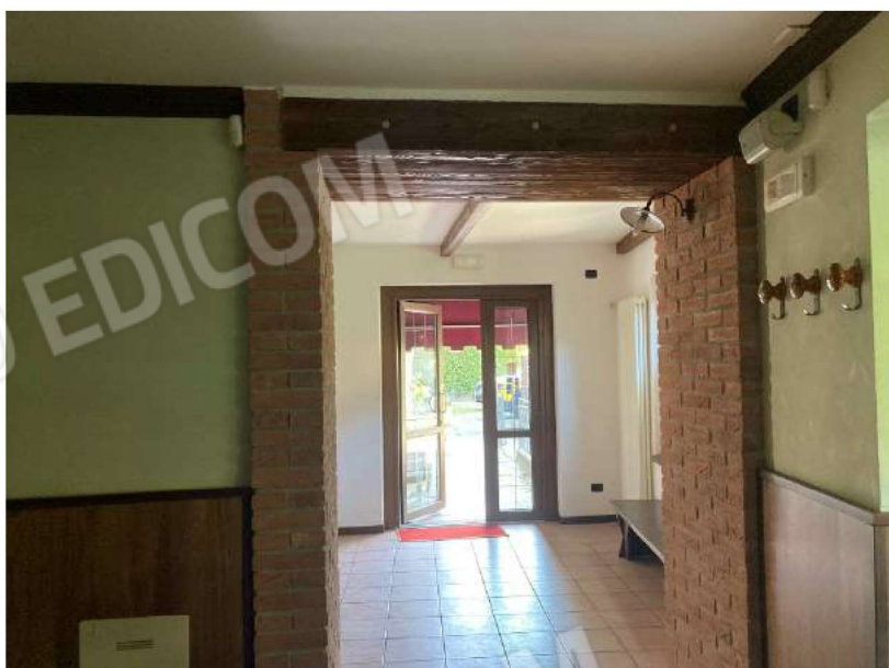
INGRESSO PRINCIPALE – vista da interno