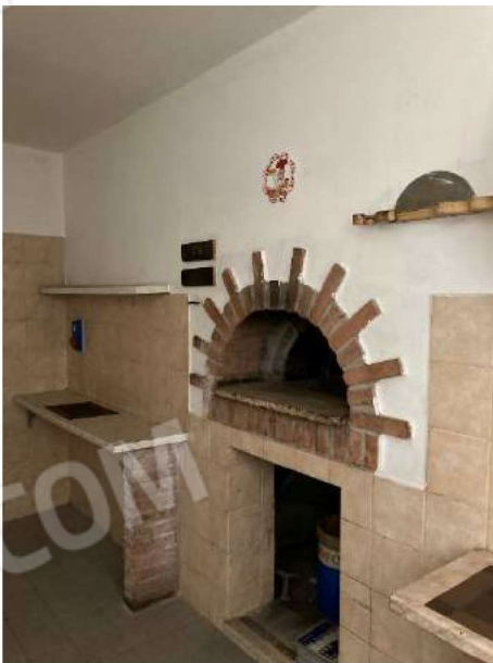
PREPARAZIONE PIZZE – vista forno