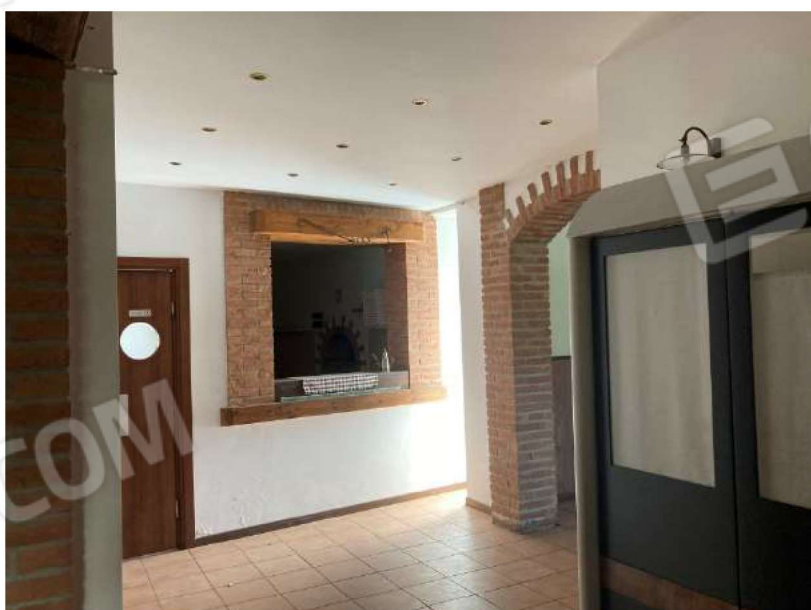
DISIMPEGNO BAR/RISTORANTE – vista verso sala ristorante e accesso locale lavaggio