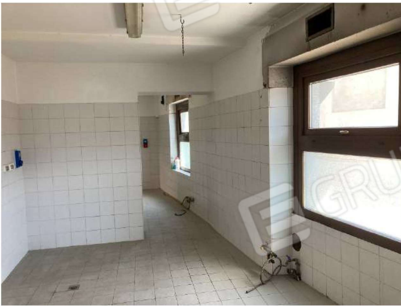
LOCALI CUCINA E PREPARAZIONE ALIMENTI – in sequenza cucina vano 2 e locale preparazione alimenti