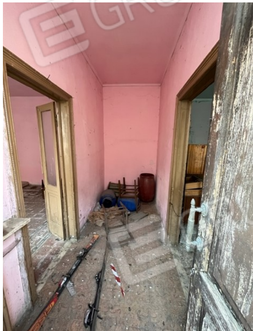
Piano terra: ingresso dalla porta su pubblica via

Viale A. Necchi 4 27100 Pavia Tel. 3392772355 e-mail nverdi2@gmail.com pec mail: nicola.verdi@pec.ording.pv.it P.IVA 01806320188 Iscritto all'Albo degli Ingegneri della Provincia di Pavia al n. 1981