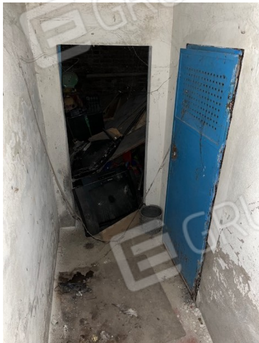
Locali al piano interrato inaccessibili in quanto colmi di materiale vario

Viale A. Necchi 4 27100 Pavia Tel. 3392772355 e-mail nverdi2@gmail.com pec mail: nicola.verdi@pec.ording.pv.it P.IVA 01806320188 Iscritto all'Albo degli Ingegneri della Provincia di Pavia al n. 1981