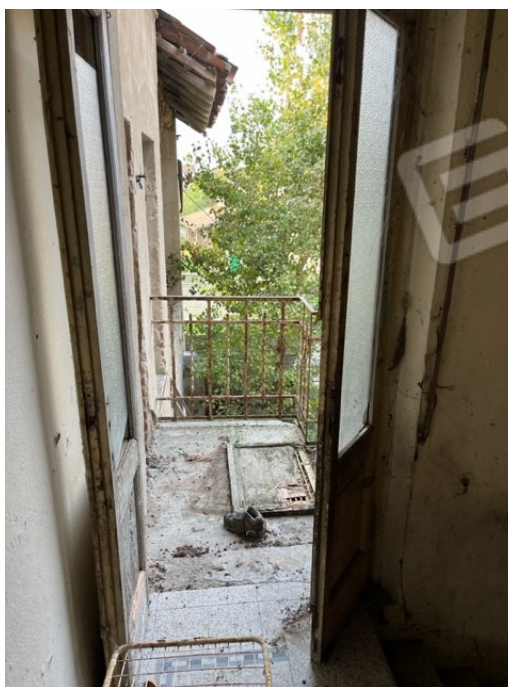
Balcone in lato sud di accesso esterno al locale di sgombero