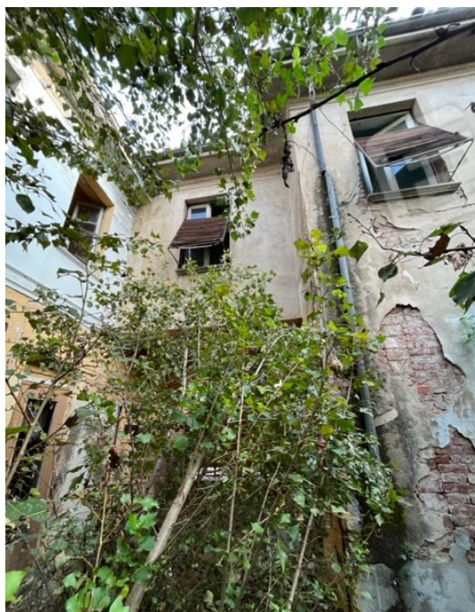
Vista facciata sud dal cortile interno