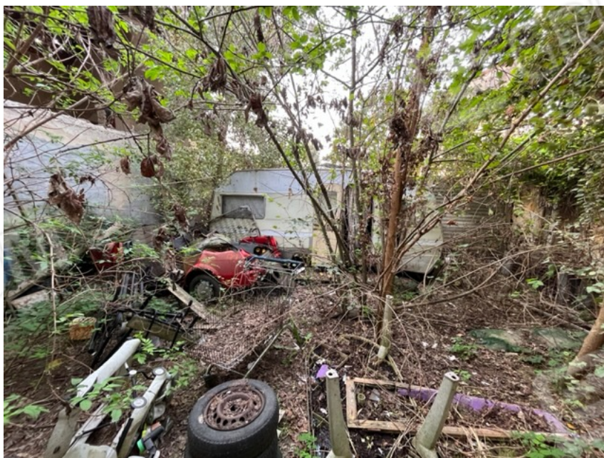
Vista del cortile interno di uso comune