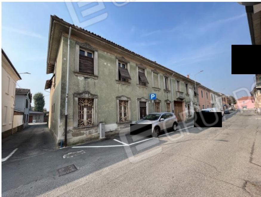
Vista del fabbricato dalla pubblica via Olivelli (lato nord).

Viale A. Necchi 4 27100 Pavia Tel. 3392772355 e-mail nverdi2@gmail.com pec mail: nicola.verdi@pec.ording.pv.it P.IVA 01806320188 Iscritto all'Albo degli Ingegneri della Provincia di Pavia al n. 1981