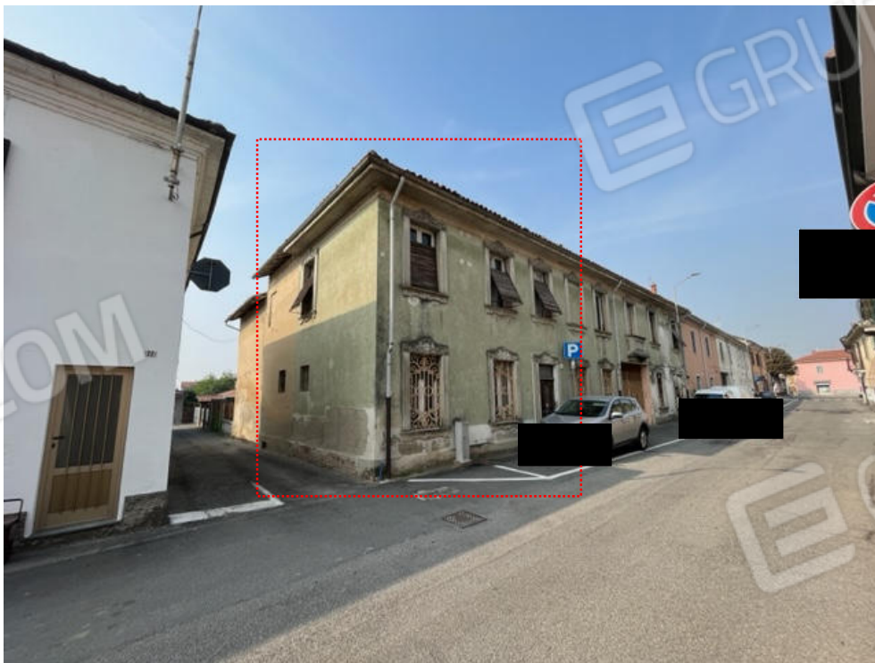
Vista del fabbricato dalla pubblica via Olivelli (lato nord-ovest).