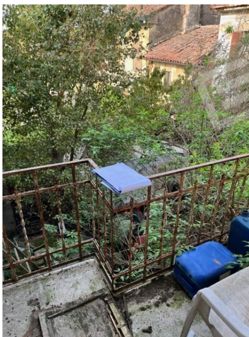
Balcone lato sud