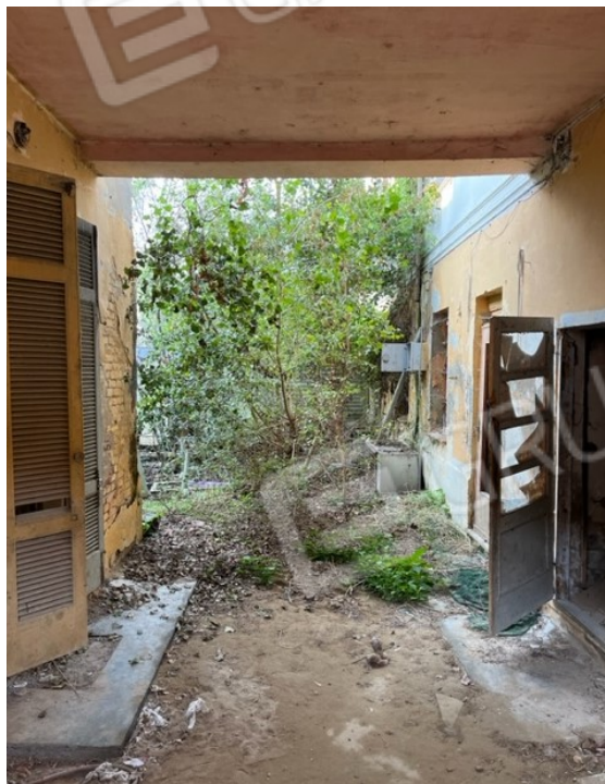
Vista dall' androne di ingresso di uso comune