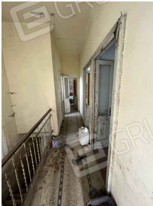
Corridoio al piano primo

Viale A. Necchi 4 27100 Pavia Tel. 3392772355 e-mail nverdi2@gmail.com pec mail: nicola.verdi@pec.ording.pv.it P.IVA 01806320188 Iscritto all'Albo degli Ingegneri della Provincia di Pavia al n. 1981