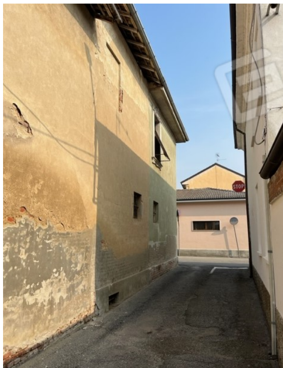
Vista esterna lato ovest – vicolo S Rocco