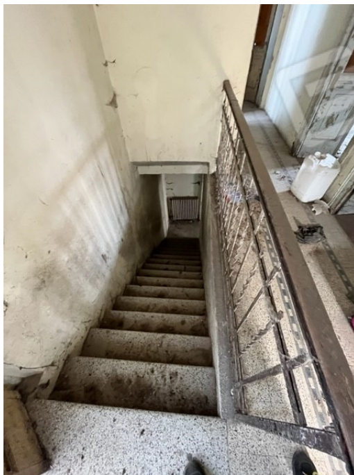
Scala di accesso al piano primo