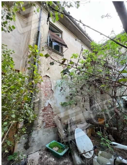
Vista facciata sud dal cortile interno

Viale A. Necchi 4 27100 Pavia Tel. 3392772355 e-mail nverdi2@gmail.com pec mail: nicola.verdi@pec.ording.pv.it P.IVA 01806320188 Iscritto all'Albo degli Ingegneri della Provincia di Pavia al n. 1981