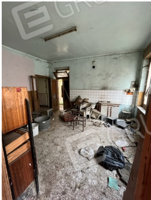
Piano terra: cucina entrando a destra

Viale A. Necchi 4 27100 Pavia Tel. 3392772355 e-mail nverdi2@gmail.com pec mail: nicola.verdi@pec.ording.pv.it P.IVA 01806320188 Iscritto all'Albo degli Ingegneri della Provincia di Pavia al n. 1981