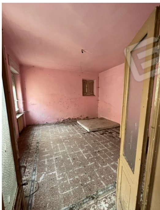
Piano terra: stanza entrando a sinistra