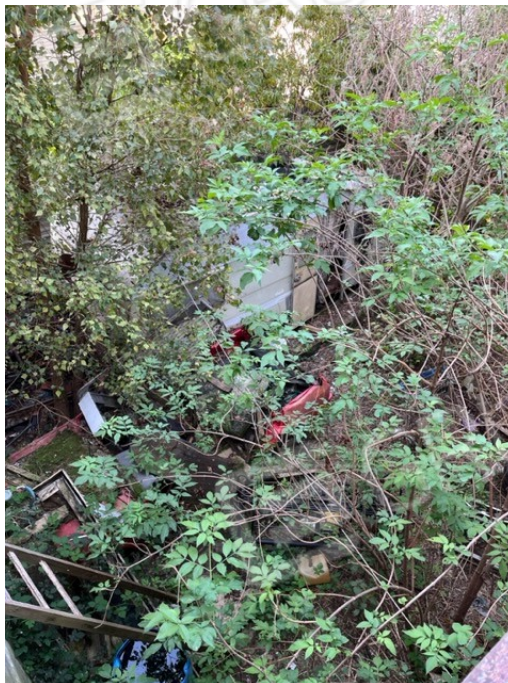
Vista dal balcone del cortile comune sottostante

Viale A. Necchi 4 27100 Pavia Tel. 3392772355 e-mail nverdi2@gmail.com pec mail: nicola.verdi@pec.ording.pv.it P.IVA 01806320188 Iscritto all'Albo degli Ingegneri della Provincia di Pavia al n. 1981