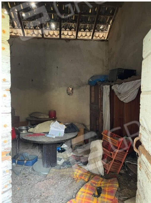
Locale di sgombero

Viale A. Necchi 4 27100 Pavia Tel. 3392772355 e-mail nverdi2@gmail.com pec mail: nicola.verdi@pec.ording.pv.it P.IVA 01806320188 Iscritto all'Albo degli Ingegneri della Provincia di Pavia al n. 1981