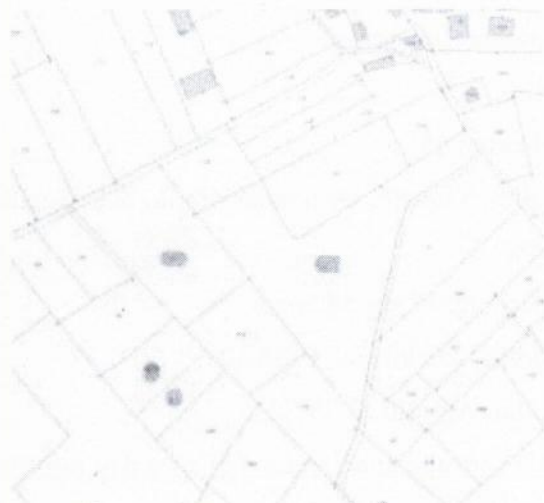
STRALCIO DELLA CARTOGRAFIA DI CATASTO TERRENI FOGLIO 9 IN COMUNE DI ROVESCALA

INDIVIDUAZIONE DEL BENE OGGETTO DELLA PROCEDURA ESECUTIVA IMMOBILIARE R.G. 274/2023