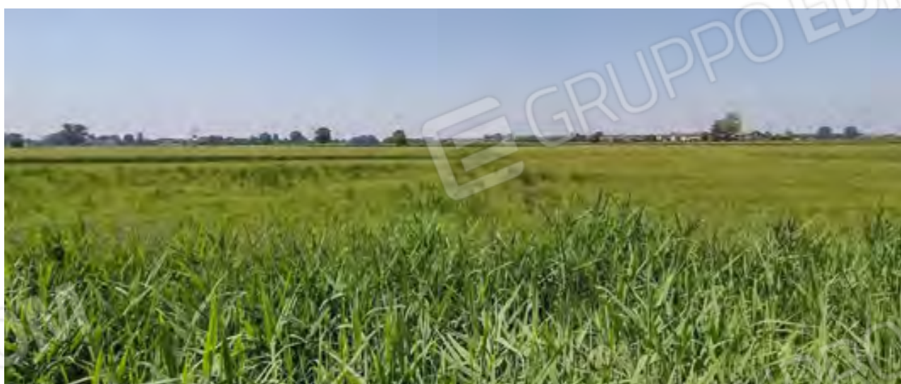
TERRENO 1 - Foglio 8 / Mappale 163