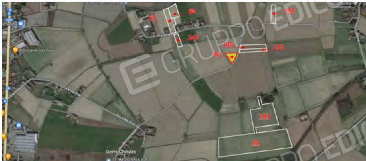
VISTA AEREA GENERALE DEI TERRENI - IN EVIDENZA IL MAPPALE COMPRESO IN QUESTO LOTTO