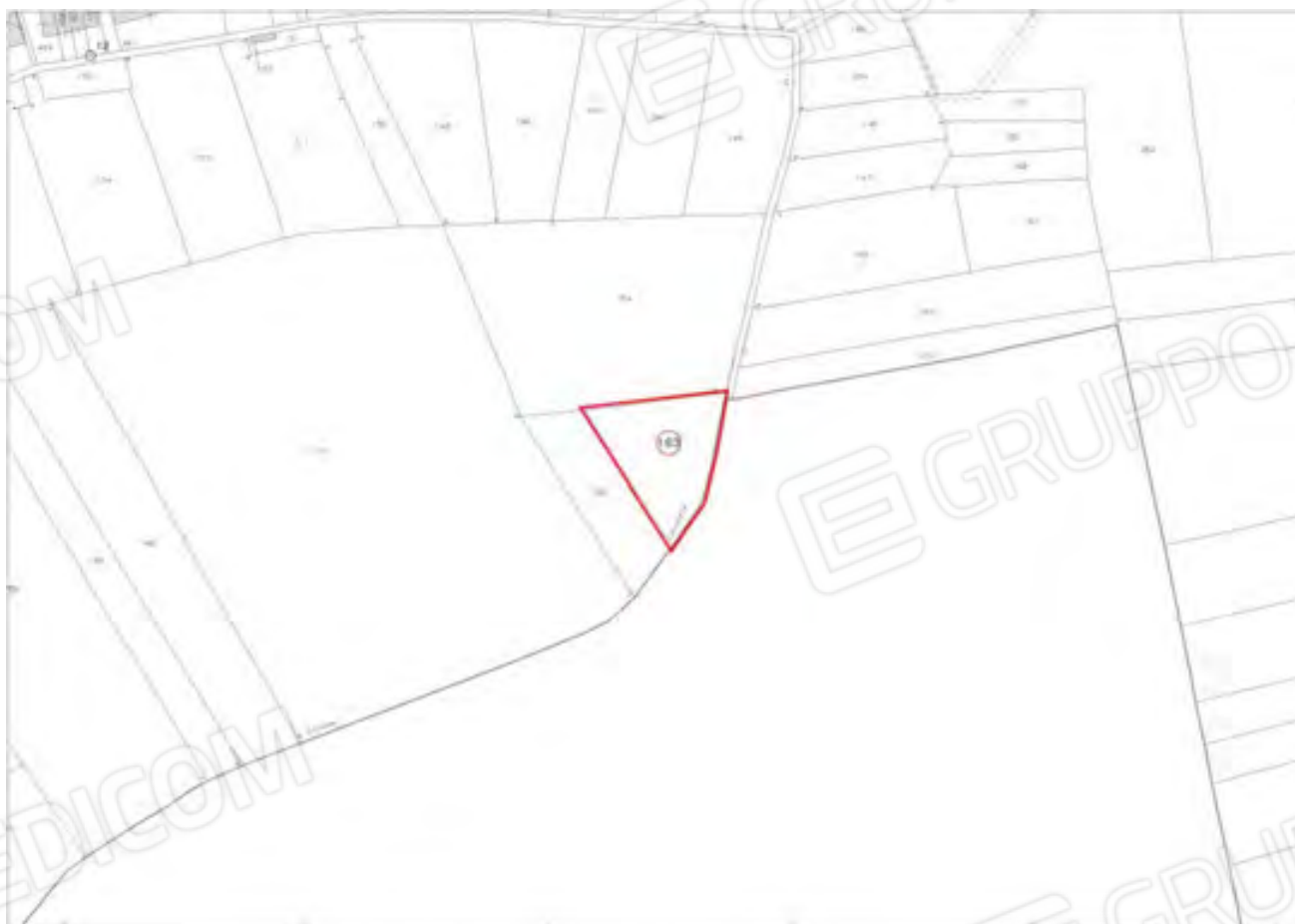
MAPPA CATASTALE DEI TERRENI - IN EVIDENZA IL MAPPALE COMPRESO IN QUESTO LOTTO