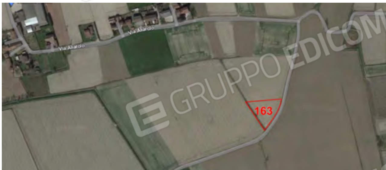
DETTAGLIO VISTA AEREA TERRENO 1/MAPPALE 163