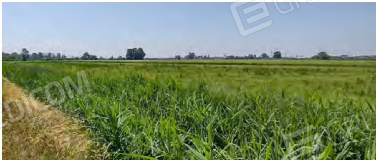
TERRENO 1 - Foglio 8 / Mappale 163