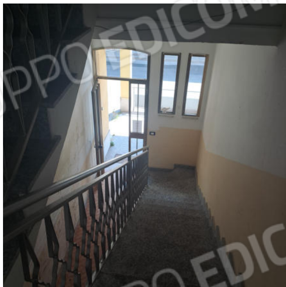
Foto 8- Ingresso e vano scala comune