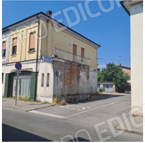
Foto 2- Edificio da Via Umberto I-Lato est-nord