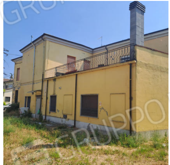
Foto 4 - Edificio dalla corte interna I-Lato ovest-sud