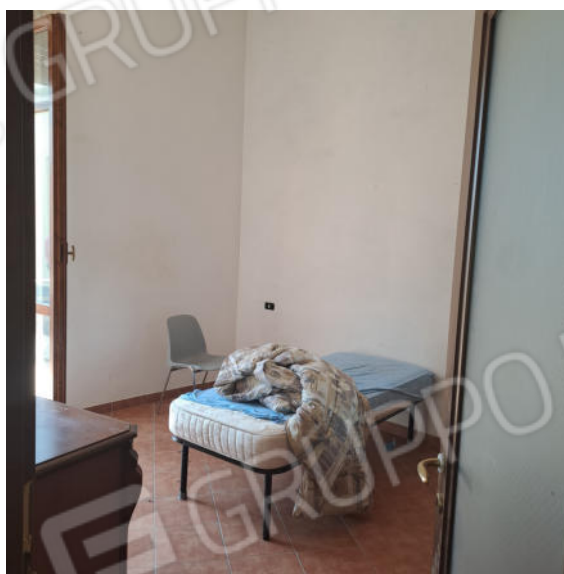
Foto 16 - Camera.