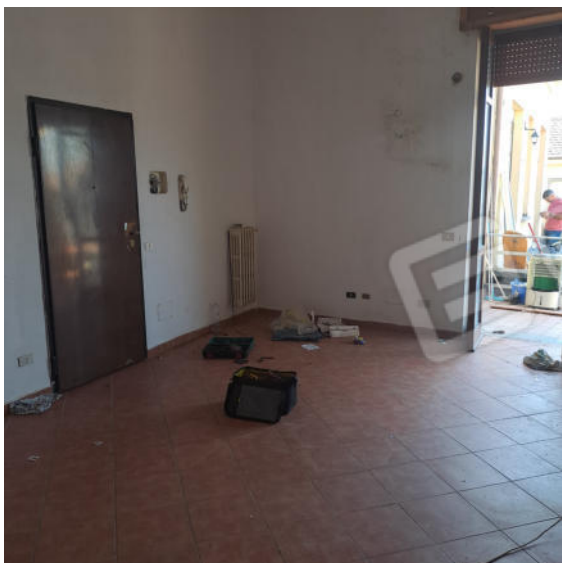
Foto 13- Porta d'ingresso e soggiorno

Esecuzione Immobiliare N° 63/2025 R.G.E.I. promossa da PENELOPE SPV S.r.L. nei confronti del Debitore Immobile in Comune di Lungavilla (Pv) – Via Umberto I n. 217.