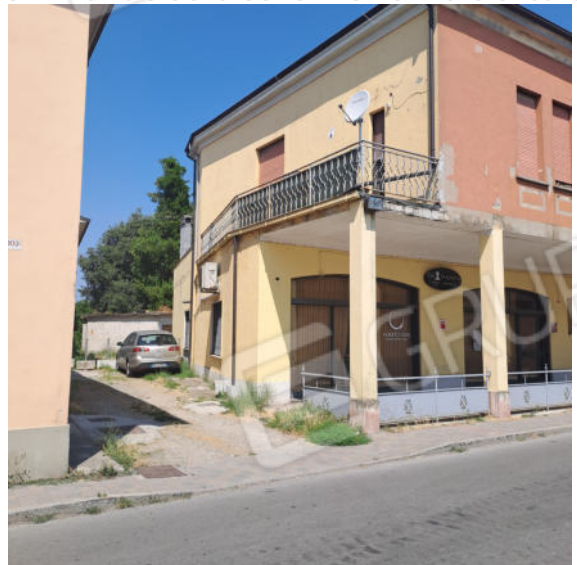
Foto 6 - Edificio dalla corte interna I-Lato sud-est