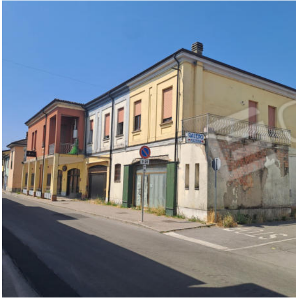
Foto 1-Edificio da Via Umberto I-Lato est-nord

Esecuzione Immobiliare N° 63/2025 R.G.E.I. promossa da PENELOPE SPV S.r.L. nei confronti del Debitore Immobile in Comune di Lungavilla (Pv) – Via Umberto I n. 217.