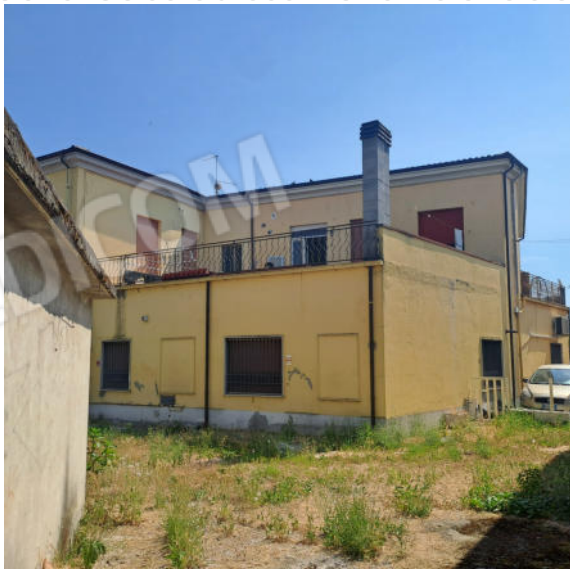
Foto 5 - Edificio dalla corte interna I-Lato ovest-sud