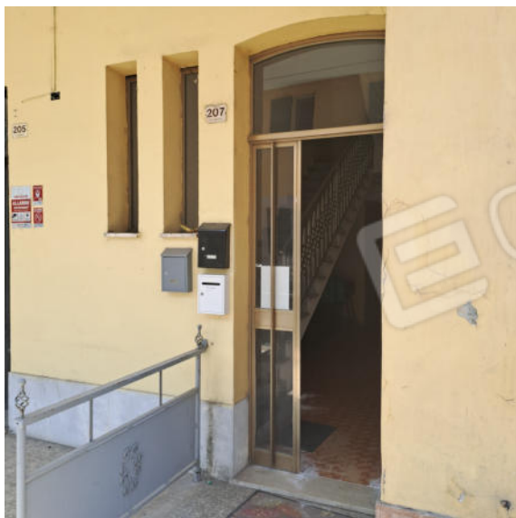
Foto 7-Ingresso condominiale da Via Umberto I

Esecuzione Immobiliare N° 63/2025 R.G.E.I. promossa da PENELOPE SPV S.r.L. nei confronti del Debitore Immobile in Comune di Lungavilla (Pv) – Via Umberto I n. 217.