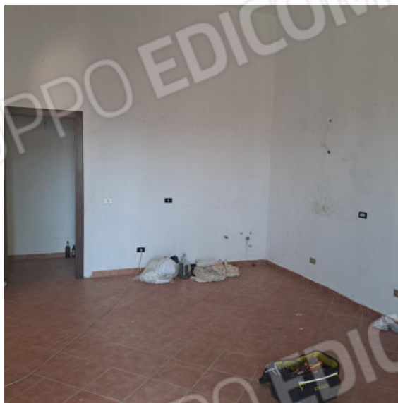
Foto 14 - Soggiorno.