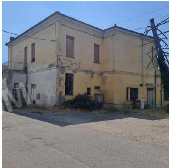
Foto 3-Edificio dalla strada interna I-Lato nord-ovest