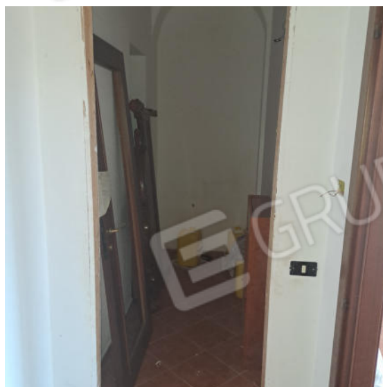
Foto 18 - Ripostiglio