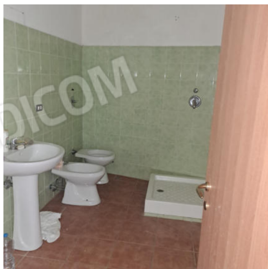
Foto 17 - Bagno