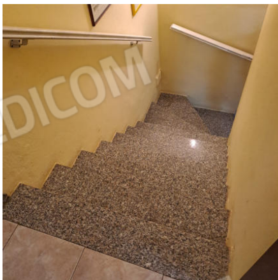
Foto 11 – Edificio residenziale - Scala di accesso a piano primo.