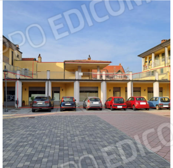
Foto 8 - Prospetto sud dalla Piazza Pertini.