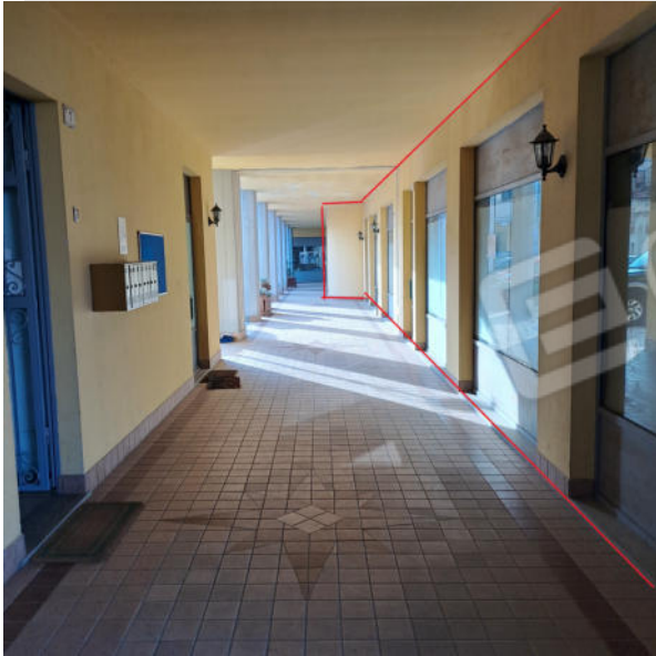
Foto 7 - Porticato condominiale

Esecuzione Immobiliare N° 0081/2022 R.G.E. promossa da Intesa SanPaolo S.p.A. nei confronti della Debitrice Immobile in Comune di Santa Giuletta (Pv) – Piazza Sandro Pertini n. 3-4-5. -Lotto ventidue-