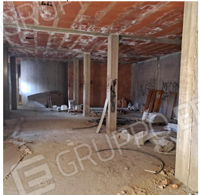
Foto 10 - Locale al piano terreno