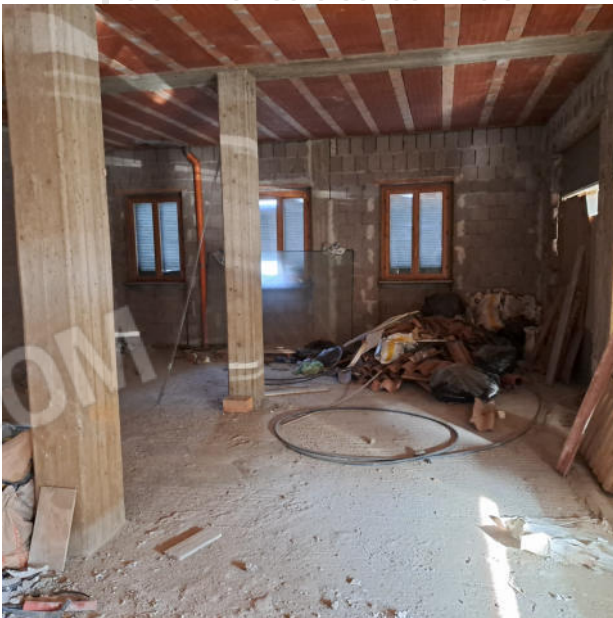
Foto 9 - Locale al piano terreno