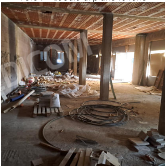
Foto 11 - Locale al piano terreno