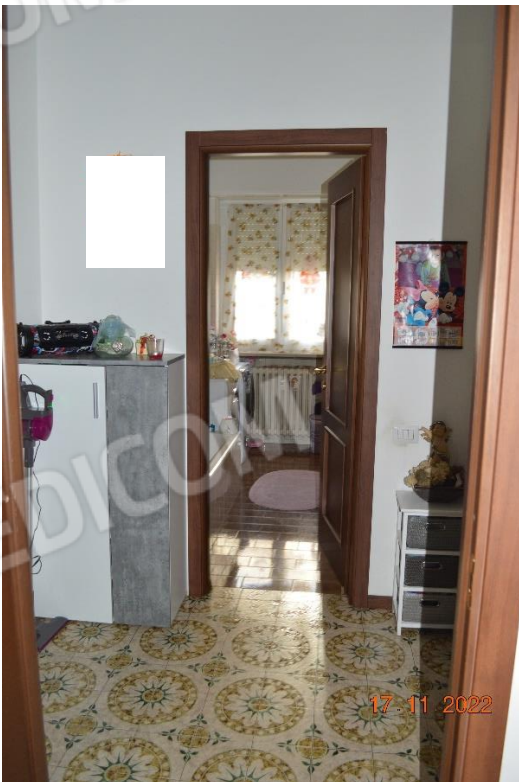
DISIMPEGNO ZONA NOTTE