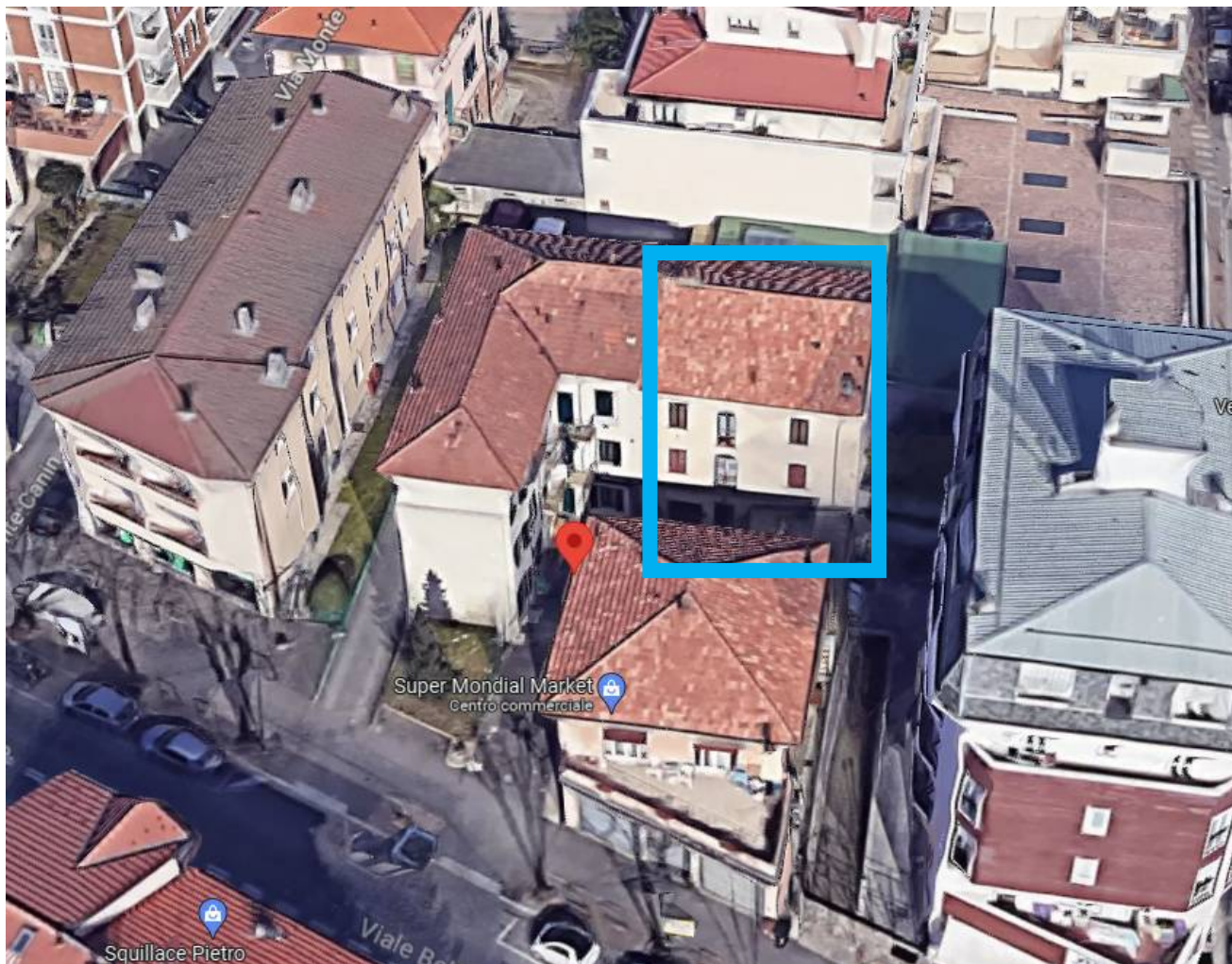
Viale Belforte n. 141 – 21100 Varese (VA)