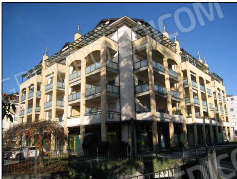
FOTO 2 ALTRA VISTA DEL FABBRICATO CHE COMPENDIA LE U.I. OGGETTO DI PROCEDURA ESECUTIVA.

FOTO 1 VISTA DEL FABBRICATO CHE COMPENDIA LE U.I. OGGETTO DI PROCEDURA ESECUTIVA.