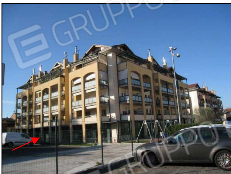
FOTO 3 ALTRA VISTA DEL FABBRICATO CHE COMPENDIA LE U.I. OGGETTO DI PROCEDURA ESECUTIVA.

Con la freccia rossa è indicata l'ubicazione dell'u.i. commerciale (ufficio) oggetto di procedura mappale 10635 sub. 87.