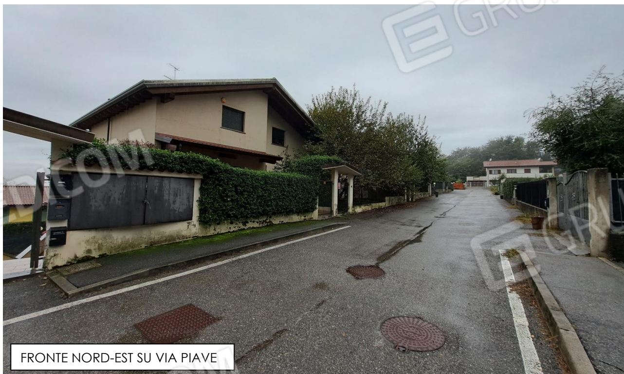
FRONTE NORD-EST SU VIA PIAVE