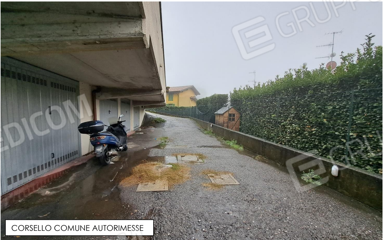
CORSELLO COMUNE AUTORIMESSE