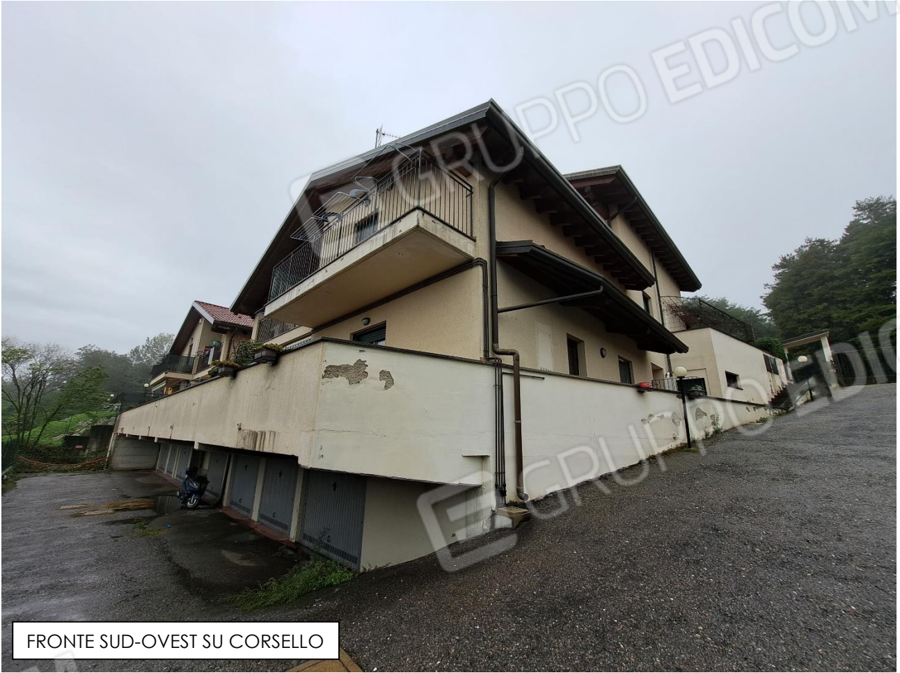
FRONTE SUD-OVEST SU CORSELLO