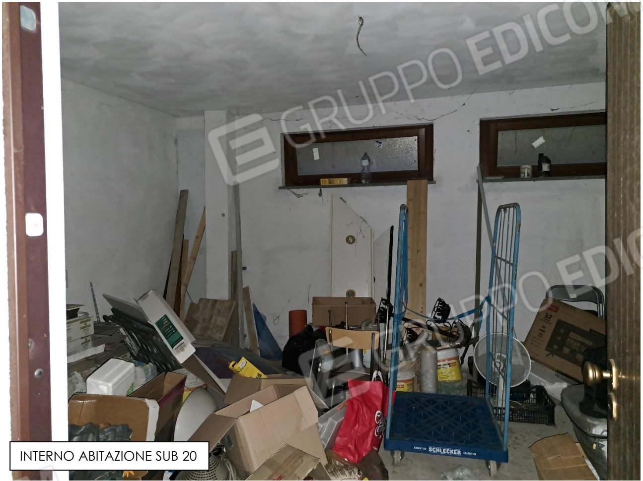
INTERNO ABITAZIONE SUB 20