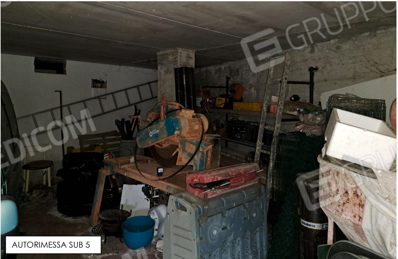
AUTORIMESSA SUB 5