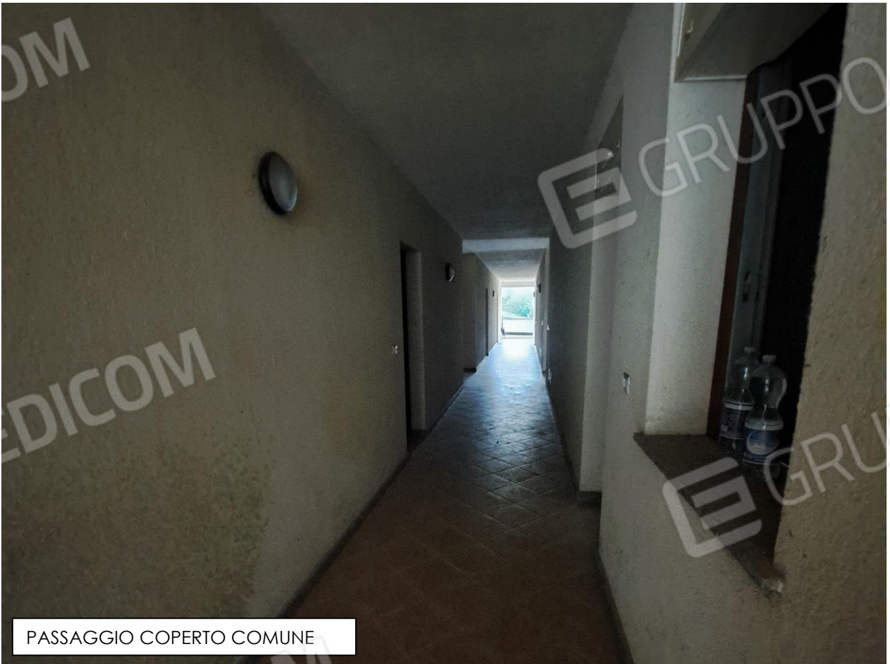
PASSAGGIO COPERTO COMUNE