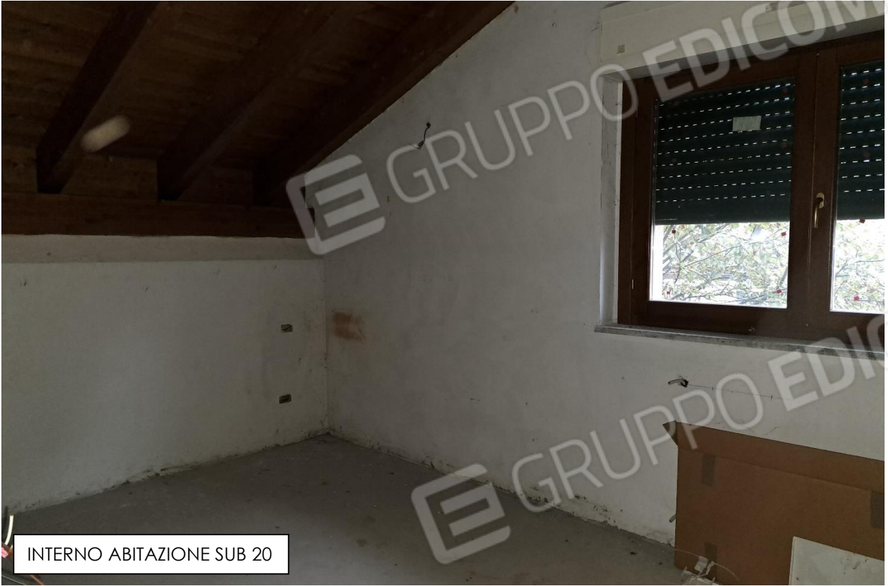
INTERNO ABITAZIONE SUB 20