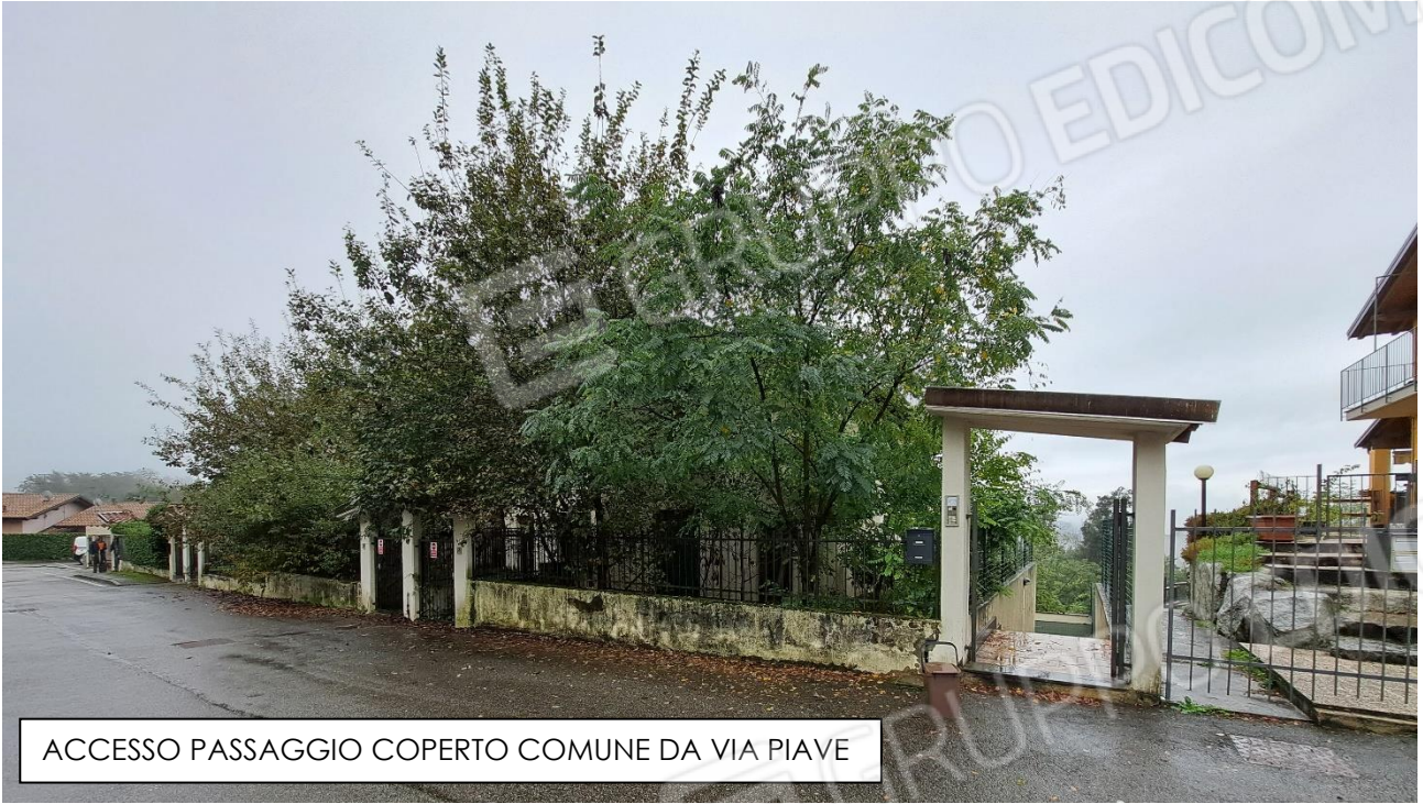
ACCESSO PASSAGGIO COPERTO COMUNE DA VIA PIAVE