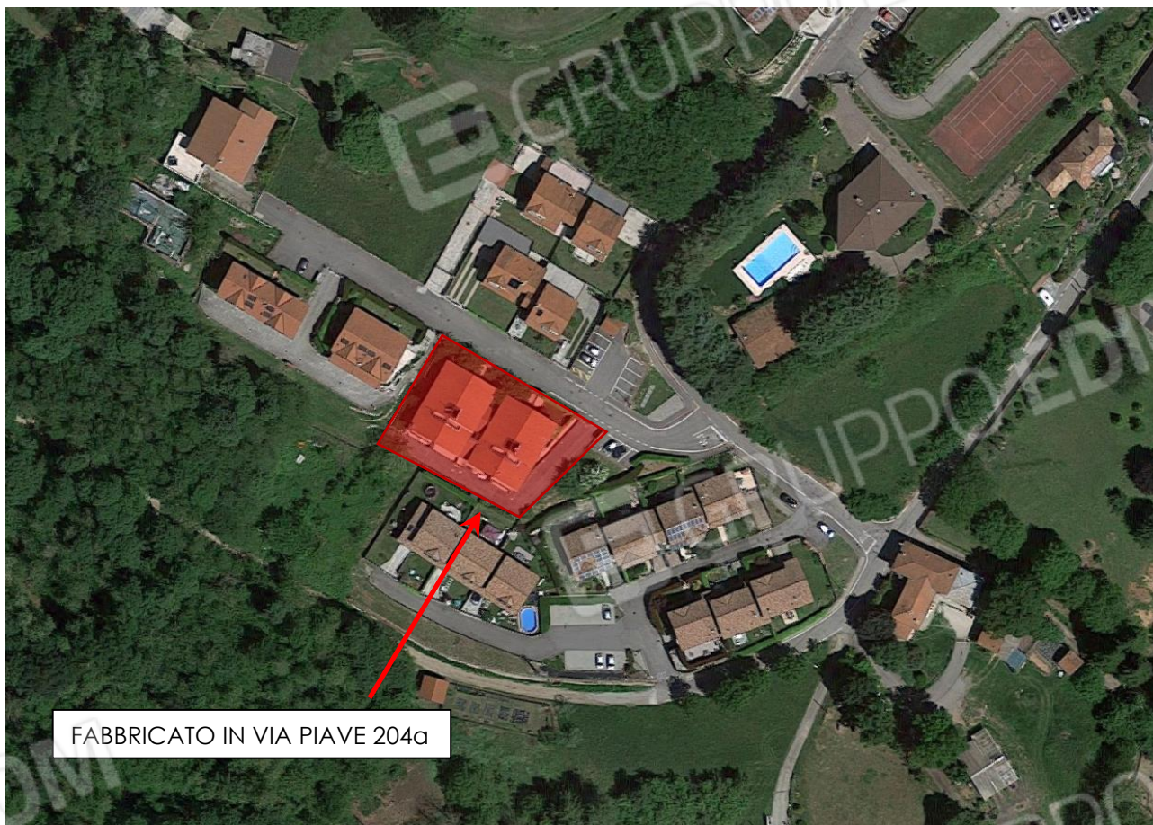
FABBRICATO IN VIA PIAVE 204a