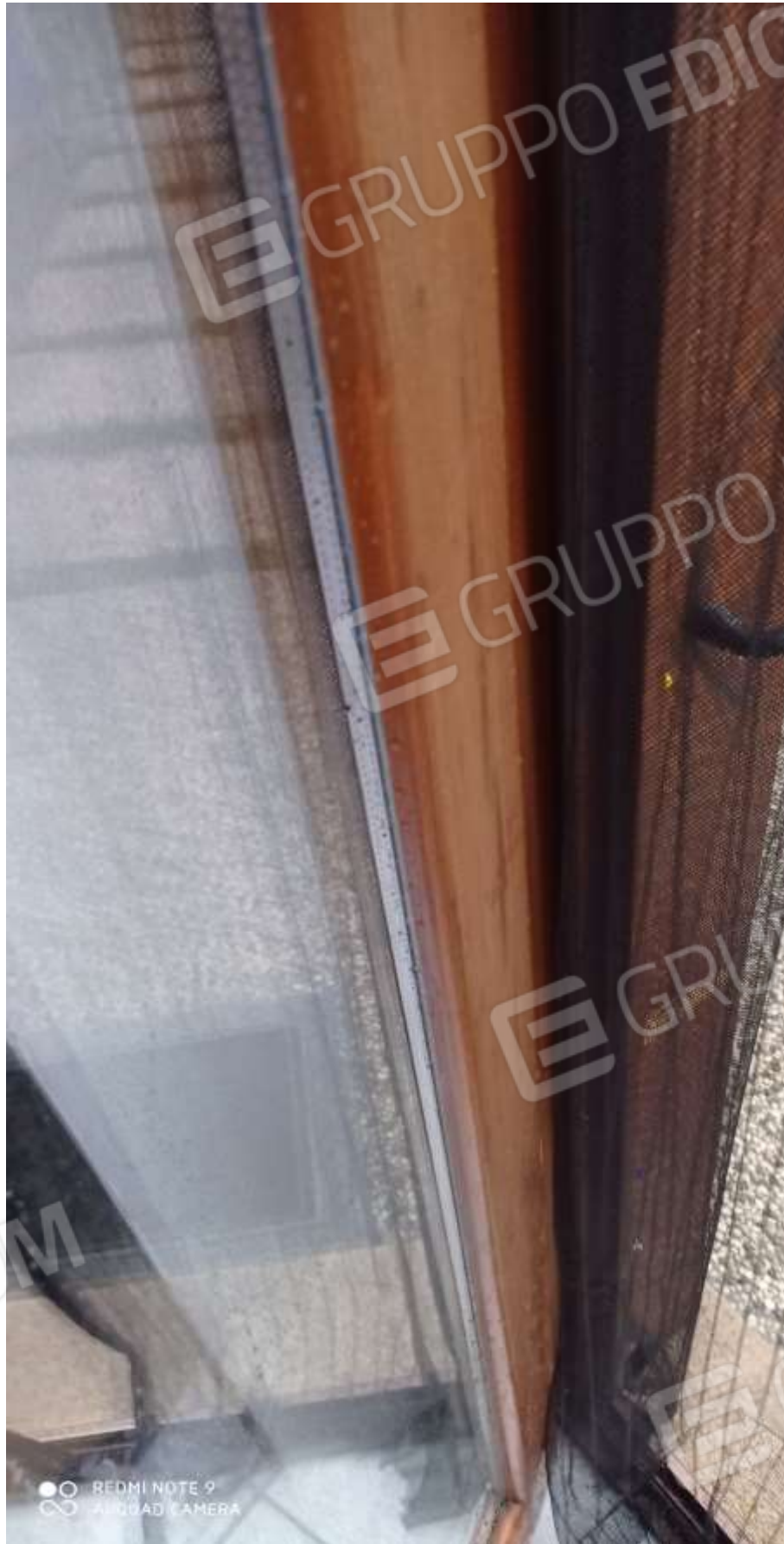
FOTO 20 – Il doppio vetro-camera sui serramenti per il contenimento del consumo energetico