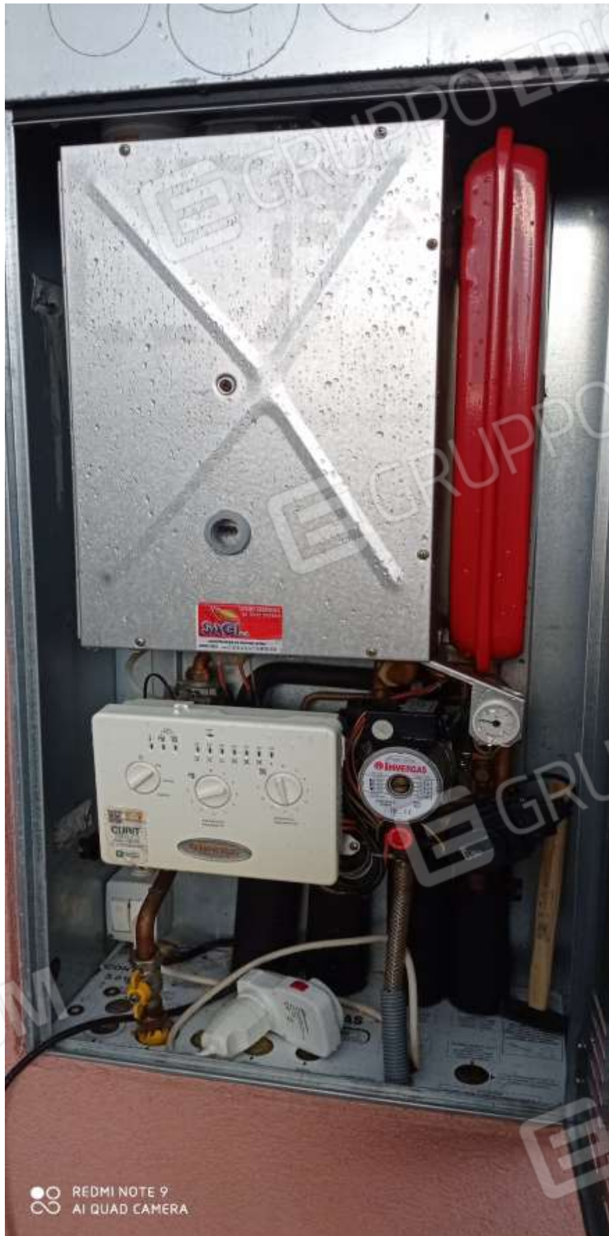
FOTO 24 – La caldaia per il riscaldamento e l'acqua calda sanitaria Posta all'esterno della casa