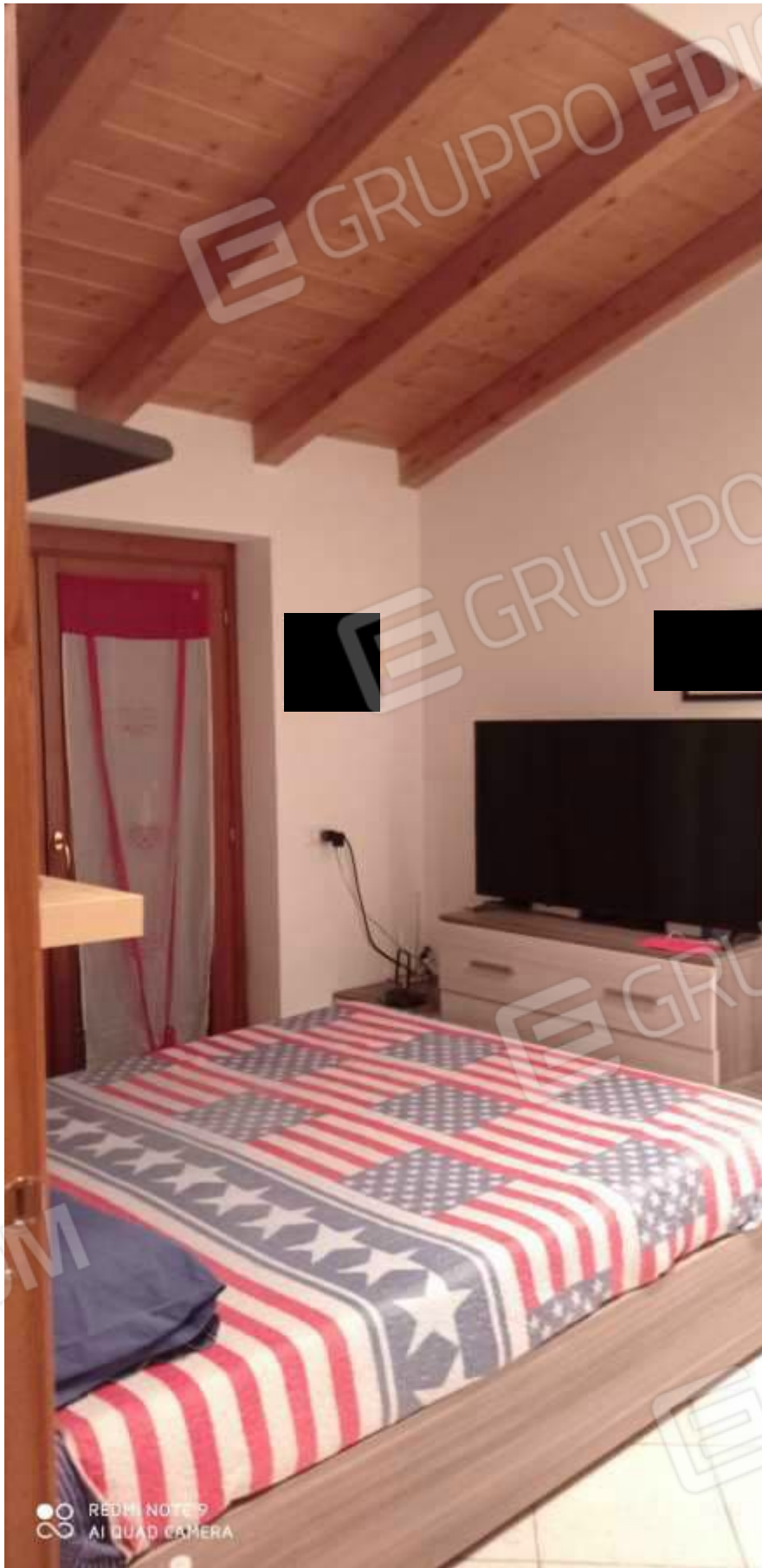
FOTO 14 – Cameretta singola al primo piano sotto il tetto di legno