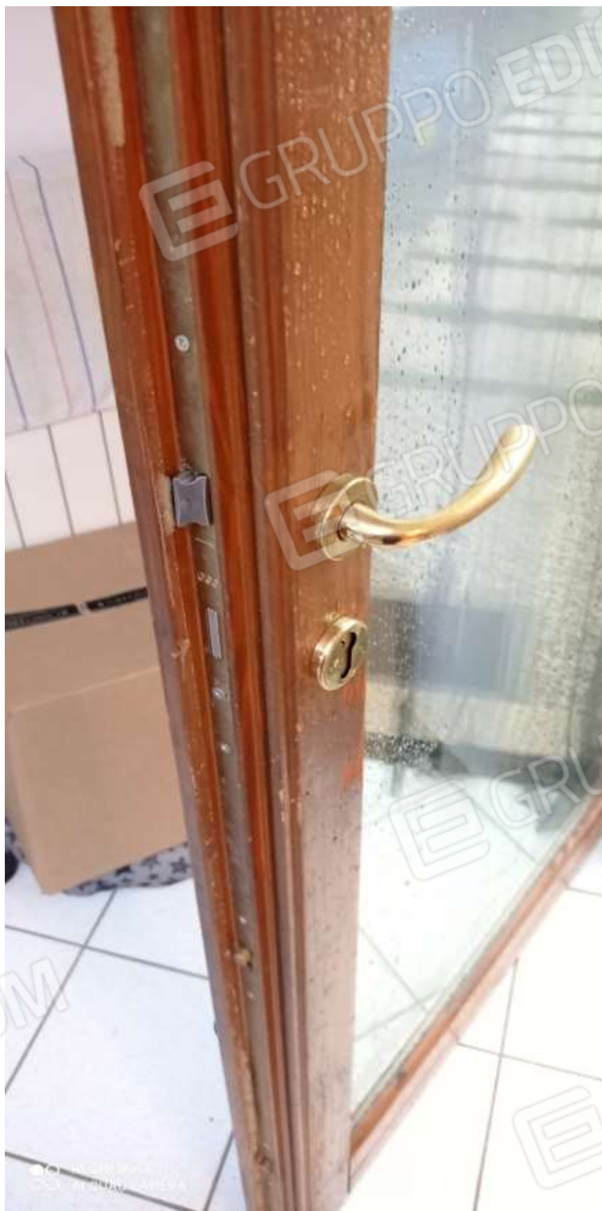
FOTO 18 – Particolare della porta di accesso alla casa (non blindata) di legno naturale con doppi vetri-camera