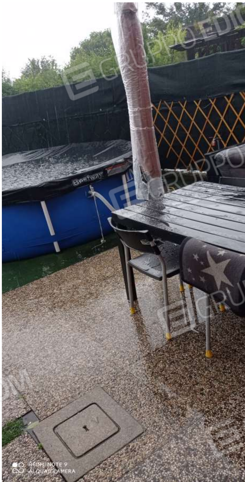
FOTO 6 – Vista della porzione di terreno antistante l’accesso e di pertinenza