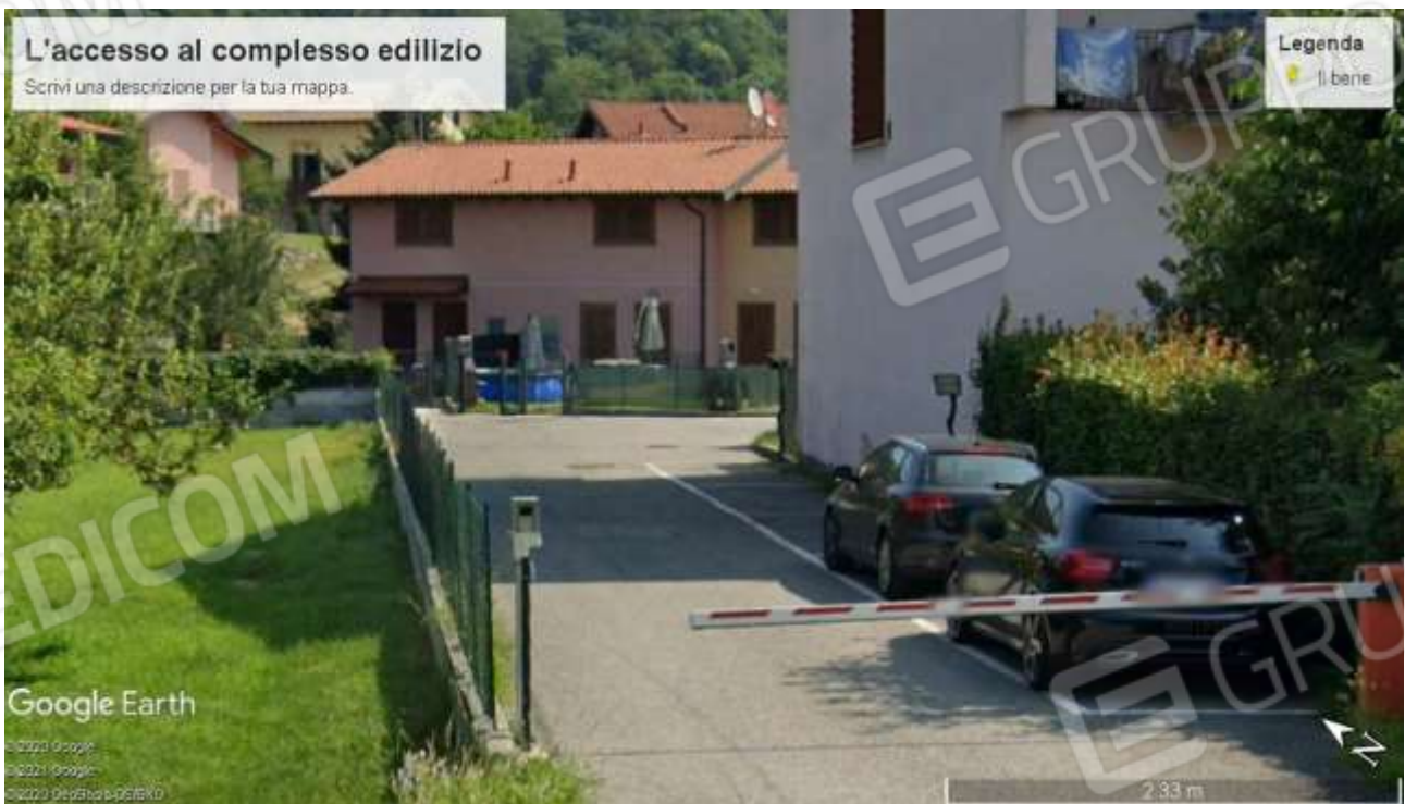
FOTO 2 – Vista della casa dall'accesso dalla pubblica via con i parcheggi privati pertinenziali