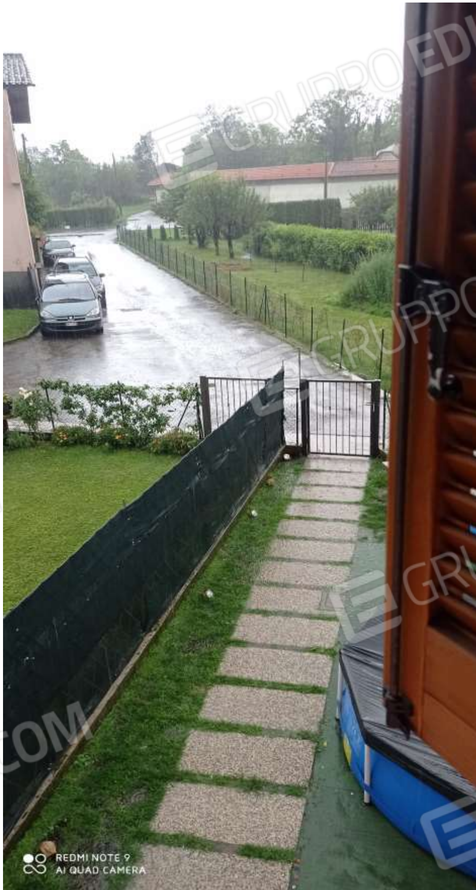
FOTO 3 – Il camminamento e l'area antistante al bene, di pertinenza