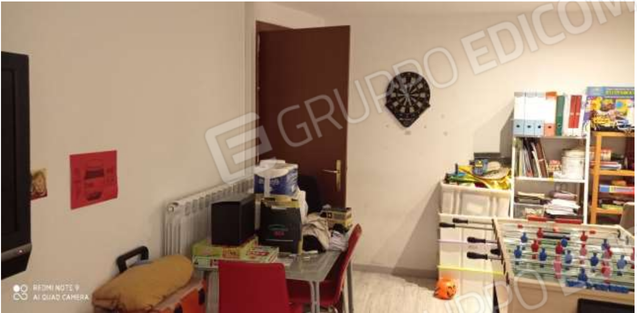
FOTO 21 – Il vano autorimessa al piano interrato utilizzato a sala giochi per i ragazzi e lavanderi