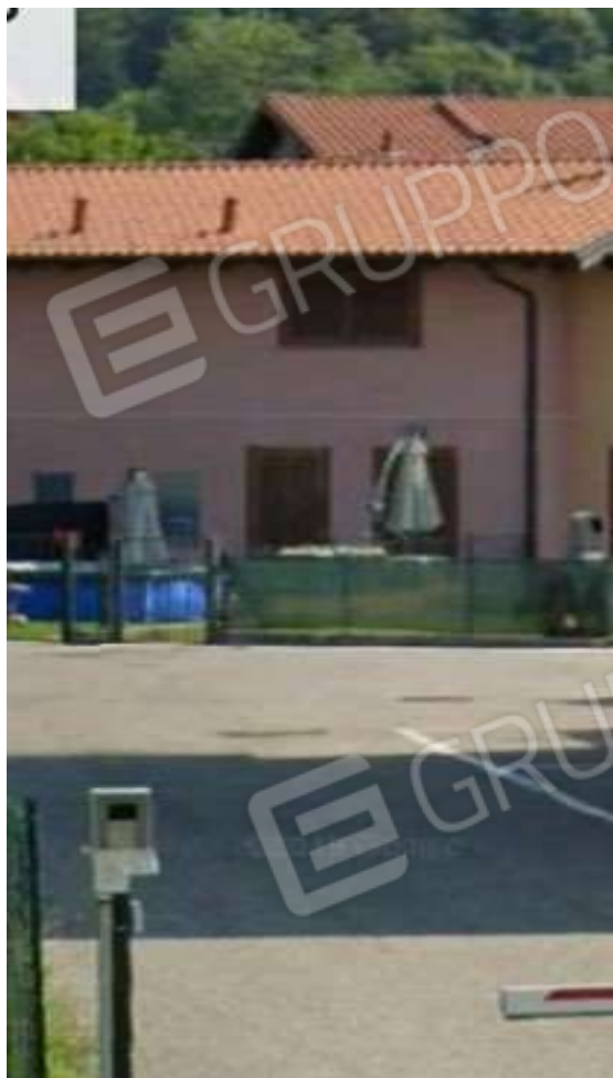
FOTO 4 – Particolare della porzione di casa oggetto della procedura