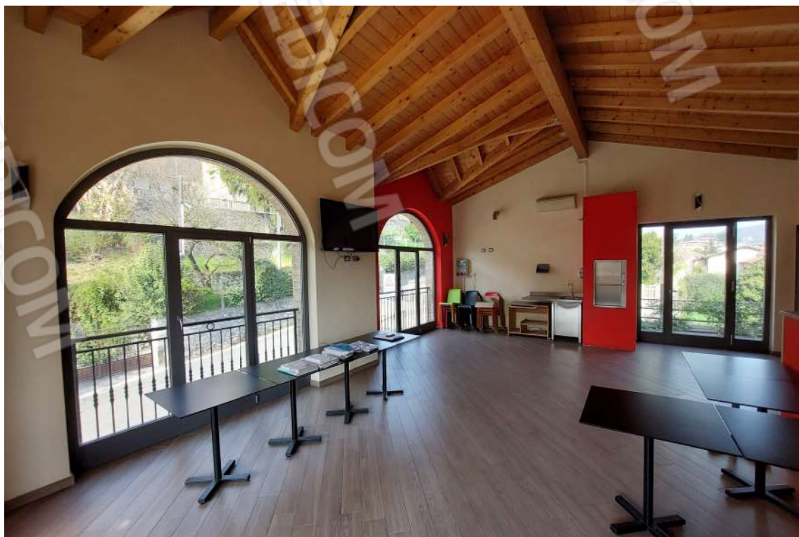
Foto n. 17: Visione del salone con le spalle al porticato coperto