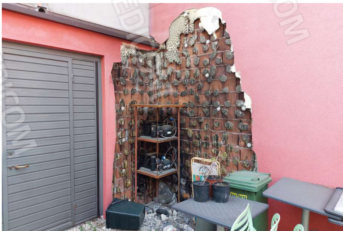
Foto n. 5: Visione della porzione di cappottatura laterale incendiata