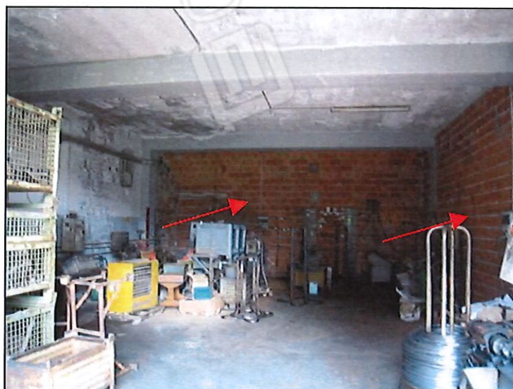
FOTO 9 VISTA RIPRESA SUL LATO EST DELL'IMMOBILE OGGETTO DI PROCEDURA.

La parete di fronte è quella indicata nella foto 6.