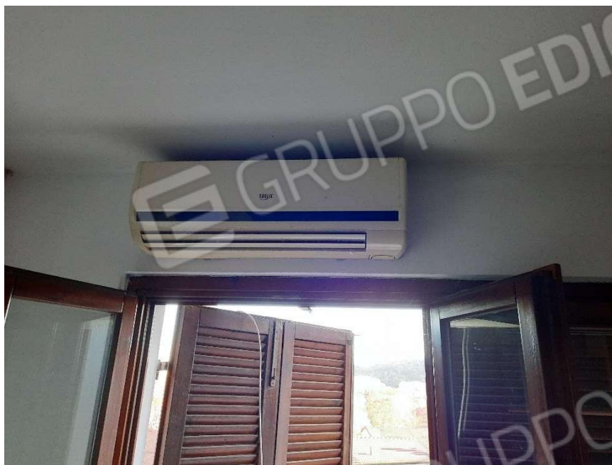
FOTO 5 - CONDIZIONATORE