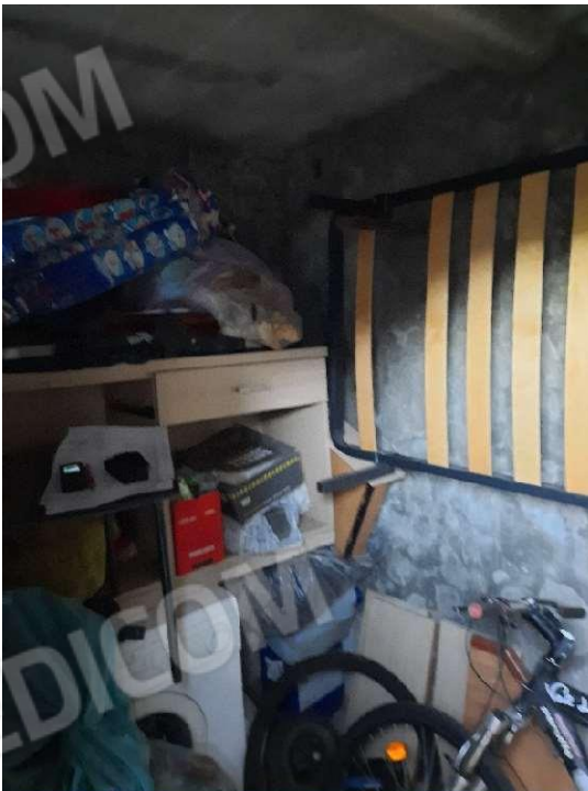
FOTO 15 - RIPOSTIGLIO