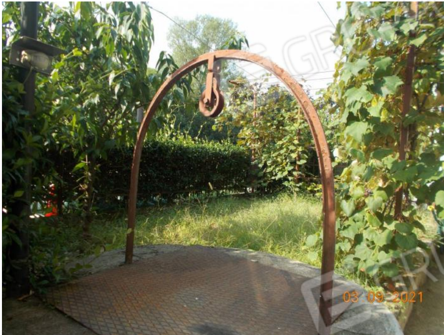
Foto 2 Area esterna PT