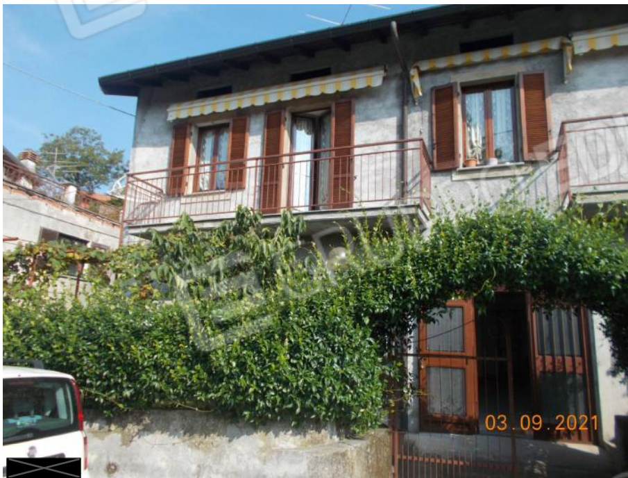
Foto 1 Ingresso abitazione e autorimessa