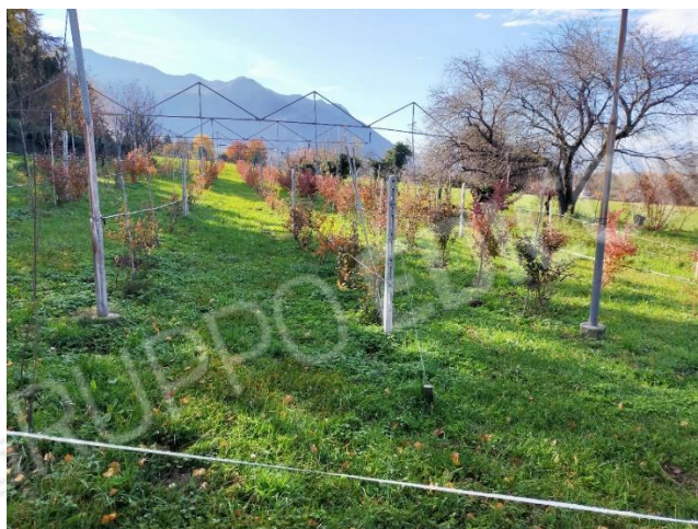
Vista est (mapp. 303)