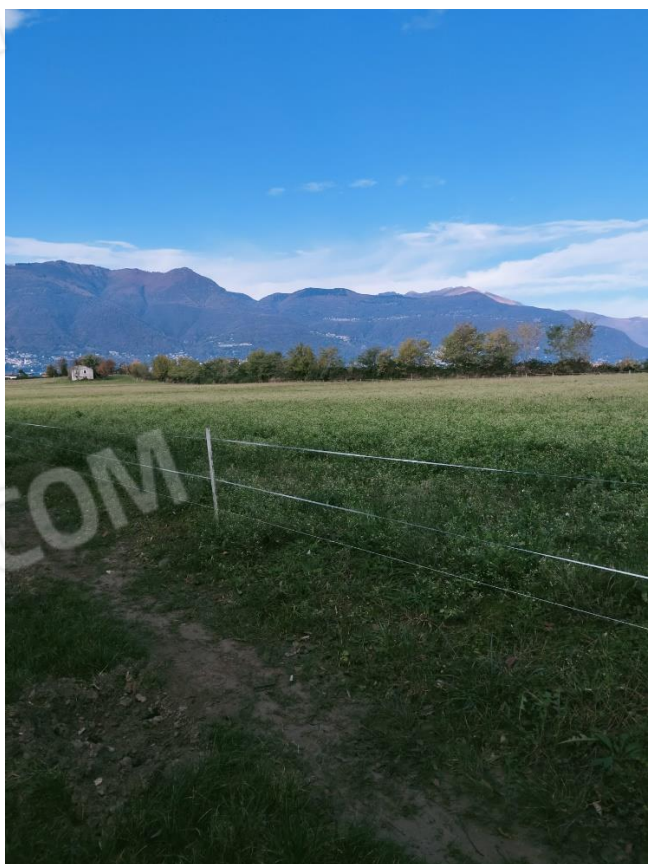
Vista ovest (mapp. 316)