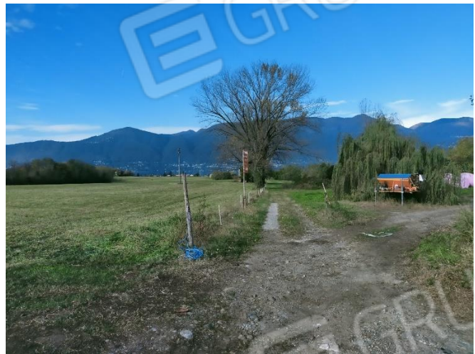
Vista ovest (mapp. 1662)