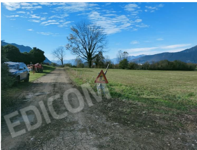
Vista sud (mapp. 1662)