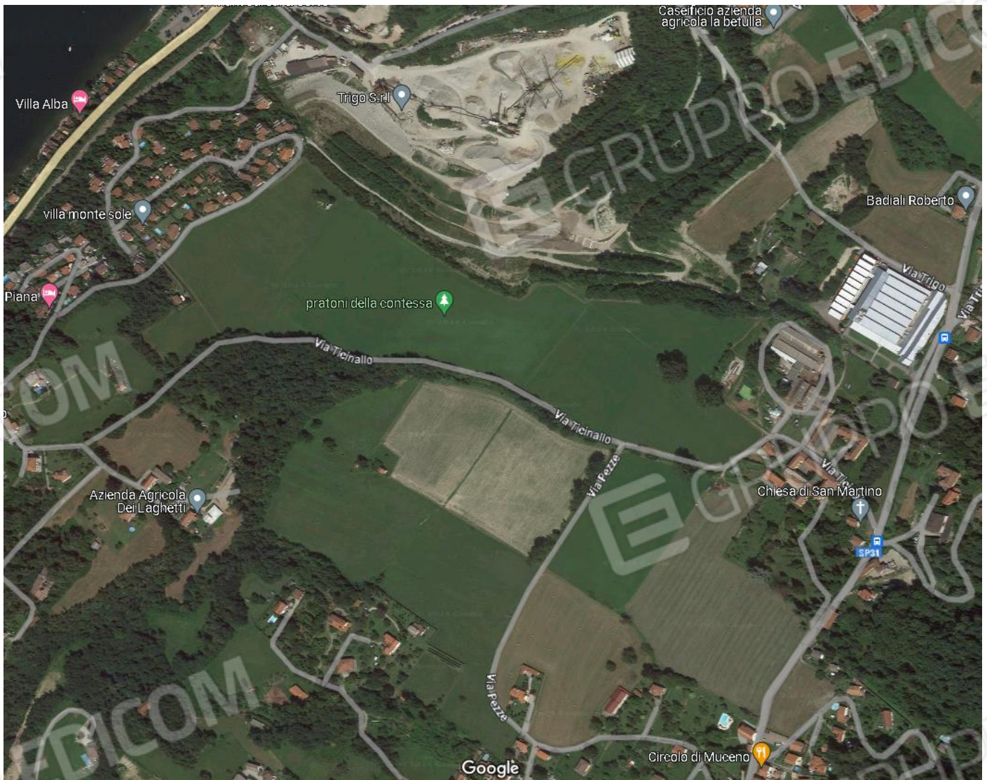
Inquadramento vista satellitare