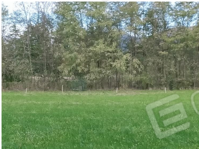
Vista ovest (mapp. 336)