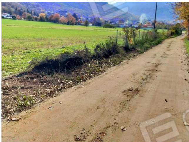
Vista nord (mapp. 314)