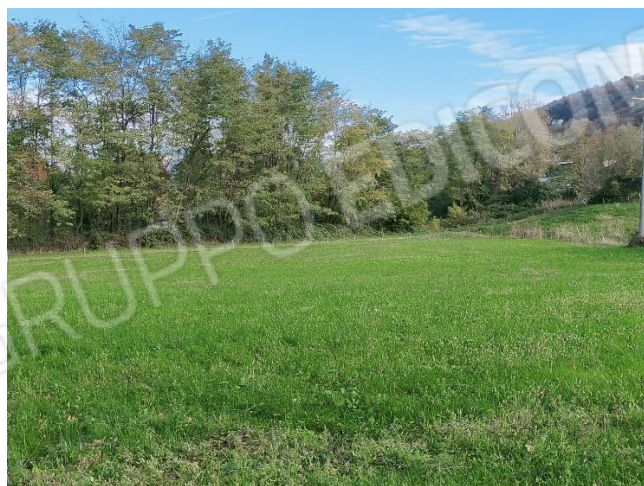
Vista sud (mapp. 336)