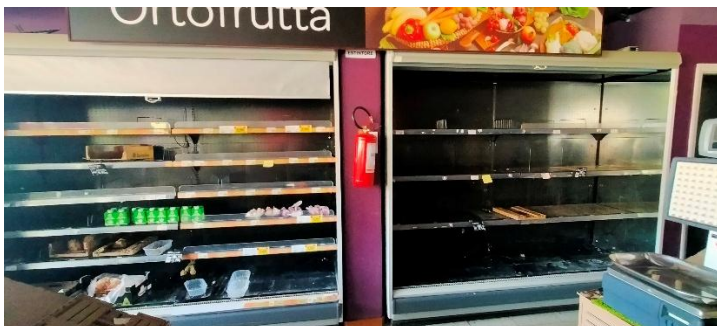
SCAFFALI FRIGO MURALE ORTOFRUTTA