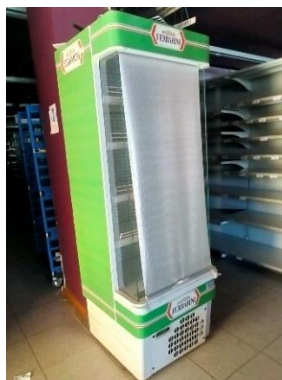
FRIGO TAKE AWAY A COLONNA

N.1 FRIGO MARCHIATO FERRARINI - DIMENSIONI H. cm. 200 X 70 X 60