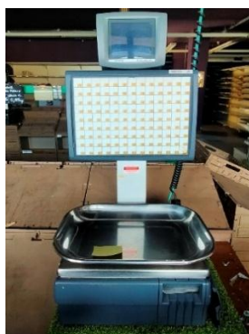
BILANCIA ORTO FRUTTA