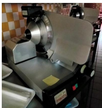
AFFETTATRICI ITALIANA MACCHI