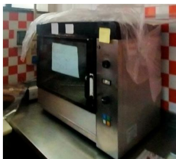
FORNO ELETTRICO PER GRIGLIA POLLO