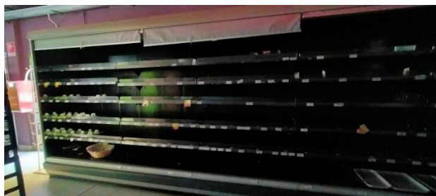
SCAFALLI SALUMI E LATTICINI

MODULARE – MISURE TOTALE H. cm 220 x 1.000 x 85