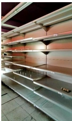
SCAFFALI IN METALLO

N.5 MODULI CON RIPIANI – MISURE H. cm 205 x 135 x 50