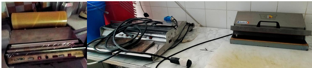
MACCHINE DISPENSER SIGILLATRICI

N.1 DISPENSER WRAPPER HAND LOVERO + N.2 MACCHINE SIGILLATRICI