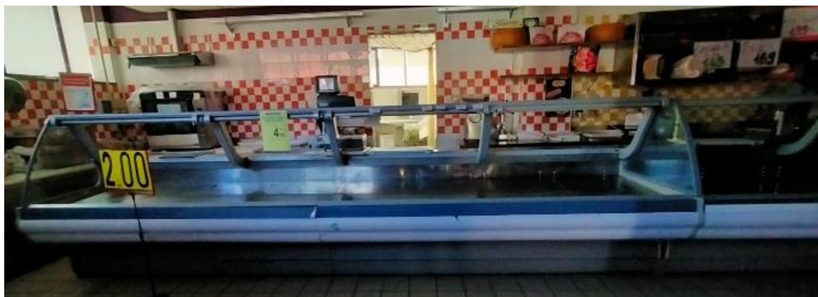
BANCO FRIGO MODULARI GASTRONOMIA

N.3 BANCHI FRIGO MODULARI GASTRONOMIA DIM. TOTALI metri 15