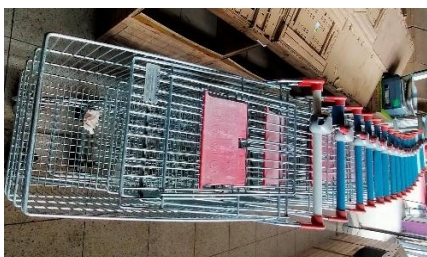
CARRELLI SPESA GRANDI 125 LITRI – 4 RUOTE – GANCIO SICUREZZA