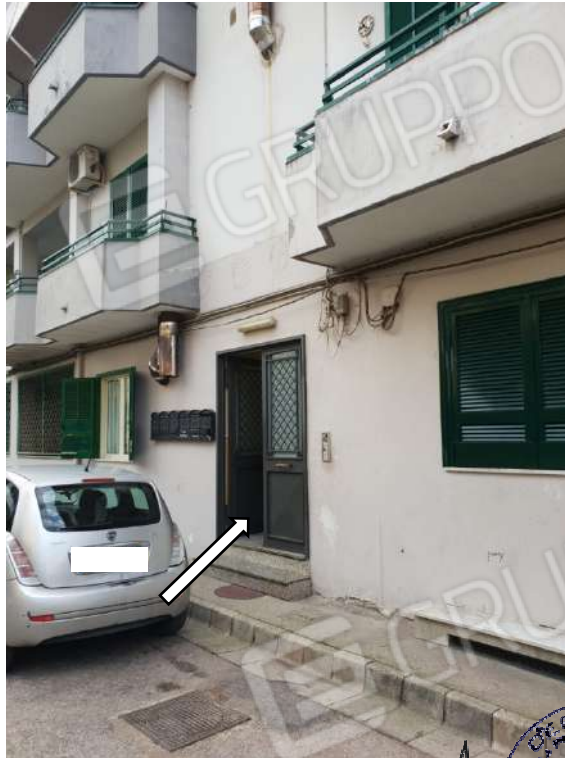
Accesso al fabbricato da Via Francesco Redi