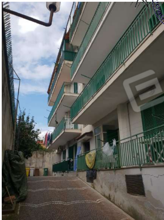
Vista dal viale comune – Prospetto Sud

Stampa circolare con firma "Angela Scala" e dati: "OFF. REG. ARCHITETTO", "ANGELA SCALA", "N. 48891".