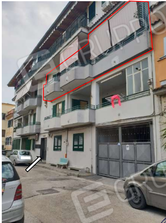
Vista accesso da Via Francesco Redi - Prospetto Nord